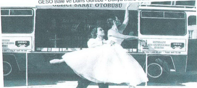
08 Nisan 2004 D.E.Ü. Rıza Fevzi Edebiyat Fakültesi - GESO Bale Gurubu