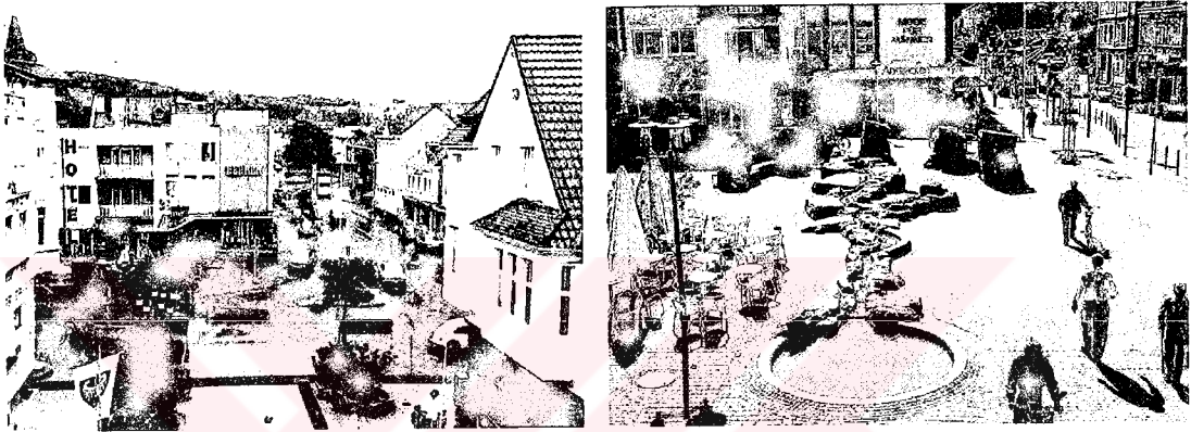
Fotoğraf 1. Kent Meydanı, Neheim – Kaplan (2000: 189-190)'dan alınmıştır.

Buna Dieter Magnus'un Neheim'da yapmış olduğu kent meydanı çalışmasını örnek olarak verebiliriz: