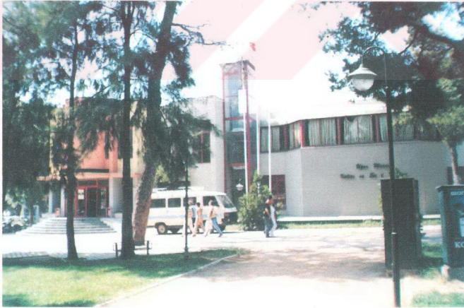
Fotoğraf 15. Bornova Belediyesi Uğur Mumcu Kültür ve Sanat Merkezi

Salon için Milli Eğitim ve İzmir'de bulunan özel tiyatro toplulukları için ücret alınmamakta, İzmir dışından gelen özel tiyatrolardan cüzi bir miktar alınmaktadır. Salon 200 kişiliktir ve yeterli olmamaktadır. Ayrıca Bornova Belediyesi'ne bağlı Ayfer Feray Açık hava Tiyatrosu'nda profesyonel tiyatro grupları gösterimlerde bulunmaktadır.