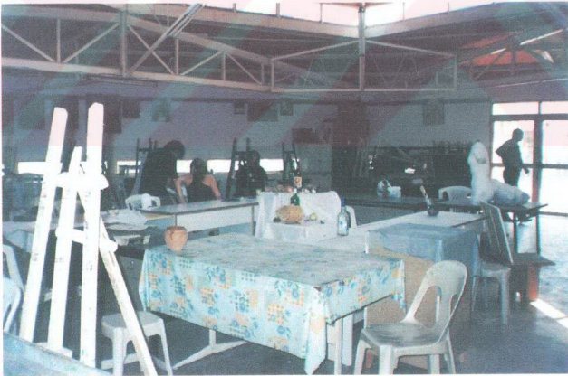
Fotoğraf 14. Karşıyaka Belediyesi Celal Yetkin Resim Atölyesinden Görünüm