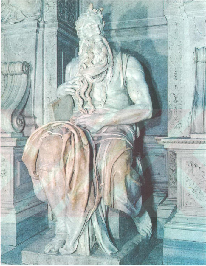
Fotoğraf 2. Musa Michalengelo - Rome and Vatican (1972: 58)'den alınmıştır.

Sanatçıların toplumdan etkilenip eserlerini ortaya koyduklarını söylemiştik. Bu etkilenmede ortaya çıkan eserler hem olumlu hem de olumsuz yönleri ortaya çıkarmaktadır. Bunu plastik sanatçıları açısından baktığımızda çıkan eserler kent içerisinde zaman zaman kendisini göstermeye başlamıştır artık. Bunlar galerilerdeki sergilerle, kent meydanlarındaki anıt ve heykellerle veya duvar resimleri ile kent sahnesinde kendini göstermektedir. Fakat