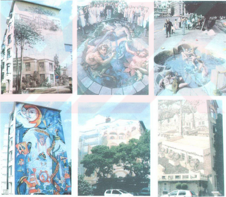
Fotoğraf 7. Avrupa'da yapılan duvar resimleri festivalinden örnekler-İzmir Life Dergisi (2004:80-81) 'nden alınmıştır.

Zamanımızda kentler artık insanlar için yeniden düzenlenip yaratılma çabası içerisindedir. Bozuk kent yapısı geç de olsa fark edilmiştir. Bu nedenle bozulmuş bu kent yapısının üzerine bir sünger çekilmektedir. Betonlar, çirkin görüntüler güzellikle kaplanmaktadır. Daima ihtiyaç olan yeşil alanlar için kör duvarlar orman haline resimlerle getirilmektedir. Bununla ilgili olarak İzmir Life Dergisi'nin Haziran 2004 sayısında yer alan duvar resimleri festivali adı altında Avrupa'da uygulanan bir sanatsal etkinliğe yer verilmiştir.(Fotoğraf 7) Burada sanatçılara kent içinde etkin kuruluşların, yöneticilerin ve bürokratların desteği vardır.