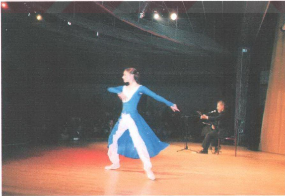
Fotoğraf 16. Narlıdere Belediyesi Atatürk Kültür Merkezi'nde Bir Sanatsal Etkinlik

Narlıdere Belediyesi dört yıl önce açmış olduğu Narlıdere Atatürk Kültür Merkezinde (Fotoğraf 16) sosyal ve kültürel faaliyetlerini sürdürmektedir. 600 kişilik salona sahip olan Atatürk Kültür Merkezi amatör tiyatro topluluklarına sahne sağlamaktadır. Devlet Tiyatrosu burada haftada iki gün gösterimde bulunmaktadır. Ayrıca özel tiyatrolar da sene içerisinde gösterilerini halka sunmaktadırlar.