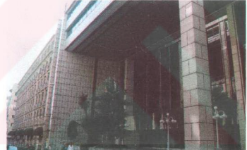
Fotoğraf 9. İstanbul Nişantaşı'nda düzenlenen yaya sergisinden örnekler-Güney (2002:25-27)'den alınmıştır.

Festivalleri İzmir özelinde incelediğimizde İzmir'de de birçok festival yapıldığı görülmektedir. Bazıları yıllardır yol alırken, bazıları ise maddi olanaksızlıklar nedeni ile zaman içerisinde unutulmaya mahkum olmuştur. Blues, Avrupa Caz, Kısa Film, Avrupa Filmleri, Tiyatro Günleri ve Uluslararası İzmir Festivali ile çeşitli zamanlarda kent merkezinde hareketlilikler görülmektedir. Bu yıl 18. kez kutlanan İzmir Festivali düzenlenenlerin en ünlüsü ve eskisidir. Bu festivale İzmir Kültür Sanat ve Eğitim Vakfı'nın (İKSEV) katkıları büyüktür. Son yıllarda sanatsal ve kültürel etkinliklerin sayısının oldukça fazla olduğu düşünülürse duvar resimleri, heykel, rock, gençlik, kukla veya yaya sergileri adı altında birçok temada festivaller de düzenlenebilir. Çok fazla kişi tarafından bilinmemesine