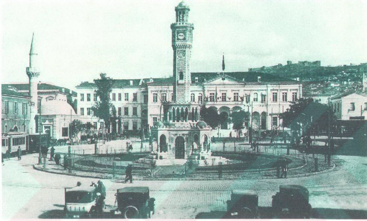
Fotoğraf 4. Konaq Meydanı

düzenli gösterilerin yapıldığı ilk tiyatrunun 1775 yılında kurulduğu anlaşılmaktadır. İzmir'in tiyatroyla tanışması diğer Osmanlı kentleriyle kıyaslandığında epeyce gerilere gitmektedir. 18. yüzyılda İzmir, kozmopolitliliği, özellikle yabancı kökenli ailelerin çokluğu, Orta Doğunun giriş limanlarından birisi olması ile bir çok yazara ve hatta İzmir'i hiç görmemiş yazarlara dahi konu olmuştur. (Beyru, 2000:229-230)