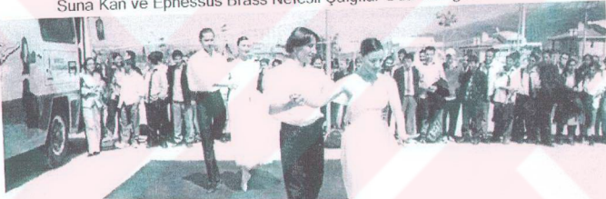
29 Nisan 2004 Güzelbahçe Cengiz Topel Çok Programlı Lisesi GESO Bale ve Dans Gurubu - Dünya Dans Günü