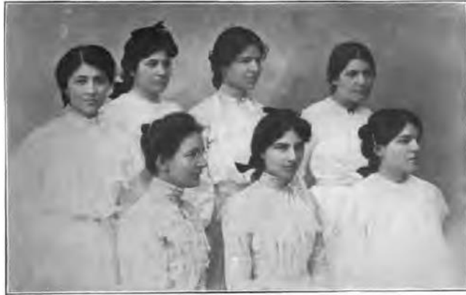
Graduates of Smyrna Training School