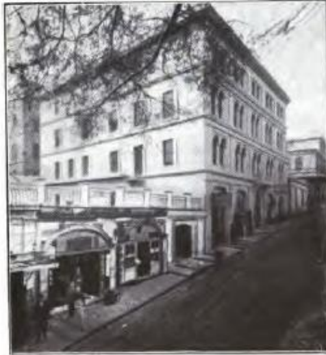
American Bible House