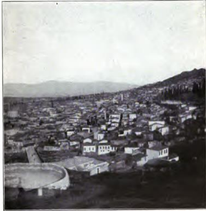
Castle Hill, Smyrna.

EK-2 ABCFM kayıtlarında Batı Misyonu'nun 75. yılında İzmir 513