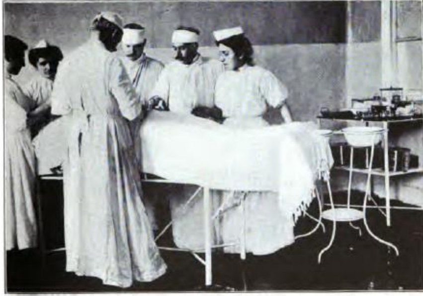
EK-4 Kız öğrencilerin tıbbi eğitimi 515