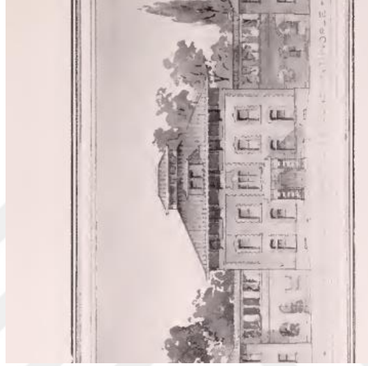
EK-6 ABCFM hemşire okulu 517