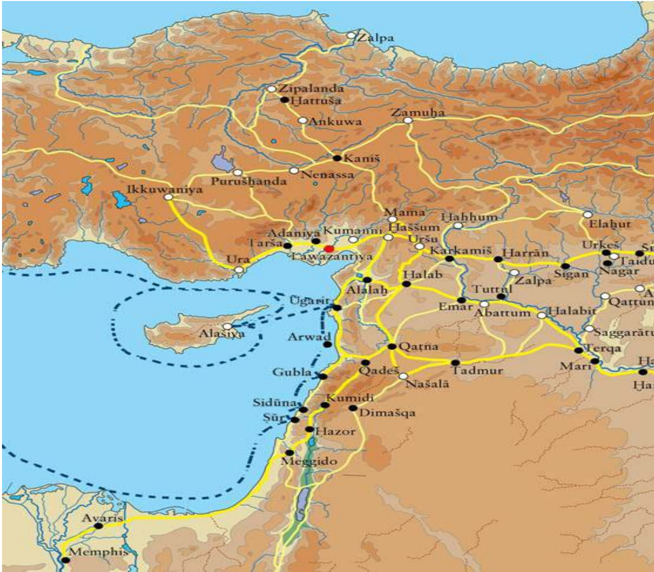
Harita 1: M.Ö II. BİNDE ANADOLU VE MEZOPOTAMYA ŞEHİRLERİ