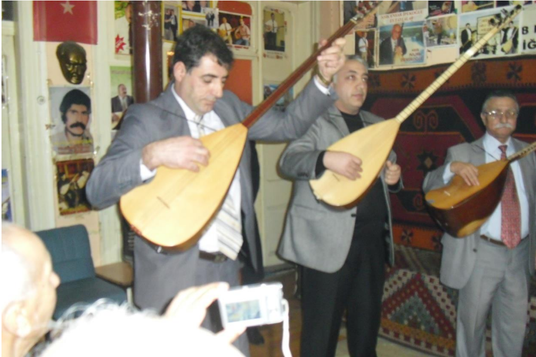
Âşıklar atışma yaparken