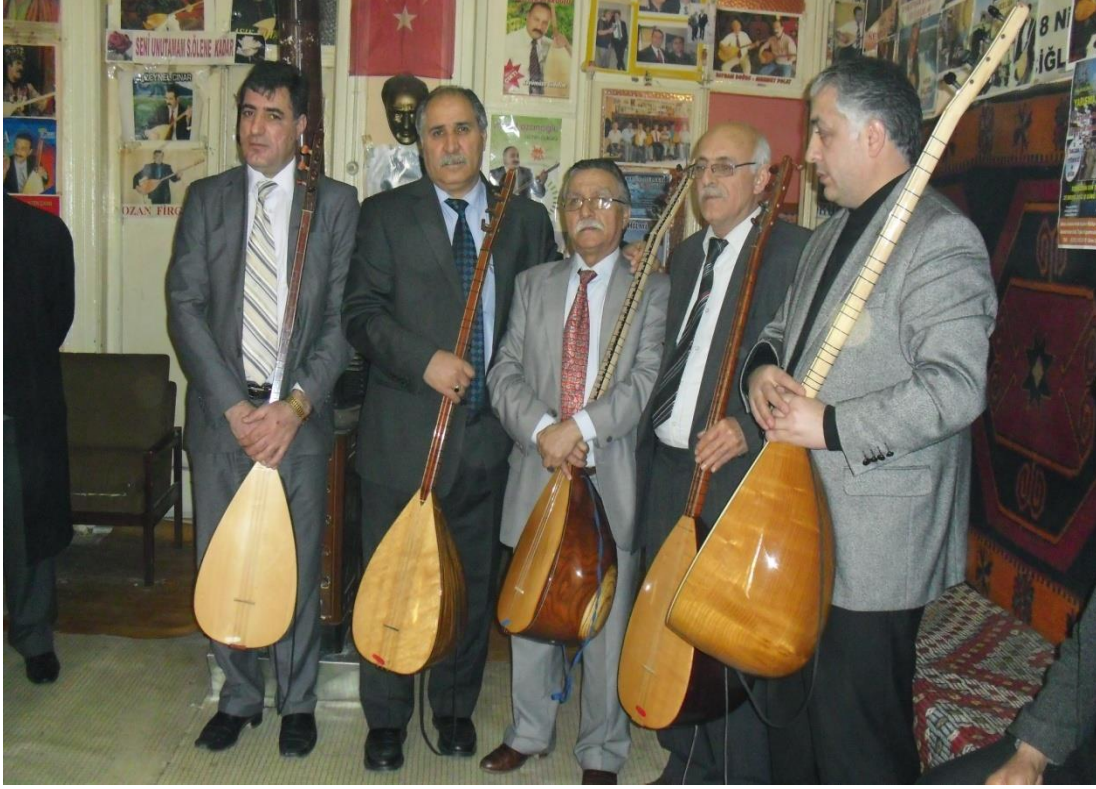
İzmir'de Yaşayan Karslı Âşıklar