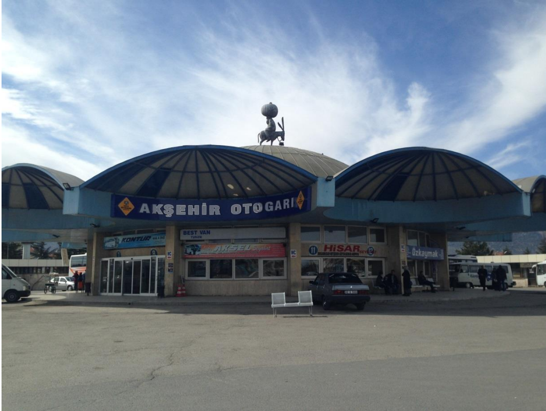
Resim 3.6. Akşehir Otogarı

Nasreddin Hoca imgesinin Akşehir'de kültür endüstrisi bağlamında hediyelik eşyalarda kullanımı kadar kültür turizmi ve kentsel peyzajda da kullanıldığı görülmektedir. Akşehir'e gelenlerin ilk gördükleri Nasreddin Hoca imgesi, otogarın üzerine yerleştirilmiş olan eşeğine ters binmiş Nasreddin Hoca heykelidir (Resim 3.6.).