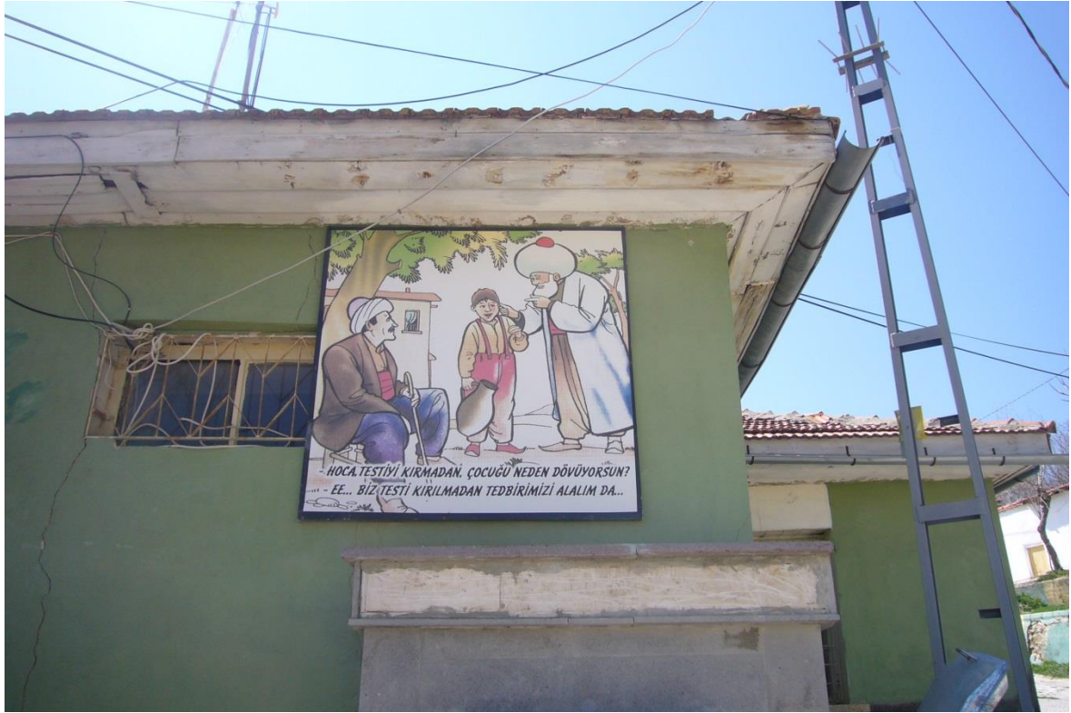
Resim 3.29. Nasreddin Hoca Köyü Genel Görünüm 4