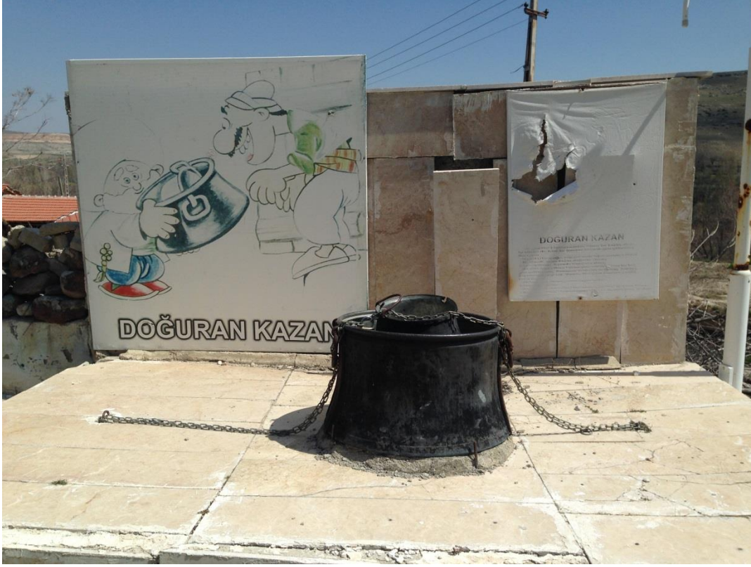
Resim 3.31. Nasreddin Hoca Kültür Parkı 1