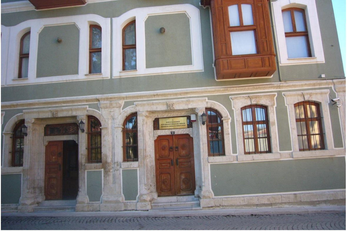
Resim 1.4. Nasreddin Hoca Etnografya Müzesi

Bu durum imgenin yaşatılabilirliğini, görünürlüğünü arttırmada etkili bir yol olarak görülebilir. Ancak imge şahsiyet olmuş bir isminin olur olmaz her yerde kullanılması o imgeyi bir noktada değersizleştirebilir. Bu nedenle imgeyi, kentin temel gösterim alanlarında kullanırken doğru ve dikkatli bir yerleştirme yapılması gerektiği ifade edilebilir.