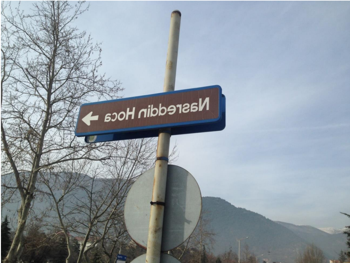
Resim 3.7. Nasreddin Hoca'nın Türbesini Gösteren Ters Tabela

Nasreddin Hoca'nın mizahından ve anlam dünyasından Akşehir peyzajında pek çok yerde yararlanıldığı görülmektedir. "Tersine Saat"i icat eden Erdoğan Özbakır'ın Hoca'nın eşeğe ters binmesinden ilham aldığı gibi yine kentin peyzajında da bu terslik imgesinden yararlanılmıştır. Bunun en belirgin örneklerinden birisi Nasreddin Hoca'nın türbesini gösteren ters harflerle yazılmış tabeladır (Resim 3.7.).