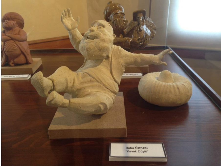
Resim 3.35. “Kavuk Düştü” Adlı Tasarım- Karikatür Müzesi