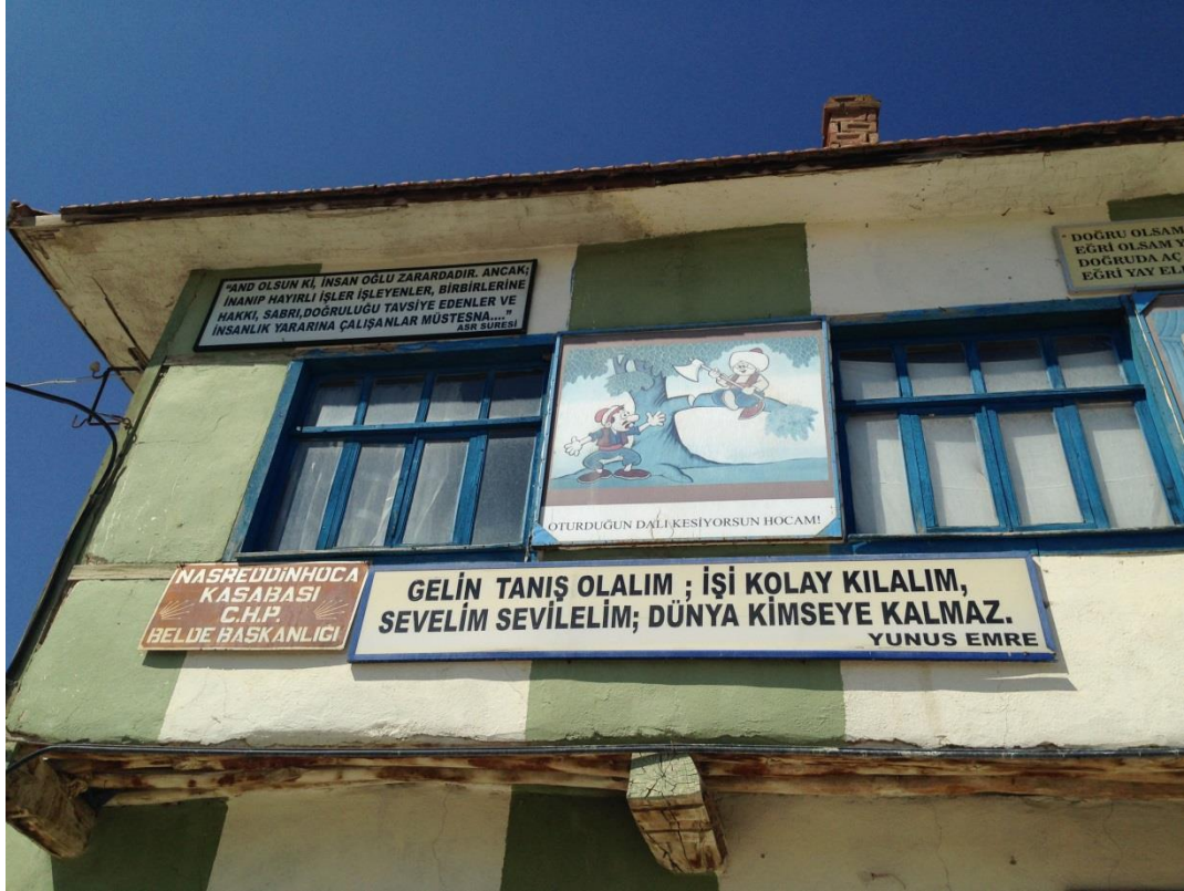
Resim 3.27. Nasreddin Hoca Köyü Genel Görünüm 2