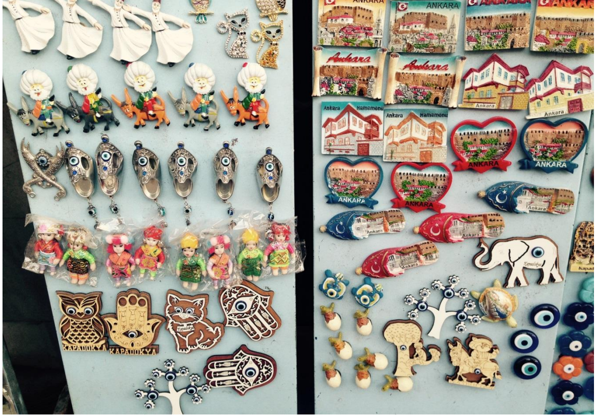
Resim 3.5. Ankara Çıkrıkçılar Yokuşu Hediyeelik Eşya Dükkânı

Görsellerden de görüleceği üzere Nasreddin Hoca imgesi nazar boncuğu, Fatma'nın Eli gibi başka kültürel imgelerin sunulduğu hediyeelik eşyalarla bir arada yer almaktadır. Nasreddin Hoca imgesi hediyeelik eşya olarak Ankara Kalesi'ne gelen turistlere sunulmakta ve bu bölge için ekonomik değer sağlamaktadır.