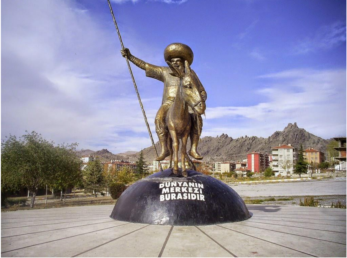
Resim 1.5. Sivrihisar Nasreddin Hoca Heykeli

Kente kimliğini veren bir imge olarak Nasreddin Hoca, Sivrihisar'ın merkezine girişte devasa bir heykel (Resim 1.5.) olarak görülmektedir. Kente gelen kişilerin Hoca imgesiyle ilk karşılaşmaları kentin girişine konulan Nasreddin Hoca heykeli ile sağlanmaktadır.