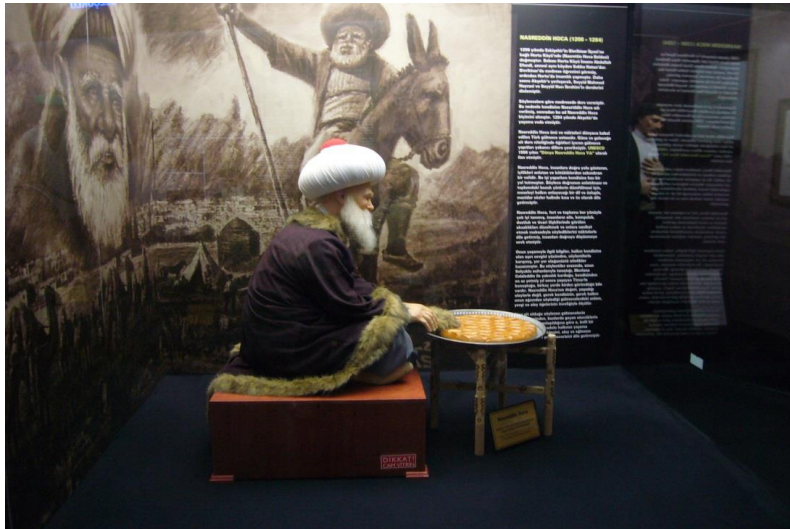
Resim 3.33. Eskişehir Balmumu Heykel Müzesi- Nasreddin Hoca

Sivrihisar'ın bağlı olduğu Eskişehir'de de Nasreddin Hoca'nın görsel bir imge olarak kullanıldığı mekânları görmekteyiz. Bu yerlerden ilki Balmumu Heykel Müzesi'dir. Bu müzenin içerisindeki bir bölümde Nasreddin Hoca'nın "Ye kürküm ye" fıkrası canlandırılmaktadır (Resim 3.33.).