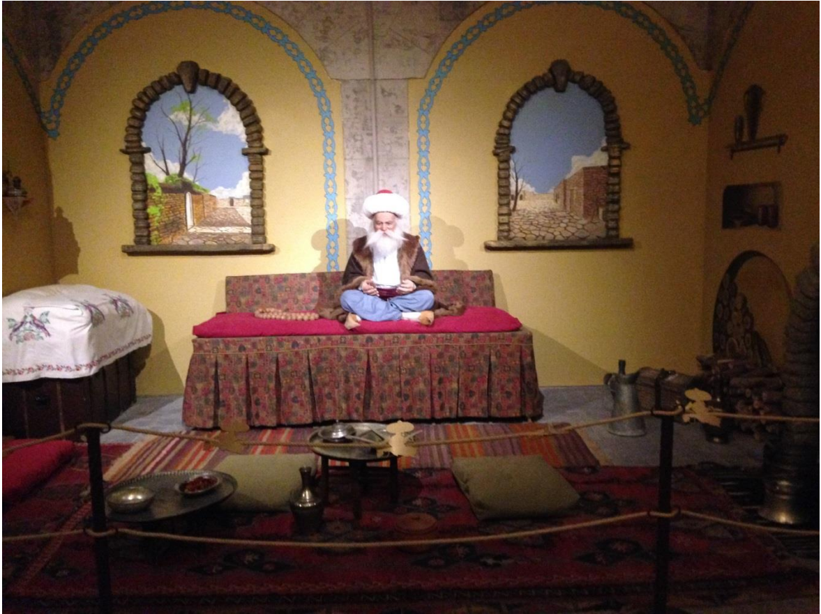
Resim 3.41. Animatronik Nasreddin Hoca- Masal Şatosu