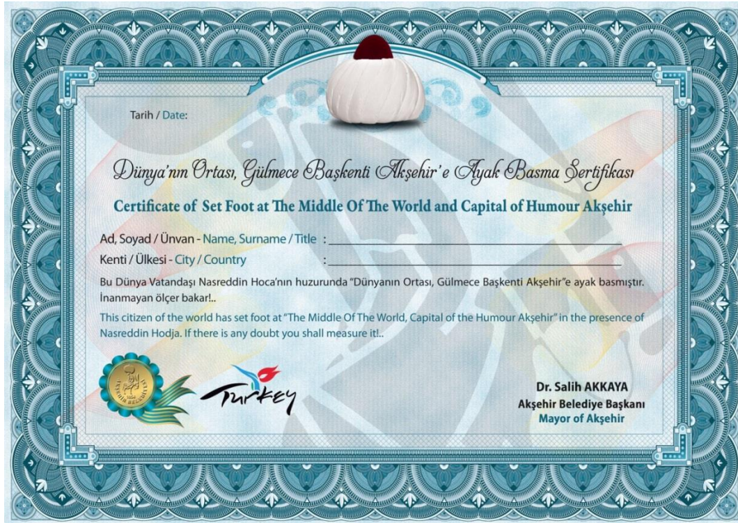
Resim 3.12. Akşehir Belediyesi'nin Dünyanın Ortası Burasıdır Sertifikası