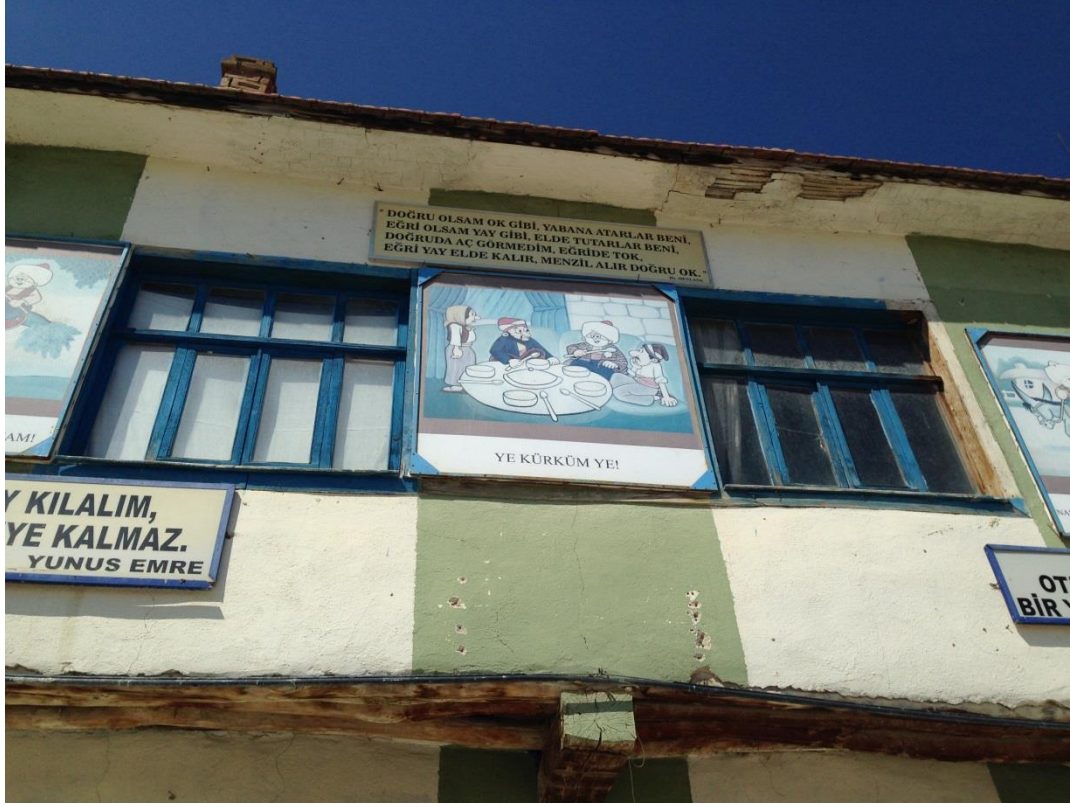
Resim 3.26. Nasreddin Hoca Köyü Genel Görünüm 1