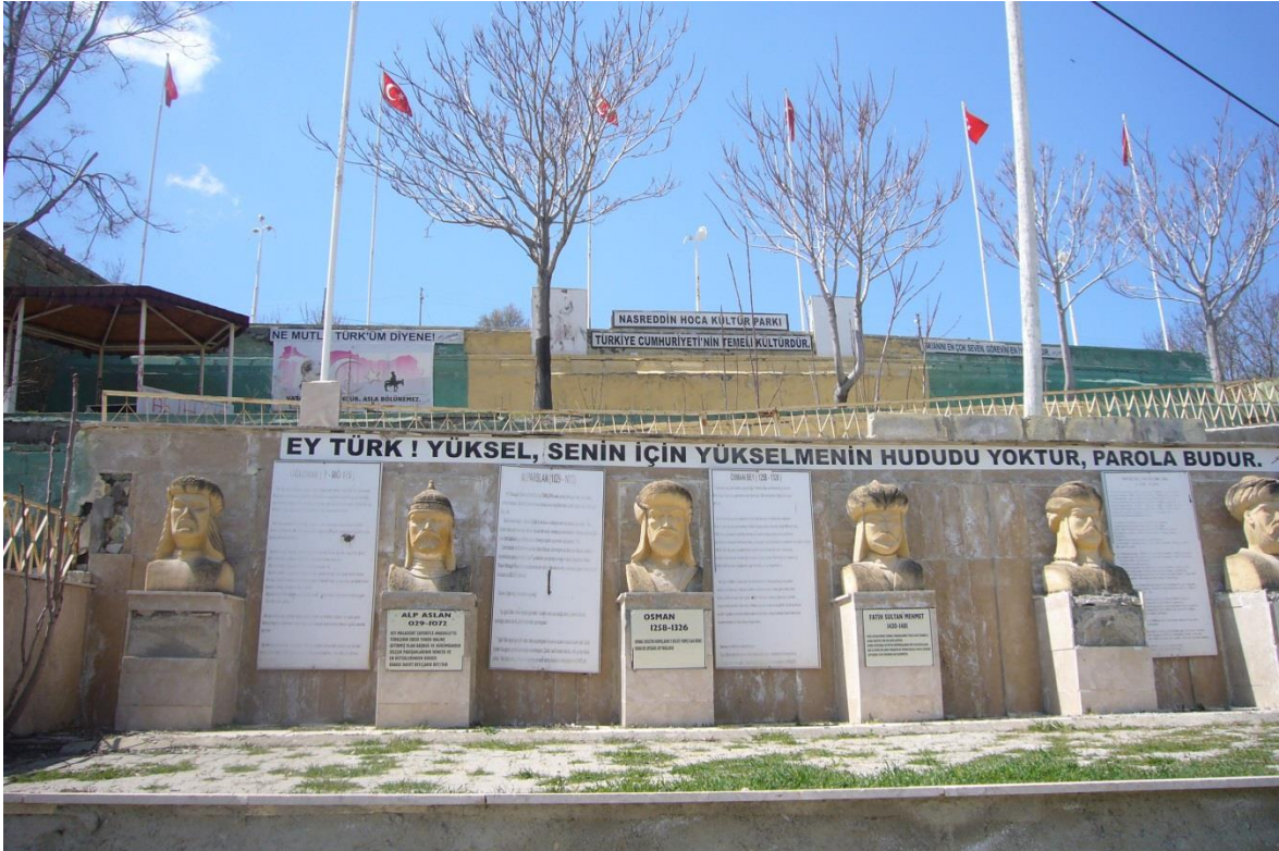
Resim 1.8. Nasreddin Hoca Kültür Parkı