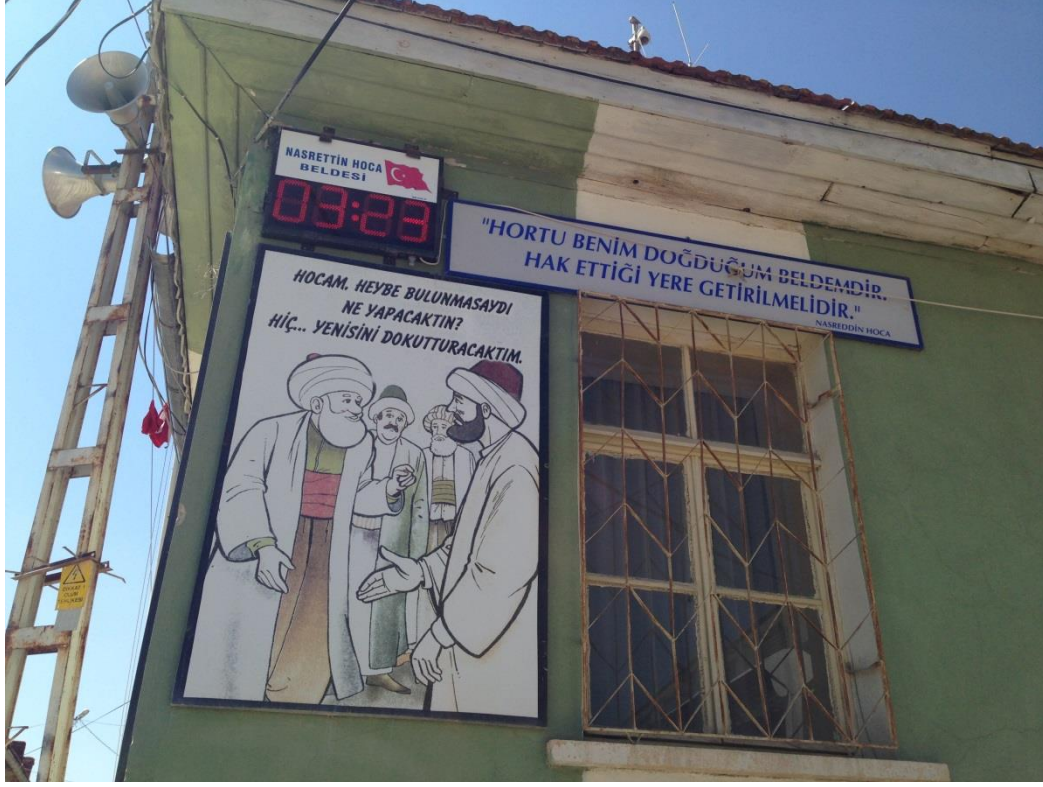
Resim 3.28. Nasreddin Hoca Köyü Genel Görünüm 3