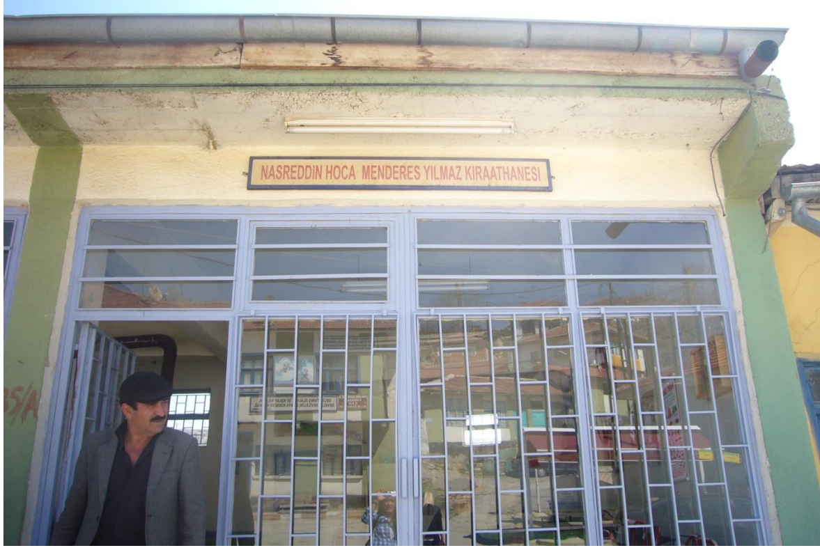
Resim 1.9. Nasreddin Hoca Menderes Yılmaz Kiraathanesi

Bir imgenin bulunduğu kentin kimliğini oluşturabilmesi için orada yaşayanların kültürel belleğinde derin bir şekilde yer etmiş olması gerekir. Sonrasında bu imgeler başarılı bir şekilde, çağdaş yorumlarla yeniden yaratılabilir. Nasreddin Hoca imgesiyle, kimliğini oluşturmaya çalışan Sivrihisar'ın bu konuda görünürlüğünü çok fazla sağlayamadığı tespit edilmiştir. Nasreddin Hoca imgesinin ve adının Hoca'nın doğduğu köyün atmosferinde pek çok yerde kullanıldığı görülmüştür. Ancak kültürel imgenin sadece kent peyzajında kullanılması yeterli değildir. Özellikle de Nasreddin Hoca gibi sözlü kültüre ait bir kahramanın fıkralarının anlatım ortamı sağlanarak o atmosfere dahil edilmesi gerekmektedir. Sivrihisar, Nasreddin Hoca'nın doğduğu evin bulunduğu yer olması sebebiyle önemli bir avantaja sahiptir. Ancak Sivrihisar'ın bu durumu etkin bir şekilde kullanarak, kültürel mirasın aktarıldığı ve yaşatıldığı bir mekân haline gelemediği tespit edilmiştir. Bu durumu gerçekleştirememesinde tanıtım faaliyetlerini etkin hale getirememesi ve kentin Nasreddin Hoca üzerinden markalaşmasını yeterince sağlayamaması gibi noktaların olduğu söylenebilir.