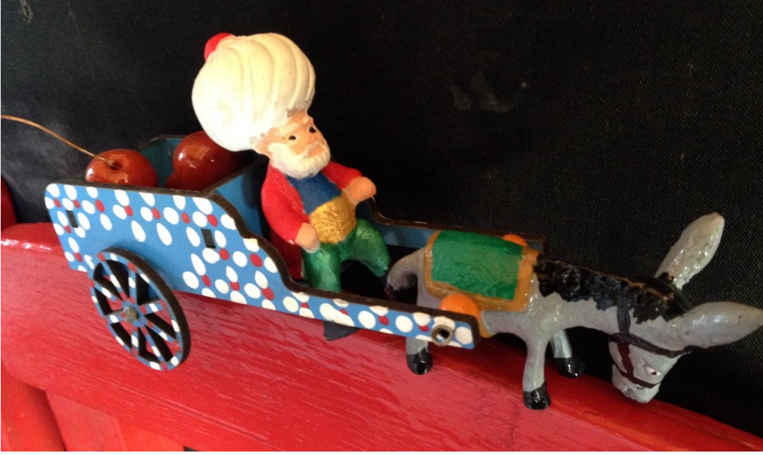
Resim 2.5. AKSEV'in Hediyeelik Eşyaları 3