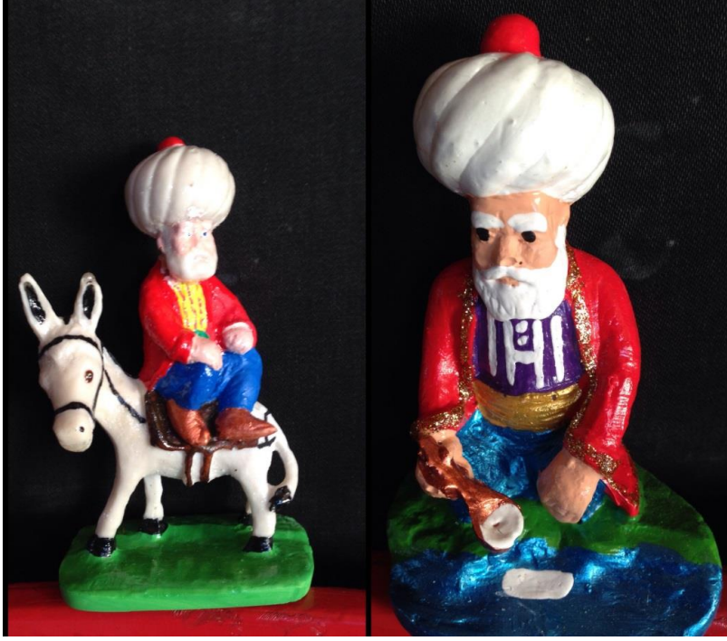
Resim 2.3. AKSEV'in hediyelik eşyaları 1

Nasreddin Hoca'nın eşeğe ters binmesi toplumun hafızasındaki popüler imgelerden birisidir. Bunun kültür endüstrisinin bir parçası olan hediyelik eşya üretiminde de yaygın olarak kullanılan imgelerden biri olduğunu söyleyebiliriz. Göle mayan çalan, kazanı doğurtan, bindiği dalı kesen Nasreddin Hoca imgeleri de kültür endüstrisinde ürüne dönüştürülmektedir. Akşehir'de üretilen hediyelik eşyalarda da bunu örnekleri görülmektedir.