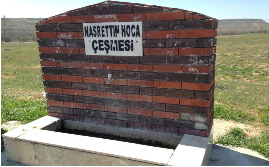
Resim 1.7. Nasreddin Hoca Çeşmesi