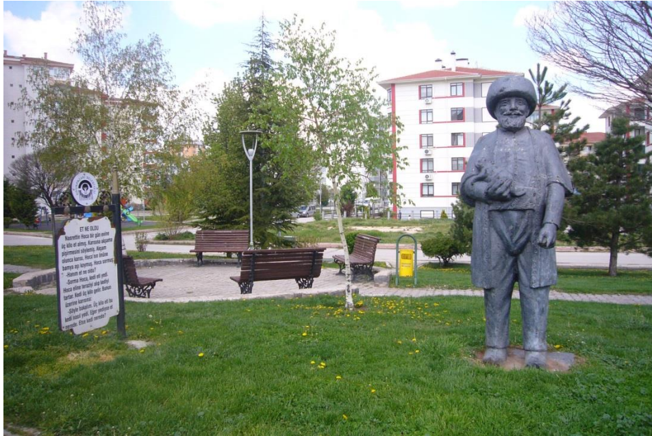
Resim 3.37. Eskişehir Gülmece Parkı 1

Eskişehir’de Odunpazarı Belediyesi tarafından 2008 yılında açılan Gülmece Parkı bulunmaktadır. Parkın içerisinde Nasreddin Hoca fıkraları hem heykellerle canlandırılmış hem de fıkra metinleri tabelalar halinde heykellerin yanında yer almaktadır. Eskişehir’deki bu Gülmece Parkı’nda “Söyle bari”, “Et ne oldu”, “Ya tutarsa”, “Kazan doğurdu”, “Eşeğe ters binmek” fıkraları heykellerle canlandırılmaktadır. Bu fıkraların canlandırıldığı heykellerin görsellerinden bazıları şunlardır: