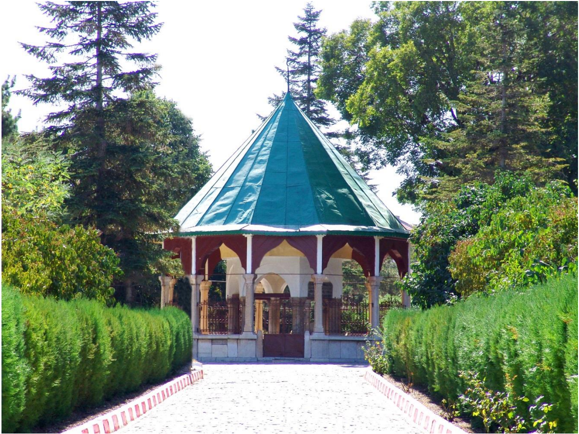
Resim 3.8. Nasreddin Hoca Türbesi Dış Görünüm

Akşehir'e turistik amaçla gelenlerin en çok ziyaret ettikleri yer Nasreddin Hoca'nın türbesidir (Resim 3.8.). Burası Akşehir halkı tarafından Nasreddin Hoca'nın Akşehir'e olan aidiyetini herkese ispatladığı, önemli bir simge mekân haline gelmiştir.