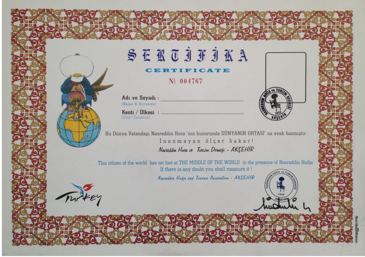
Resim 3.11. Nasreddin Hoca Turizm Derneği'nin Dünyanın Ortası Sertifikası