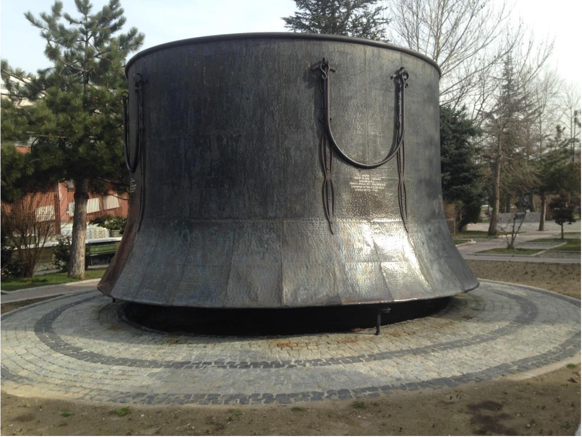
Resim 3.20. Nasreddin Hoca'nı Kazanı

Bu kazanın büyüklüğünün Nasreddin Hoca'nın mizahının uygulamalı olarak gösterildiğinin bir imgesi olarak düşünülebilir. Kazan, tek başına görsel bir imge olarak sözlü kültürün ürünü olan "kazan doğurdu" fıkrasını imlemektedir. Ancak bu imlemeyi yapabilmesini sağlayan kazanı görenlerin kültürel belleğinde bu fıkranın hâlihazırda bulunuyor olmasıdır.