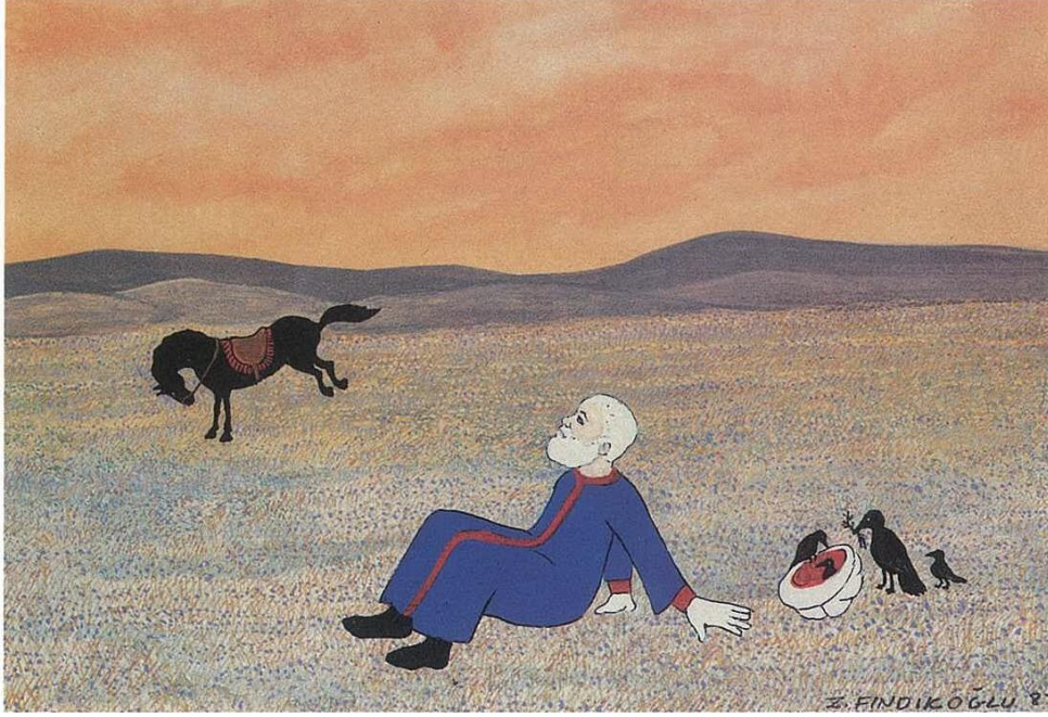
Resim 3.2. Nasreddin Hoca Karpostalı (1)

Nasreddin Hoca imgesinin kullanıldığı ürünlerle karşılaşmakta ve bu ürünleri satın alabilmektedir. İstanbul'da Galata Kulesi civarında bulunan bir hediyelik eşya dükkânında yabancı turistlere yönelik hazırlanmış kartpostallarda Nasreddin Hoca imgesinin kullanıldığı görülmektedir (Resim 3.2 ve Resim 3.3.).