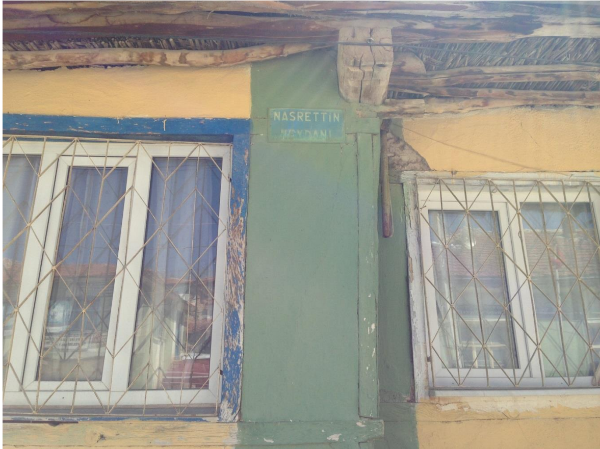
Resim 3.30. Nasrettin Meydanı

Nasreddin Hoca imgesinin köy içerisindeki mekân isimlendirmelerinde kullanıldığı tespit edilmiştir. Nasreddin Hoca Köyü'nün meydanı, köy kahvesinin, eski belediye binasının ve eşeğine ters binmiş Nasreddin Hoca heykelinin bulunduğu alandır ve burası “Nasrettin Meydanı” (Resim 3.30.) olarak anılmaktadır.