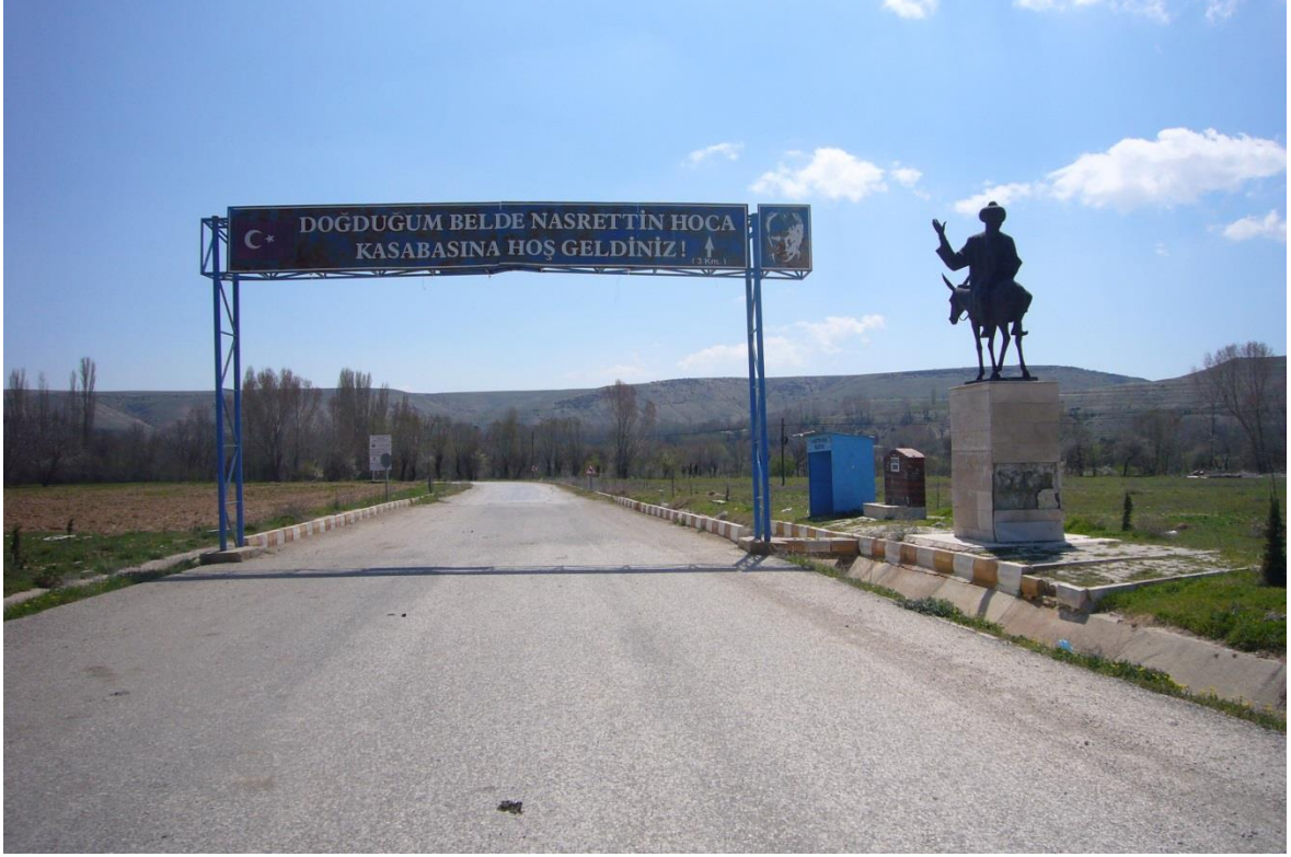
Resim 1.6. Nasreddin Hoca Köyü'nün Girişi

olan Nasreddin Hoca'nın dilinden ifade edilen "Doğduğum Köye Hoşgeldiniz" ibaresi (resim 1.6.) görülmektedir.