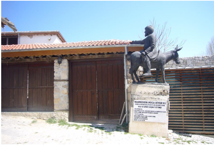
Resim 3.24. Nasreddin Hoca'nın Doğduğu Ev Dış Görünüm

yaşatmaya başlamıştır. Bu ad değişikliği uygulamalı halk biliminin örnekleri arasında değerlendirilebilir. Köyün girişinde eşeğine ters binmiş bir Nasreddin Hoca heykeli, üzerinde “Doğduğum Belde Nasrettin Hoca Kasabasına Hoşgeldiniz” yazan büyük bir levha ve Nasreddin Hoca Çeşmesi bulunduğu görülmektedir. Nasreddin Hoca Köyü, genel kabule göre Hoca'nın doğduğu köydür ve Hoca'nın doğduğu ev de burada bulunmaktadır. Nasreddin Hoca'nın doğduğu evin girişinde eşeğine ters binmiş eliyle de evi gösteren Nasreddin Hoca heykeli bulunmaktadır ve üzerinde de “doğduğum mekâna buyurun” ifadesi (Resim 3.24.) yer almaktadır.