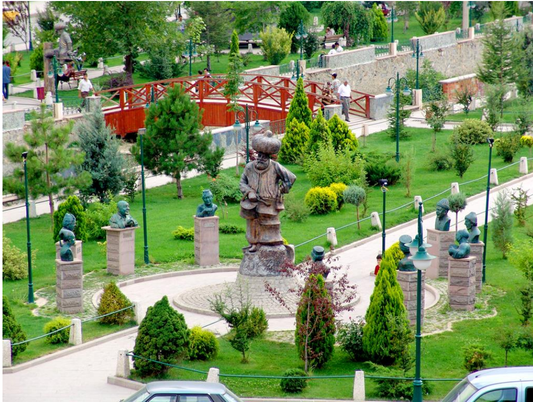
Resim 3.15. Gülmece Parkı’nın Girişi

Akşehir’de Nasreddin Hoca ile ilgili bir diğer uygulama ise türbenin yakınındaki Gülmece Parkı’ndadır. Adından da anlaşılacağı üzere mizah temelinde oluşturulmuş bir parktır. Buranın girişinde elinde göle maya çaldığı bakracı ve kaşığıyla birlikte eşeğine ters binmiş büyük bir Nasreddin Hoca heykeli vardır. Bu heykelin etrafında mizahının kaynağını Nasreddin Hoca’dan ve sözlü gelenekten aldıklarını ifade eden Kel Hasan Efendi, Nejat Uygur, Erol Günaydın, Müjdat Gezen, Kavuklu Hamdi, Naşit Özcan, İsmail Dümbüllü, Münir Özkul, Ferhan Şensoy gibi güldürü ustalarının büstleri bulunmaktadır (Resim 3.15.). Parkın içerisinde yine Hoca’nın mizahını karikatürlerinde yaşatan Bedri Koraman, Mustafa Eremektar, Semih Balcıoğlu, Cemal Nadir Güler, Ferit Öngören, Oğuz Aral, Altan Erbulak, Nehar Tüblek, Turhan Selçuk gibi karikatüristlerin büstleri de vardır.