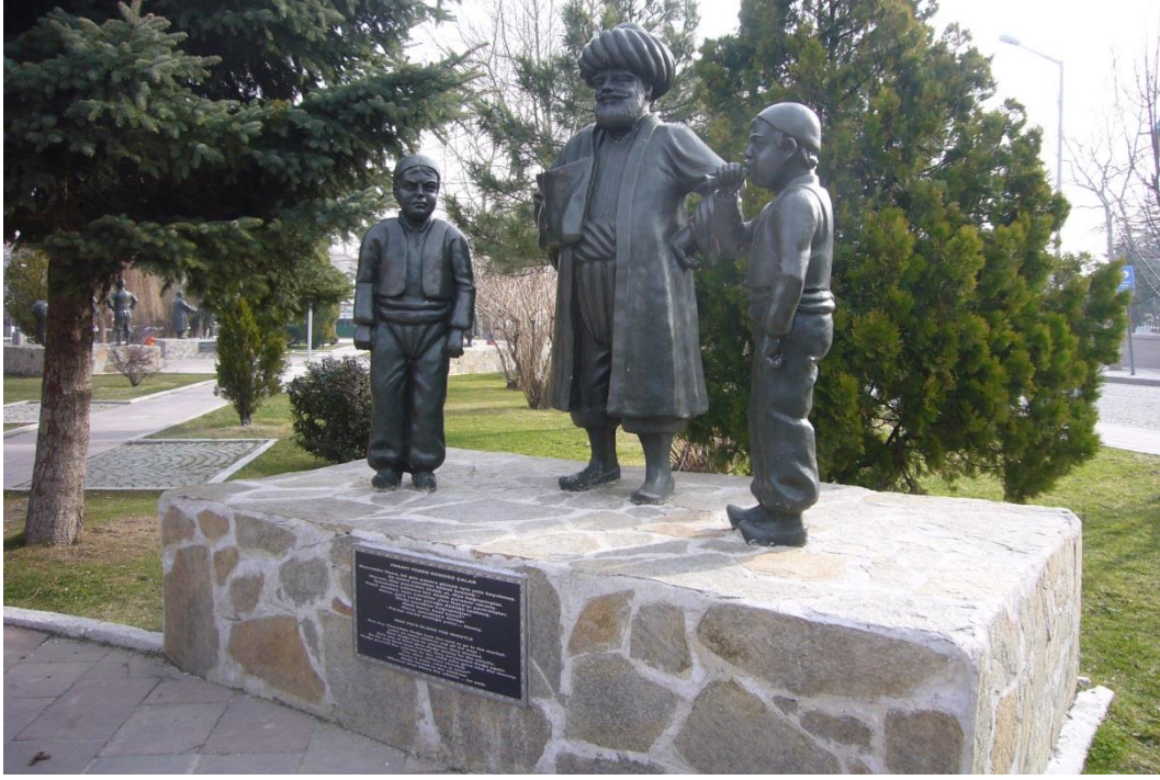
Resim 3.19. Parayı Veren Düdüğü Çalar

Gülmece Parkı'nda fıkraların canlandırıldığı heykellerin dışında, parkın sonunda Nasreddin Hoca'nın "Kazan doğurdu" 5 fıkrasındaki kazandan esinlenerek yapılmış devasa bir kazan bulunmaktadır (Resim 3.20).