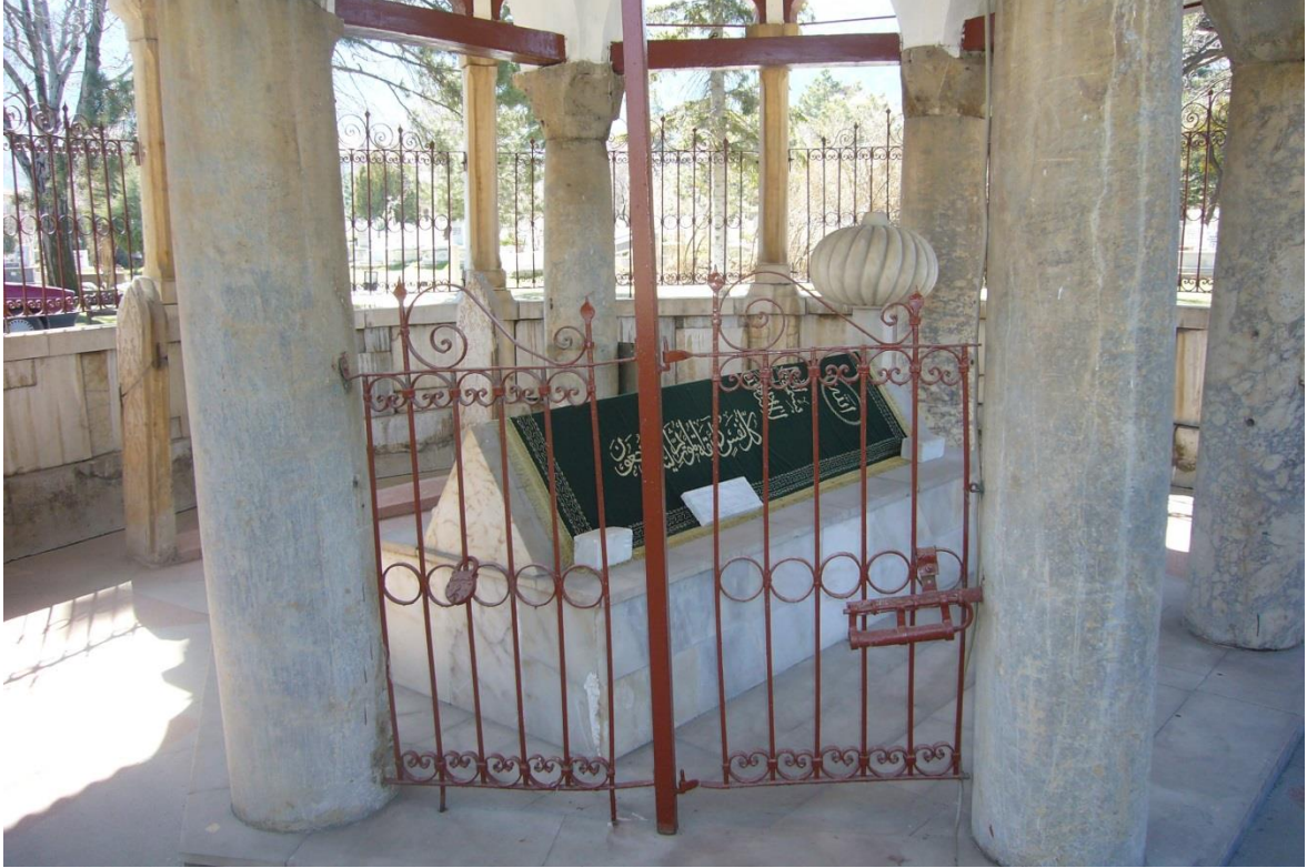
Resim 3.9. Nasreddin Hoca Türbesi İç Görünüm

“Günümüze büyük değişiklikler geçirdikten sonra ulaşan türbe, iki bölümden oluşur. Tarihi belgelerden edinilen bilgiye göre, 14. yüzyılda yapılmış ve 6 yuvarlak sütun üzerine oturtmuştur. Sonradan dışa, 12 desteğe oturan revak görünümlü çokgen kuruluş yapılmıştır. Türbenin dört tarafının açık, bir tarafının asma kilitle kapalı olması Nasreddin Hoca'nın mizah anlayışının göstergesidir” (Akşehir Kataloğu 2011) (Resim 3.9.).