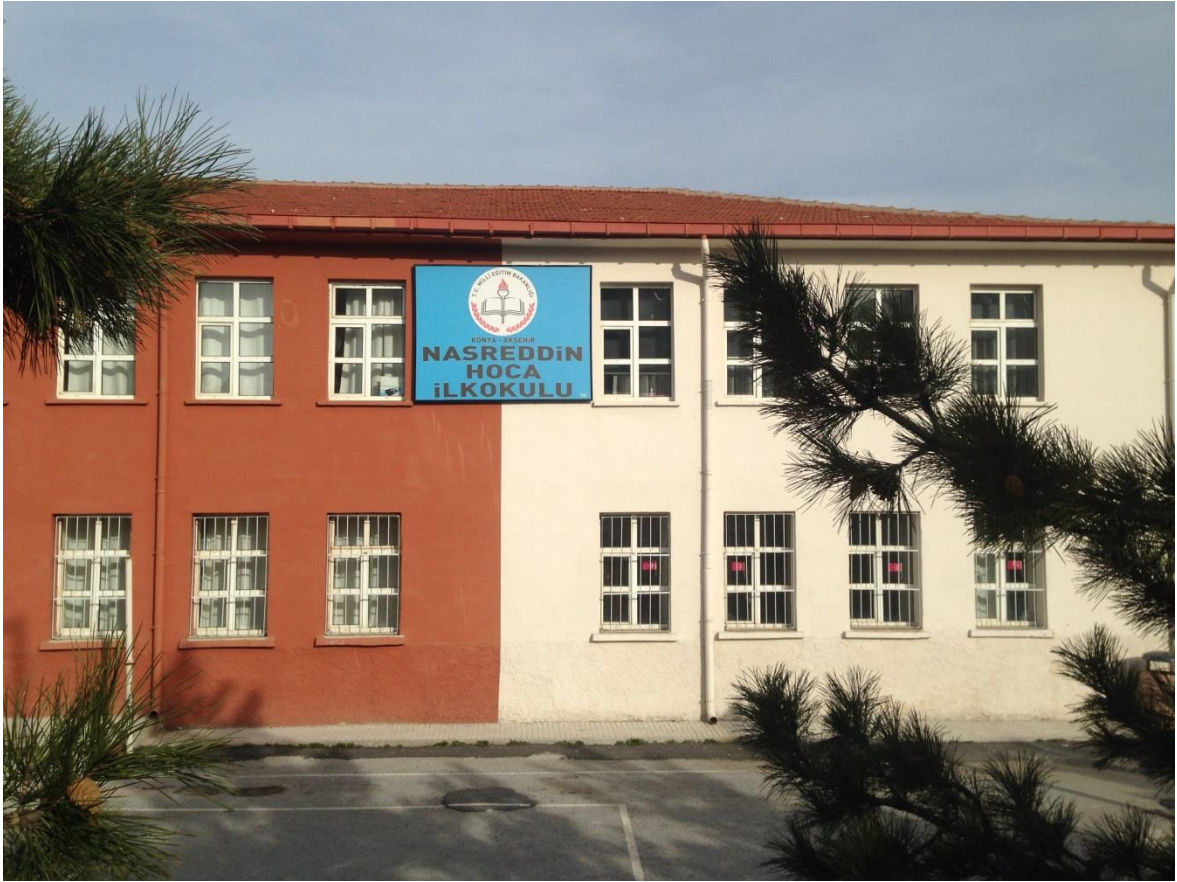
Resim 1.3. Nasreddin Hoca İlkokulu

Kentlere kimliğini veren şahsiyetler etrafında oluşturulmuş imgelerin isimlerinin de kentin pek çok yerinde kullanıldığı görülmektedir. Bu noktada Akşehir'de de kentin temel imgesi olan Nasreddin Hoca'nın adının da okul (Resim 1.3.), müze (Resim 1.4.), işyeri gibi pek çok yerin adlandırılmasında kullanıldığı görülmektedir.