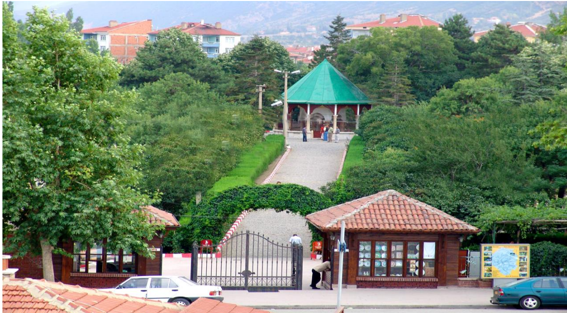
Resim 1.2. Nasreddin Hoca'nın Türbesi