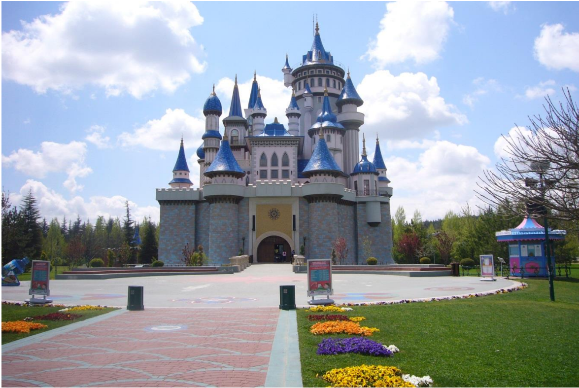
Resim 3.40. Eskişehir Sazova Parkı Masal Şatosu