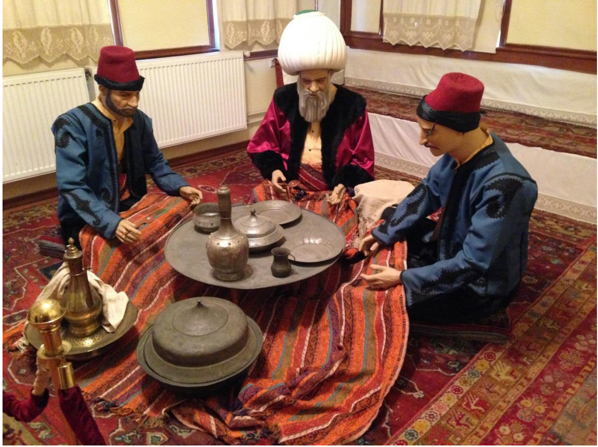
Resim 3.22. Nasreddin Hoca Etnografya Müzesi

Akşehir'de Nasreddin Hoca'nın imgesel olarak kullanıldığı mekânlardan birisi de Nasreddin Hoca Arkeoloji ve Etnografya Müzesi'dir. Müzede etnografik eserlerin sergilendiği üçüncü katta bir odada Nasreddin Hoca'nın "Ye kürküm ye" fıkrası canlandırılmaktadır (Resim 3.22.).