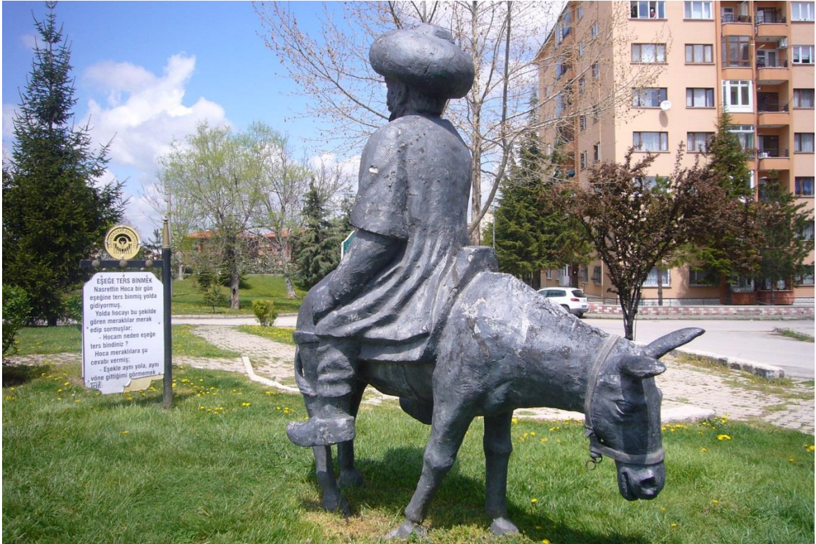
Resim 3.39. Eskişehir Gülmece Parkı 3

Nasreddin Hoca fıkralarından hareketle oluşturulan Gülmece Parkı, tıpkı Akşehir'deki gibi sözlü kültür ürünlerinin görselleştirilmiş hallerini sunmaktadır. Bu park, Nasreddin Hoca ve fıkralarına dair kentsel peyzajda görünürlüğü arttırmak adına önemli bir çalışma olarak düşünülebilir. Aynı zamanda fıkraların