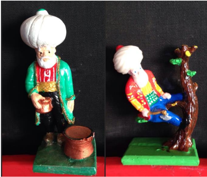
Resim 2.4. AKSEV'in hediyelik eşyaları 2

Nasreddin Hoca'nın eşeğe ters binmesi toplumun hafızasındaki popüler imgelerden birisidir. Bunun kültür endüstrisinin bir parçası olan hediyelik eşya üretiminde de yaygın olarak kullanılan imgelerden biri olduğunu söyleyebiliriz. Göle mayan çalan, kazanı doğurtan, bindiği dalı kesen Nasreddin Hoca imgeleri de kültür endüstrisinde ürüne dönüştürülmektedir. Akşehir'de üretilen hediyelik eşyalarda da bunu örnekleri görülmektedir.