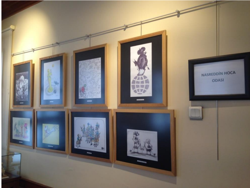
Resim 3.34. Anadolu Üniversitesi Eğitim Karikatürleri Müzesi'nde Nasreddin Hoca Odası

Yine Eskişehir merkezde bulunan Anadolu Üniversitesi Eğitim Karikatürleri Müzesi'nde Nasreddin Hoca Odası adı verilen bir oda bulunmaktadır (Resim 3.34). Bu odanın duvarlarında gerek yerli gerek yabancı karikatüristlerin Nasreddin Hoca mizahının anlam dünyasıyla bugünün dünyasını çizgileriyle yorumladıkları karikatürleri yer almaktadır.