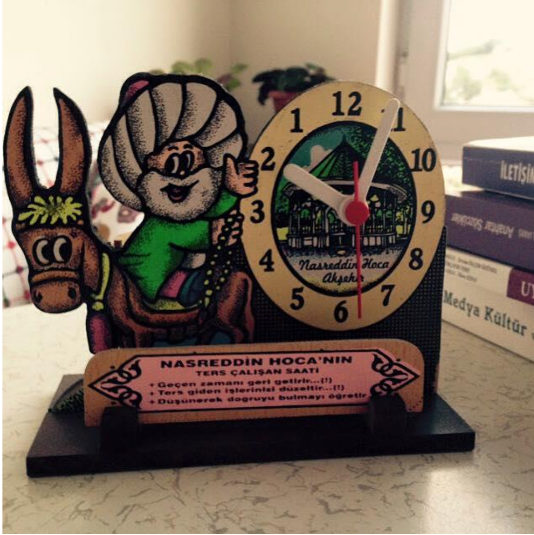
Resim 2.2. Nasreddin Hoca'nın Ters Çalışan Saati

çizimlerinin, düzenlenmesinin, imalatının her aşamasının kendi atölyesinde yapıldığını, çok fazla talep gördüğü için diğer hediyelik eşyaların üretimine yetişemediklerini ve sadece tersine saat üretimine devam ettiklerini dile getirmiştir.