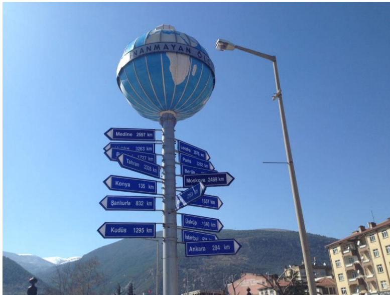
Resim 3.13. İnanmayan Ölçsün Anıtı

Nasreddin Hoca'nın yine "dünyanın merkezi burasıdır inanmayan ölçsün" 4 diye biten fıkrasından alınan ilhamla hayata geçirilen "İnanmayan Ölçsün Anıtı" (Resim 3.13) Nasreddin Hoca'nın türbesinin yakınında yer almaktadır.