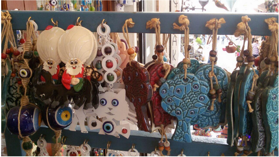
Resim 3.4. Ankara Kalesi Civarı Hediyelik Eşya Dükkânı

Nasreddin Hoca imgesiyle karşılaşılan yerler içerisinde turistik mekânlarda bulunan hediyelik eşya dükkânları da vardır. Bu dükkânlarda birbirinden farklı yerlere ait kültürel imgeler etrafında oluşturulmuş hediyelik eşyalar birlikte yer almaktadır. Resim (3.4.) ve resim (3.5.) Ankara Kalesi civarında bulunan hediyelik eşya dükkânlarında çekilmiştir.