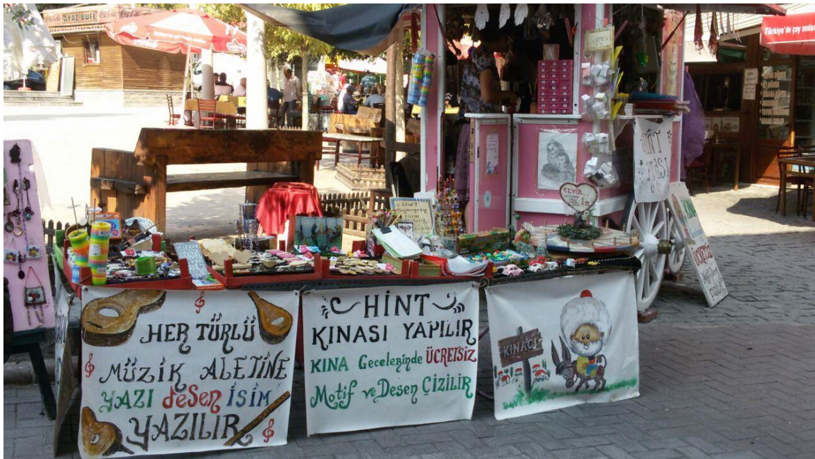
Resim 3.1. Ankara Hamamönü Hediyelik Eşya Standı

Nasreddin Hoca imgesinin kullanımıyla ilgili herhangi bir telif ve tescil çalışmasının olmaması, bu imgenin kültür endüstrileri, yaratıcı endüstriler ve kültür turizmi gibi kültür ekonomisi alanlarında kullanımına bir sınırlandırma getirmemektedir. Bu durum imgenin pek çok alanda kullanılarak görünürlüğü artırması açısından olumlu gibi görünse de bazen bağlamı dışında ticarî amaçlarla kullanılmasına neden olmaktadır. Bu duruma örnek olarak resim 3.1.'de Nasreddin Hoca imgesinin bağlamı dışında başka bir kültürel uygulamanın ticarî tanıtımını yapmak amacıyla görsel olarak kullanıldığı görülmektedir.