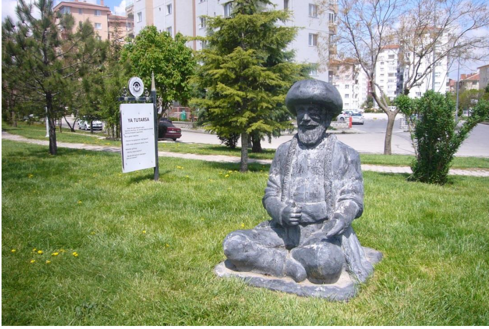
Resim 3.38. Eskişehir Gülmece Parkı 2