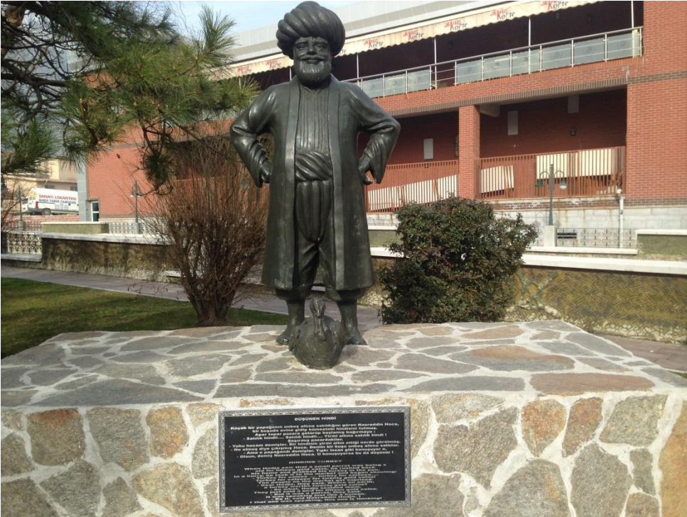
Resim 3.18. Düşünen Hindi