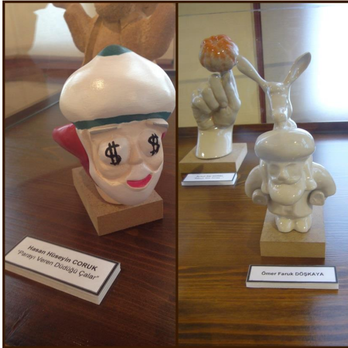
Resim 3.36. Anadolu Üniversitesi Eğitim Karikatürleri Müzesi'nde Nasreddin Hoca Odası

Buradaki tasarımlar kaynağını Nasreddin Hoca'nın mizahından almıştır. Sözlü kültürde oluşmuş Nasreddin Hoca fıkralarını kendi yaratıcılıklarıyla birleştirerek görsel birer imge haline getirmişlerdir. Gelenek unsurlarından faydalanarak