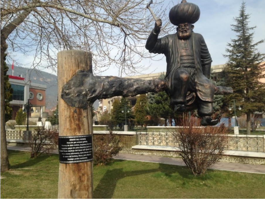
Resim 3.17. Bindiği Dalı Kesmiş