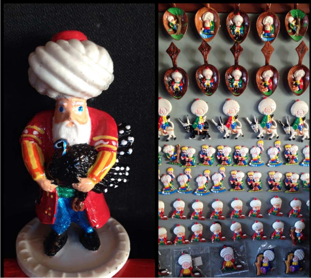
Resim 2.6. AKSEV'in hediyeelik eşyaları 4