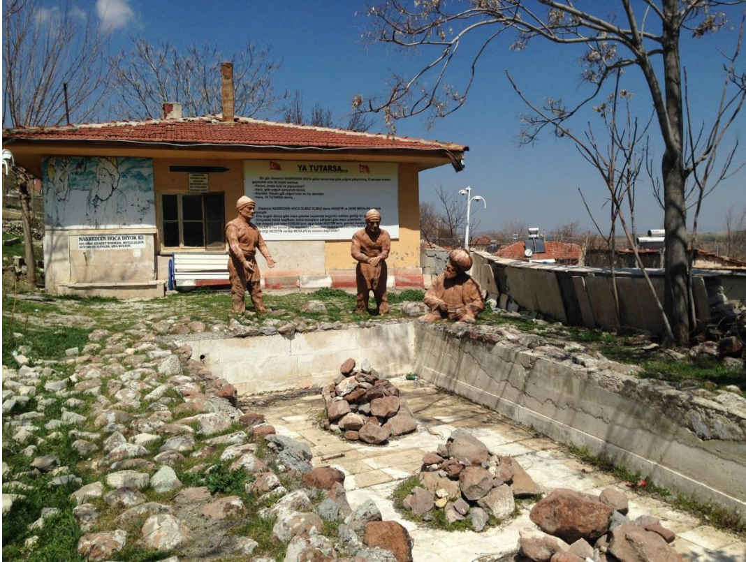
Resim 3.32. Nasreddin Hoca Kültür Parkı 2