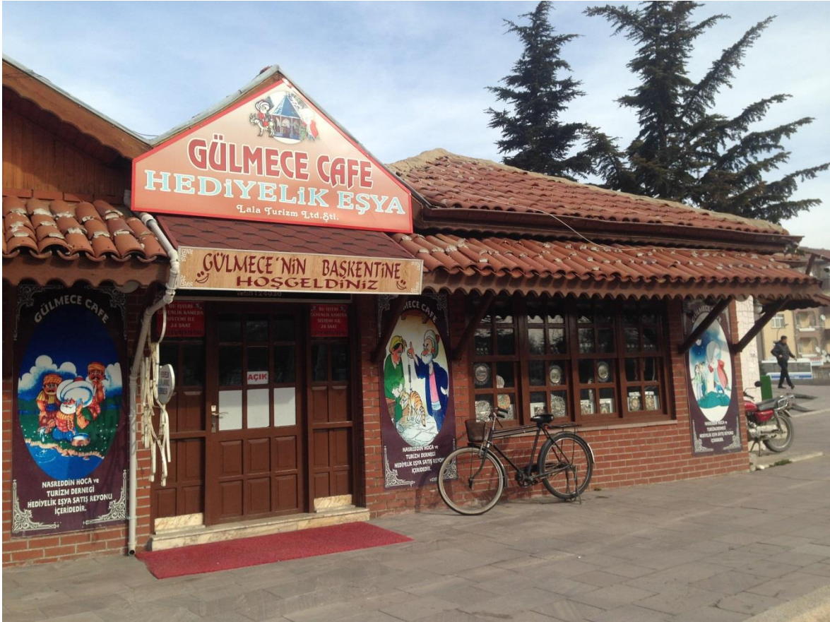
Resim 3.21. Gülmece Kafe ve Hediyelik Eşya Dükkânı

Gülmece Parkı'nın içerisinde AKSEV'e bağlı olarak Nasreddin Hoca'nın hediyelik eşyalarını da satan Gülmece Kafe (Resim 3.21.) yer almaktadır. "Gülmecenin Başkentine Hoşgeldiniz" sloganıyla yerli yabancı turistlerin dikkatini çekebilecek bir mekân olarak düşünülebilir. Sözlü bellekte oluşmuş Nasreddin Hoca'nın, imge olarak ekonomik değere dönüştürüldüğü bir yer olduğu ifade edilebilir.