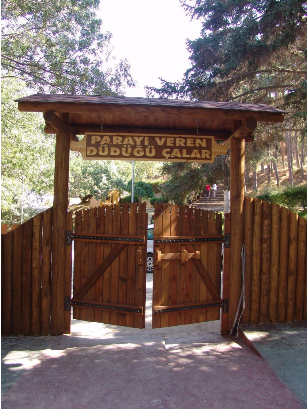
Resim 3.23. Akşehir Belediyesi Sosyal Tesisleri Giriş Kapısı

Nasreddin Hoca mizahının, Akşehir'in daha pek çok yerinde kullanıldığı görülmektedir. Bu yerlerden biri de Akşehir Belediyesi Sosyal Tesisleri'dir. Buranın bahçe kapısında sizi "Parayı veren düdüğü çalar" yazan ahşap bir tabela (Resim 3.23.) karşılamaktadır.