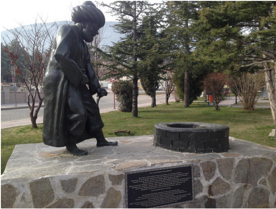
Resim 3.16. Ay'ı Kuyudan Çıkarmak

İngilizce olarak yazılmıştır. Gülmece Parkı'nda heykellerle canlandırılan Nasreddin Hoca fıkralarının metinleri altlarında yazmasa dahi, görsel bir imge olarak zihnimize fıkra metnin çağrışmasını sağlamaktadır. Ancak fıkra metninin yazılması bir yandan fıkrayı bilmeyenlerin öğrenmesine ve canlandırılan fıkranın görsel sunumuyla birlikte bir anlam oluşturmaya yardımcı olmaktadır. Gülmece Parkı'nda heykellerle canlandırılan Nasreddin Hoca fıkraları şunlardır: Ay'ı Kuyudan Çıkarmak (Resim 3.16.), Turşuyu Sen mi Satacaksın Ben mi?, Testiyi Kırmadan Önce, El Âlemin Ağzı Torba Değil ki Büzesin, Tarifesi Bende, Keramet Kavuktaysa, Bindığı Dalı Kesmiş (Resim 3.17), Ya Tutarsa!, Kazan Doğurdu, Düşünen Hindi (Resim 2.18), Sağlığında Buradan Giderdim, Parayı Veren Düdüğü Çalar (Resim 2.19.), Düşmeseydim İnecektim, Ağaçtan Öte Yol Gider, Yorgan Gitti Kavga Bitti, Kedi Nerede? Fıkraların canlandırıldığı bu heykellerden bazılarının görselleri şöyledir: