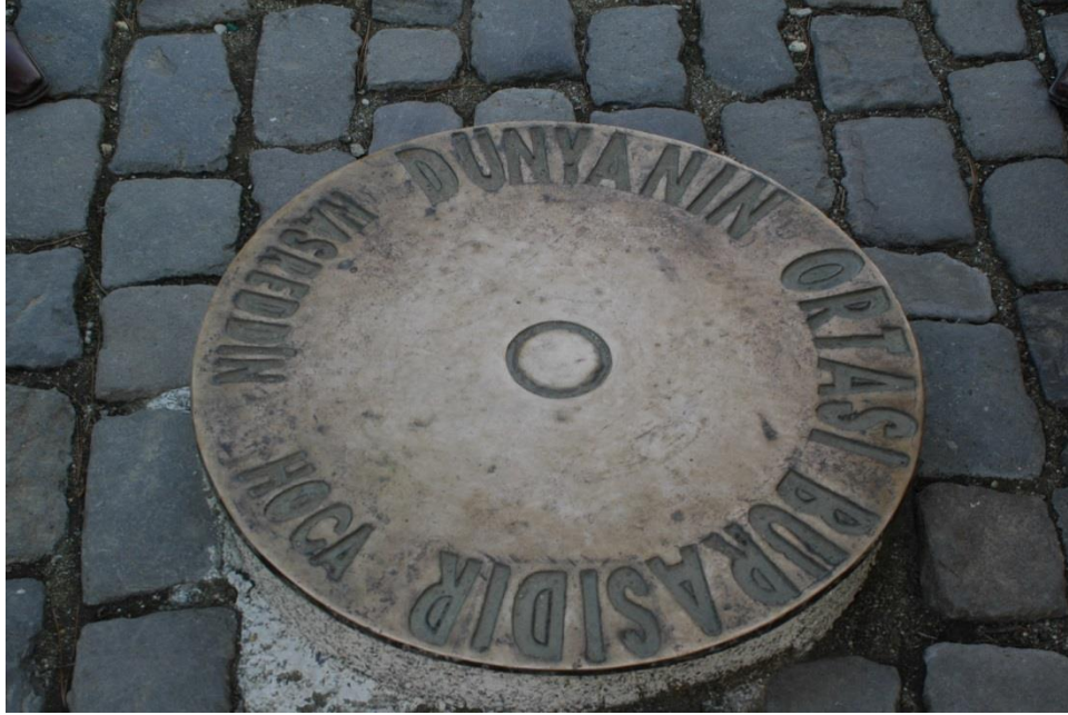
Resim 3.10. “Dünyanın Ortası Burasıdır” platformu.

Akşehir’de Nasreddin Hoca’nın “dünyanın merkezi” 3 fikrında bahsedilen yerin Akşehir olduğuna dair bir yargı vardır. Akşehir’de “dünyanın merkezi” sloganıyla markalaşma yolunda çalışmalar yaptığı görülmektedir. Markalaşma denilince “yerelliğin dünya ile buluşması” (Özdemir, 2012: 66) noktasından hareket eden tek tescil kurumu olan Türk Patent Enstitüsü akla gelmektedir. Bu doğrultuda Nasreddin Hoca ve Turizm Derneği de 2006 yılında Türk Patent Enstitüsü’ne yaptığı başvuru sonucunda on yıllığına “Dünyanın Ortası Akşehir” tescil belgesini almıştır. Beraberinde de Nasreddin Hoca Türbesi’nin önüne “Dünyanın Ortası Burasıdır” yazan bir platform (Resim 3.10.) yerleştirilmiştir.