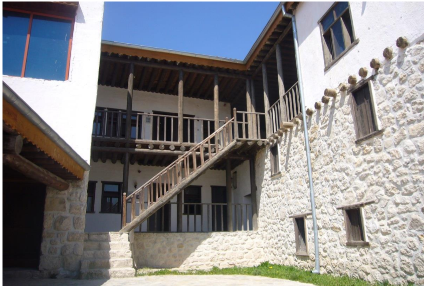
Resim 3.25. Nasreddin Hoca'nın Doğduğu Ev İç Görünüm