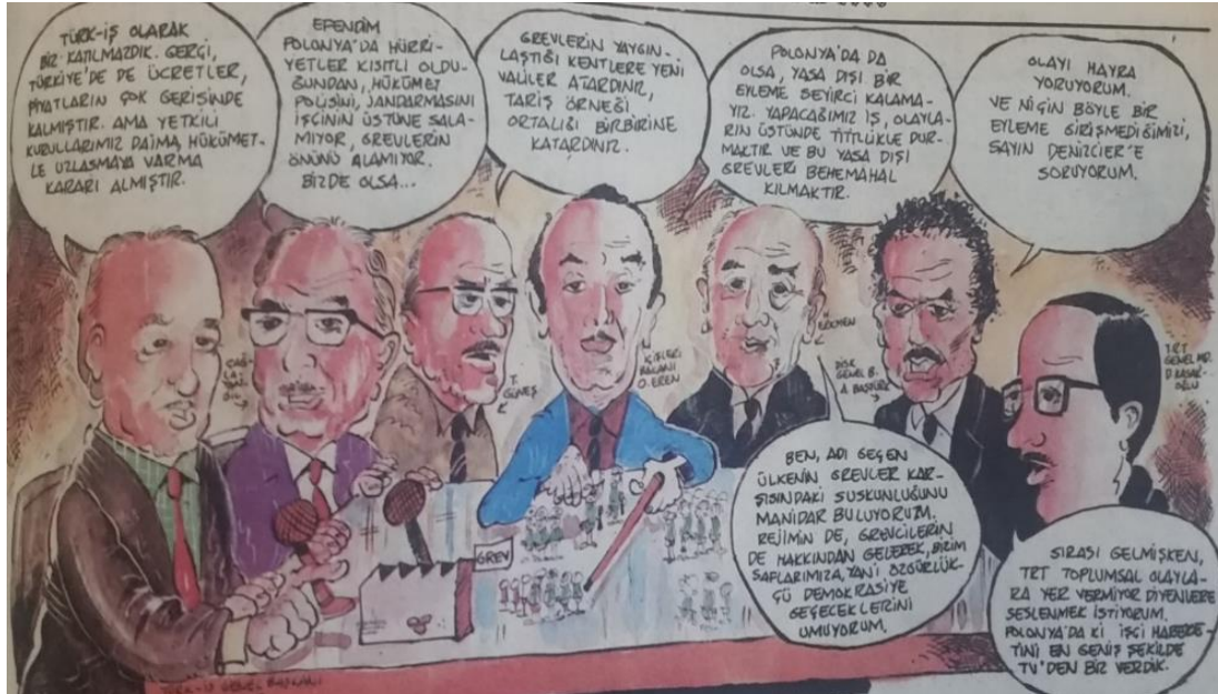
Resim 4.22. Çarşaf/03.09.1980