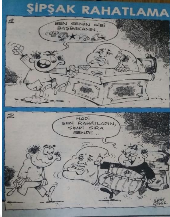
Resim 4.31. Çarşaf/10.09.1980