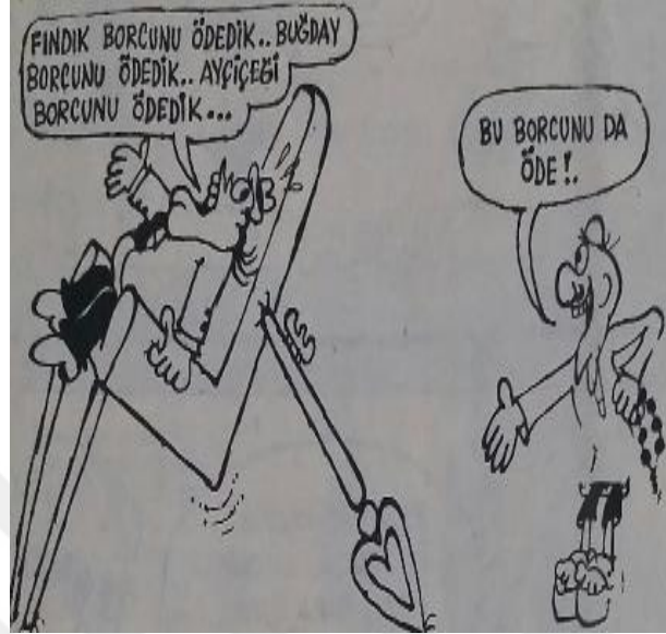
Resim 4.11. Çarşaf/10.09.1980

destekleyen hippilere kendi partisinin kapılarını açmaktadır. Karikatür Erbakan'ın siyasi duruşundan ziyade Erbakan özelinde siyasi ahlak anlayışını sorgulamayı amaçlamaktadır.