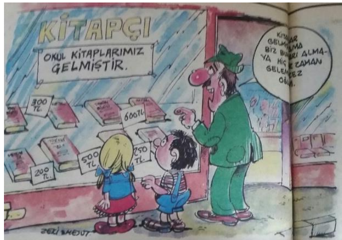
Resim 4.57. arřaf/10.09.1980