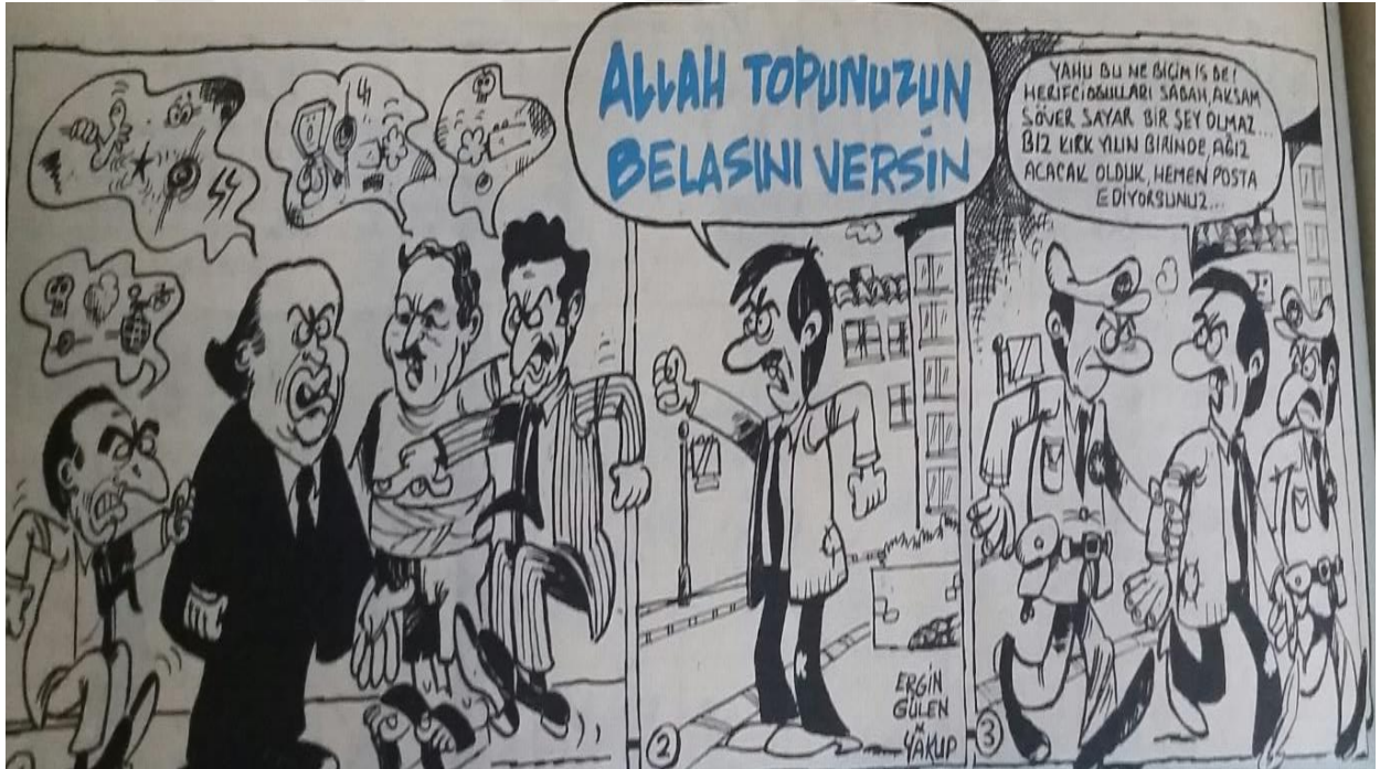
Resim 4.28. Çarşaf/10.09.1980

Dönem itibariyle siyasi uzlaşmazlıktan doğan istikrarsızlık, topluma yansımış, siyasi aktörlerin tümüne karşı bir güvensizlik oluşmuştur. Karikatürde toplumun bu duruma karşı verdiği tepki birey üzerinden yansıtılmıştır. Siyasilere kızgınlığını fiziksel şiddet kullanmadan belirten vatandaşın karakola götürülmesi asli görevi asayişçi sağlamak olan polisin tutumunun sorgulanmasını sağlamaktadır.