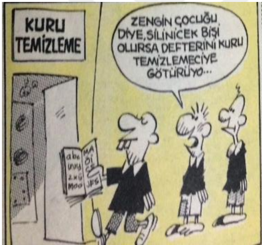
Resim 4.58. Gırgır/28.09.1980

Her iki dergi de okul kıyafeti ve kitaplarının ekonomik şartlar el vermediği için veliler tarafından alınmadığını ele almıştır. Gırgır, karikatürü “Veliler “Çocuklarımıza önlük alamıyoruz” dediler” başlığı kullanarak bir mizah yazısı eşliğinde vermiştir. Yazıda şu ifadeler yer bulmuştur: “Öğrenci velileri dün yaptıkları açıklamada çocuklarına önlük alamadıklarını söylediler. “Böyle giderse çocuklarımız bu yıl okula gidemeyecek diyen veliler adına konuşan Ebru Cintonik “Çünkü sosyete olarak günlerdir bu yılın önlük modasını bekliyoruz. Ama modacılar hala bir girişimde bulunmadılar. Çocuklarımızı öyle herkesin çocukları gibi sıradan önlüklerle okula gönderemeyiz...” Yazıda, haber metni diline yakın bir dil kullanılmış konu gerçek bir durummuş gibi sunulmuştur. Karikatürde toplumun ekonomik olarak farklı kesimlerden oluşmasının kaygıları da farklılaştırdığı mesajı bulunmaktadır. Çarşaftaki karikatür ise komedi unsuru olmadan yalın gerçeği yansıtmaktadır. Yan anlama başvurmada düz anlamla sorunun aktarıldığı görülmektedir.