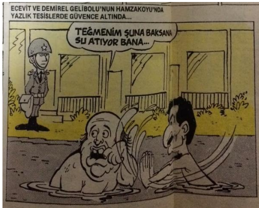
Resim 4.88. Gırgır/21.09.1980

Çarşaf'ın, karikatüründe ise Rahşan Ecevit ve Nazmiye Demirel'in çamaşır yıkadıkları görülmektedir. Karikatürde bir çamaşır deterjanı firmasının reklamlarında geçen replikler kullanılmış Rahşan Ecevit ve Nazmiye Demirel'in artık gündelik hayatın sıradan uğraşları içinde oldukları aktarılmak istenmiştir.