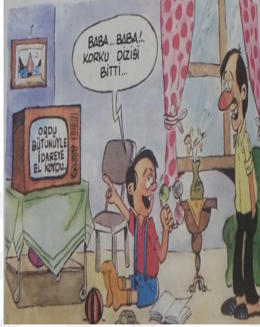
Resim 4.82. Çarşaf/24.09.1980

karikatürde, sarhoş olduğu sanılan kişi aslında olayların durulmasının şaşkınlığını yaşamaktadır. Karikatürde “darbe sonrası siyasi şiddet ve terör olaylarının durması sağlanmış bu huzur ortamını darbeyi yapan asker yaratmıştır” örtük mesajı çıkmakla birlikte görsel veya yazılı asker ile ilgili hiçbir bilgiye yer verilmemiştir.