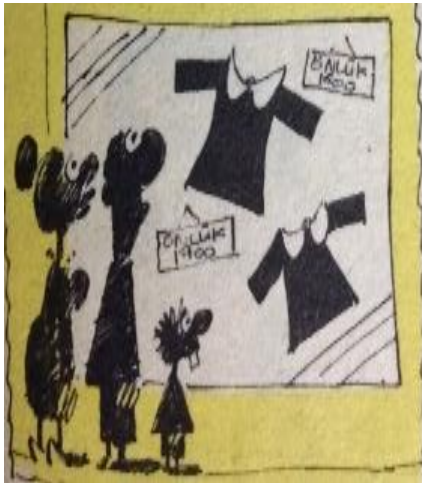
Resim 4.56. Gırgır/21.09.1980

Gırgır'daki karikatr eđitim masrafları aileleri tarafından karřılanamayan ğrencilerin neler yařadığını anlatmaktadır. Okul antası olmayan ocuđun yz ifadesi karikatrn yazısından daha gl bir mesaj tařımaktadır. arřaf'ta ise 24 Ocak kararlarının uygulanması ile bařlayan IMF – Trkiye iliřkilerine gnderme yapılmakta Stand By antlařması ile IMF'den alınan krediler anlatılmaktadır. Bu karikatr ekonomik sıkıntıları IMF ile iliřkilendirerek okuru sorgulamaya gtrmektedir.