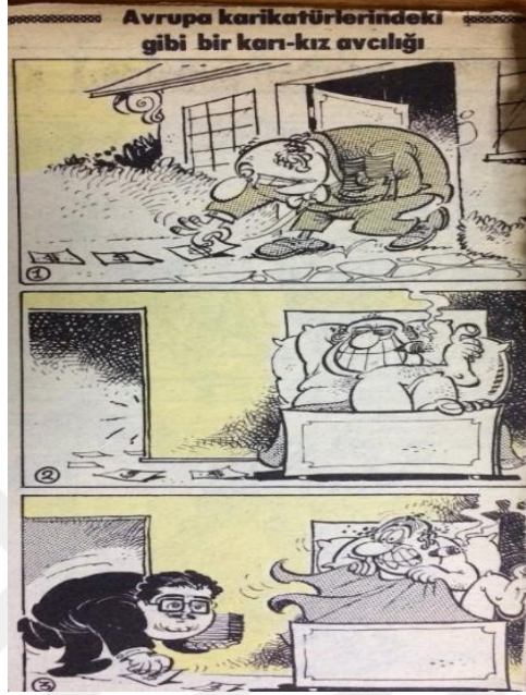
Resim 4.33. Gırgır/14.09.1980

80'li yılların başında siyasi konuların yanında darbenin nedenleri arasında gösterilen ekonomik sıkıntıların da mizaha konu olduğu görülmektedir. Ekonomi politikaları ve toplumun yaşadığı ekonomik bunalım eleştirinin sık sık hedefi olmuştur.