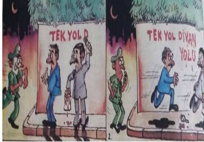
Resim 4.71. Çarşaf/03.09.1980

Dönem itibariyle yoğun olarak yaşanan sokak hareketlerinin en belirgin simgesi duvar yazıları olmuş özellikle sol ideolojiyi benimseyen gruplar politik mesajlarını duvar yazıları üzerinden vermiştir. Karikatürde görülen iki kişi bu grupların sık kullandığı “Tek yol devrim” cümlesini duvara yazacakken polisi görünce vazgeçerek “Tek yol divan yolu” yazarlar.