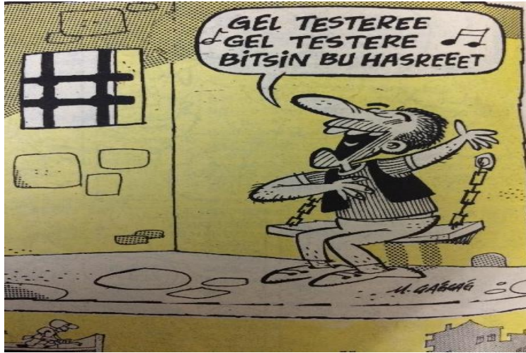
Resim 4.67. Gırgır/07.09.1980

Gırgır'da cezaevinde olduğu anlaşılan karakter, Esmeray'ın söylediği "Gel teskere gel" adlı şarkının sözlerini kendi bulunduğu şartlara göre değiştirmiştir. Karikatürde teskere yerine "testere" kelimesi kullanılarak mahkûmların cezaevlerinden kaçma planları ima edilmek istenmiştir.