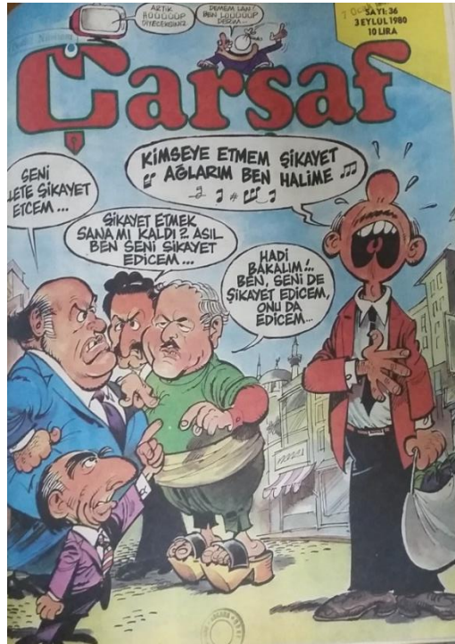
Resim 4.2. Çarşaf/03.09.1980