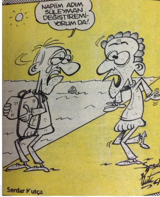
Resim 4.29. Gırgır/07.09.1980