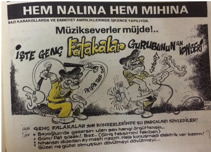
Resim 4.69. Gırgır/14.09.1980