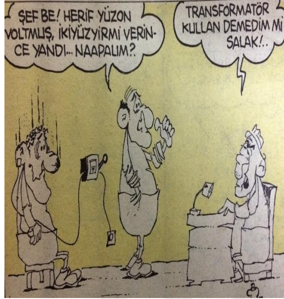
Resim 4.68. Gırgır/14.09.1980