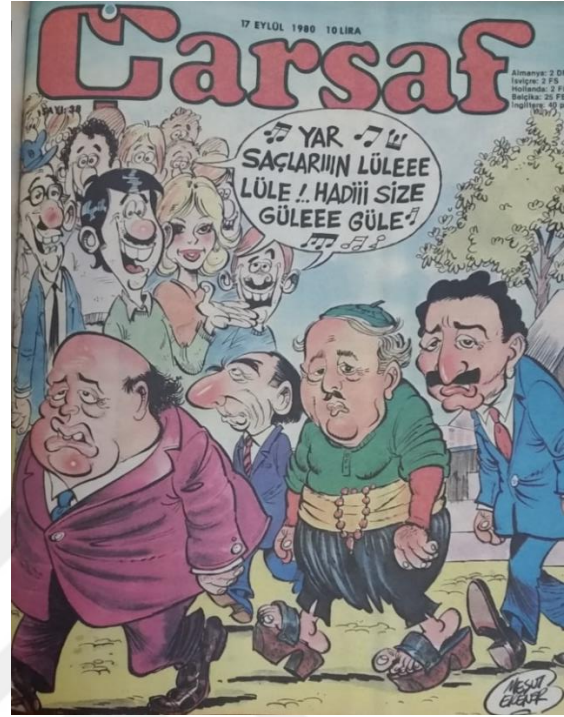
Resim 4.76. Çarşaf/17.09.1980