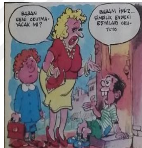
Resim 4.59. Çarşaf/10.09.1980