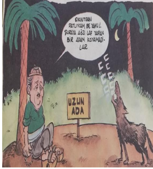
Resim 4.85. Çarşaf/24.09.1980