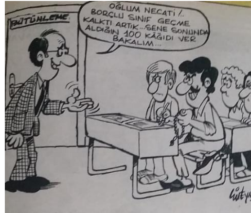
Resim 4.53. Çarşaf/03.09.1980

Her iki karikatürde de ekonomik sorunlar hem öğrenci hem de öğretmenler üzerinden anlatılmıştır. Gırgır'da yer alan karikatürde yaz tatilinde öğrencinin ayakkabı boyacılığı yaptığı öğretmeninde simit sattığı anlaşılmaktadır. Çarşaf'ta ise liselerde uygulanan borçlu