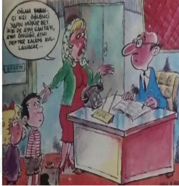
Resim 4.51. Çarşaf/10/09.1980

Okulların eylül ayında açılmasıyla birlikte dar gelirli ailelerin çocuklarının eğitim giderleri dergilerin birinci gündem maddesini oluşturmaktadır. Ele alınan her iki dergide de ekonomi temalı karikatürlerin büyük çoğunluğu bu nedenle eğitim masrafları üzerinedir.