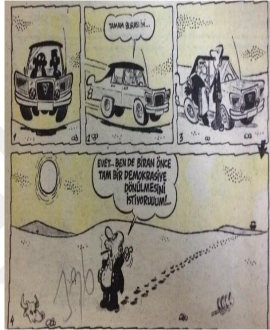
Resim 4.77. Gırgır/28.09.1980

sunulmuştur. Darbe öncesinde yaşanan terör olayları ve ekonomik sıkıntılar nedeniyle 12 Eylül yönetimi toplum gözünde haklılık zeminine sahip olmuş toplumsal desteği arkasına almıştır. Karikatürde de darbe sonrasında toplumun bu durumu hızlıca kabul ettiği bunun yansira şarkı söyleyecek kadar mutlu olduğu anlaşılmaktadır. Liderlere karşı alaycı bir tutumla konuyu ele alan dergide, darbeye ve toplumun bunu alımlama biçimine karşı herhangi bir eleştiri görülmemektedir.