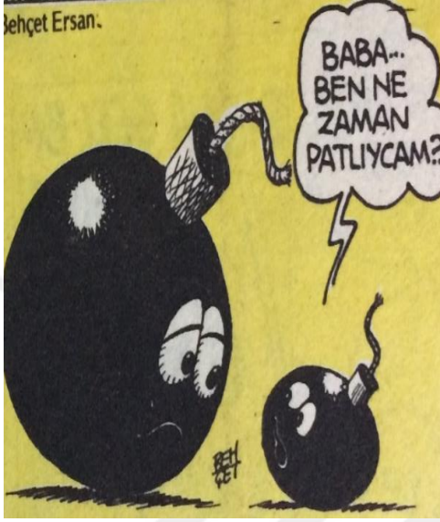
Resim 4.64. Gırgır/07.09.1980