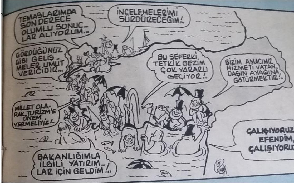
Resim 4.13. Çarşaf/03.09.1980