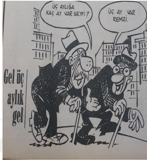
Resim 4.44. Çarşaf/03.09.1980