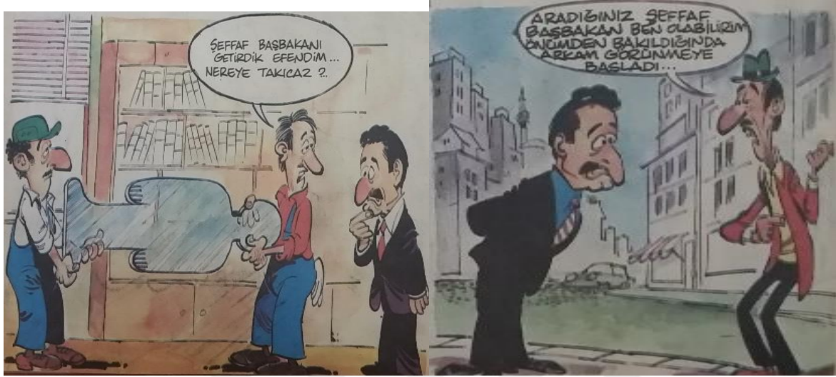
Resim 4.7. Çarşaf/10.09.1980

karikatür dünyasında birçok karikatürist tarafından benimsenen şekilde çizilmiş, böylece ayırt edici biçimsel özelliklere sahip olmuştur. Dergide bilinen siyasi aktörler dışında politikacılar silindir şapkalı, fraklı ve papyonlu olarak çizilmiştir. Sürekli tekrarlanan bu çizim pratiği politikacılarla ilgili belirgin bir imgenin de yaratılmasını sağlamaktadır.