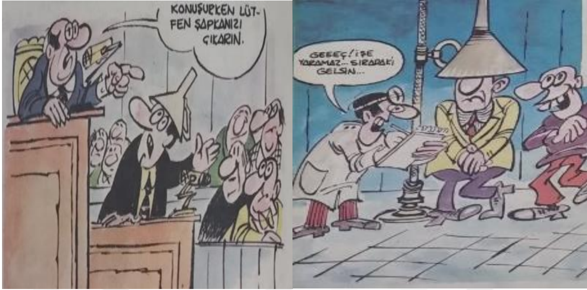
Resim 4.14. Çarşaf/17.09.1980

Çarşaf'ta "Huni testi. Öncelikle bu teste katılmadan önce, çok büyük kafalı, romantik ve şiire meraklı, büyük burunlu, çatık kaşlı, badem bıyıklı ve başı takkeli olmamak, milleti aval yerine koymamak, akrabasını, yeğenini, amcasını devreye sokup milleti soymamak şarttır... Şimdi teste gelelim: İki kere iki kaç eder? Hiç koltuk gördünüz mü? Maksadınız vatana hizmet mi yoksa ya kısmet mi?..." yazısı ile verilen karikatürde siyasetçi olmak için huni testine tabi tutulan kişilerden beklenen özellikler sıralanmıştır. Olmaması gereken vasıflar arasında sıralanan belirgin fiziksel özellikler, darbe öncesi mecliste bulunan tüm siyasi liderlerin özelliklerini yansıtmaktadır. Darbe sonrası çizilen karikatürde eski liderlerin siyasete dönemeyeceği mesajı verilmiştir.