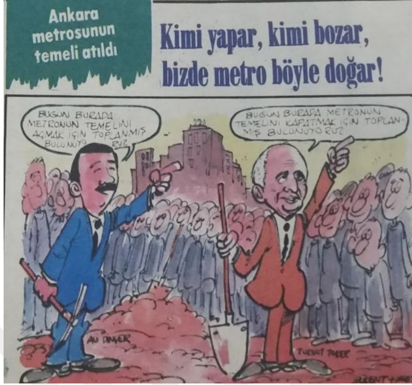
Resim 4.20. Çarşaf/17.09.1980