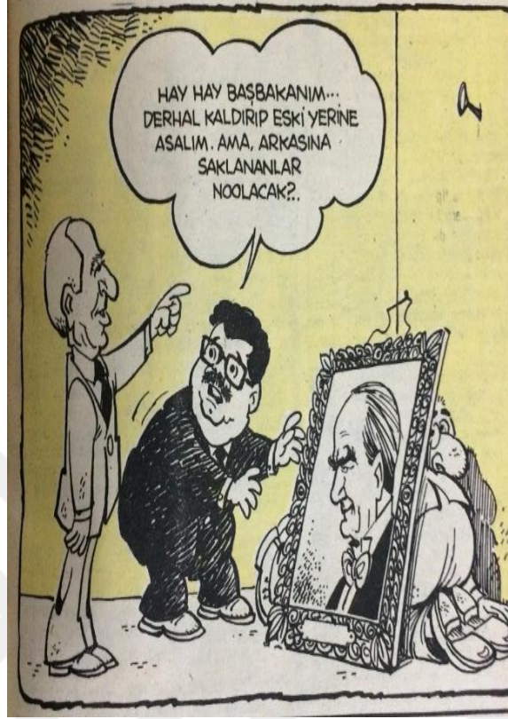
Resim 4.24. Gırgır/28.09.1980