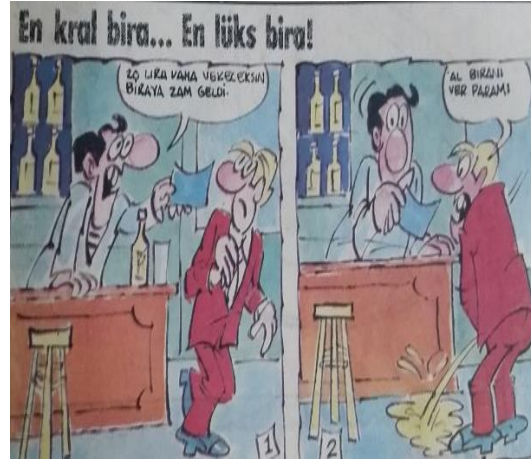
Resim 4.37. Çarşaf/10.09.1980

Çarşaf'ta esnaf ekonomik sıkıntıları anlatmada araç olarak kullanılmıştır. Her iki karikatürde de ekonomik sıkıntıların nedenlerine inilmeden sonuçları mahalleli ve esnaf gerginliği üzerinden aktarılmış esnaf ekonomik mağduriyetin dışında tutulmuştur. Çarşaf'taki ilk ( Resim 4.51. ) karikatürde “Geçim sıkıntınız var mı?” sorusuna esnaf “Eh işte... Geçirip gidiyoruz” cevabını vermiş bu anlamsal çarpıklık mizah unsuru olmuştur. Karikatürde esnafın hem görsel olarak hem de söylem olarak sunumu ekonomik sıkıntılardan uzak bir portre çizmektedir. İkinci karikatürde( Resim 4.56. ) bira içen karakter parayı ödediğinde bira fiyatlarını arttığını ve daha fazla para ödemesi gerektiğini duyunca içtiği birayı kendi yöntemleriyle geri ödemeye çalışmaktadır. Karikatürde komik öge durumun tersine çevrilmesi ile gerçekleşmiştir.