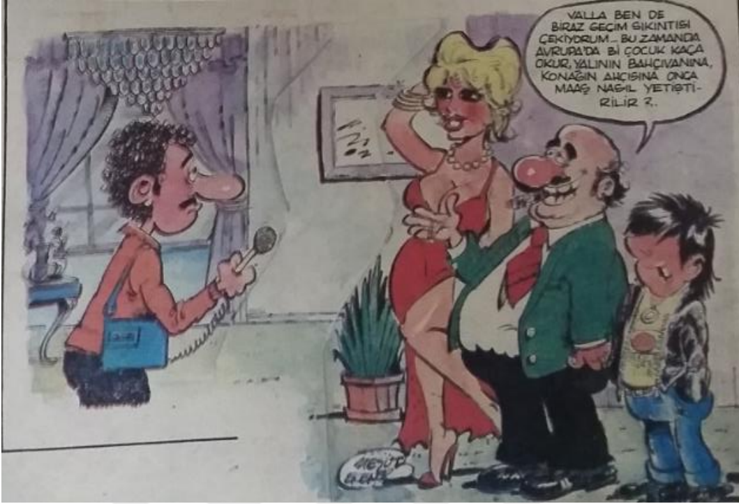
Resim 4.46. Çarşaf/03.09.1980

Çarşaf'ta, ekonomik şartlarla ilgili soru soran muhabir ile zengin bir iş adamı olduğu anlaşılan kişi röportaj yapmaktadır. İş adamının dekolte elbiseli karısı ve Avrupai bir giyim tarzı ve saç şeklini benimsemiş çocuğu da yanında bulunmaktadır. İş adamı röportaj yapan muhabire alaycı bir ifade ile yalının bahçıvanının, konağın aşçısının maaşını yetiştiremediklerini, geçim sıkıntısı yaşadıklarını belirtirken karısının da poz vermeye çalıştığı görülmektedir. Karikatürde yüksek ekonomik seviyeye sahip olmalarına rağmen kültürel sermayeye sahip olmayan toplumsal kesimler bu üç kişilik aile üzerinden aktarılmıştır.