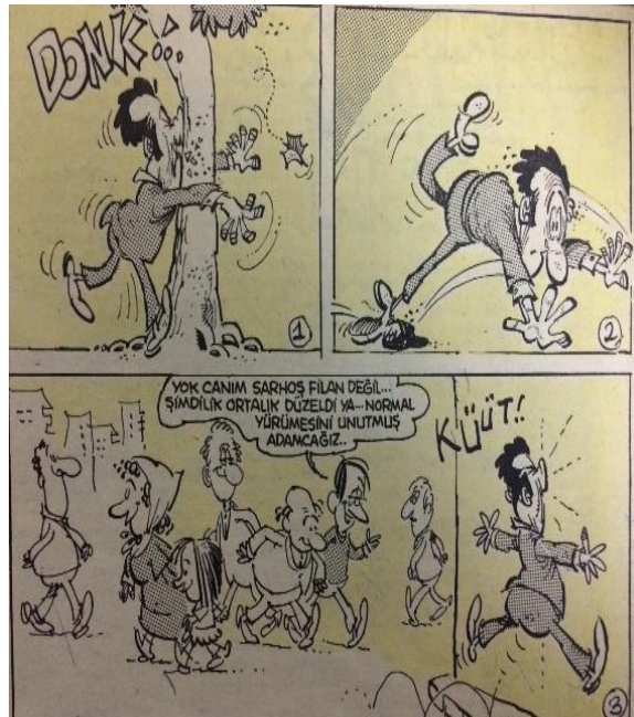
Resim 4.81. Gırgır/21.09.1980

Terör olayları her alanı olduğu gibi eğitim hayatını da etkilemiş özellikle üniversite eğitimi devam eden çok sayıda kişi eğitimini yarıda bırakmak zorunda kalmıştır. Gırgır'da çocuklarını okula yazdırmak isteyen çift görülmektedir. Ancak darbe öncesi yaşanan terör olayları nedeniyle çocuk okula gidememiş yaşı ilkokula yazılmak için ilerlemiştir. Karikatür şiddetin bittiğini eğitim hayatının da normale dönmeye başladığını gösterir niteliktedir.