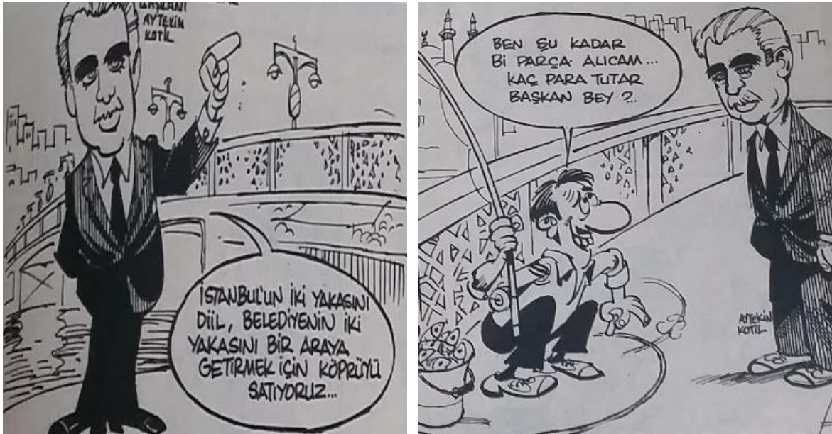
Resim 4.61. Çarşaf/10.09.1980