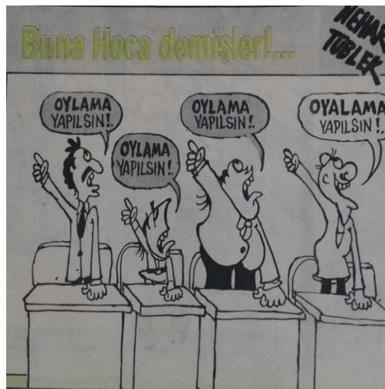
Resim 4.12. Çarşaf/10.09.1980

Çarşaf'ın, ilk karikatüründe (Resim 4.24.) Demirel ekonomi politikaları ile ilgili açıklamalar yaptığı sırada Erbakan'ın Demirel hükümetini düşürmeye çabaladığı görülmektedir. Aşağıda yer alan ikinci karikatürde ( Resim 4.25. ) ise diğer liderler mecliste alınan kararlarla ilgili oylama yapılmasını isterken Erbakan, “oyalama” yapılmasını istemektedir. Karikatürde kelime oyunu yapılarak Erbakan'ın siyasi iktidarsızlığa yol açan bir politika izlediği aktarılmak istenmiştir.