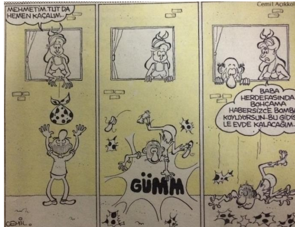
Resim 4.79. Gırgır/28.09.1980

TRT’de 12 Eylül günü darbe bildirisinden sonra okunan Hasan Mutlucan’a ait Kahramanlık Türküleri albümünden "Yine de Şahlanıyor" türküsü çalınmıştır. Darbe ile özdeşleştirilen türkü TRT’te de çok sık çalınmış bir propaganda aracı gibi kullanılmış kitlelerin milli duygularına hitap edilmek istenmiştir. Karikatür, bir yandan “kurtuluş” temasını ön plana çıkarmış bir yandan da türkünün çok sık tekrarlanmasının kişiler üzerinde yarattığı etki yansıtmıştır.