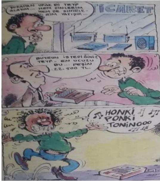
Resim 4.40. Çarşaf/10.09.1980