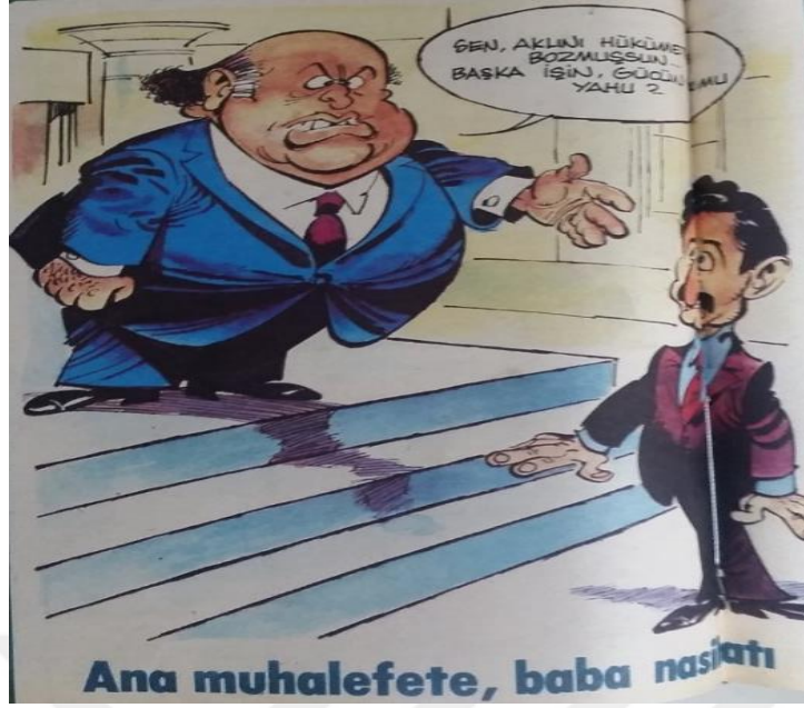
Resim 4.21. Çarşaf/10.09.1980

Demirel ile Ecevit ilişkisini bir karşılaştırma şeklinde veren karikatürde muhalefet partisinin muhalefet yapmasını sorgulayan Demirel, siyasi uzlaşmazlığın temel figürü olarak konumlandırılmıştır. Demirel'in Ecevit'e "Başka işin gücün yok mu?" diye sormasına karşın Ecevit'in cevap vermemesi mesajın okur tarafından tamamlanmasını sağlamaktadır.