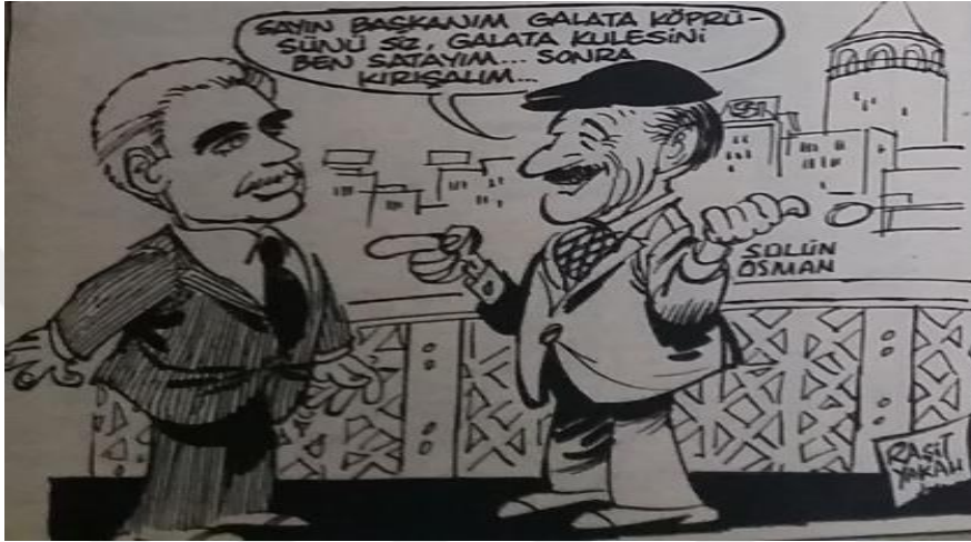
Resim 4.62. Çarşaf/10.09.1980