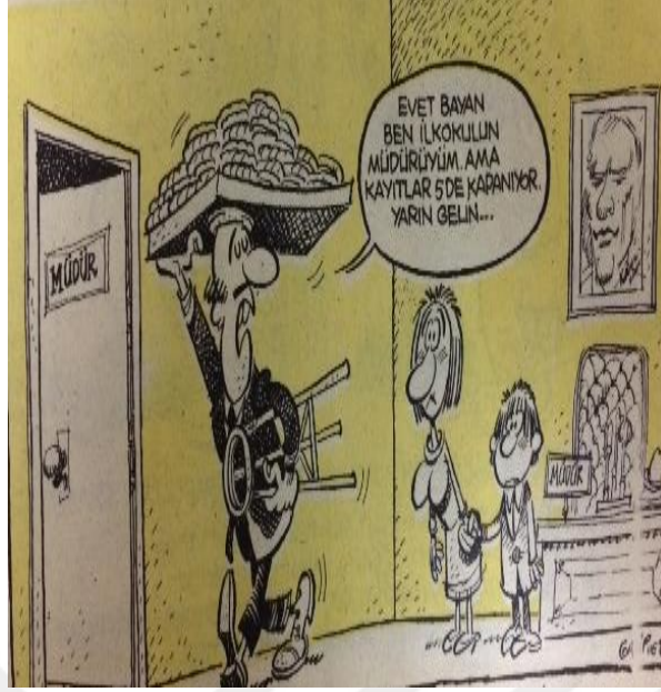
Resim 4.60. Gırgır/14.09.1980

Gırgır, sadece öğrencilerin değil orta sınıfın bir kesimi olan öğretmenlerin de ekonomik sıkıntılarını karikatürlerinde yer vermiştir. Karikatür, okul mesaisi bittiğinde simit satmaya giden bir öğretmeni ele alarak toplum tarafından saygın bir meslek olarak kabul edilen öğretmenlik mesleğinin ekonomik şartlarını ortaya koymaktadır.