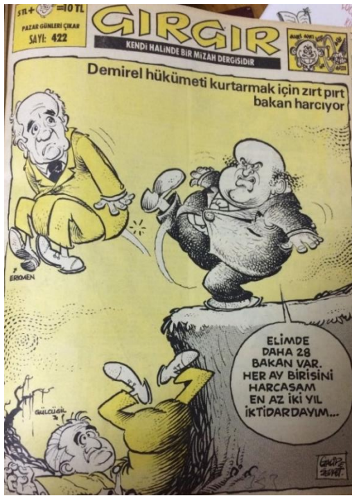
Resim 4.1. Gırgır/07.09.1980

Gırgır ve Çarşaf dergilerinde siyasi aktörler güncel siyasi gelişmeler çerçevesinde ele alınmış, iktidar ve muhalefet partileri ve liderleri öne çıkarılmıştır. Dergilerde, siyasete ve siyasetçiye ilişkin tanımlamaları “siyasi uzlaşmazlık, siyasi yetersizlik, siyasi hırs” kavramları oluşturmaktadır.