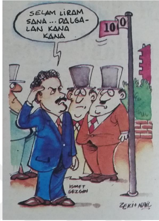
Resim 4.42. Çarşaf/10.09.1980