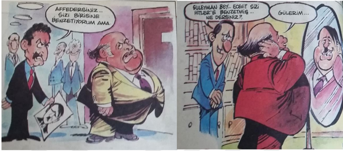
Resim 4.16. Çarşaf/03.09.1980

“Kim kime benziyor” başlığı ile verilen karikatürde, Ecevit’in Demirel’i Hitler’e benzetmesi konu edilmiştir. Ecevit’e gülerak karşılık veren Demirel, aynaya baktığında kendisinin Hitler’e benzediğini görmektedir. Karikatürde bir yandan siyasi uzlaşmazlık teması ön planda tutulurken diğer yandan da Ecevit’in söylemlerinin gerçeği yansıttığı izlenimi çıkmaktadır.