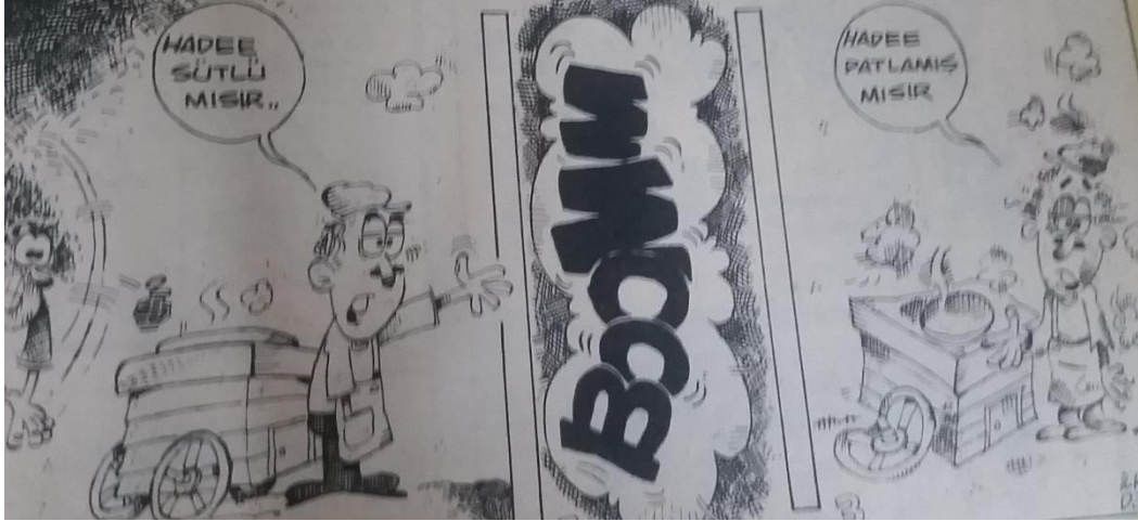
Resim 4.66. Çarşaf/10.09.1980

Çarşaf'ta bomba patlamadan önce "sütlü" mısır satan mısır satıcısının bomba patladıktan sonra "patlamış" mısır satmaya başladığı görülmektedir. Bombadan sonra günlük hayatına hemen devam eden mısır satıcısı ile sık sık yaşanan patlamaların toplum tarafından bir şekilde kanıksandığı izlenimi yaratılmaktadır.