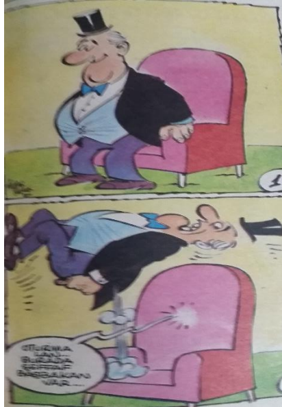
Resim 4.6. Çarşaf/10.09.1980

Çarşaf'ta yer alan “Demirel’in atış takvimi” yazısıyla verilen karikatürde Süleyman Demirel’in dönem itibariyle çok sık katıldığı temel atma törenleri konu edinilmiştir. Karikatürde Demirel, kendi makam koltuğunun temel atma törenini gerçekleştirmektedir. Karikatürde Demirel makam koltuğu ile özdeşleştirilmiş, Demirel’in ülke gündeminden çok siyasi makam kaygılarıyla meşgul olduğu aktarılmıştır.