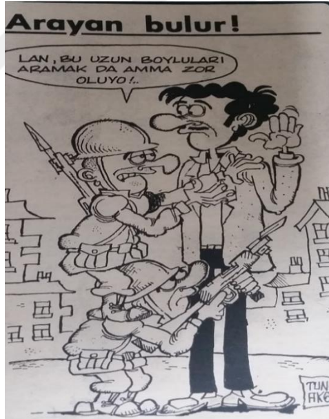
Resim 4.70. Çarşaf/03.09.1980

Karikatür, darbe öncesi sıkıyönetim uygulamaları kapsamında sık sık yaşanan üst aramalarını yansıtmaktadır. Üst aramalarının gündelik hayat pratikleri arasına girdiğini aktaran derginin cezaevi koşulları veya işkence temalarına değinmediği görülmektedir. Çarşaf asker ve polisi tamamen eleştirinin dışında tutmamış fakat şiddet teması içinde de ele almamıştır.