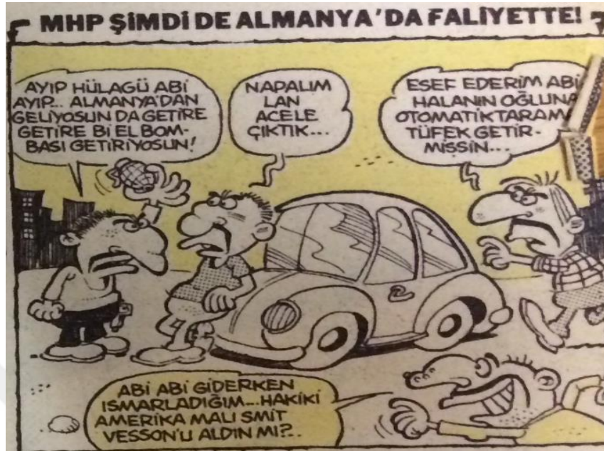
Resim 4.74. Gırgır/14.09.1980