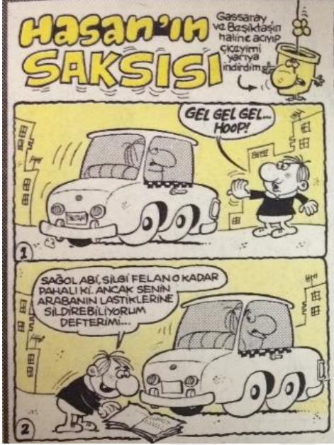
Resim 4.50. Gırgır/14.09.1980

maddi sıkıntıları göze aldıklarının anlatıldığı karikatürde, aynı zamanda okul masraflarına karşı da bir eleştiri vardır.