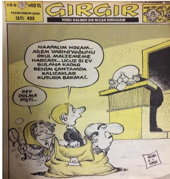
Resim 4.49. Gırgır/14.09.1980

Gırgır'da yer alan karikatürde tahtaya kalkan öğrenci hariç hiç kimse önlüklü değildir. Pahalı olduğu için önlük alamayan öğrencilerini derste uyaran öğretmen, tek önlük giyen öğrenciyi örnek olsun diye tahtaya kaldırmıştır. Öğrenci arkasını döndüğünde önlüğün ona küçük geldiği için arkasının tamamen açık olduğu görülür. Çarşaf'ta ise yine önlük alamayıp annesinin mutfak önlüğü ile okula gelen öğrenci resmedilmektedir. İki karikatürde ekonomik sıkıntılar öğrenciler üzerinden işlenmiştir.