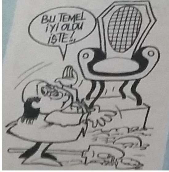
Resim 4.5. Çarşaf/03.09.1980

Çarşaf'ta yer alan “Demirel’in atış takvimi” yazısıyla verilen karikatürde Süleyman Demirel’in dönem itibariyle çok sık katıldığı temel atma törenleri konu edinilmiştir. Karikatürde Demirel, kendi makam koltuğunun temel atma törenini gerçekleştirmektedir. Karikatürde Demirel makam koltuğu ile özdeşleştirilmiş, Demirel’in ülke gündeminden çok siyasi makam kaygılarıyla meşgul olduğu aktarılmıştır.