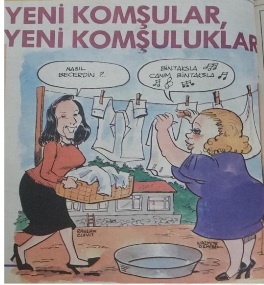
Resim 4.87. Çarşaf/24.09.1980