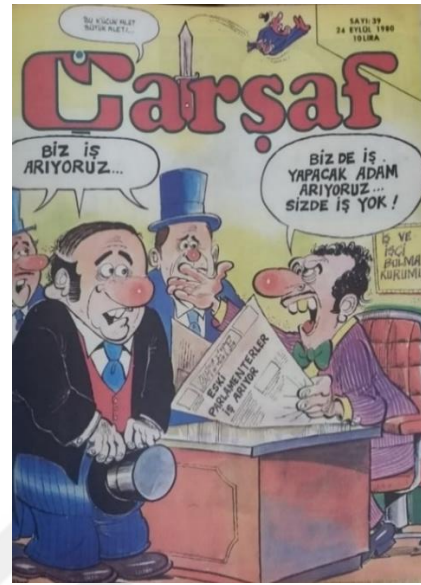
Resim 4.84. Çarşaf/24.09.1980

Darbe sonrası siyasilerin sosyal hayatını ele alan karikatürlerde mizah, konumları itibariyle her zaman ciddiyetlerini koruyan siyasileri sıradan bireyler gibi göstererek sağlanmıştır. Siyasilere karşı alay onların toplumdaki imajlarına zarar vermeye yöneliktir.