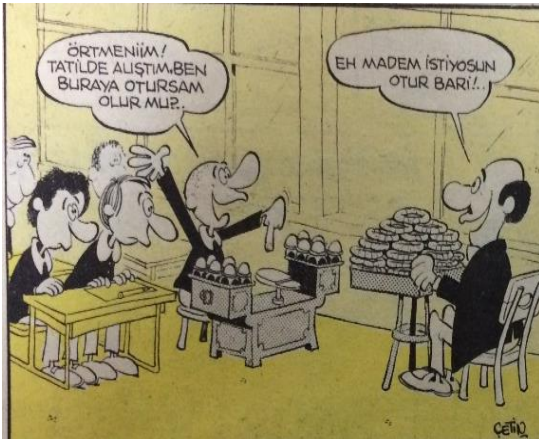
Resim 4.52. Gırgır/21.09.1980

Okulların eylül ayında açılmasıyla birlikte dar gelirli ailelerin çocuklarının eğitim giderleri dergilerin birinci gündem maddesini oluşturmaktadır. Ele alınan her iki dergide de ekonomi temalı karikatürlerin büyük çoğunluğu bu nedenle eğitim masrafları üzerinedir.