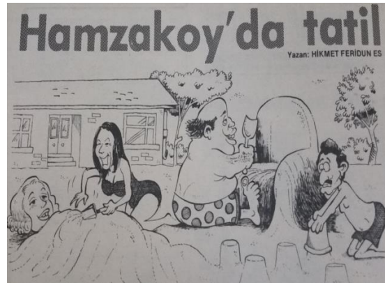
Resim 4.89. Çarşaf/24.09.1980