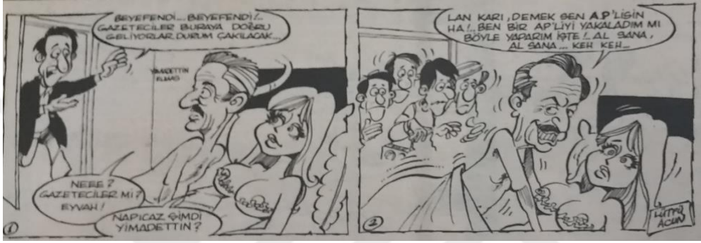
Resim 4.4. Çarşaf/10.09.1980

Gırgır'daki karikatürün “Gırgır Politikayla Uğraşmaz Politikacıyla Uğraşır” sloganını tam anlamıyla yansıttığı görülmektedir. Dönemin Sağlık Bakanı Münif İslamoğlu tarafından sağlık personeline tamgün yasası için verilen maaşların vergi yolu ile geri alınacağına açıklanmasına tepkilerin aktarıldığı karikatürde, Bakan İslamoğlu, sağlık personeli tarafından köşeye sıkıştırılmış ve korkmuş resmedilmiştir. Mizahın protesto işlevinin ortaya çıktığı karikatür, yönetilenin yöneten karşısında söz sahibi olmasının, hak arama isteğinin bir örneğini oluşturmaktadır.