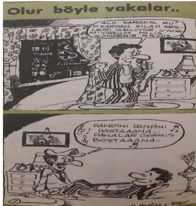
Resim 4.72. Çarşaf/10.09.1980