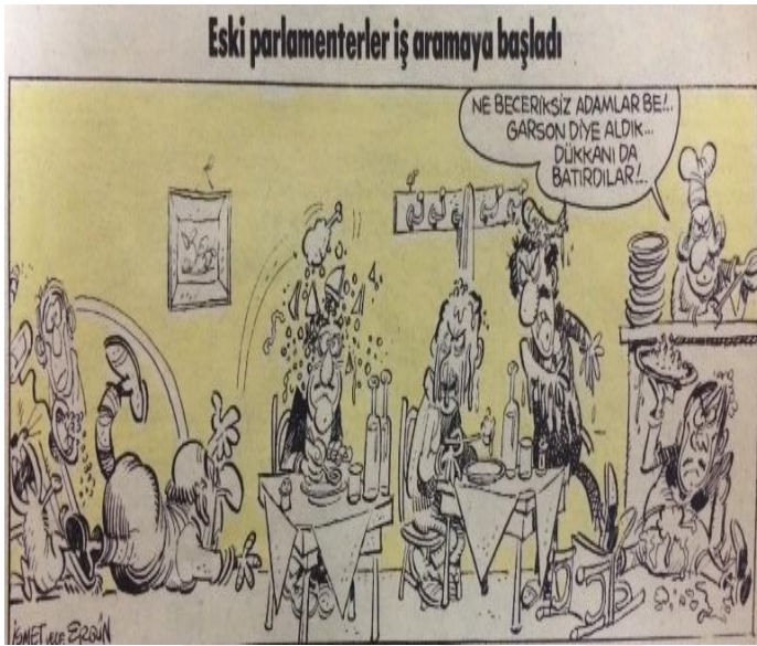
Resim 4.83. Gırgır/21.09.1980