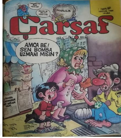
Resim 4.65. Çarşaf/10.09.1980