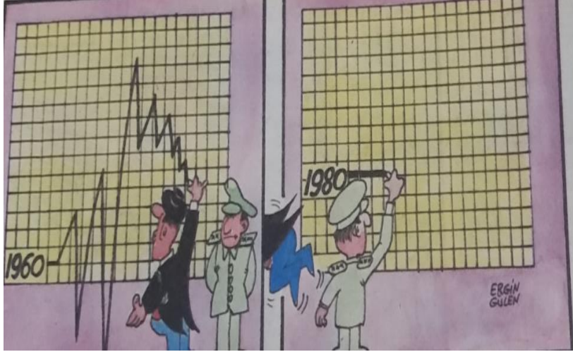
Resim 4.26. Çarşaf/24.09.1980

Çarşaf, 1960'tan 1980'e kadar "siyasi iktidarsızlığı" çizgi grafiğe benzer bir görselle göstermektedir. Grafiğin başladığı 1960 yılı düz bir çizgiyle başlarken daha sonraki yıllarda dalgalanmalar görülmektedir. Karikatürün devamında asker, kalemi eline alarak 1980 yılından itibaren dümdüz bir çizgi çizer. Her darbe sonrası askerin gidişatı düzelttiği mesajı açık bir şekilde verilmektedir. Çarşaf ve Gırgır'ın askeri darbe karşısındaki tutumunun benzerlik göstermediği söylenebilir. Karikatüristin, potansiyel okurun eğitim düzeyine bağlı olarak simge ve işaret kullandığı bilgisi göz önüne alındığında Gırgır'ın daha örtük, Çarşaf'ın ise daha açık simgeler kullandığı iki derginin söylemlerinin yine aynı ölçüde değiştiği söylenebilir.