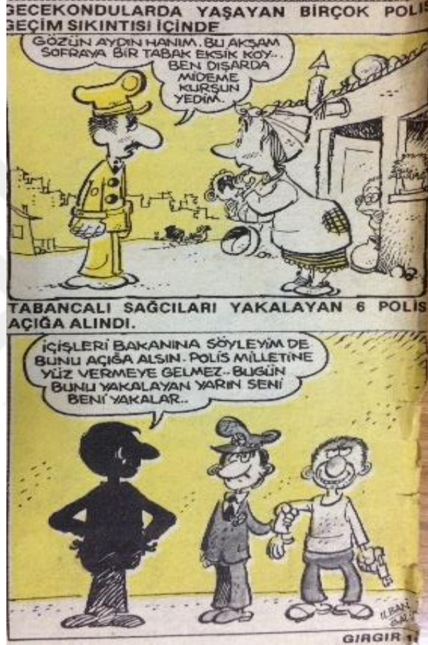
Resim 4.73. Gırgır/14.09.1980