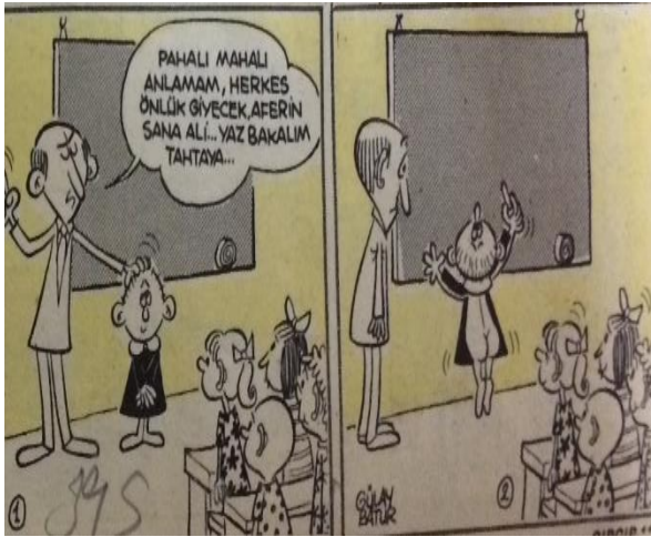
R Resim 4.47. Gırgır/28.09.1980