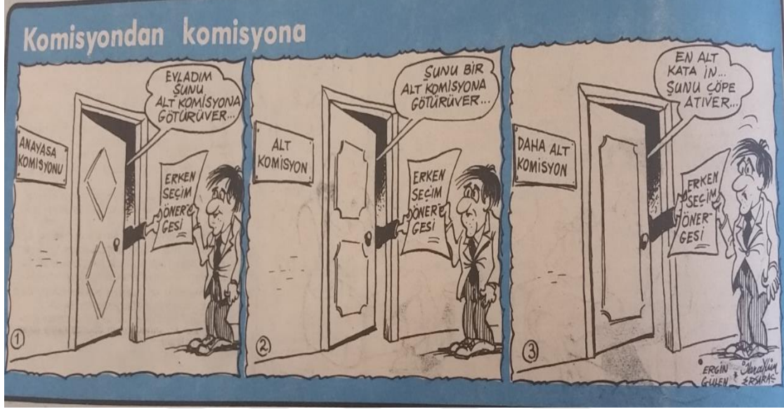
Resim 4.19. Çarşaf/03.09.1980

gidiyordu...” Karikatür, bir taraftan Cumhurbaşkanlığı seçimlerinin bir türlü gerçekleşmemesine vurgu yaparken bir taratanda ekonomik kaygıları ortaya koymaktadır.