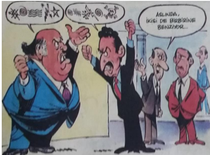
Resim 4.17. Çarşaf/03.09.1980

“Kim kime benziyor” başlığı ile verilen karikatürde, Ecevit’in Demirel’i Hitler’e benzetmesi konu edilmiştir. Ecevit’e gülerak karşılık veren Demirel, aynaya baktığında kendisinin Hitler’e benzediğini görmektedir. Karikatürde bir yandan siyasi uzlaşmazlık teması ön planda tutulurken diğer yandan da Ecevit’in söylemlerinin gerçeği yansıttığı izlenimi çıkmaktadır.