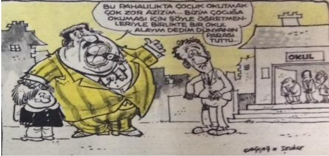
Resim 4.45. Gırgır/28.09.1980