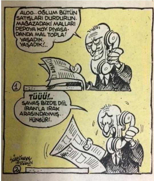
Resim 4.43. Gırgır/28.09.1980