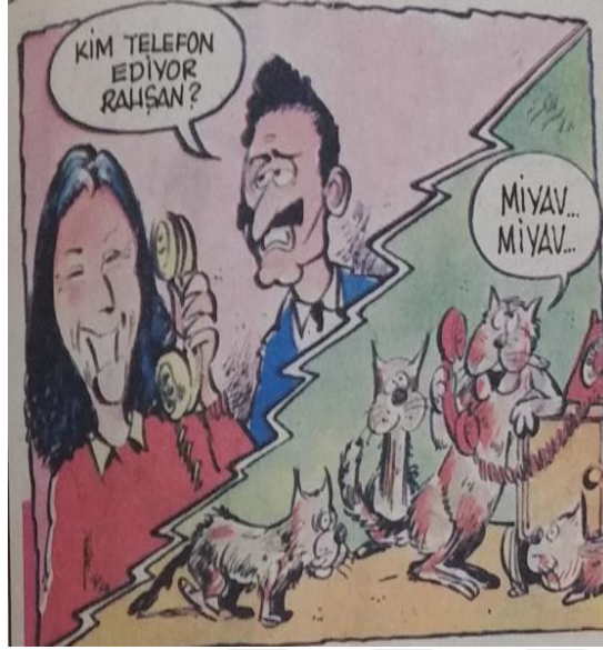
Resim 4.86. Çarşaf/24.09.1980

Darbe sonrası siyasi mizah yoğunluklu olarak yasaklı liderler üzerinden ilerlemiştir. Askerin yönetime el koyması ve sonrasında yaşanan gelişmeler olumlu ve sınırlı biçimde işlenmiştir. 12 Eylül, öncesi siyasi gelişmeleri her iki dergiden de takip edebilmek mümkünken 12 Eylül sonrası siyasi gelişmelerle ilgili çok az bilgiye yer verilmiştir.