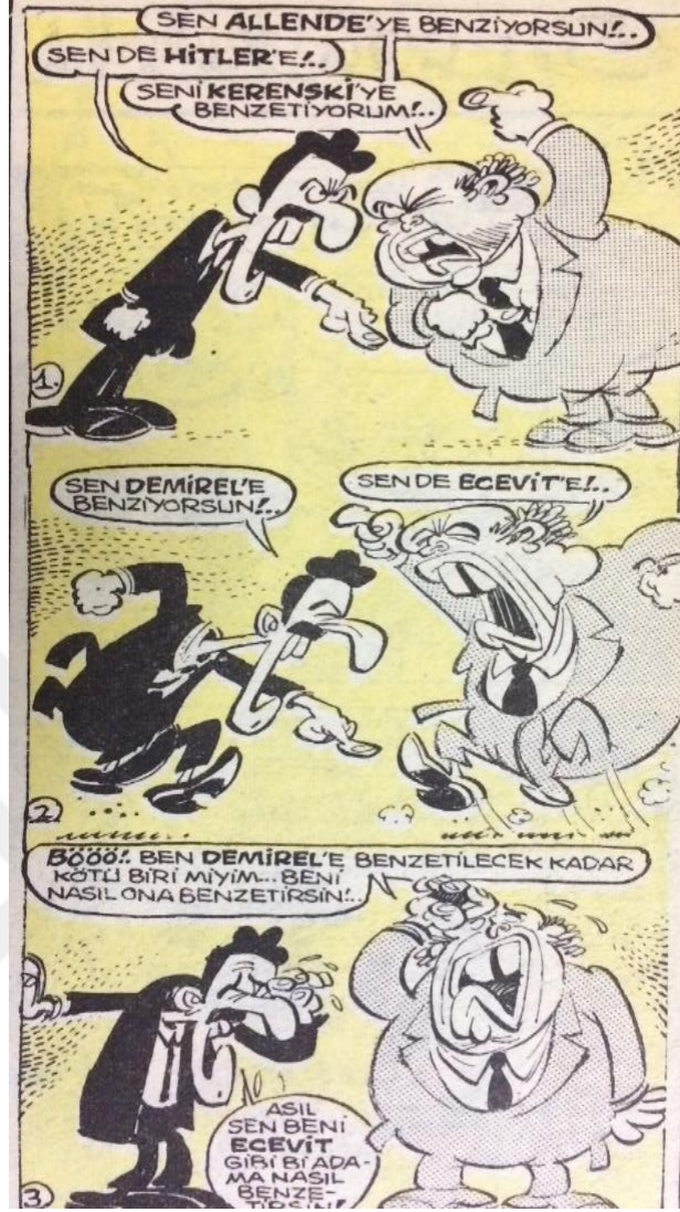
Resim 4.30. Gırgır/07.09.1980

İsim takma başlığı ile verilen karikatürde iki kişi birbirlerini farklı ideolojik fikirlere sahip siyasi liderlere benzeterek tartışmaktadır. Karakterlerin birbirlerini sol görüşlü Rus siyaset adamı Kerenski'ye, Marksist devlet başkanı Şiilili demokrat lider Allende'ye, yirminci yüzyılın en büyük diktatörü olarak bilinen Alman siyasi lider Hitler'e benzediği görülmektedir. Birbirlerini Demirel ve Ecevit'e benzetmeye başladıklarında ise kızgınlıkları bir anda hüzne dönüşür. Demirel ve Ecevit'e benzetilmeyi Allende, Hitler veya Kerenski'ye benzetilmekten çok daha kötü bir şey olarak algılayan karikatür karakterleri ağlamaya başlar. Derginin 12 Eylül öncesi siyasi aktörleri sert bir üslupla yansıttığı görülmektedir.