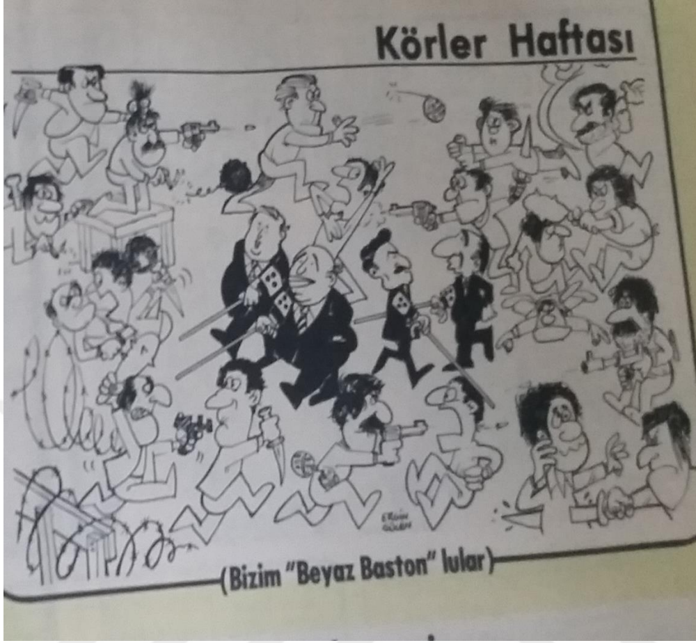
Resim 4.15. Çarşaf/10.09.1980

Dönem itibariyle siyasi şiddet olayları artmış ve başta büyük şehirler olmak üzere tüm illeri kuşatmıştır. Karikatür, ülkenin en önemli sorunu şiddete karşı tüm siyasi liderlerin adeta kör olduklarını göstermektedir. Sıkıyönetim ilan edilmesine rağmen asker, karikatüre dâhil edilmemiştir. Şiddetin engellenememesi askeri yetersizlikle ya da askerin yetkilerini kullanıp kullanmadığı gibi sorgularlar açıklanmamış, ülkenin durumu sadece siyasilerin umursamazlığına bağlanmıştır. Şiddeti engellemede askerin, görevi, rolü gibi sorgulamalar yapılmamıştır.