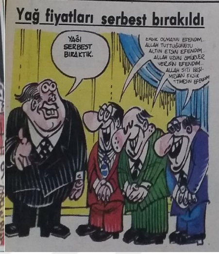
Resim 4.35. Çarşaf/10.09. 1980