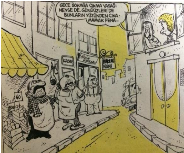
Resim 4.38. Gırgır/28.09.1980

Çarşaf'ta esnaf ekonomik sıkıntıları anlatmada araç olarak kullanılmıştır. Her iki karikatürde de ekonomik sıkıntıların nedenlerine inilmeden sonuçları mahalleli ve esnaf gerginliği üzerinden aktarılmış esnaf ekonomik mağduriyetin dışında tutulmuştur. Çarşaf'taki ilk ( Resim 4.51. ) karikatürde “Geçim sıkıntınız var mı?” sorusuna esnaf “Eh işte... Geçirip gidiyoruz” cevabını vermiş bu anlamsal çarpıklık mizah unsuru olmuştur. Karikatürde esnafın hem görsel olarak hem de söylem olarak sunumu ekonomik sıkıntılardan uzak bir portre çizmektedir. İkinci karikatürde( Resim 4.56. ) bira içen karakter parayı ödediğinde bira fiyatlarını arttığını ve daha fazla para ödemesi gerektiğini duyunca içtiği birayı kendi yöntemleriyle geri ödemeye çalışmaktadır. Karikatürde komik öge durumun tersine çevrilmesi ile gerçekleşmiştir.