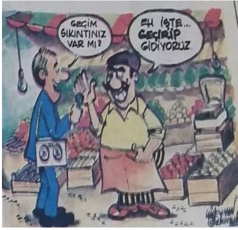
Resim 4.36. Çarşaf/03.09.1980