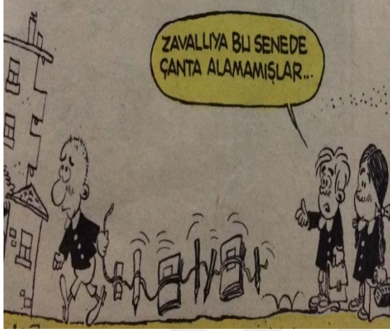
Resim 4.54. Gırgır/21.09.1980

sınıf geme sistemine atıfta bulunarak yine ekonomik kořullar gz nne serilmek istenmiřtir. Hoca ve ğrencinin ekonomik sıkıntıları verilirken aık mesajlar kullanılmakla birlikte karikatrlerde bu durumun nedenlerine dair aık veya rtk bir mesaj bulunmamaktadır.