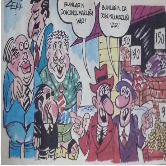
Resim 4.34. Çarşaf/10.09. 1980