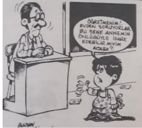
Resim 4.48. Çarşaf/24.09.1980

Gırgır'da yer alan karikatürde tahtaya kalkan öğrenci hariç hiç kimse önlüklü değildir. Pahalı olduğu için önlük alamayan öğrencilerini derste uyaran öğretmen, tek önlük giyen öğrenciyi örnek olsun diye tahtaya kaldırmıştır. Öğrenci arkasını döndüğünde önlüğün ona küçük geldiği için arkasının tamamen açık olduğu görülür. Çarşaf'ta ise yine önlük alamayıp annesinin mutfak önlüğü ile okula gelen öğrenci resmedilmektedir. İki karikatürde ekonomik sıkıntılar öğrenciler üzerinden işlenmiştir.