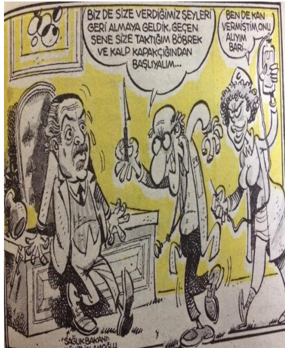
Resim 4.3. Gırgır/07.09.1980

Çarşaf'ın, ise kapağında politik kutuplaşmaların halkta yarattığı ironik durumu çizimlerine yansıttığı görülmektedir. Karikatür çatışmacı siyasi söylemlerin birey üzerinde yarattığı tahribatı ele almaktadır. Siyasi liderlerin birbirleri arasındaki çatışma ve topluma sundukları olumsuz hayat şartlarına karşı "sokaktaki adam"ın ruh hali ortaya konulmuştur.