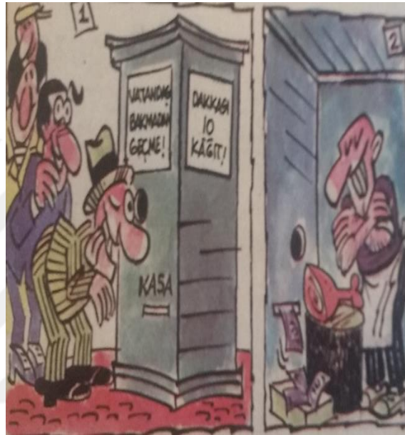
Resim 4.41. Çarşaf/03.09.1980