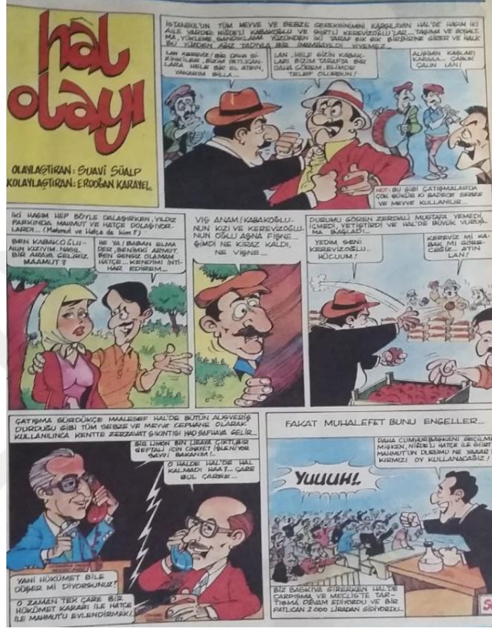
Resim 4.18. Çarşaf/03.09.1980

Karikatürün devamında “ kim kime benziyor” sorunsalı Ecevit ve Demirel’in tartışmalarını izleyen vatandaşın yorumu ile cevaplandırılmıştır. Karikatürde iki liderin birbirlerine karşı demokrasinin özünde yatan uzlaşma kültüründen yoksun tutumu eleştirilmiştir.