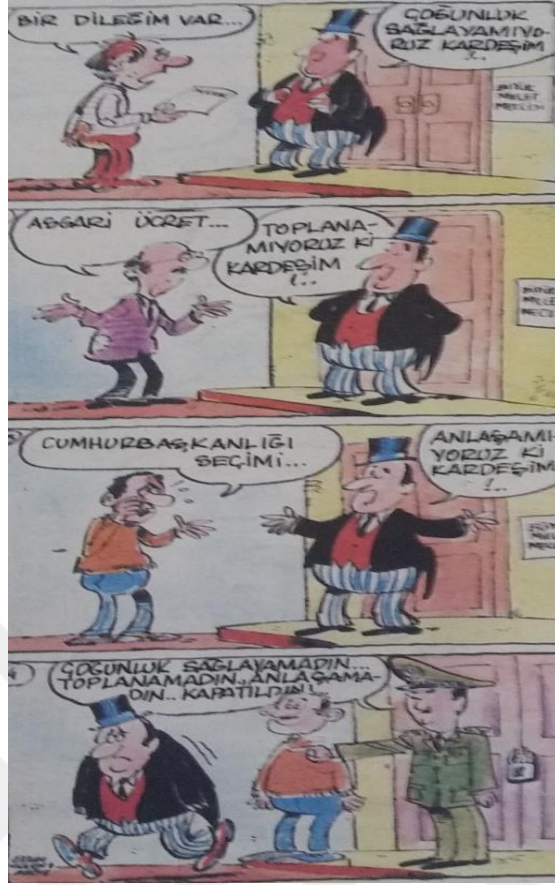
Resim 4.25. Çarşaf/24.09.1980

Çarşaf'taki bu karikatürde mesaj yazıdan çok çizgilerde verilmiştir. Ekonomik ve siyasi beklentilerini belirten vatandaşa umursamaz bir tutumla toplanamadıklarını, anlamadıklarını söyleyen vekil görülmektedir. Siyasi uzlaşmazlıkların darbenin tek gerekçesi olarak gösterildiği bant karikatürün son karesinde görülen asker – vekil – vatandaş üçlemesi ile darbe sonrası durum özetlenmektedir. Son aşamada yüzündeki gururla duruma müdahale eden asker ve bu durumu memnuniyetle karşılayan vatandaşın karşısında omuzları düşük, çaresiz bir şekilde koşar adım uzaklaşan siyasetçi figürü görülmektedir.