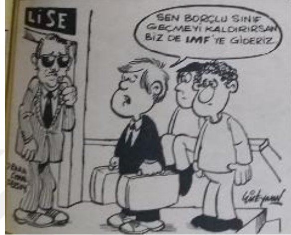
Resim 4.55. arřaf/03.09.1980

Gırgır'daki karikatr eđitim masrafları aileleri tarafından karřılanamayan ğrencilerin neler yařadığını anlatmaktadır. Okul antası olmayan ocuđun yz ifadesi karikatrn yazısından daha gl bir mesaj tařımaktadır. arřaf'ta ise 24 Ocak kararlarının uygulanması ile bařlayan IMF – Trkiye iliřkilerine gnderme yapılmakta Stand By antlařması ile IMF'den alınan krediler anlatılmaktadır. Bu karikatr ekonomik sıkıntıları IMF ile iliřkilendirerek okuru sorgulamaya gtrmektedir.