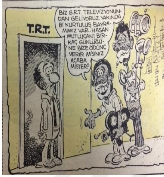
Resim 4.78. Gırgır/21.09.1980