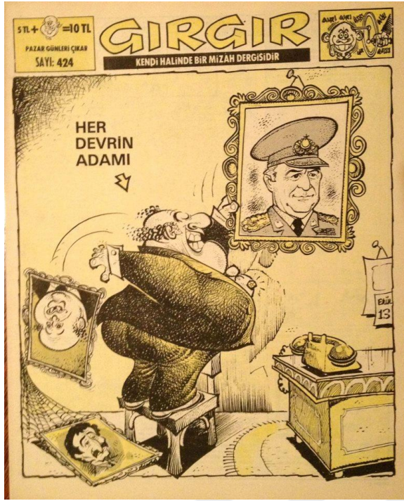
Resim 4.75. Gırgır/21.09.1980