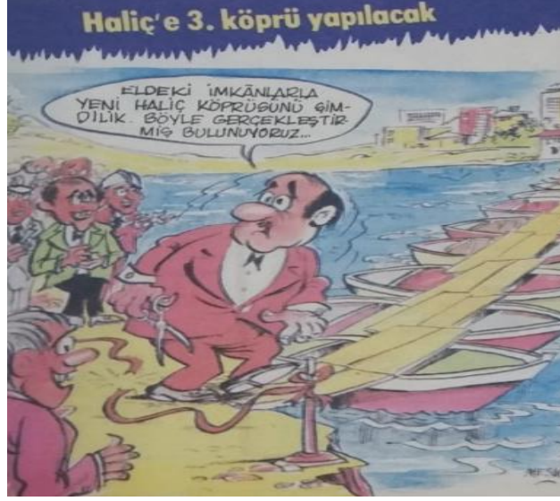
Resim 4.63. Çarşaf/24.09.1980

Çarşaf, darbe sonrası İstanbul Belediye'si tarafından Haliç'te yapılması planlanan köprü ile ilgili haberleri karikatürüne konu etmiştir. Karikatürde kayıkların bir araya getirilmesi ile oluşturulan köprünün açılışının yapıldığı görülmektedir. Kurdele ile açılışı yapılan kişinin kim olduğu anlaşılmamaktadır.