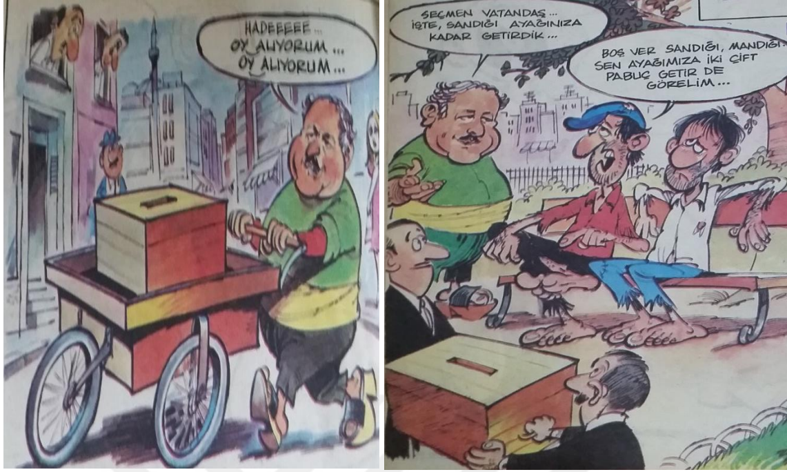
Resim 4.32. Çarşaf/03.09.1980

Dönem itibariyle Erbakan'ı ve onun politik söylemlerini benimseyenler için "takunyalılar" ifadesi kullanılmaktadır. "Takunya" başlı başına bir kimlik bildirimini kabul edilmiş, bu simgeden yola çıkılarak "takunyalı siyaset" ve "takunyalı bürokrasi" gibi kavramlar ortaya çıkmıştır. Ele alınan dönemde Çarşaf'ta çıkan tüm Erbakan figürleri takunyalı olarak çizmiştir.