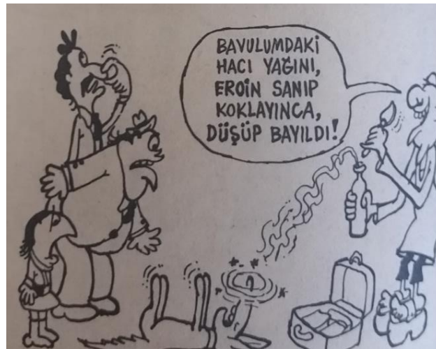
Resim 4.8. Çarşaf/03.09.1980

Karikatürde Ecevit'in şeffaflık açıklaması ele alınarak konuya geçim sıkıntısı nedeniyle bir deri bir kemiğe dönen vatandaş üzerinden bakılmıştır. Çarşaf siyasi gündemi konu edindiği karikatürlerinde toplumun durum karşısında "ne düşündüğü, hangi kaygıları taşıdığı" gibi soruları cevaplandırmayı amaçlamıştır. Karikatür vatandaşın gündemi ile siyasilerin gündemi arasındaki farkı ortaya koymakla beraber toplumun yaşadığı sıkıntıların siyasiler tarafından fark edilmediğini göstermektedir.