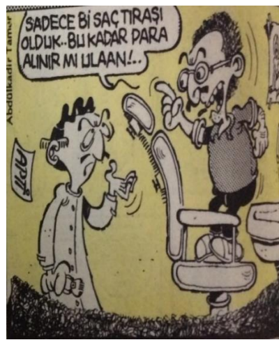
Resim 4.39. Gırgır/07.09.1980