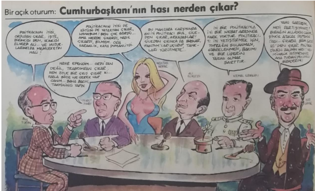
Resim 4.23. Çarşaf/10.09.1980