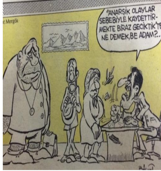
Resim 4.80. Gırgır/28.09.1980

Terör olayları her alanı olduğu gibi eğitim hayatını da etkilemiş özellikle üniversite eğitimi devam eden çok sayıda kişi eğitimini yarıda bırakmak zorunda kalmıştır. Gırgır'da çocuklarını okula yazdırmak isteyen çift görülmektedir. Ancak darbe öncesi yaşanan terör olayları nedeniyle çocuk okula gidememiş yaşı ilkokula yazılmak için ilerlemiştir. Karikatür şiddetin bittiğini eğitim hayatının da normale dönmeye başladığını gösterir niteliktedir.