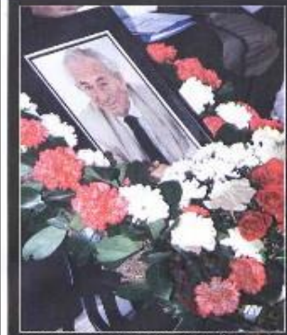
Mag DABA da vardı. Abi yıldı qırmızısız staklere, ama dıñlı- la mıñlıy, anıñ köñöl kuyumadı. Anıñ qıñ Tazıy, öñe...