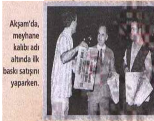
Akşam'da, meyhane kalıbrı adı altında ilk baskı satışını yaparken.