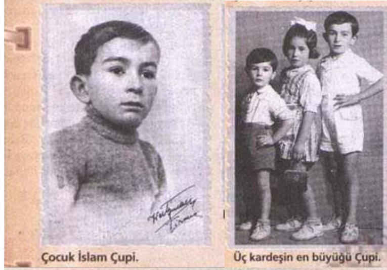
Çocuk İslam Çupi.