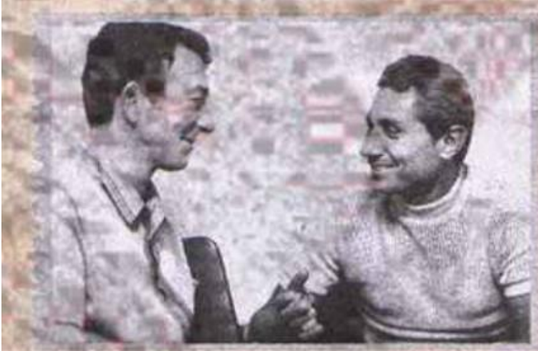
Bir zamanların efsane futbolcusu Lefter'le.