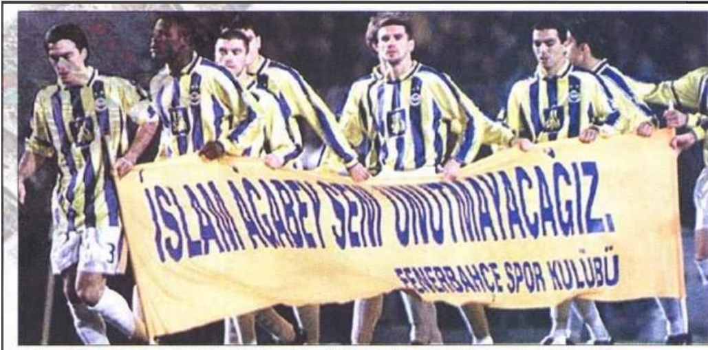
O, Fenerbahçe'ye ağıttı... Sarı - Lacivertiler de sahaya çıktıkları pankartla, bu sevgiye en güzel yanıtı verdiler...