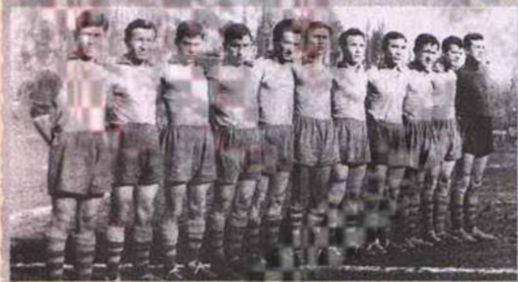
İstanbul mahalli ligi Çapa futbol takımında.

23.04.200,Gazete Pazar, Sayfa 14,Özel Tarih