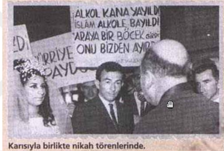
Karıyla birlikte nikah törenlerinde.