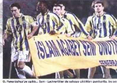
O, Fenerbahçe'ye ağıttı... Sarı - Lacivertiler de sahaya çıktıkları pankartla, bu sevgiye en güzel yanıtı verdiler...

İslam Çupri'ye hak ettiği saygı gösterildi