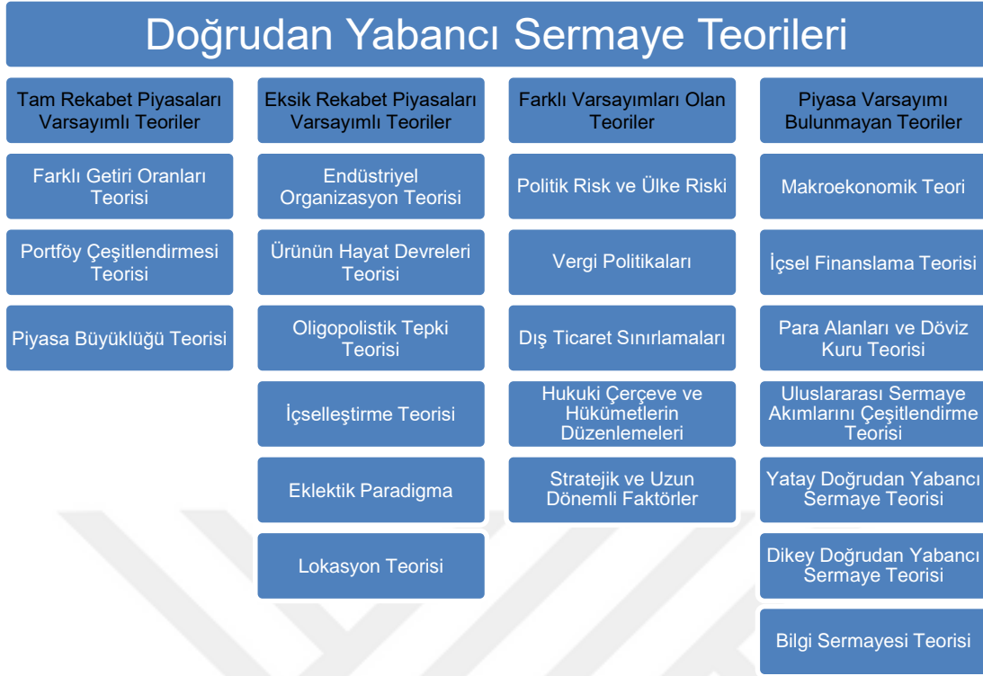
Şekil 2.1. Doğrudan Yabancı Sermaye Teorilerinin Sınıflandırılması

Kaynak: Foreign Direct Investment Theory, Evidence and Practice, Imad A. Moosa, Palgrave, 2002.