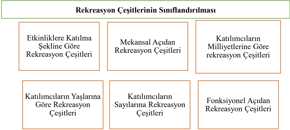
Şekil 2.1. Rekreasyon Çeşitlerinin Sınıflandırılması (Hazar 2009,30)

Rekreasyon faaliyetleri birçok farklı yönü ele alınarak sınıflandırılabilir. Mekâna, zamana, eylem çeşidine, yapılış şekline göre, bireysel, fiziksel, mental, tedavi edici amaçlarına göre sınıflandırma yapılabilir (Ardahan ve Ark.2016: 26).