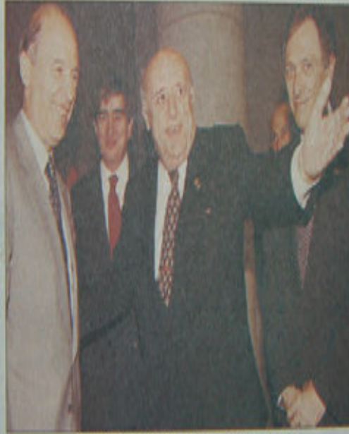
Siyasi istikrar, Yunanistan'ın tavrını belirledi

Yunanistan'ın uzlaşma tavrı Türkiye'deki siyasi istikrar havasına bağlanırken, Cumhurbaşkanı Demirel ve Yunan Başbakan Simitis, "Sera ismiht adimlarda" mesaj verdiler. Dışişleri Bakanı Cem ve Müsteşar Öymenin görüşmelerdeki etkili performansları dikkati çekti.