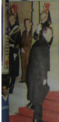
Montaşma Paris'te Başbakan Mesut Yılmaz, Cumhurbaşkanı Süleyman Demirel ve Paris Başbakan Mikhael Doustla ile görüşüyor. 'Bu konuşma önemli' dedi. Yılmaz, önceki gün Başbakanın Paris'te görüşmelerini böyle tanımladı.

Başbakan Yılmaz'dan, Yunanistan'la ilişkilerde sürpriz detant politikası: 'Ege Ordusu kaldırılabilir...'