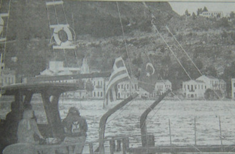
BİR KAYALIK DAHA SORUN YARATTIYOR - Ege denizinin doğusunda yer alan Kastellorizo adlı küçük adacığın, İkizce'den sonra Yunanistan ve Türkiye'nin arasında yeni bir krize neden olmasının korkuluyor. 200 kişinin yaşadığı Kastellorizo'nun açıklarından geçen Türk bavyraklı bir yatta bulunan yabancı gazeteciler, iki ülkeyi savaşın eşiğine getiren soruları yerinde izlemeye cabalıyor.

rapora yer alıyor. Atina'daki bu diplomatik çevrelere göre Balkanlarda münafık arayış içinde olan Yunanistan'ın bu arayışa geçirmek istediği Balkan paketi. Avrupa Birliği ile ilişkilerin düzeltilmesi. Askara girme ve geçme yollarında Türkiye ile eşit düzeyde gelme. Suriye, Irak, İran, Bulgaristan, Rusya, Ermenistan ile ilişkilerin daha da geliştirilmesi. Güney Kıbrıs Rum yönetiminin sadetini önlemek için Yunanistanın söz konusu edilen "iki yıl süre ile sorunların çözümünü" formülünün içinde yer alıyor.