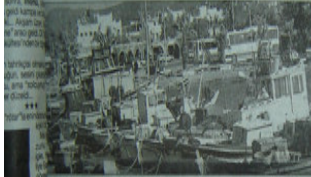
Balkan'da Kardak Reyecani - Bodrum ve çevresinde oturan yarıtatarlar, Kardak kızılların yönettiği bir ülkeye atıldığına inanıyorlar. Bölgedeki bu barutlu ortamın etkisiyle de dün göç planlıyorlar.

► Dışişleri Bakanı Deniz Baykal, Türkiye ve Yunanistan arasında ortaya çıkan Kardak bölgesinin ardında, bölgede hâlâ "sıcaklık ve yoğun gerginlik hâli" olduğunu dikkat çekerek Yunanistan'a, durumu normalleştirilince yolunda geyrek göstermeye çağırarak Dışişleri Bakanı Onur Öymen ile Yunanistan'ın, Türkiye'ye çıkarlarına zarar verici bazı girişimler yapmasına ilişkin bilgiler alındıktan sonrasında bulundu. Başbakanlık Konferansı'nda dün yapılan toplantıda, Çiller'in "serisi" olarak ifade edilen Yunanistan'ın yaklaşımı hakkında Yunanistan arasında taharütler yaratmıştı.