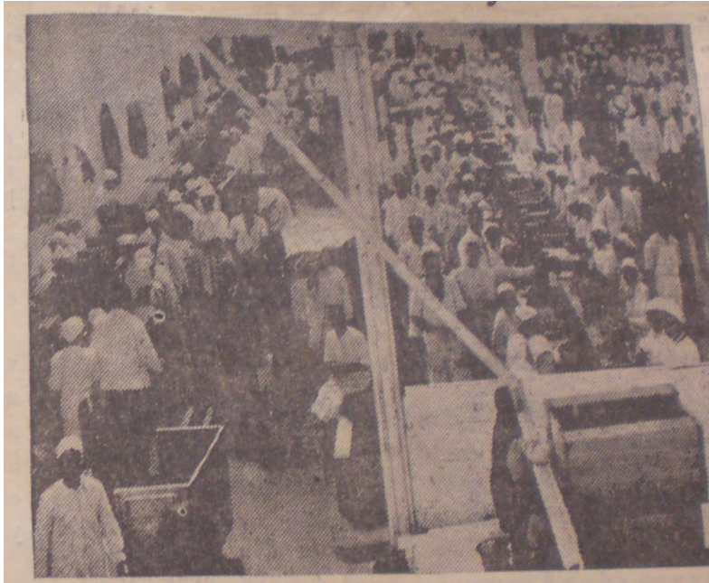
İncir Hanlarında yapılan bir hazırlık (Yeni Asır Gazetesi 12 Ağustos 1936)