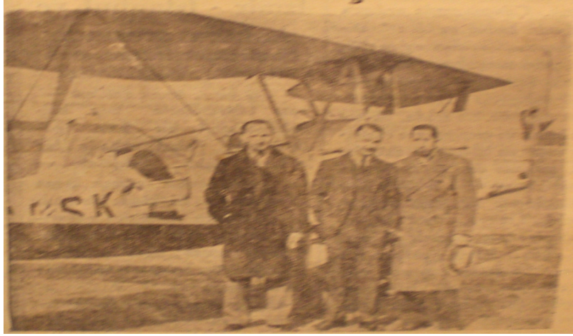
İzmir- İstanbul- Ankara Hava Postalarından bir görüntü(Yeni Asır Gazetesi, 15 Ağustos 1936)