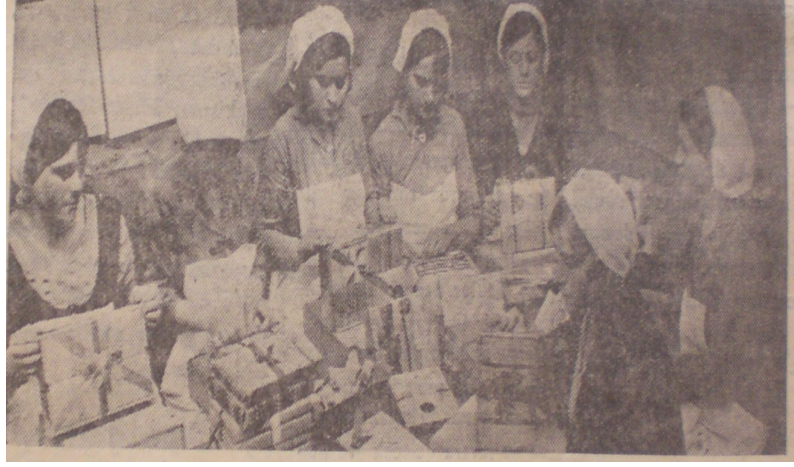
İncirlerin işlenişi ve hazırlanışıyla ilgili bir fotoğraf (Yeni Asır, 14 Ağustos 1936)