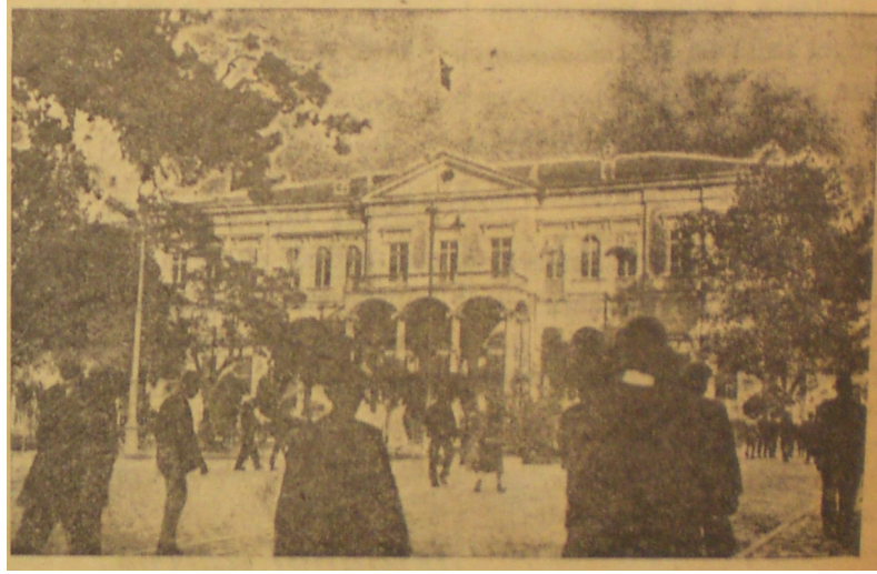
İzmir Hükümet Binası (Anadolu,7 Ekim 1936)