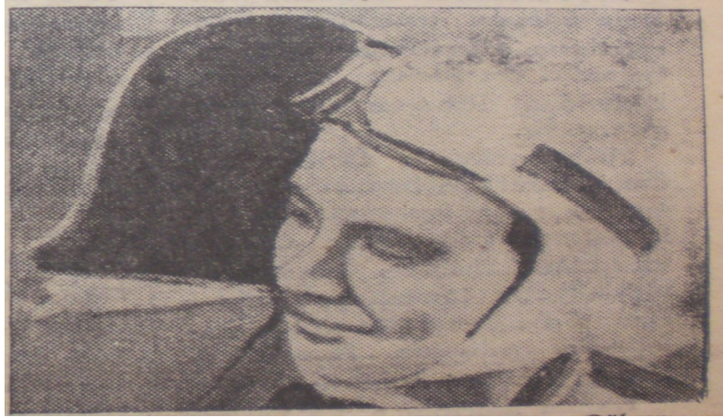
Türk kuşunun gösterilerinde yer alan ilk kadın pilotumuz Sabiha Gökçen(Yeni Asır, 13 Ekim 1936)