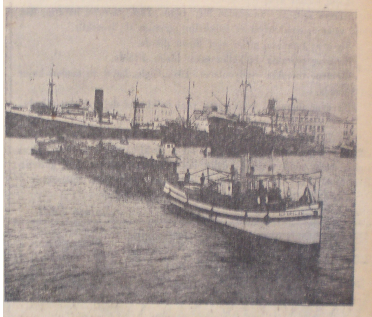
İzmir Limanı'ndan bir manzara(Anadolu, 4 Aralık 1936)