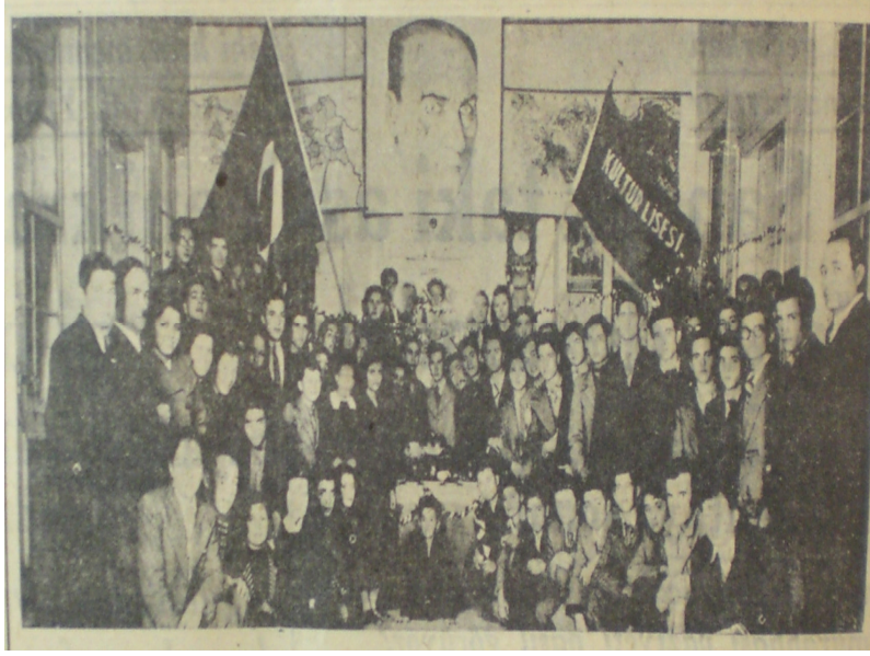
Kültür Lisesi toplantısından bir görüntü(Anadolu Gazetesi 13 Aralık 1936)