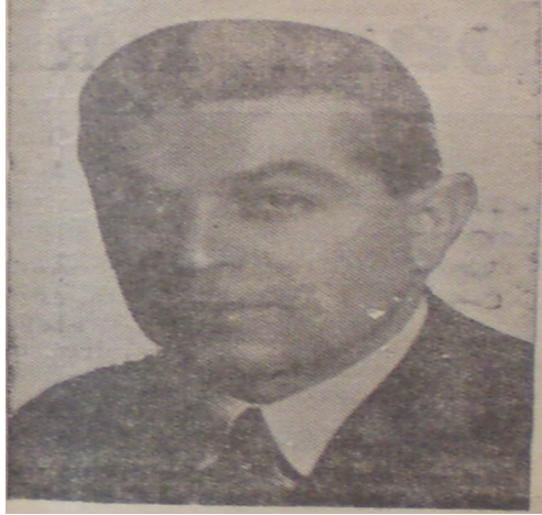
Belediye Reisi Behçet Uz (Yeni Asır, 11 Ağustos, 1936)