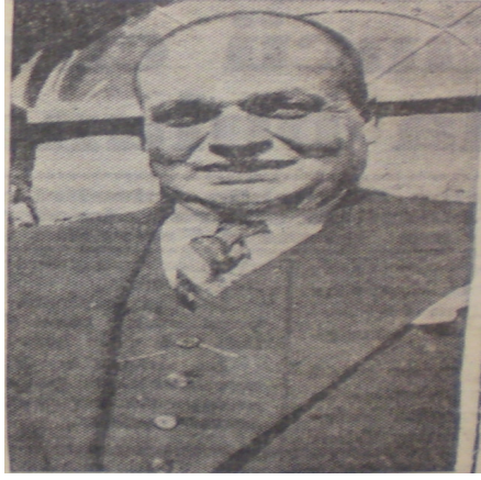
Dönemin Valisi Fazlı Güleç