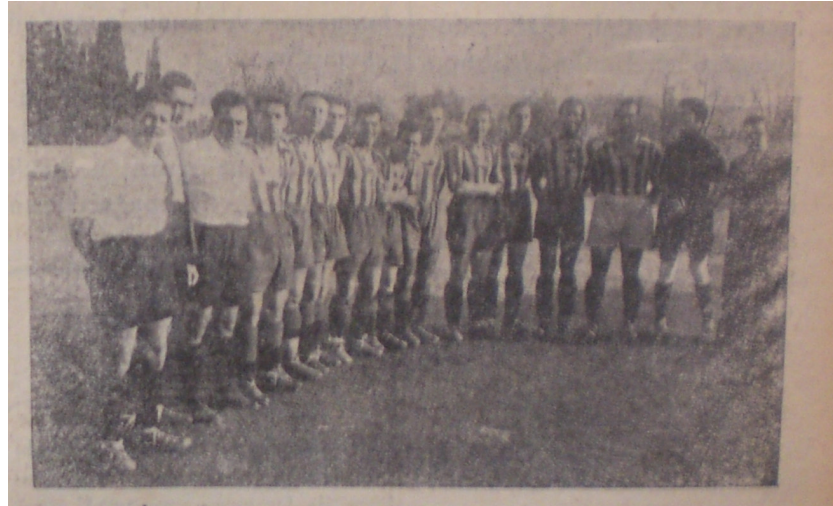
İzmir takımlarından Göztepe'nin Yugoslavya maçı öncesinde çıkardığı kadro (Anadolu, 20 Aralık 1936)