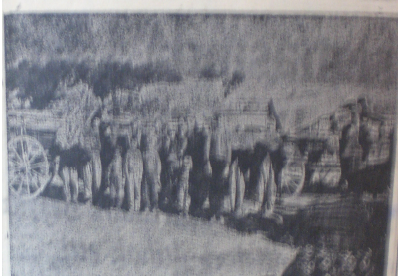
Bulgaristan'dan İzmir'e gelen göçmenler (Anadolu, 17 Ağustos 1936)