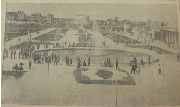
İzmir Fuarından bir görüntü (Yeni Asır, 12 Eylül 1936)