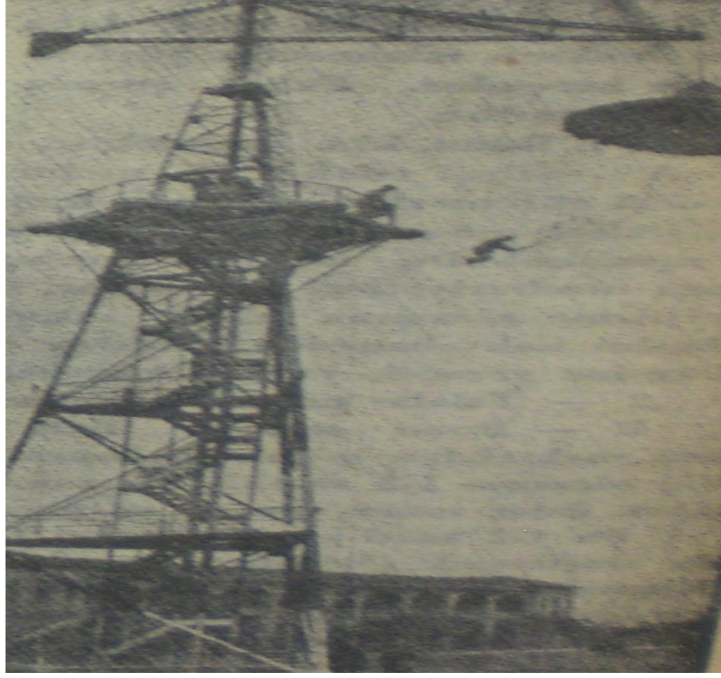
Fuar eğlencelerinden biri olan paraşütle atlama(Anadolu, 13 Ağustos 1936)