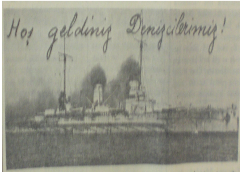
Filomuzun İzmir'e gelişi( Anadolu Gazetesi 5 Aralık 1936)