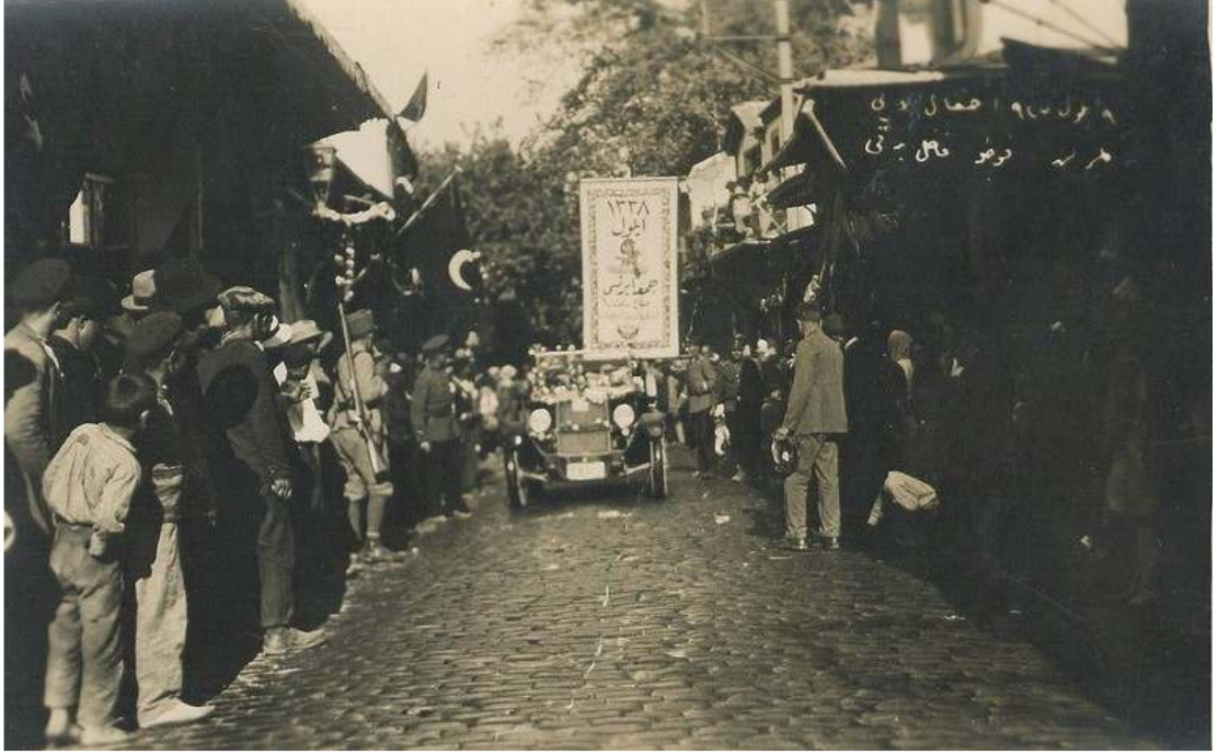
1927 yılı Kurtuluş Bayramı kutlamalarında, kurtuluşu temsilen yapılan geçit töreni ve etrafını saran kalabalığın görüntülediği fotoğraf 504 .