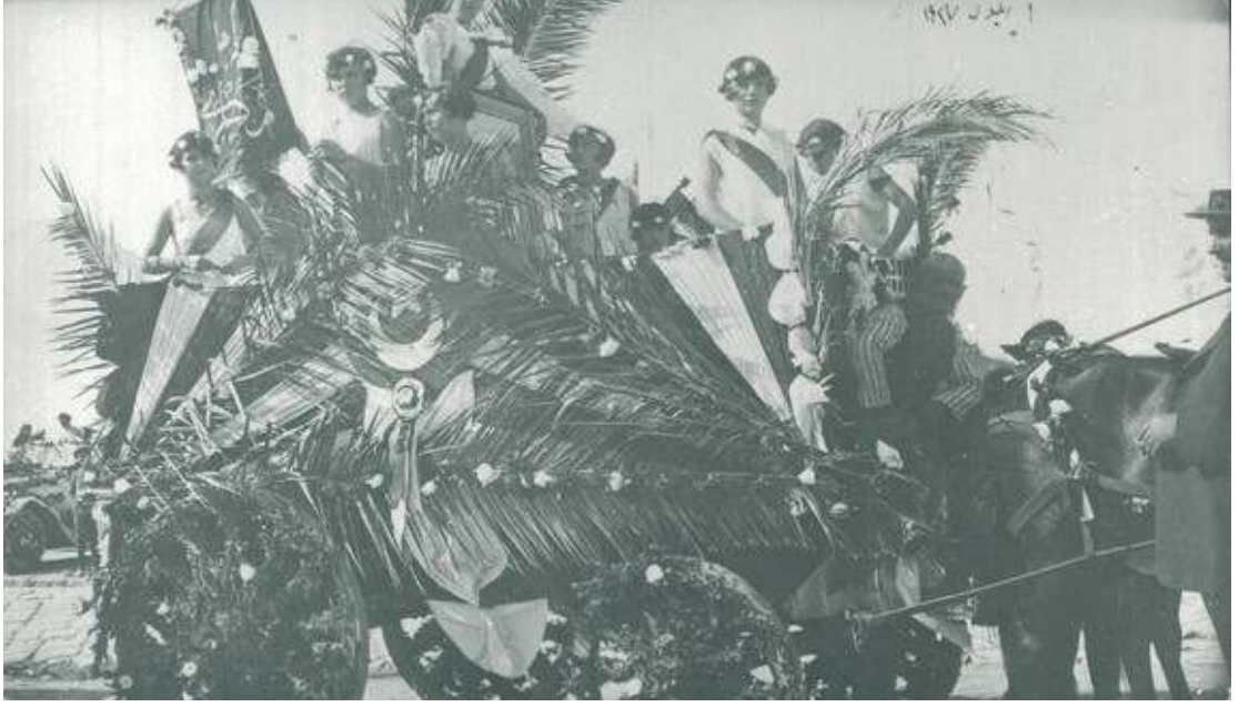
1927 yılında yapılan 9 Eylül geçit resmine katılan çiçek, palmiye yaprakları ve ay yıldızla donatılmış atlı arabaya binen, saçları çiçeklerle süslü genç kızlar 502 .