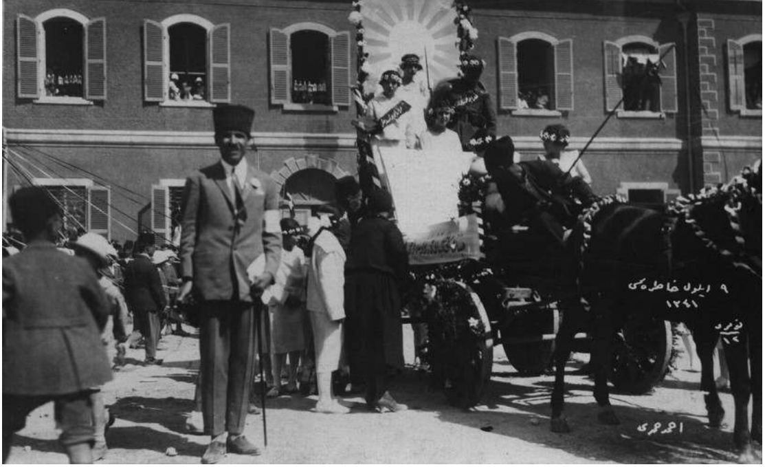
Basmane Garı'nın önündeki 9 Eylül kutlamalarının görüntülediği fotoğraf 500 .