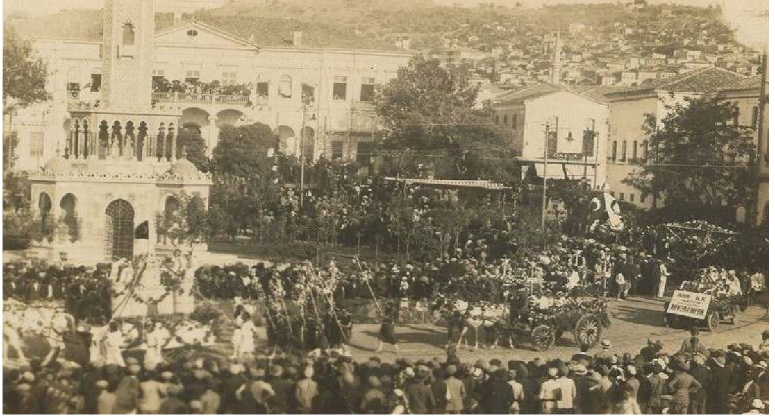
Konak Meydanı'nda 9 Eylül Kurtuluş Bayramı kutlamalarının görüntülediği bir fotoğraf 503 .