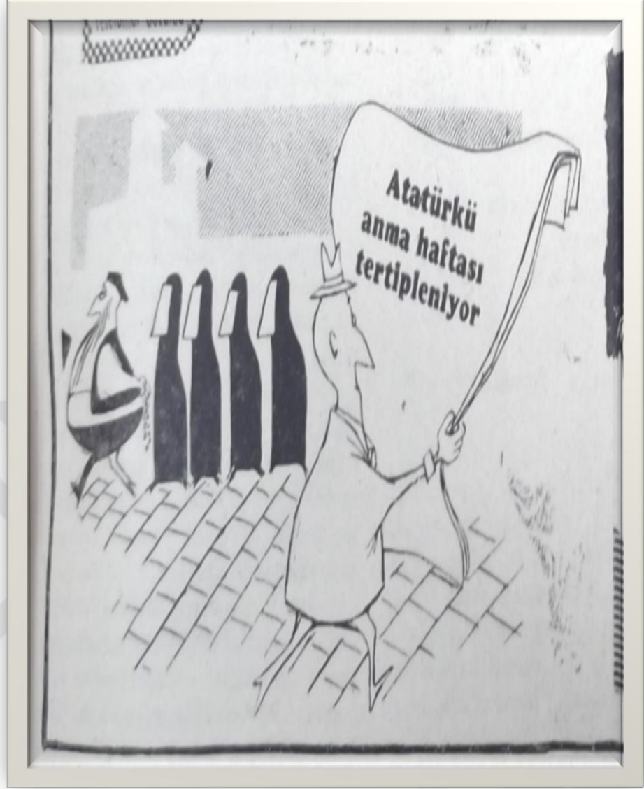
EK 2- Derginin bu karikatüründe kara çarşafın ve çok eşliliğin yeniden türemesine dikkat çekilmiştir. 574