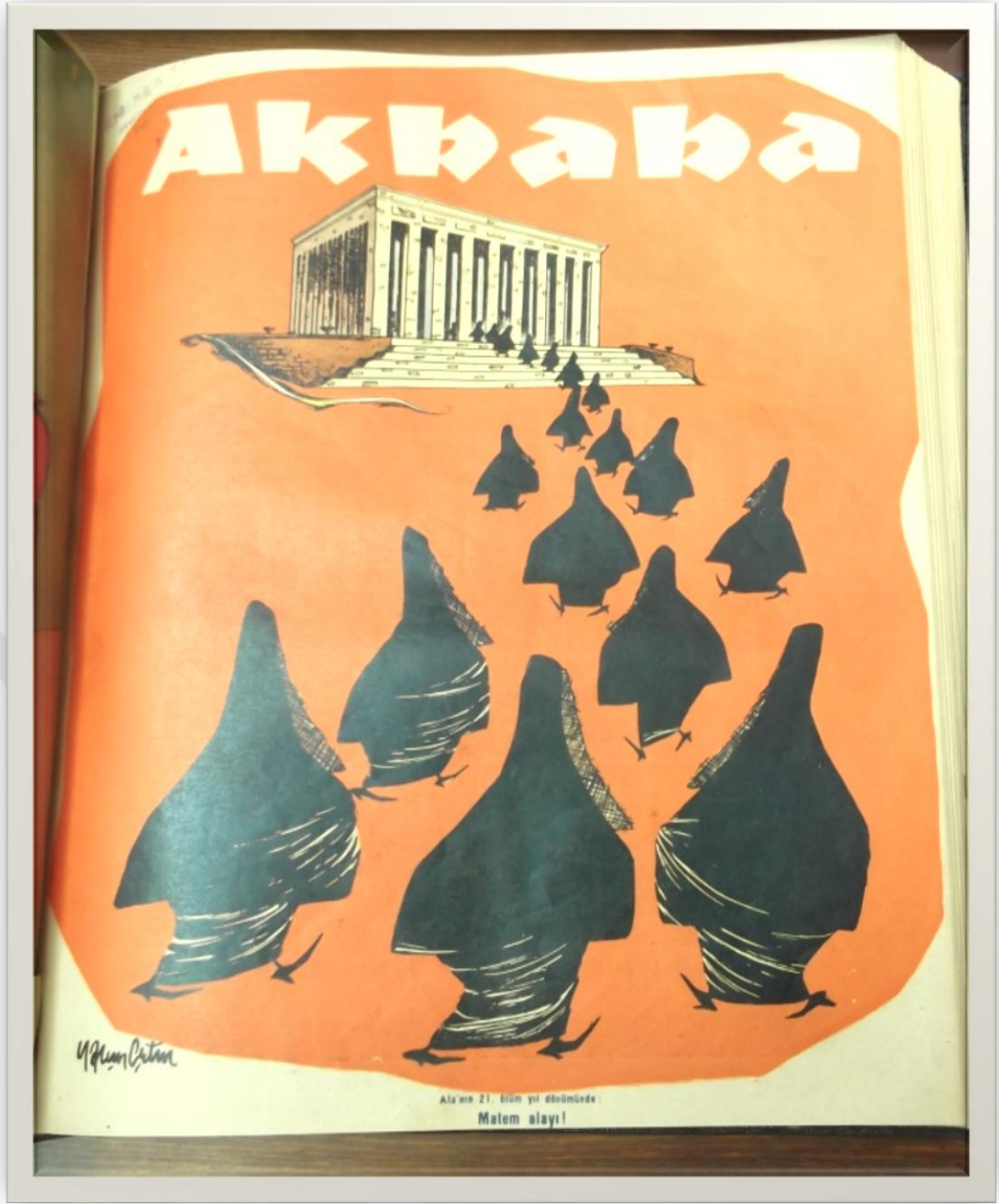
EK 3- Bu karikatürde Atatürk'ün 21. ölüm yıldönümünde kara çarşafın ne kadar yayıldığına dikkat çekilmiştir 575 .