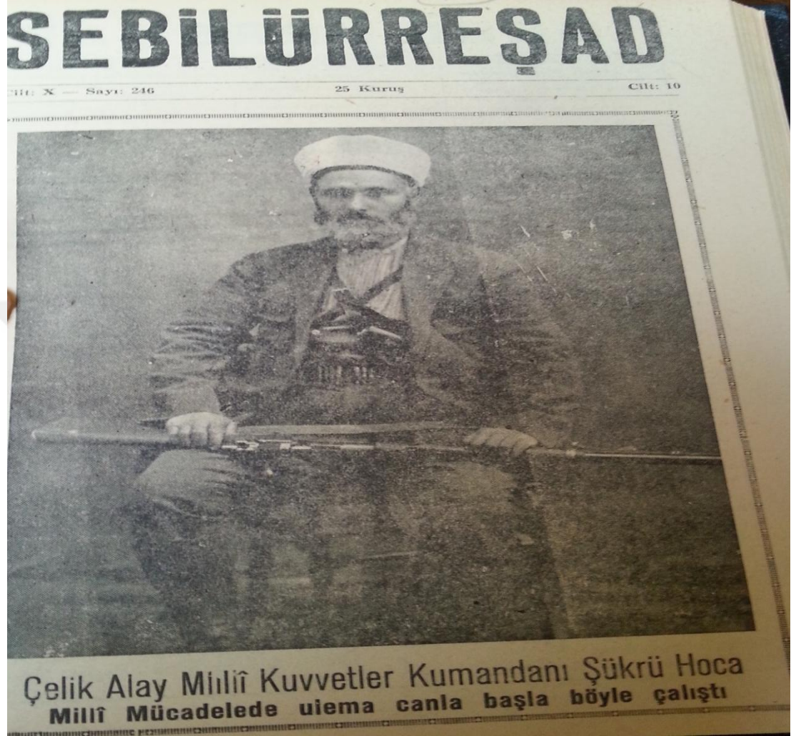
EK 6- Sebilürreşad Dergisi'nde Milli Mücadele yıllarında din adamlarının savaşmasıyla ilgili yayınladığı bir resim 578 .