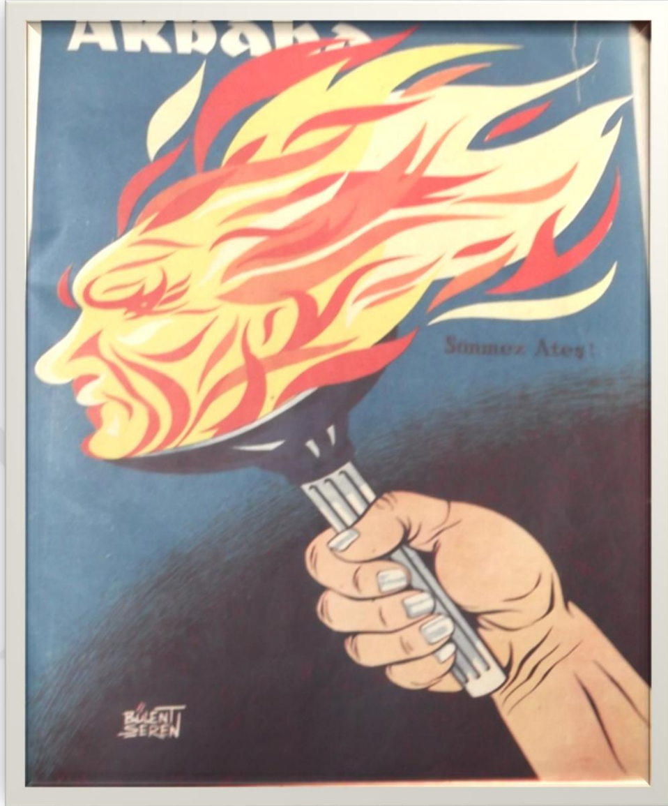
EK 5- 27 Mayıs 1960 Askeri Müdahalesi'nden sonra Atatürk'ün sönmez ışığının yeniden parlamaya başladığını anlatan bir karikatür 577 .