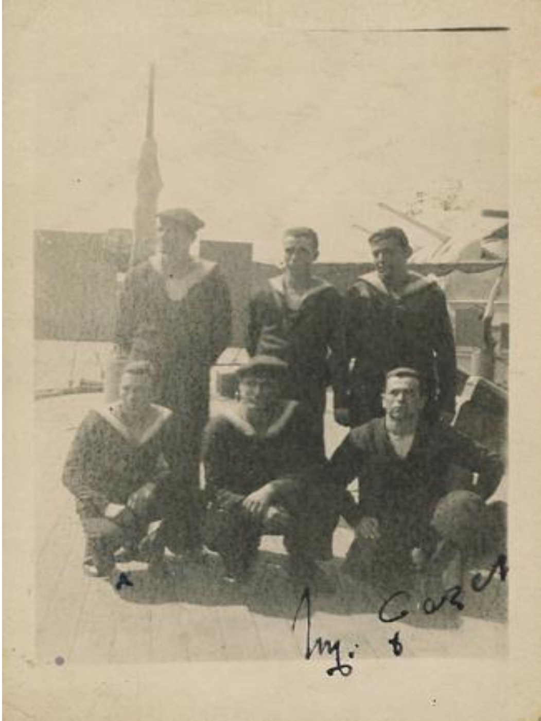
Ek.XVI Missouri zırhlısı önünde hatıra bir hatıra fotoğrafı çektiren Amerikan Askerleri