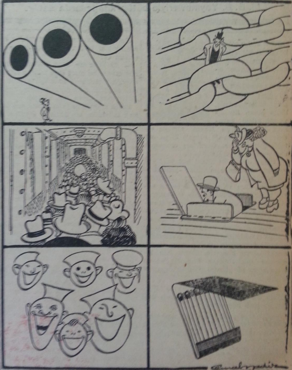
Missouri'yi ziyaretten aklımda kalanlar!..

Şehrimizde misafir bulunan Ameri- kâli denizciler dün sabah saat 10 da Taksim Cumhuriyet âbidesine törenle — Arkası sahife 3. Sü. 7 de —