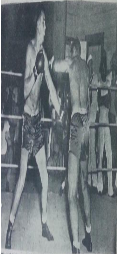
Missouri'nin beynelmül şöhretli ağır boksörleri çok çetin bir karşılaşmada

Amerikanın birinci sınıf profesyonel boksörlerini arasında bulunduran Missouri boksörleriyle karşılaşıyoruz