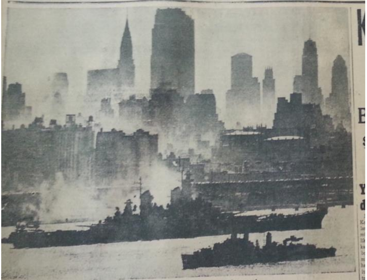
Missouri hareketinden evvel Neo-York limanında