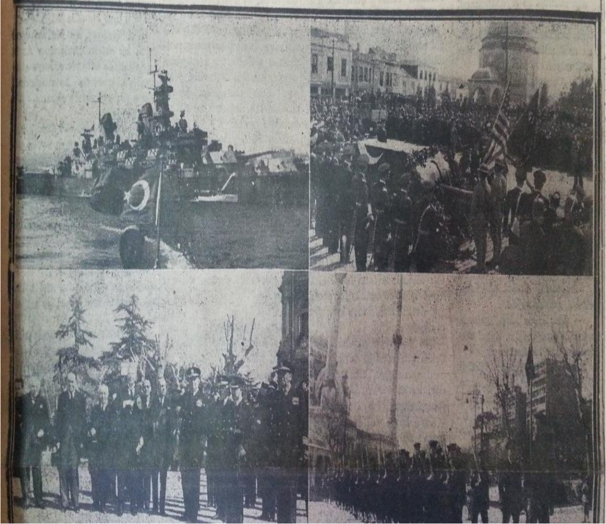
Ek.XIII Münir Ertegün'ün merasimine ilişkin Türk basınından resimler