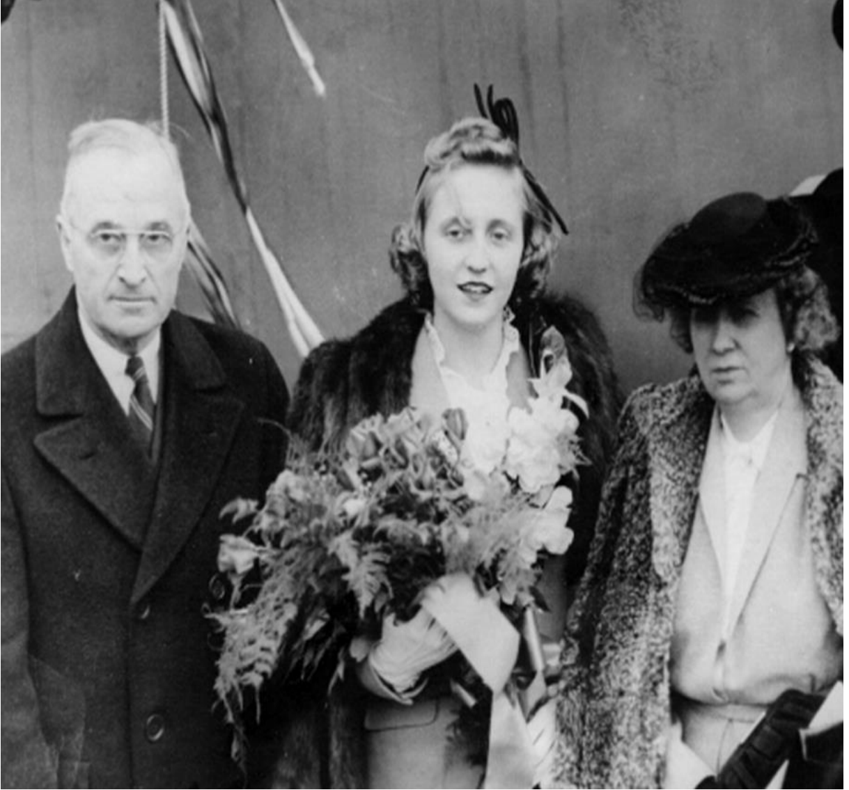
Ek.XV 1944 yılında suya indirilen Missouri zırhlısının sponsorluğunu üstlenen Margaret Truman (Ortada) ve ABD Birleşik Devletleri Başkanı Harry Truman