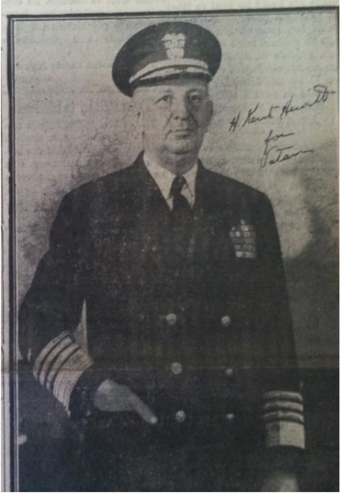
Ek.IV Missouri zırhlısı Amiral ve Amerika Birleşik Devletleri 12.Filo komutanı Henry K.Hewitt