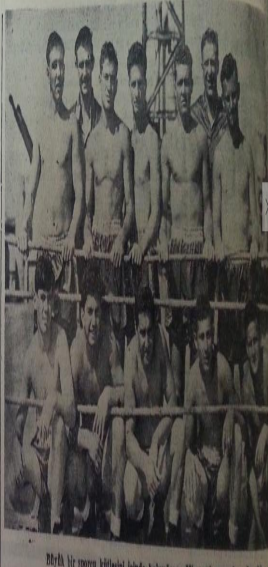
Böyle bir sporcu küllüsünü bulduğumuz Missouri'de

Boks deyince hiç şüphe yok ki ilk akla gelecek memleket