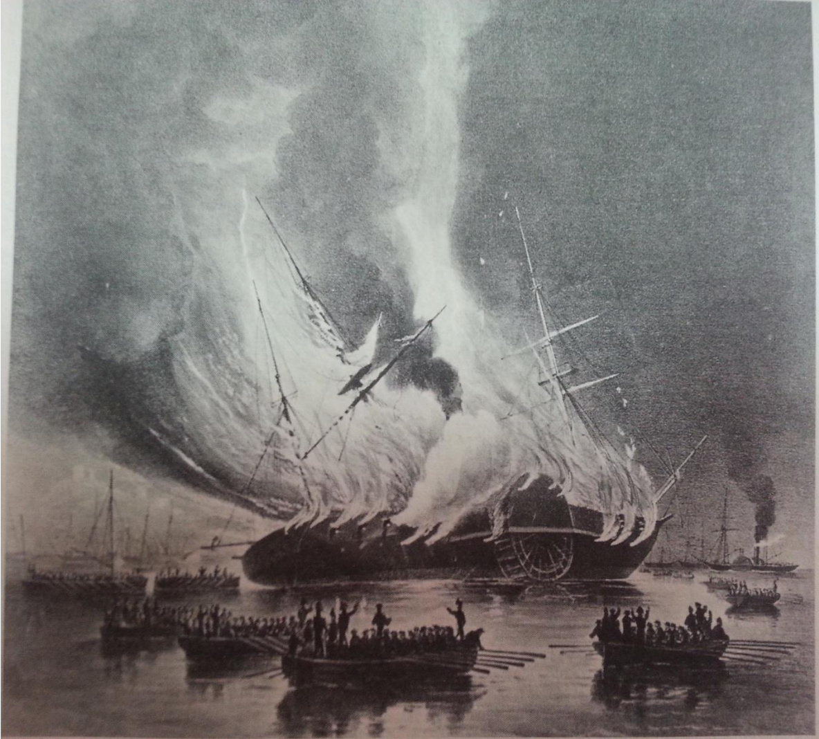
The first Missouri in flames at Gibraltar.

Ek.XIV Missouri'nin 1843 yılında Caleb Cushing'i Çin'e nakledişi esnasında Cebelitarık açıklarında yanarak batışı