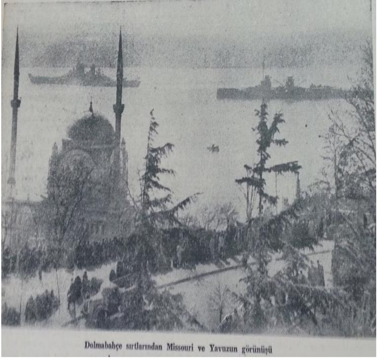
Ek.X 6 Nisan 1946 tarihinde Missouri ve kendisini karşılayan Yavuz zırhlısına ait Dolmabahçe sirtlarında çekilen bir resim