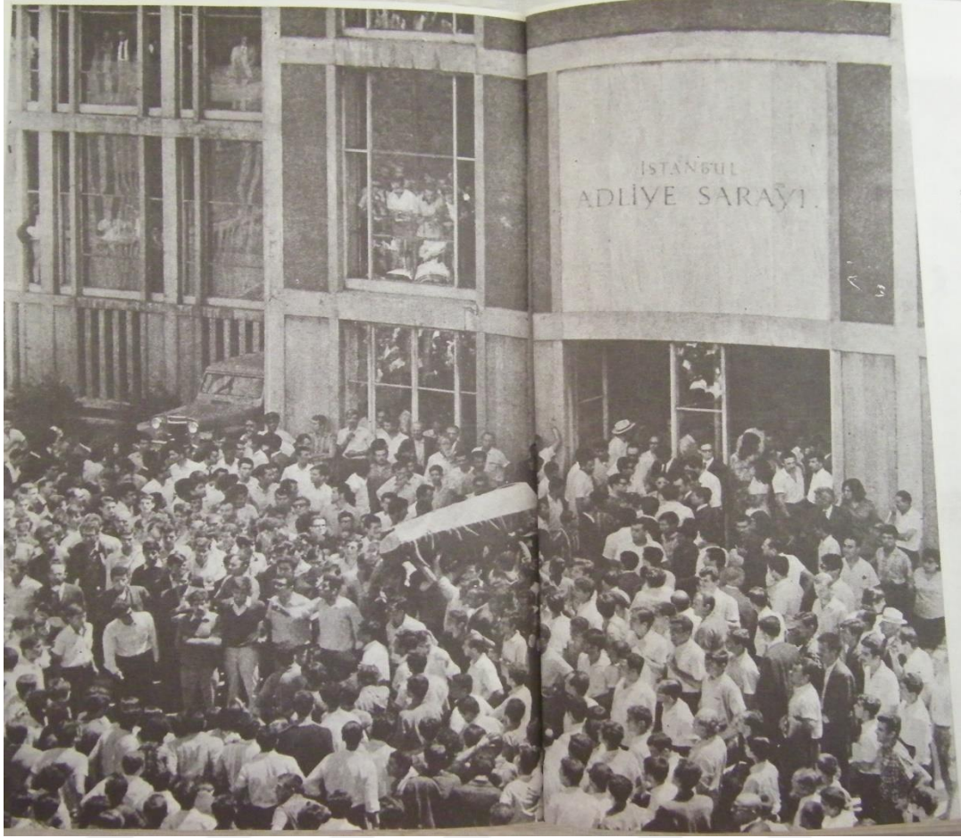
EK 7: Polis tarafından öldürülen Vedat Demirciođlu'nun sembolik cenaze töreninde Deniz Gezmiş konuşma yaparken 413