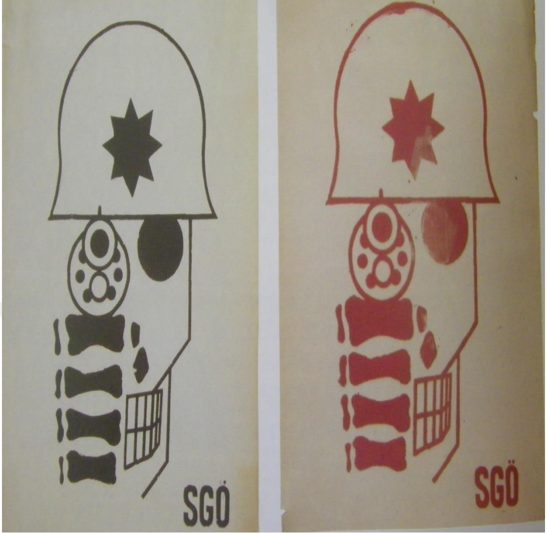
EK 9: FKF'nin DEV-GENÇ'e dönüşüm sürecinde TİP'li gençler tarafından kurulan Sosyalist Gençlik Örgütü'nün, toplum polisinin kaldırılması isteğiyle düzenlediği kampanyadan bir afiş 415