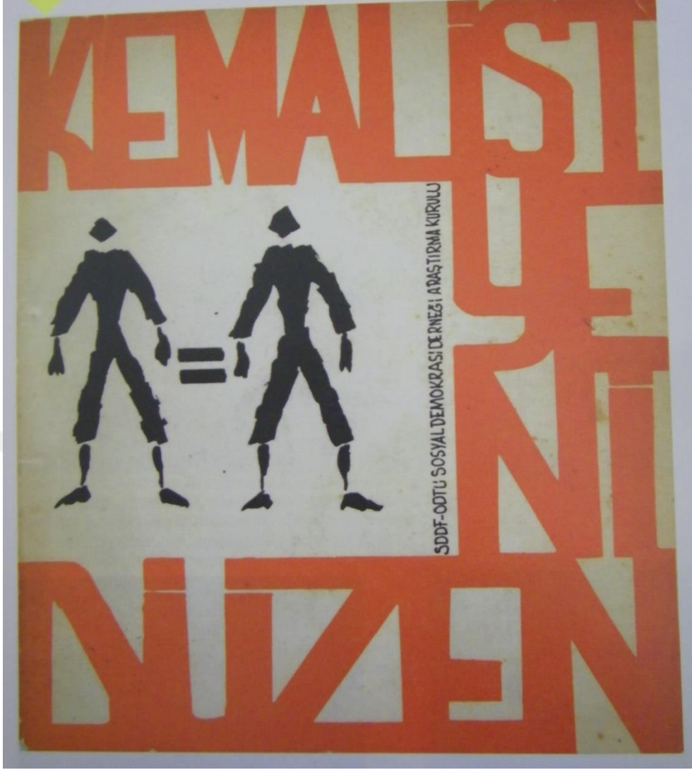
EK 10: 1966 yılında kurulan ODTÜ Sosyalist Demokrasi Derneği'ne ait bir afiş 416