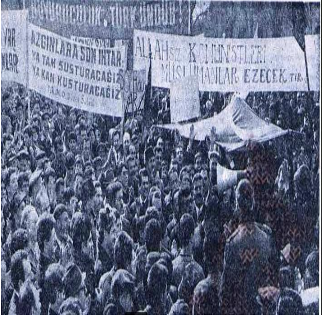
EK 11: MTTB'nin düzenlediği Şahlanış Mitinginden bir kare 417