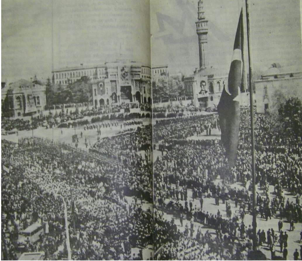
EK 6: 28-29 Nisan olaylarının ertesinde yapılan anma töreni 412