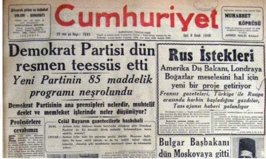
Demokrat Parti Amblemi