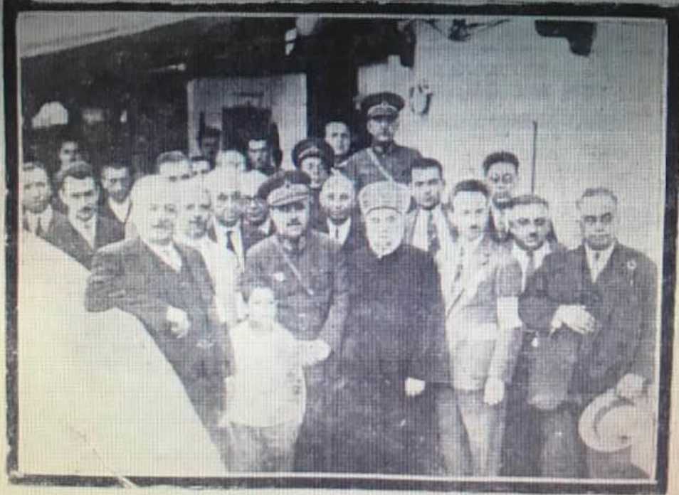
Vapurdaki ziyaretçilerden bir grup

Şehitlikleri ziyaret için Çanakkale seyahatine tahsis edilen Reşit Paşa vapuru dün akşam saat 19 da hareket etmiştir.