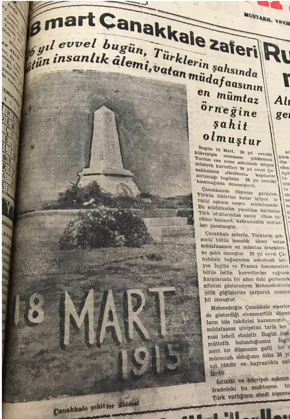
Ek 7: Yeni Sabah 18 Mart 1946