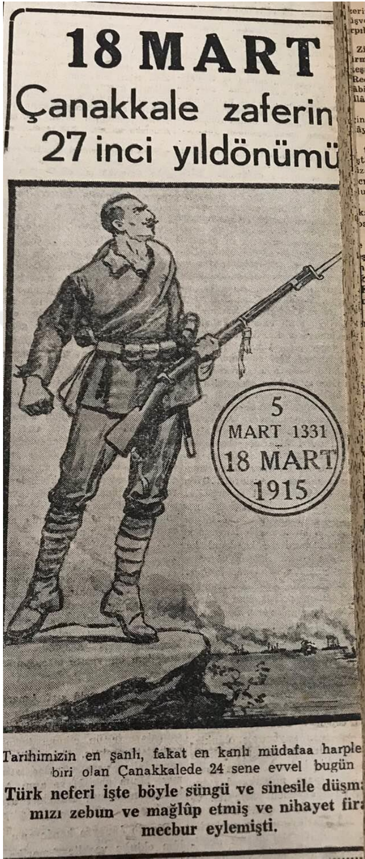
Ek 6: Taviri Efkar 18 Mart 1944