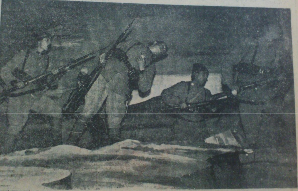
Eminönü Halkevinde dün gece Çanakkale zaferini temsilen tertib edilen canlı tablolardan biri

Çanakkaledeki tören çok güzel oldu, yüksek tahsil gençleri, Çanakkale toprağından yapılmış bir vazoyu damarlarından akıttıkları kanla doldurarak anıta koydular