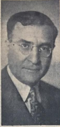
B. Milletler Kore Komiyonuna başkanlık etmiş olan Kasım Gülek