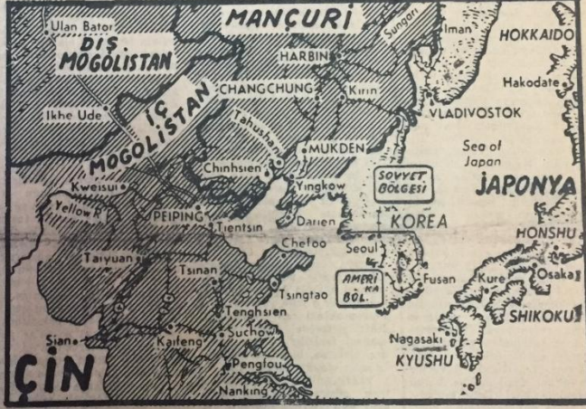
Kuzey ve Güney Koreyi gösterir harita

Uzakdoğu'nun gerek siyasi gerek askerî bakımından ehemmiyetli bir bölgesi olan Kore'de dün resmen harp patlamıştır. Kuzey Kore'deki komünist hükümetin radyosu da harbin resmen ilân edildiğini bildirmiştir. Anadolu Ajansının muhtelif kaynaklardan aldığı haberlere göre komünist Kuzey Kore kuvvetleri evvelki gün Güney Kore Cumhuriyetine muhtelif taarruzlarda bulunmuşlardır. Moskova tarafından desteklenen Kuzey Kore kuvvetleri topçu ateşinden sonra taarruza geçmişlerdir. Komünist kuvvetlerin ilk hamlede Seul'un kırk mil kuzey batısındaki bir kasabayı işgal ettikleri bildirilmektedir. Seul'deki Amerikan askerî memurlarına talimat verilmiştir. Güney Kore'deki Amerikan askerî heyeti ceman 500 (Soru 4 üneü S. 1 inci Su. da)