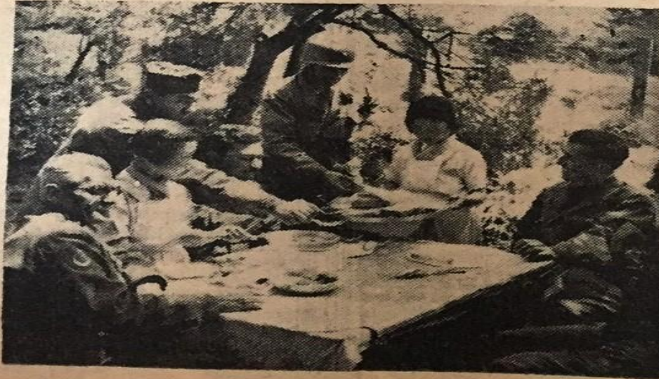
Suvon'da geri kademede bir öğle yemeği servisi yapan Koreli kız.