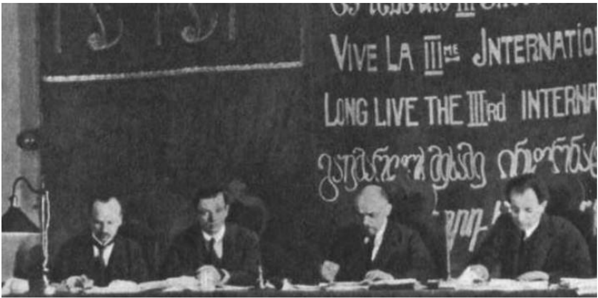
KOMÜNİST ENTERNASYONEL KURULUŞ KONGRESİ VE İLK TOPLANTISI