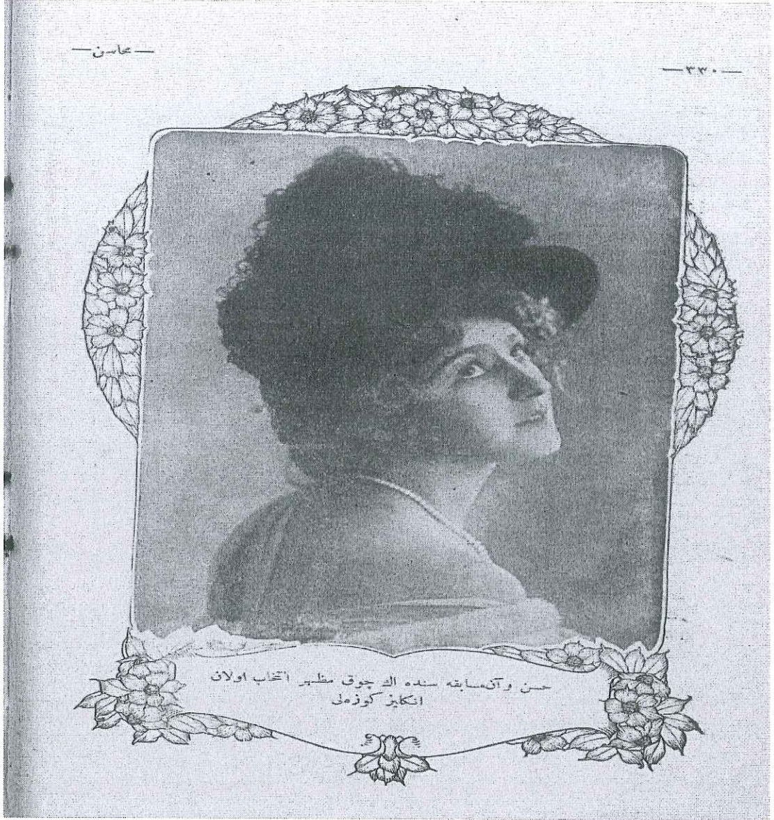
Hüsn ü an müsabakasında en çok mazhar-ı intihab olan İngiliz güzeli.