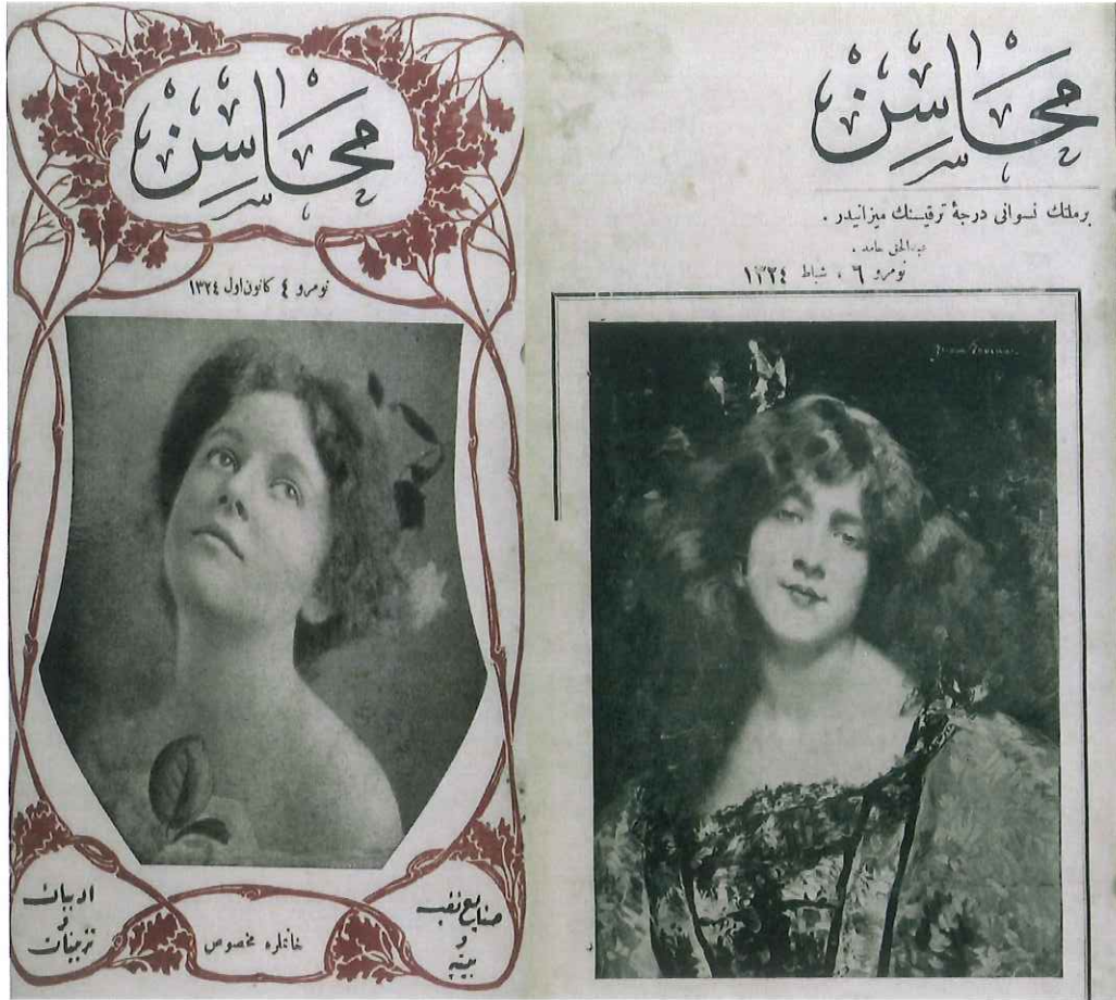
Mahâsin dergisinin dördüncü ve altıncı sayısının kapakları.