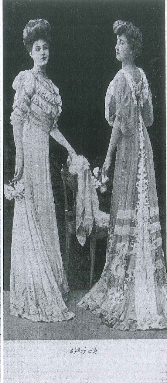
Paris modasından örnekler.