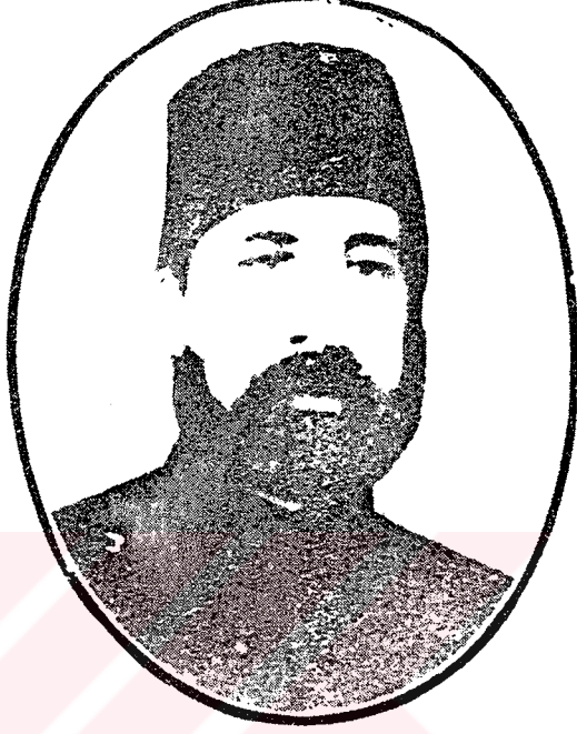
Ahmet Esat Paşa