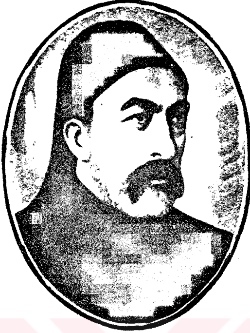
Kibrıslı Mehmet Paşa