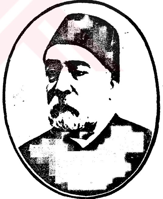
Mahmut Nedim Paşa