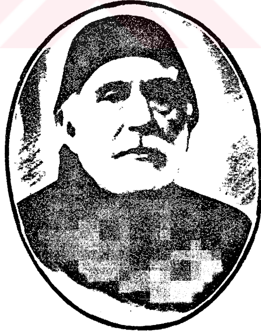
Mustafa Naili Paşa