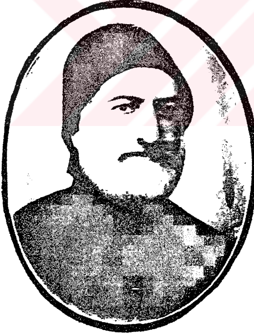
Yusuf Kâmil Paşa