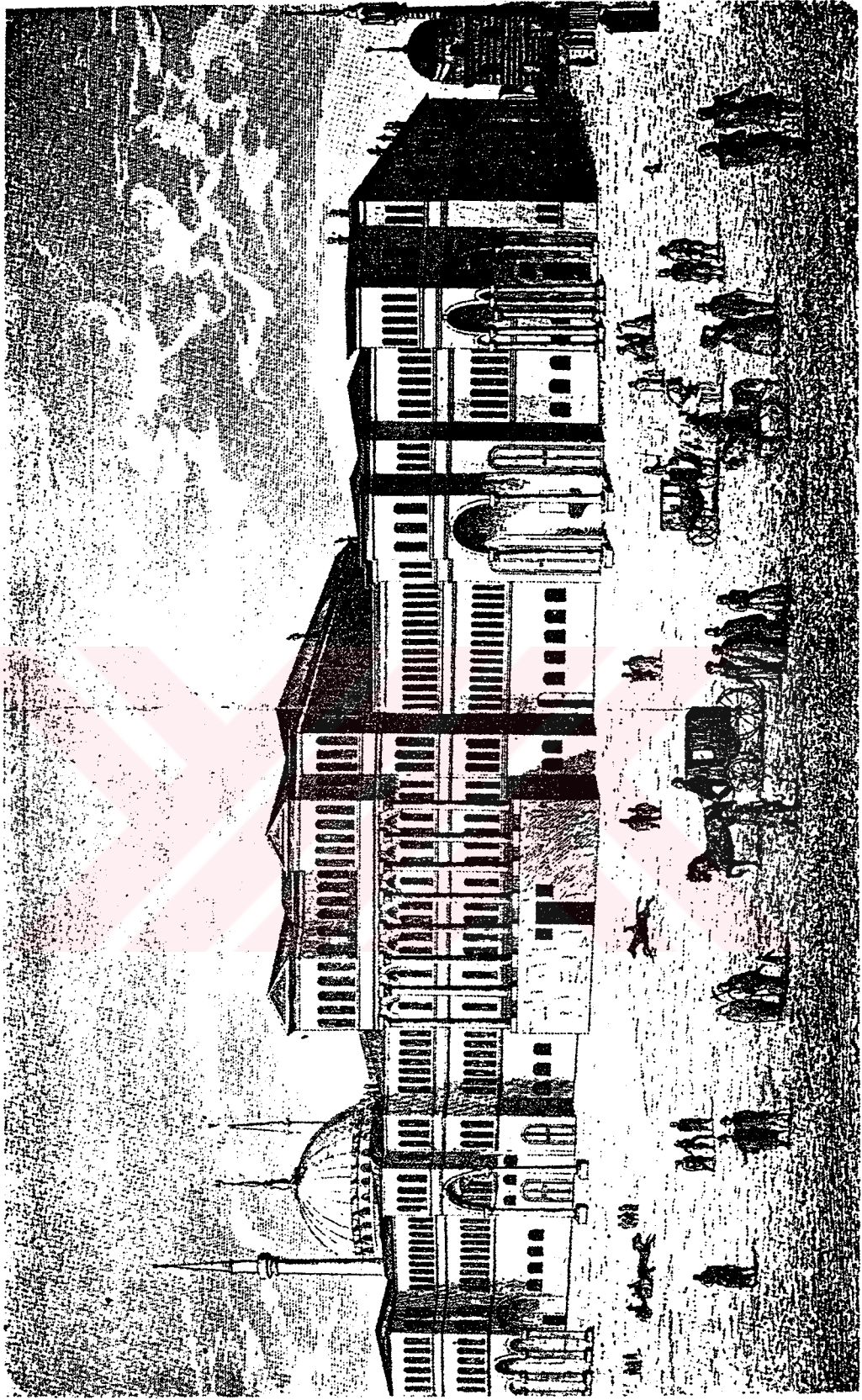
Tanzimat Devrinde Babıâli.

[14 Kânunusani 1867 tarihli Ayinei Vatan Mecmuasından]