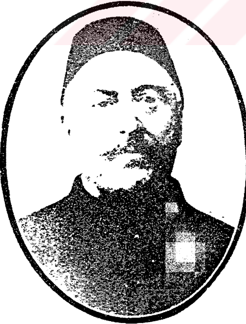
Mehmet Ali Paşa