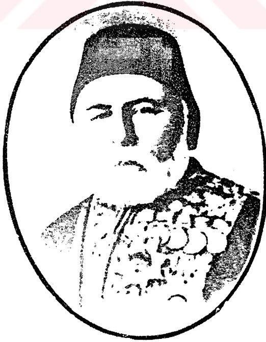
Hüseyin Avni Paşa