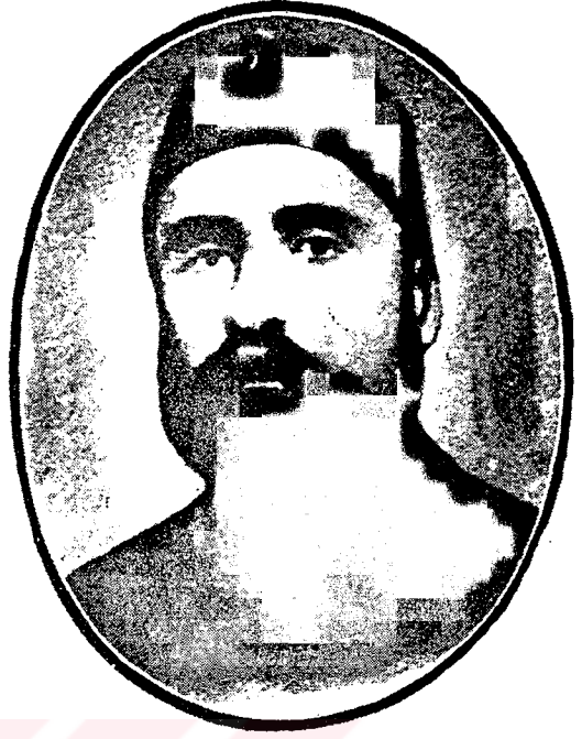
Mütercim Rüşti Paşa