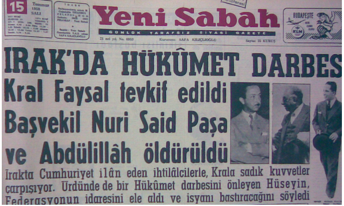
(Yeni Sabah, 15 Temmuz 1955)