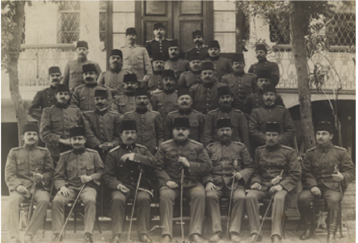
(6. Ordu Mensubu Türk Subayları)

Birinci Dünya Savaşı Sırasında Irak için bkz.