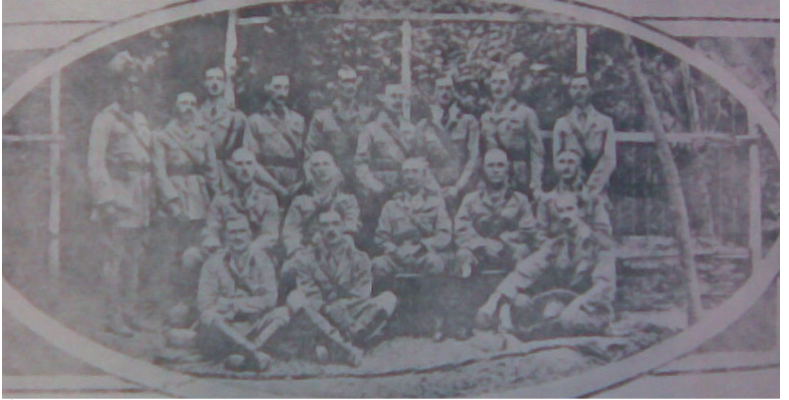
(İngiliz-İrak Ordusu Başkumandanı General Nixon ve Kurmayları Bağdat, 1916)