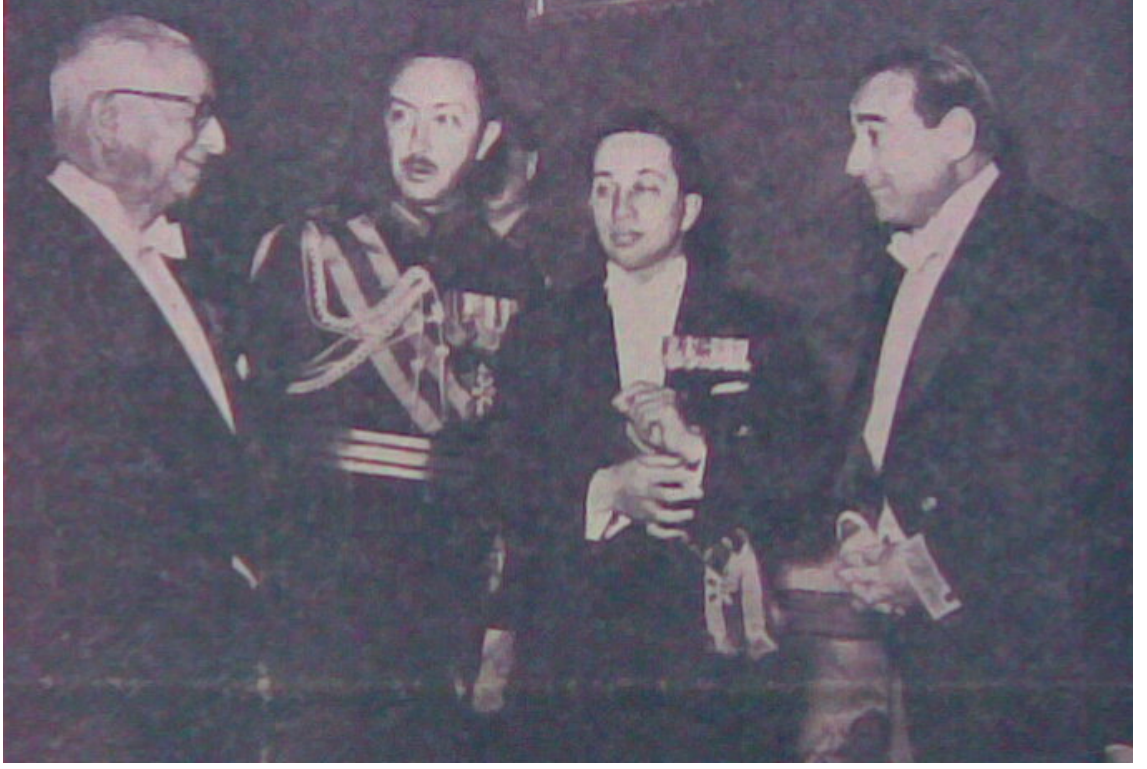
Başbakan Adnan Menderes, Irak Kralı II. Faysal ve Emir Abdullilah ile birlikteyken.