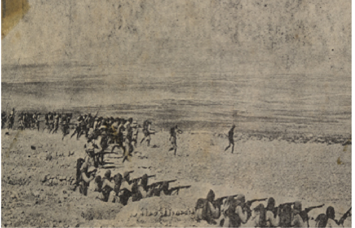
(Selman-ı Pak Savaşı sırasında Türk birlikleri, İngiliz askerlerini takip ederken)