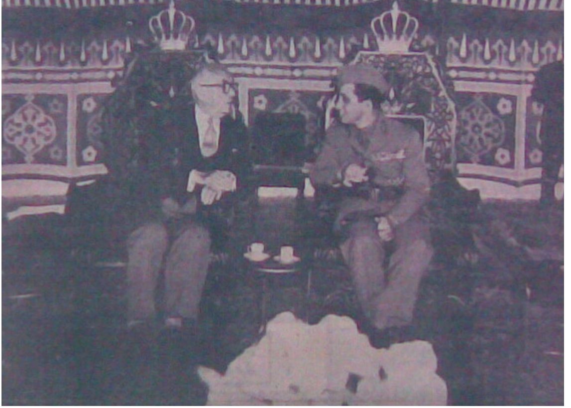
Cumhurbaşkanı Celal Bayar ve Irak Kralı II. Faysal.(Zafer Gazetesi, 7 Mart 1955)