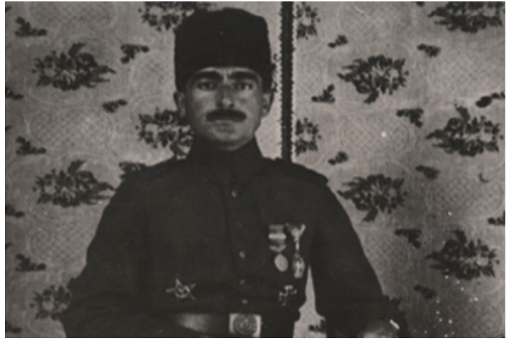
(Halil (KUT)Paşa 1882-1957)