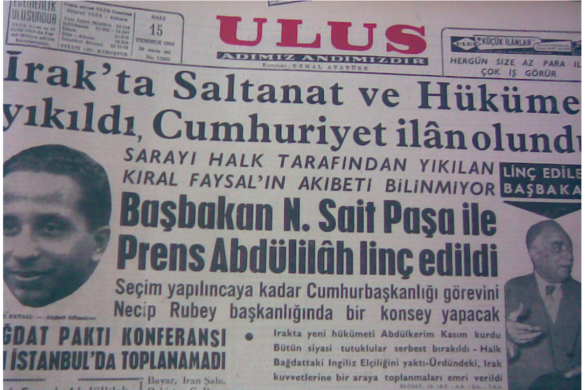
(Uluş Gazetesi 15 Temmuz 1955)