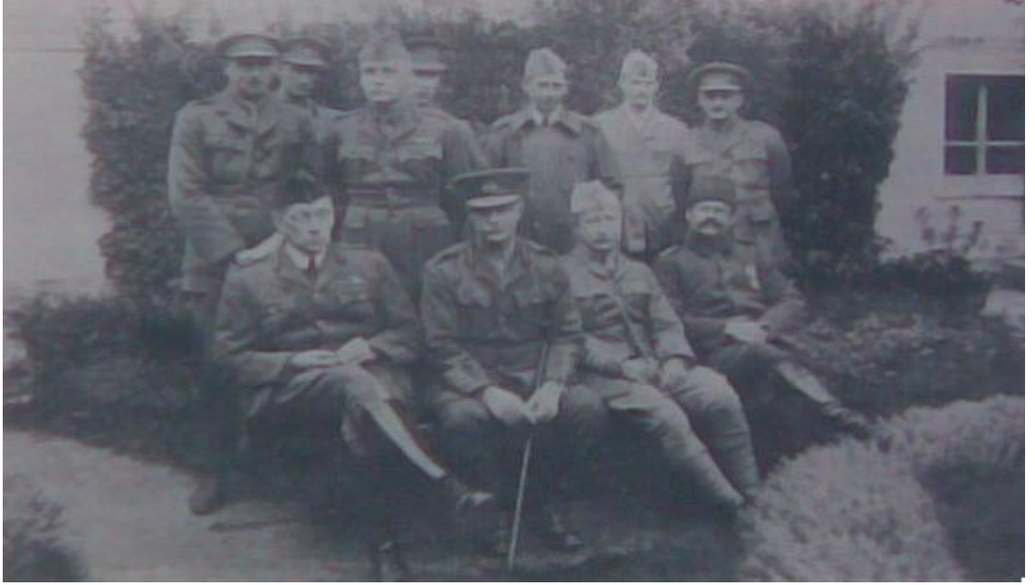
(Selman-ı Pak savaşı sonrası Kut'ül-Amare'de esir düşen İngiliz Komutanları)