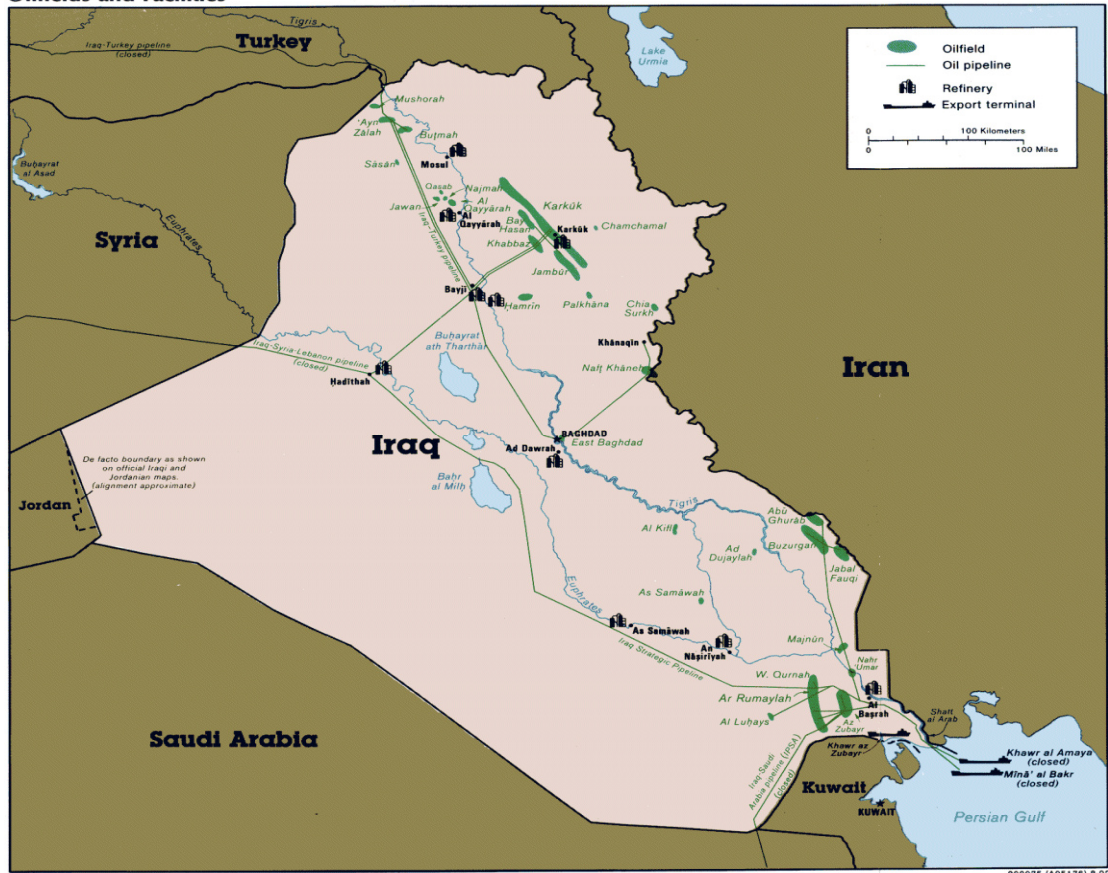
Oilfields and Facilities

http://bbs.keyhole.com/ubb/z0302a1700/REZiraq-oilfields-map.jpg Erişim Tarihi: 20 Nisan 2010