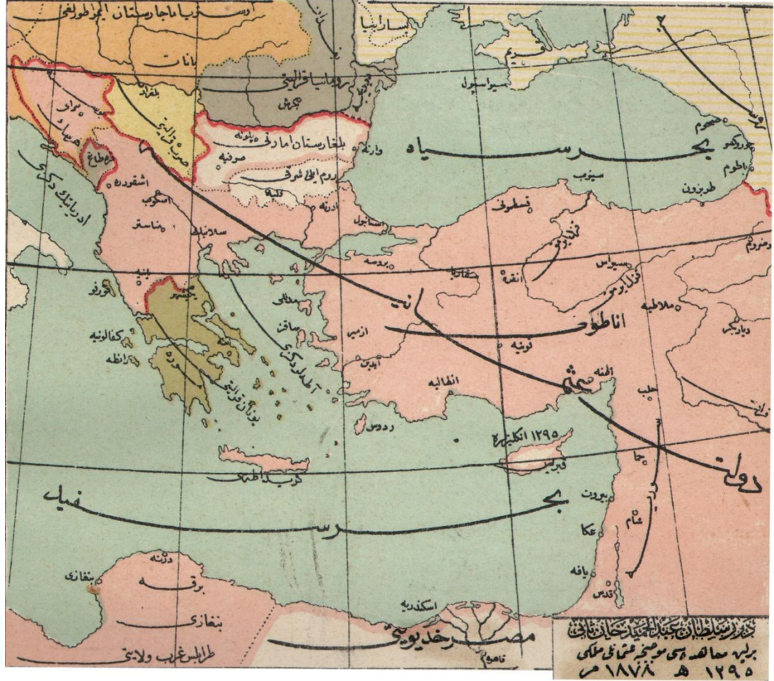
Ek. 3. Berlin Anlaşması Mücebince Balkanlarda Osmanlı Mülkü*