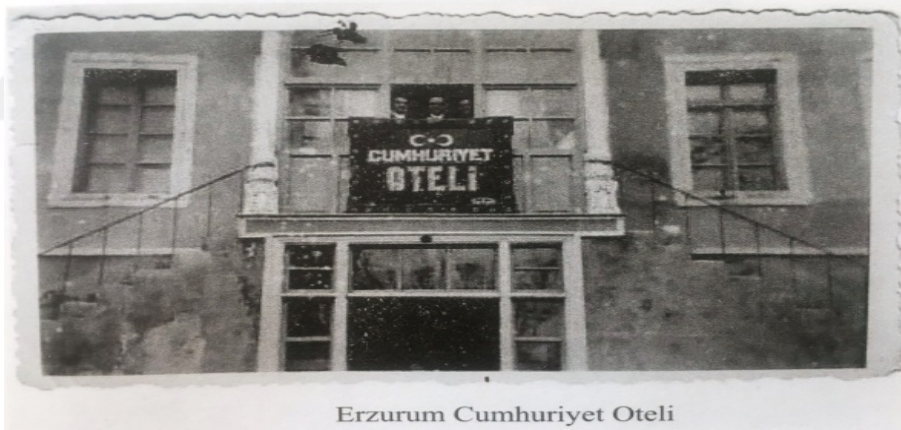
Erzurum Cumhuriyet Oteli