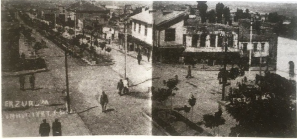
1930'larda Cumhuriyet Caddesi