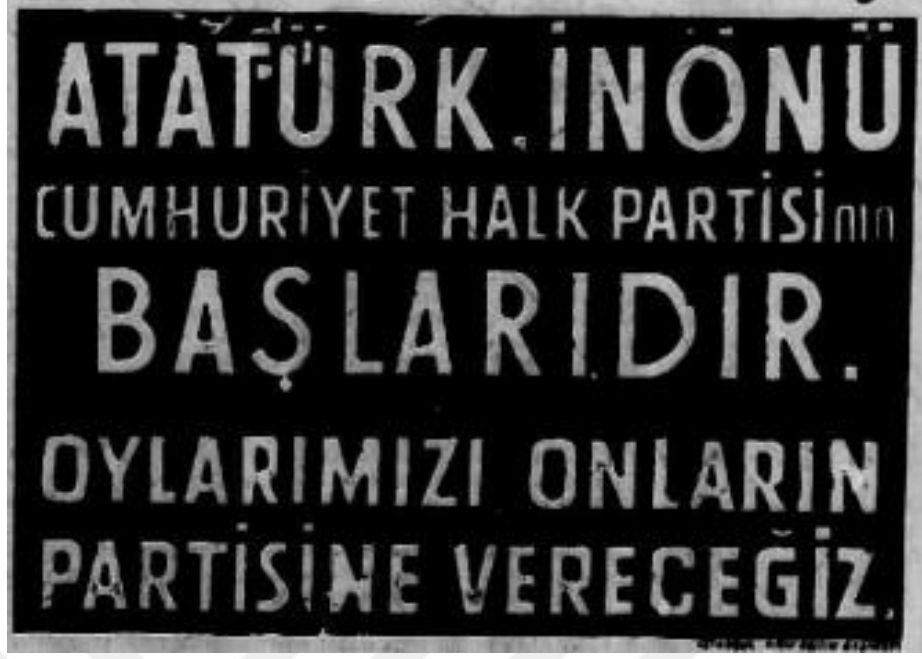
Ek 5. CHP'nin seçim sloganı 462