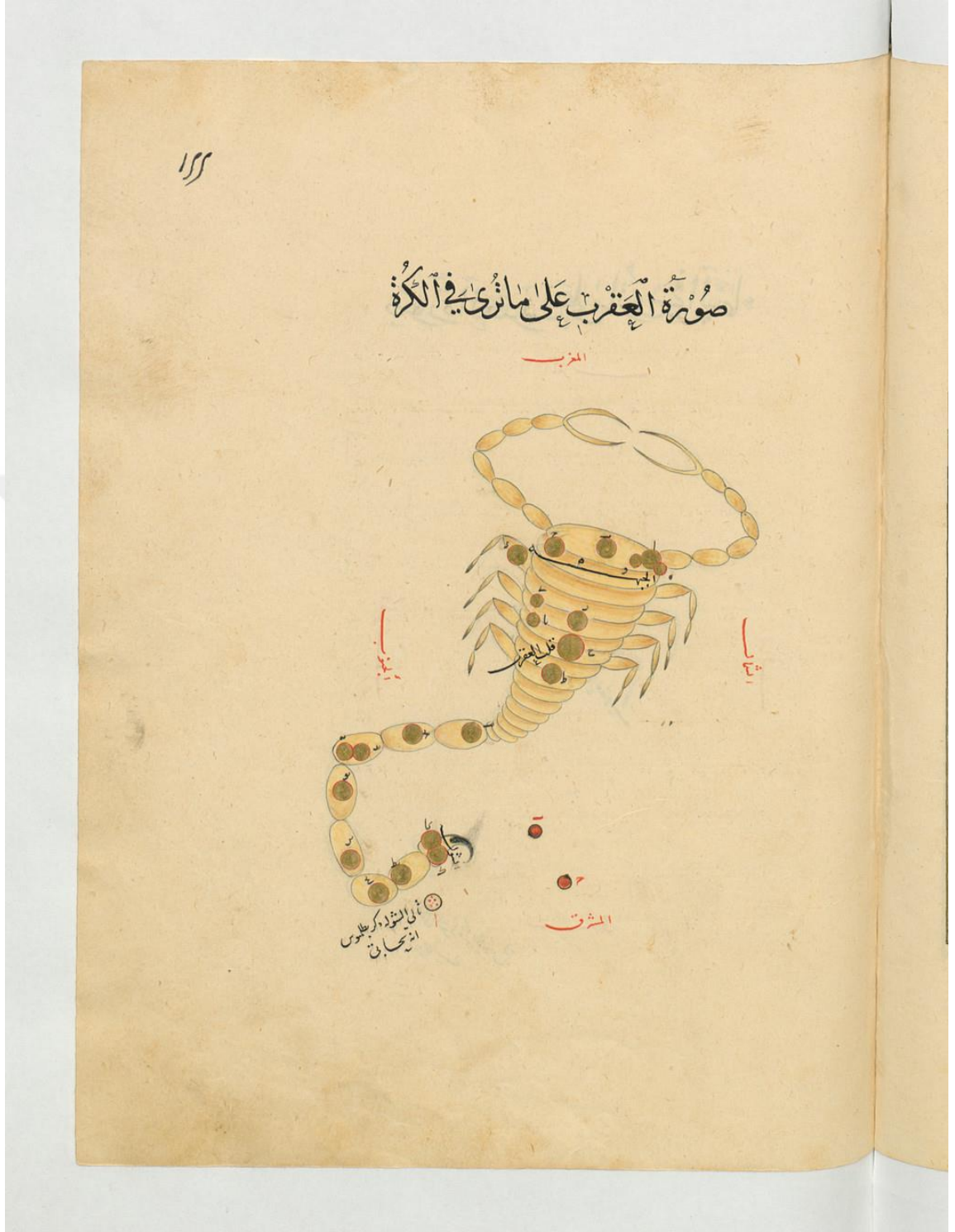
Abdurrahmân es-Sûfi'nin “ Kitâbü Suveri'l-Kevâkibi's-Sâbite ” adlı eserinden akrep burcuyla ilgili bir çizim