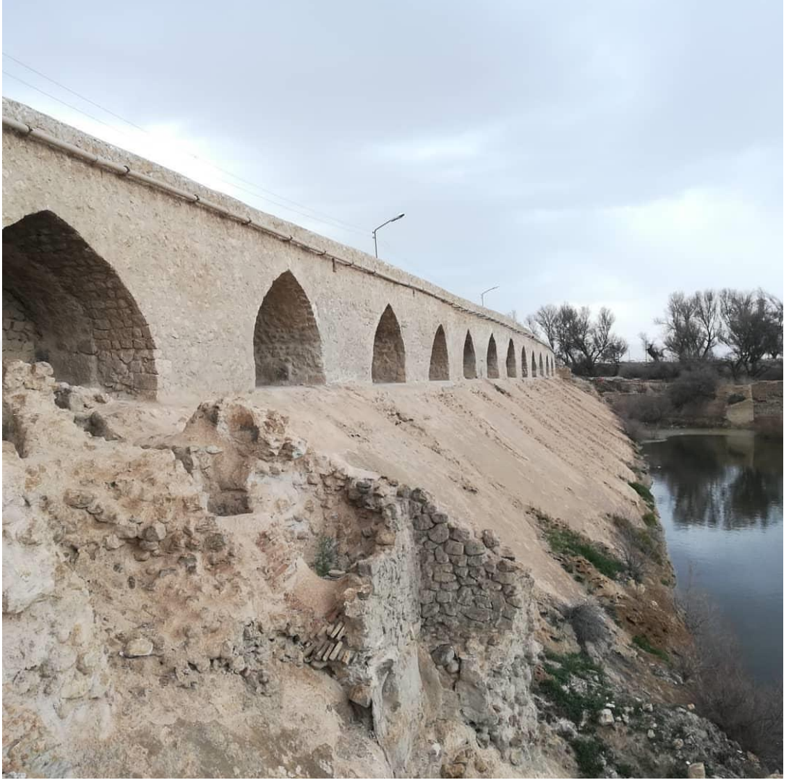
Bend-i Adudî (veya Bend-i Emîr)'den bir görünüm. 1784