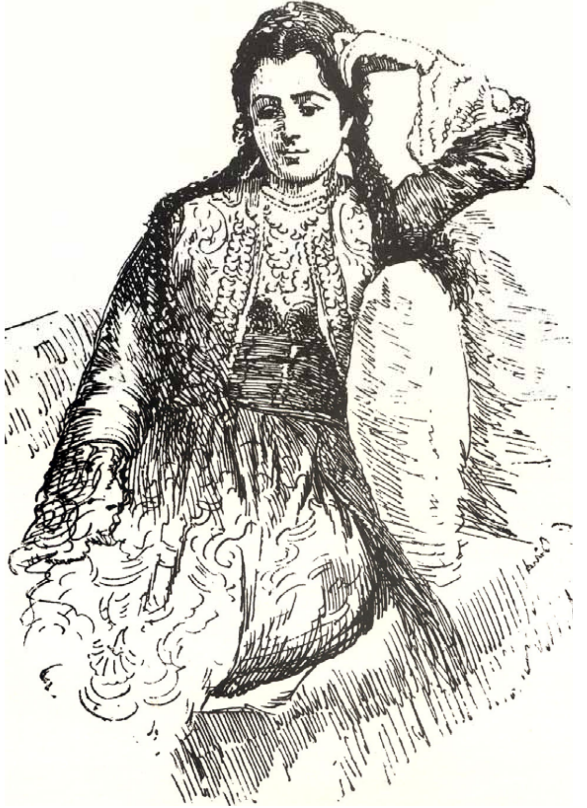
Resim III , Ermeni kadın. Gravürlerle Türkiye, c. VI, s. 109.