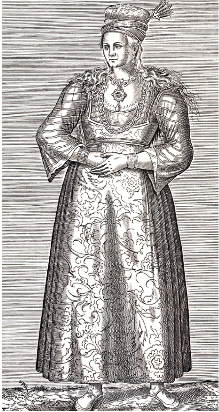
Resim I, Beyoğlu'nda bir Rum kızı. Gravürlerle Türkiye, c. VI, s. 100.