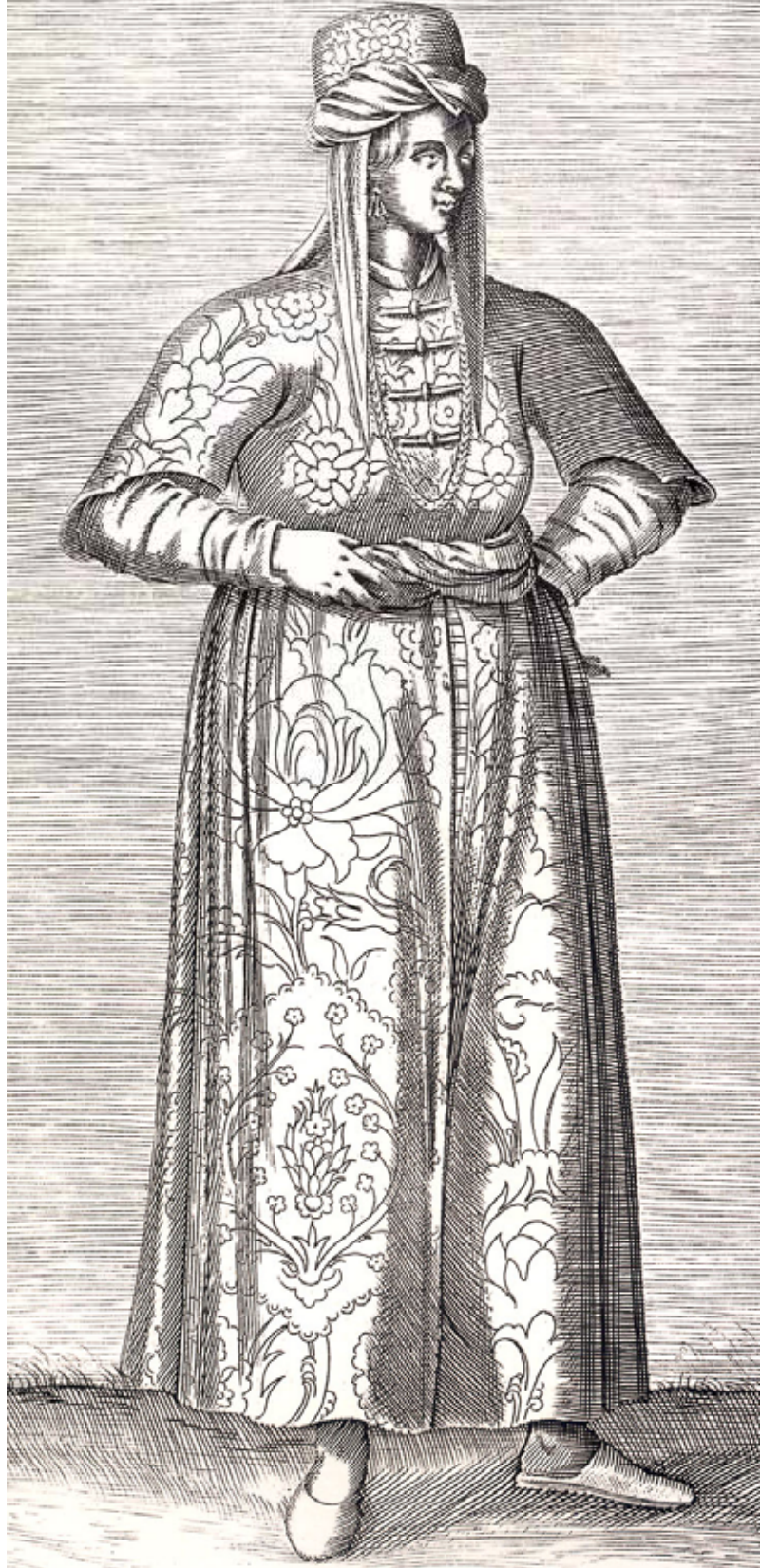
Resim II , Edirneli Yahudi kızı. Gravürlerle Türkiye, c. VI, s. 108.