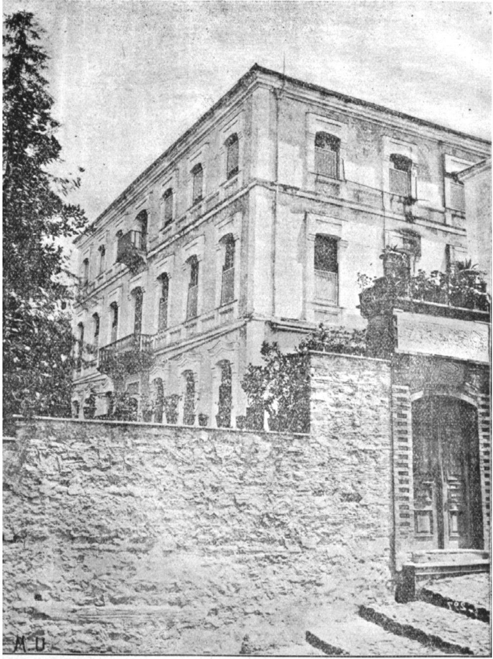
میرکون انات مکتب رشیدی