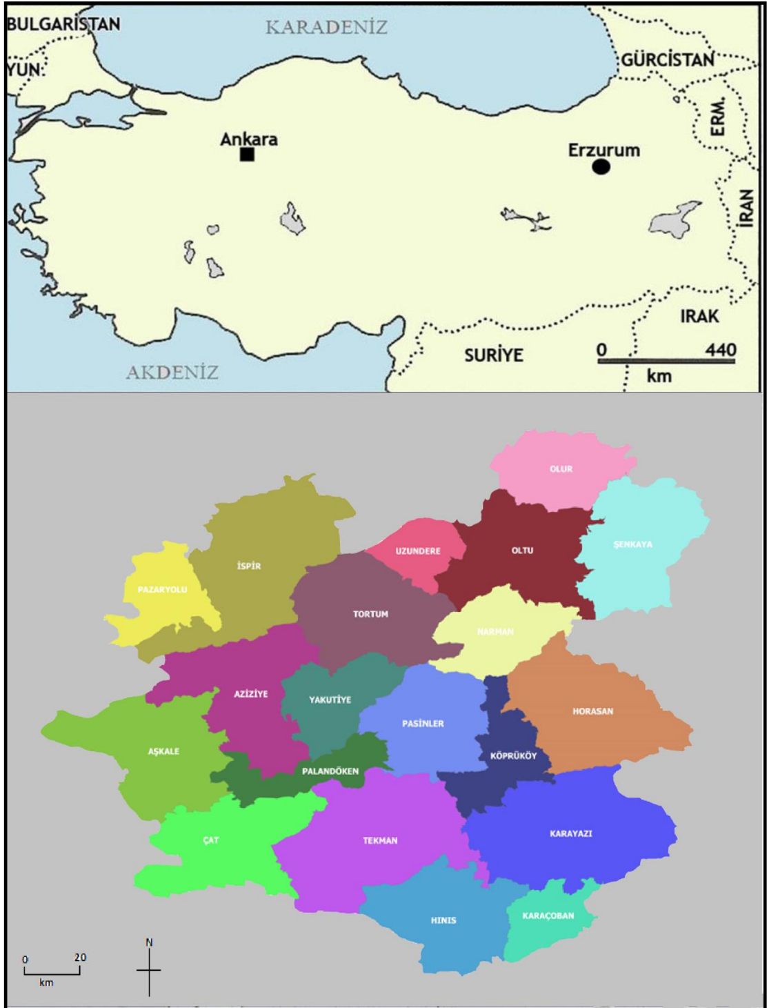
Harita 1. Çalışma Sahası Lokasyon Haritası

Erzurum bulunduğu coğrafyanın olumsuz koşulları bağlantılarını güçleştirmesine rağmen önemli kavşak noktalarında ki geçitler ile komşuları ile bağlantı