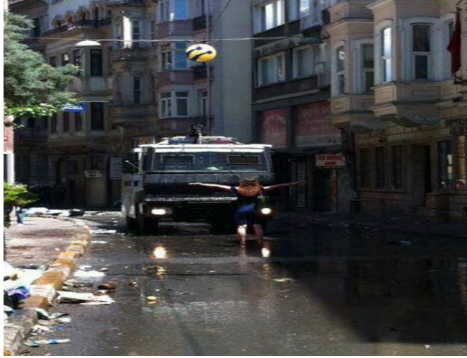
Tablo 3.4. Siyah Elbiseli Kadın (Diren Gezi Parkı)

Bu içerikler üzerinden şunlar söylenebilir: erkeğin baskısı, hâkimiyeti altında yaşayan kadın, toplumda sıkıştırıldığı çerçeveden hala çıkamamıştır. Polisin yaptığını haklı gören bu bakış açısı toplumda ataerkil sistemin sürdüğünün bir kanıtıdır.