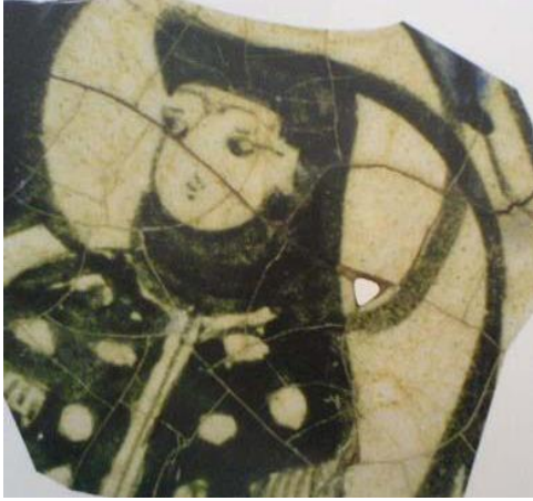
Resim 2.14. Kubadabad Sarayı'ndan Kadın Figürlü Çini Parçası Karatay Medresesi.(F.Özsoy)

Kubadabad Sarayından kadın figürlü çini parçasında Resim 2.14’de görüldüğü gibi, diğerlerinden farklı olan baş süslemesi, tepe kısmı düz bir başlık üzerine, baş ve yüzü çevreleyerek sarılmış olan bir örtü bulunmaktadır. Başın arkasından aşağıya doğru kalın bir bant şeklinde püskül sarmaktadır. 77