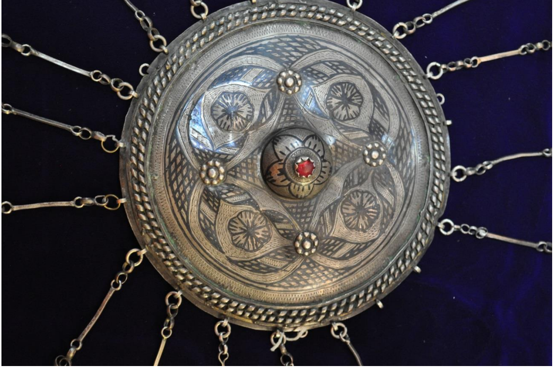
Resim 4.3.c Gümüş ve Altın Liralı Tepelik Detay (K. Mercimek).

Tepeliğin bu geniş bölümünde yine farklı bir teknik daha göze çarpmaktadır. Yapraklarla oluşturulan sarmalların kesiştiği noktalarda kabartma tekniğiyle oluşturulmuş dört adet çiçek süslemesi bulunmaktadır. Tepeliğin en dış bölümünde de gümüş telle yapılmış kıvrımlı bir süsleme unsuru görülmektedir. Bu kıvrımlı bölüm kompozisyonu kapatarak son bulmuştur.