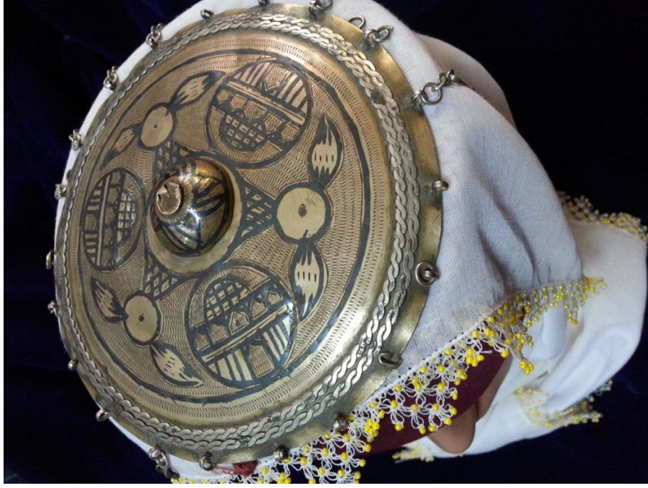
Resim 4.10.a. Gümüş Tepelik Detaylı Kompozisyon Görünümü.

Bu örnekte küçük kubbemsi bölüm yerindedir ve süslemeler buradan başlamaktadır. Küçük kubbenin merkez noktasında taş için olan bölümün zedelendiği görülmektedir. Taşı olmayan tepeliğin diğer kabartmalı motifleri de eksiktir. Tepeliğin kenarlarından sarkan birkaç tane zincir olsa da uçlarında liraları mevcut değildir. Yapraklar ve mimari formları andıran geometrik süslemeler, zemin desenlerini oluşturur.