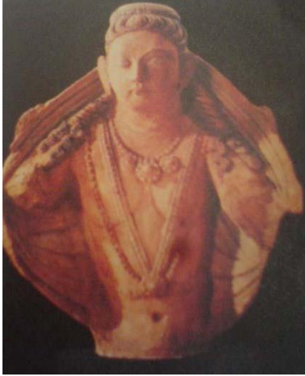
Resim 2.9. Kısa Fesli Kadın Figürü (F. Özsoy)

“Saçları geriye doğru toplanan figürün tepe kısmında geniş bir topuz görünümlü kısa bir başlık bulunmaktadır. Omuzlar üzerinde görünmekte olan saçlar kalın örgülüdür. Başlığın arkasından gelen örtü dökümlü kıvrımlar yaparak omuzlardan inerek arkada bele doğru toplanmaktadır.” (Resim 2.9). 70