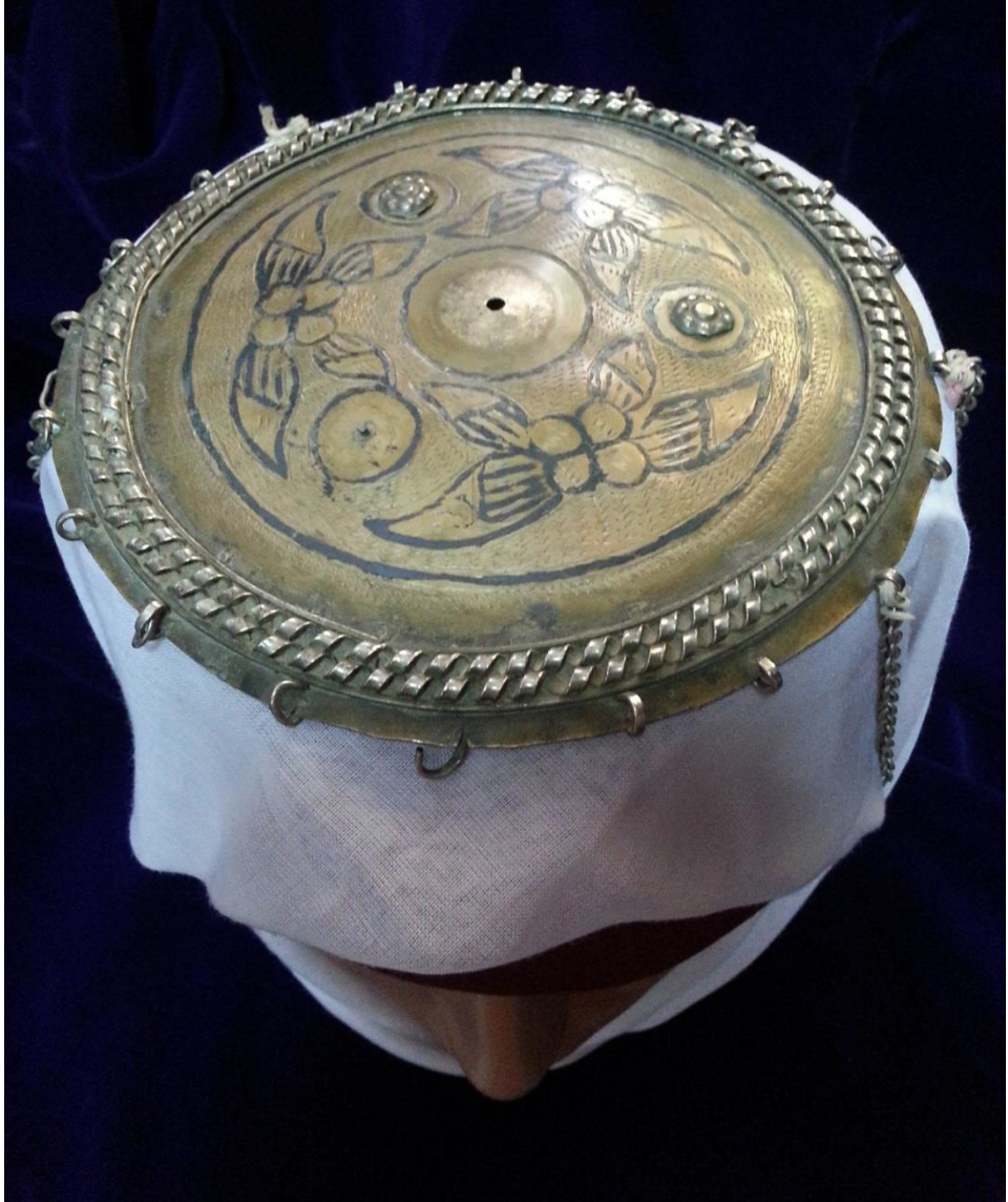
Resim 4.9.b. Gümüş Tepelik Detaylı Kompozisyon Görünümü (K. Mercimek).

Tepeliğin kompozisyonu, tepe noktasından başlayarak kenarlara doğru düzenlenmiştir. Üç grup halinde çiçek ve yapraklardan oluşmuş ve oldukça sadedir. Az sayıda bordürü bulunan örnek yine çift sıra sarmal kabartmalı teknikle sonlandırılmıştır.