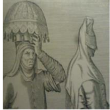
Resim 2.21. Hamama Giden Türk Kadınları ( Gravürlerle Türkiye , Cilt 1, Kültür Bakanlığı Yayınları, 2002, s:112)

Hamama giden Türk kadınları tasvirinde görülen başlıkta, başa yerleştirilmiş olan yüksek bir başlığın üzerine tepeden göğüs ve omuzları örterek bele doğru inen örtü bulunmakta ve bu örtünün arka uçları saçaklıdır. Yüze ise peçe şeklinde kenarları bordürlü ve sert görünümlü bir örtü ile örtülmüştür (Resim 2.21). 84