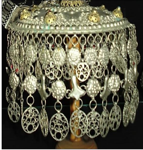
Resim 3.11. Gümüş, Altın ve Cam Taşlarla Süslü Tepelik (H.Murat Devrek)

Gelin Kıyafetleri: Gelin kıyafetleri çok göz alıcıdır. Damat evine gidecek gelin kızın başlığı gümüş takılarla süslenir. Fesin önüne orta kısmı taşlı gerdanlığa benzer gümüş saçaklı gümüş çiçeklerle donatılmış “alınlık” denilen bir takı takılır. Alınlık üzerine ortaya fesin iki yanına kulaklar üzerine iki taraflı taşlı gümüş takılar, kulakları kapatmasına dikkat edilerek yerleştirilir, böylece geline nazar değmesinin önüne geçilir