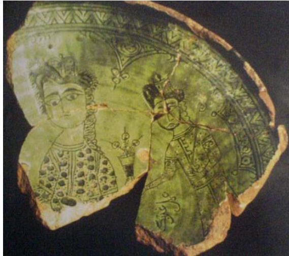
Resim 2.16. Kubadabad, Slip Tekniğinde Tabak Parçası, Konya Karatay Müzesi (F.Özsoy)

Tokat ve Konya Karatay Müzesinde bulunan tabak parçalarında (Resim 2.15) ve