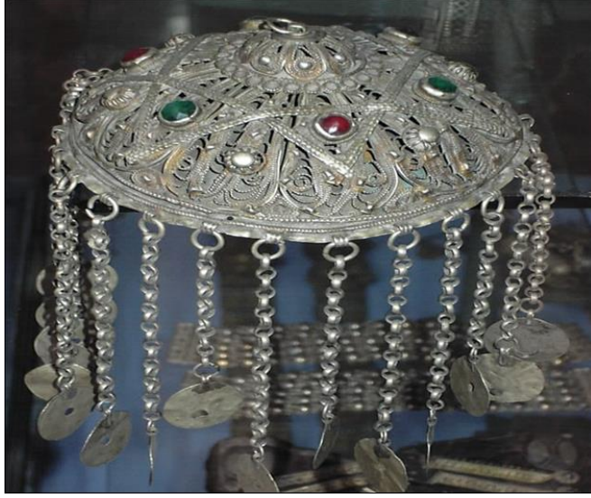
Resim 3.10. Gümüş Tepelik (M. Devrek).