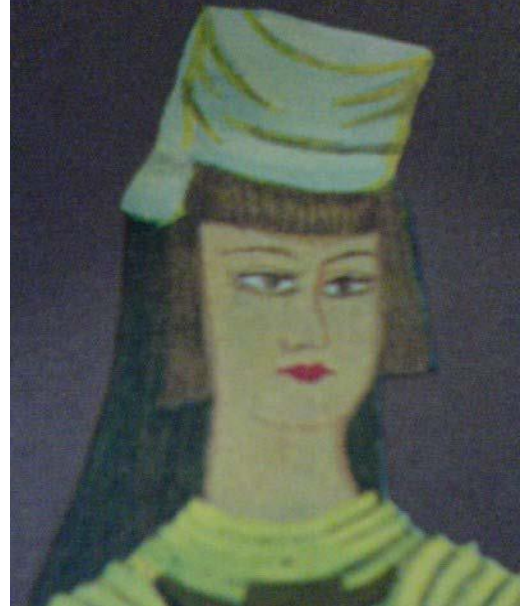
Resim 2.6. Hotoz (F. Özsoy)

“Von le Coq’un albümünde görülen resimler arasında bilhassa genç kızların saçlarının, tepelerinde kok’a benzer bir topuz halinde toplandığı görülüyor (Resim.2.5). Başa sımsıkı sarılı ince ince örgülere mukabil burada önde alın boyunca bir kâkül kesilmiş, saç arkada, enseden itibaren tam tepede toplanmıştır. Japonya’da erkek çocukların saçlarını hala buna benzer şekilde yukarda toplayıp bir kurdeleyle dibinden bağladıkları görülmektedir.” 66