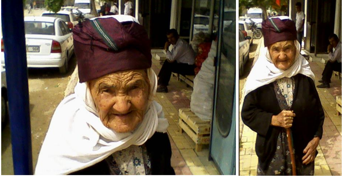
Resim 4.11. Kahramanmaraş İli Yaşlı Kadınların Baş Bağlama Şekillerine Günümüzde Rastlanan Bir Örnek (H. F. Derbent).

Resim 4.26’da Kahramanmaraş il merkezinde yaşlı bir kadının baş bağlama şekli şu şekildedir. Fesin altında bulunan beyaz kenarı oyasız tülbent çene altından bağlanır. Sonra tülbentin üzerine fes takılır. Fesin takılmasıyla birlikte bir ikinci tülbent daha takılarak omuz üstüne bırakılır. Daha sonra etrafını çevreleyen bordo renkli bir eşarp sarılarak bağlanır, altına gelen kısımda ise uç kısımlar saçaklı olan bölüme denk getirilir.