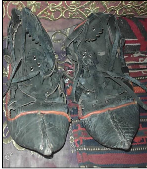
Resim 3.2. Ham Çarık. (H.M.Devrek)

Edik Yapılışı: Yüz kısmı teke sahteyinden (yaşlı tekedan), içi (astarı) koyun derisinden kaplama yapılır. Boğaz kısmında püskül, topuk kısmında demirden yapılmış nalça olur ve çivileri elde yapılmıştır. Gelinler kına gecesinde Edik giyerler. Ediğin boğaz kısmı bol olduğundan kına gecesinde edik'in boğaz kısmına geline akçe, altın, para takılır. Gelin erkek evine gittiğinde düğünden sonra Harçlık yapılır. Edik'de yemeni gibi beş renkte yapılır. Siyah, sarı, portakal rengi, hardal rengi ve kırmızı renklerden yapılır.