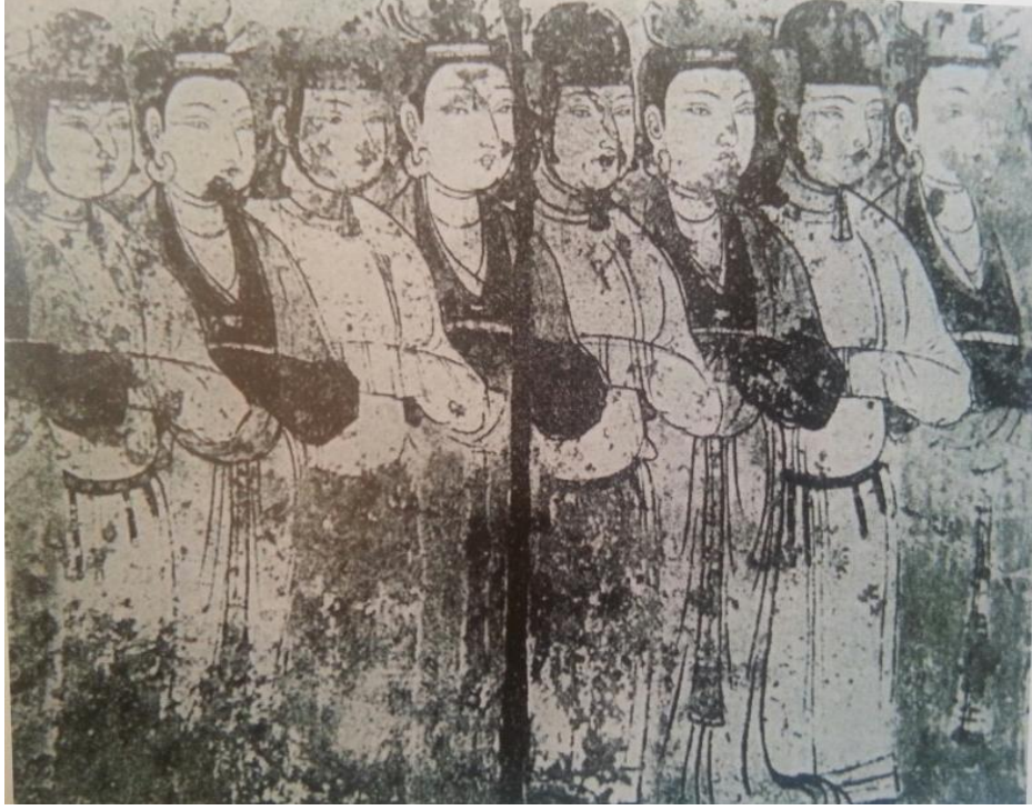
Resim 2.7. Sorçuk, Uyghur freski, Kadın ve Erkek Vakıfçılar (O. Aslanapa)

“Sorçuk’tan 83x59 cm. ölçülerindeki bir freskte kız ve erkek genç Uyghur vakıfçıları tasvir edilmiştir, eser VIII-IX. Yüzyıllara aittir. Bir kız, bir erkek olarak sıralanmış on vakıfçı sıkışık halde yan yanadır, figürler portre özelliği göstermektedir. Erkekler sakalsız, sadece daha koyu cilt rengi ile kızlardan ayrılıyor. Hepsı yuvarlak yüzlü, badem gözlü, iri burunlu, küçük ağızlıdır. Kıyafetler farklıdır. Erkeklerin kırmızı ve siyah keçeden yuvarlak başlıkları kırmızı ve siyah şeritlerle çeneye bağlanmıştır. Kızların koyu siyah saçları tepede çift topuz halinde toplanmış, alındaki beyaz tarak ve yanlardaki süs firketeleri ile göze çarpar. Kulaklarda kalın halkalar şeklinde iri altın küpeler var.” (Resim 2.7). 68