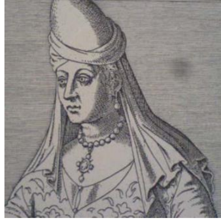
Resim 2.17. Evde ya da Sarayda Türk Kadını ( Gravürlerle Türkiye , Cilt 1, Kültür Bakanlığı Yayınları, 2002, s:110)

Baş çevresinin üzerine yerleştirilmiş olan başlığın ucu hafif öne eğimli olup tepe