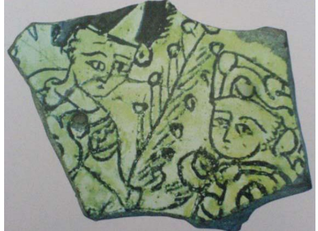
Resim 2.15. Sgraffito Desenli, Renksiz Sırlı Tabak Fragmanı, Tokat Müzesi. (F.Özsoy)