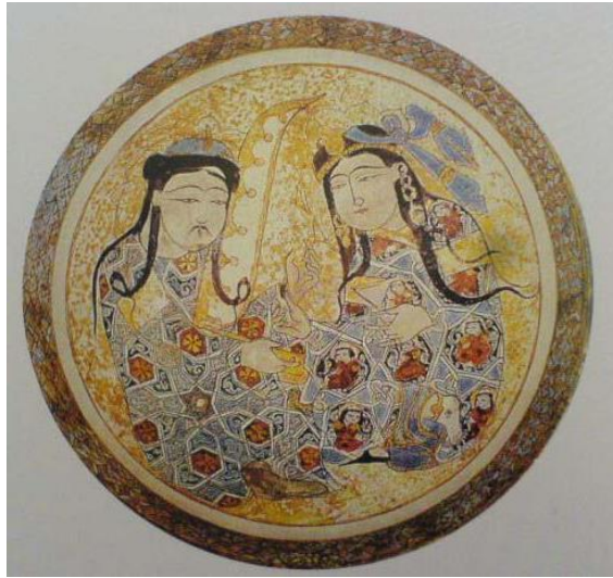
Resim 2.11. Seramik Tabakta Minyatür, İran. (F. Özsoy)

“Saç örgüleri bazen bele kadar iniyordu; buna “sığan saç” deniyordu. Saçlarını uzatma ve örme geleneği Anadolu’da sürdürülmüştür. Saç tümüyle uzatılmasa bile bir perçemi uzun bırakılırdı. Örülü erkek saçları için “yülidi”, kadın saçları için “örgüç” denilmekteydi. Örgülü saçla bazen keçi kılından takma zülüfler eklenirdi. Uzun saç modası, Memluklere kadar yayılmıştır. Buna “art saç” deniyordu.” 75