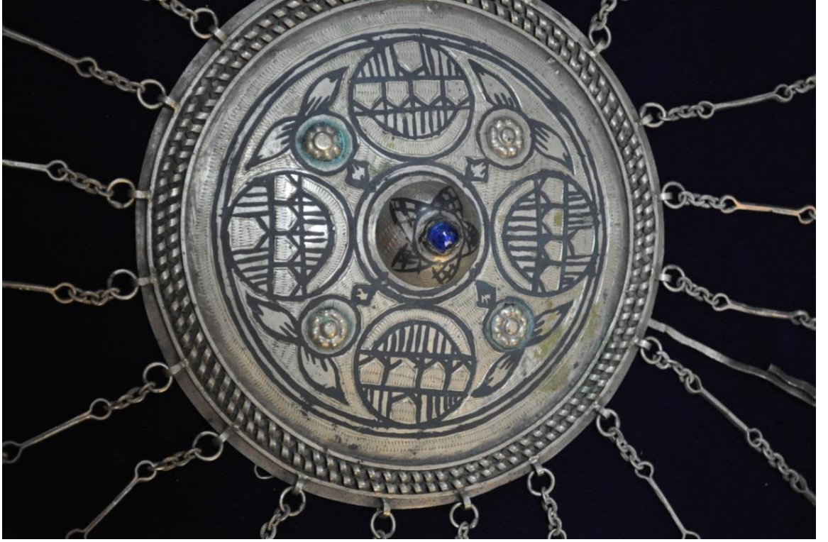
Resim 4.6.c. Gümüş, Mavi Taşlı, Altın Liralı Tepelik (K. Mercimek).

Mavi taşlı bu tepelikte kompozisyon büyük oranda geometrik bir süslemeden meydana gelmektedir. Dört adet büyük yuvarlak içerisinde geometrik hatta daha çok mimari unsurları andıran süsleme öğeleri göze çarpmaktadır. Etrafını çepeçevre saran zincir halkaları, buralara liralara asılabileceğini de göstermektedir.