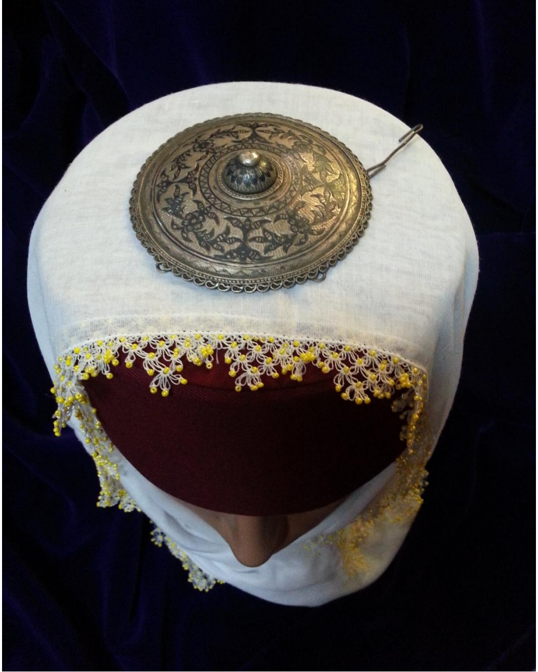
Resim 4.2.b. Gümüş Tepelik Genel Görünüm (K. Mercimek).

Yine bu örnekte de Resim 4.1.b'deki tepelikte görülen kanca biçimli metal bir parça bulunmakta, bu da tepeliğin sarkan bölümlerini işaret etmektedir. Tepelikler ile ilgili herhangi bir bilgi verilmediğinden varsayımlara dayanarak yine bu bölümlerde altın veya gümüş liralara bulunduğu söylenebilir.