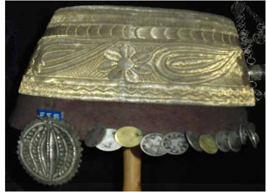
Resim 3.8. Sim Sırmalı Fes (H.Murat Devrek)