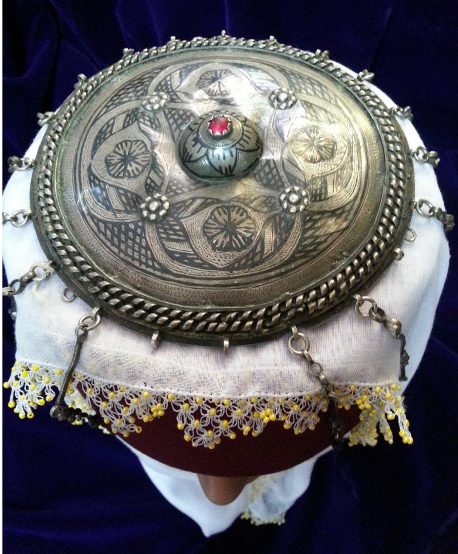
Resim 4.3.b. Gümüş ve Altın Liralı Tepelik Detaylı Kompozisyon Görünümü (K. Mercimek).

Merkezi noktası yine küçük bir kubbe şeklinde başlayan tepeliğin kubbesinin üzerinde kırmızı renkli bir taş mevcuttur. Ana kompozisyon küçüklü büyüklü bordürlerden oluşmaktadır. Tepe noktasından başlayan işlemler taşın yerleştirildiği noktanın etrafından bir çiçeğin taç yapraklarını oluşturan ve merkezi noktasında da taşın yer aldığı görülmektedir. Bu bölümden sonra en geniş bordür diye nitelendirdiğimiz kısımda çiçek ve yaprak motifleri ile birlikte sarmallar oluşturulduğu görülmektedir. Geometrik ve bitkisel unsurların bir arada kullanıldığı bir örnektir.