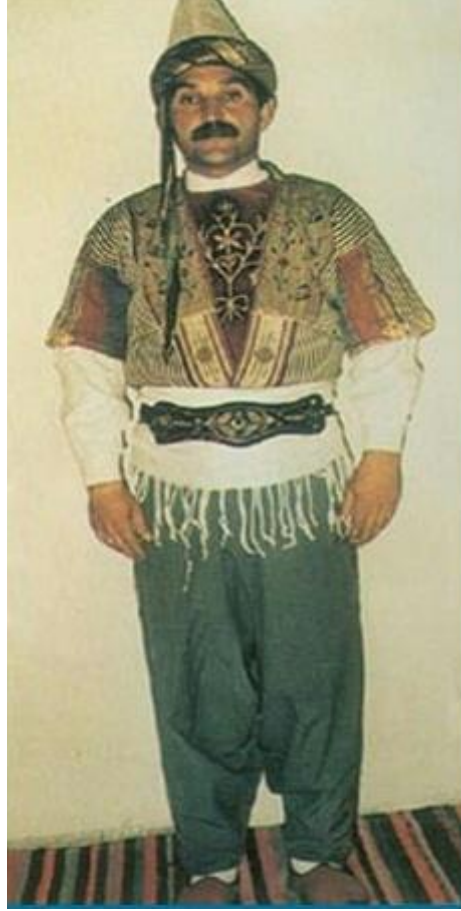
Resim 3.1. Kahramanmaraş Erkek Giyimine Örnek

Zıbın: Uzun gömlektir. Yakası hakim yaka ön tarafına 3 düğme kullanılır, geri tarafı düğmesizdir ve kapalıdır. Kolları düz (manşetsiz) düğmesizdir. Renk olarak çizgili ve düz renkler kullanılır (Kurşuni renk çok kullanılır). Zıbınlarda bel hizasında tek cep kullanılır. Boyu diz kapağa kadar uzanır.