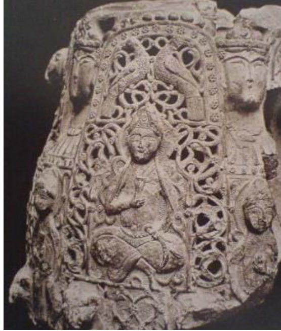
Resim 2.13. Ajur Tekniği ile Yapılmış Büyük Selçuklu Keramik Küp Parçası (F. Özsoy)

Melek tasviri İslam sanatında Hıristiyan dünyasından esinlenilmiş ve az rastlanan bir figürdür. Bu figürde saçlar, iki kalın örgü yapılmış, başın ortasına ve başa kabartma ve oymalı başlık yerleştirilmiştir (Resim 2.12).