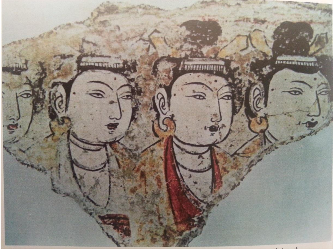
Resim 2.8. Vakıf Yapan Prensesler (O. Aslanapa)