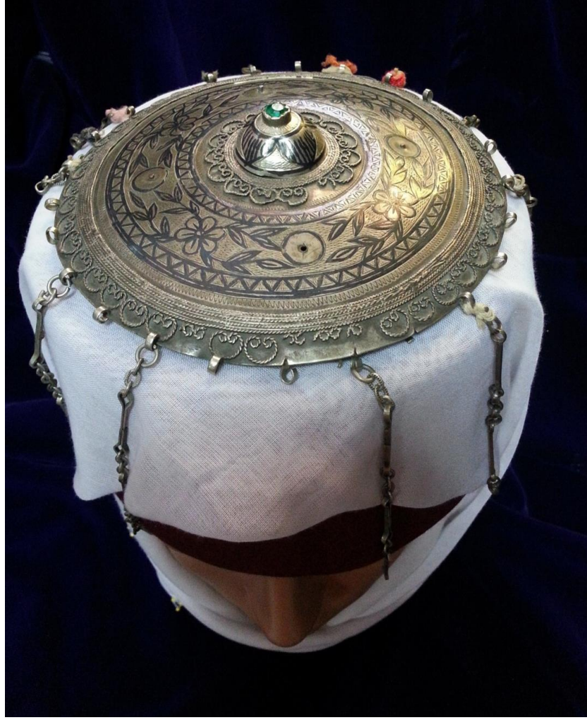
Resim 4.5.c. Gümüş, Yeşil Taşlı, Altın Liralı Tepelik Detaylı Kompozisyon Görünümü (K. Mercimek).

Yine çiçek ve yaprak motifleri ile bezenmiş olan tepeliğin geniş bölümünde dört adet küçük yuvarlak yer alır. Bu yuvarlakların ortasındaki delikler dikkat çekmektedir. Bu delikler burada kabartma tekniği ile yapılmış ve bu bölümlere monte edilmiş motifleri işaret eder. Bu yargıya bir önceki tepelik örneği göz önüne alınarak varılabilir. Tepelik hasara uğraması sebebi ile buradaki motifler mevcut değildir. Yine dar bordürlerle ve zarif telkâri örneği ile kapatılan kompozisyon sonunda liralardan takıldığı halkalar mevcuttur. Maalesef bu örnek de yine diğerleri gibi tahribata uğramış ve gerektiği gibi korunamamıştır.