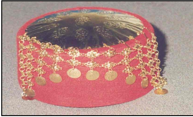
Resim 3.7. Penesli Kırmızı Fes (H.Murat Devrek)

Fes: Keçeden yapılır, iç kısmına silindir şeklinde kalıp koyulup sertleşmesi sağlanır. Fesin de farklı şekil ve modelleri vardır. Yüksek olanları veya alçak basık olanları olabilmektedir. Yaşlı kadınlar genellikle alçak kalıpsız olanları kullanırken, gelinler daha hacimli ve kalıplı olanları kullanmaktadır. Fesler kişinin ekonomik durumuna göre sim sırmalı ve penesli süslü olabildiği gibi sade olup üzerine tepelikle kullanılanları da mevcuttur. Evlenecek olan genç kıza nişanında erkek tarafı ekonomik durumuna göre sim sırmalı veya altına gelen ön kısmı altın veya gümüş liralarla sıralanmış fesler takarlar. Bordo ve kırmızı renkleri mevcuttur. 114