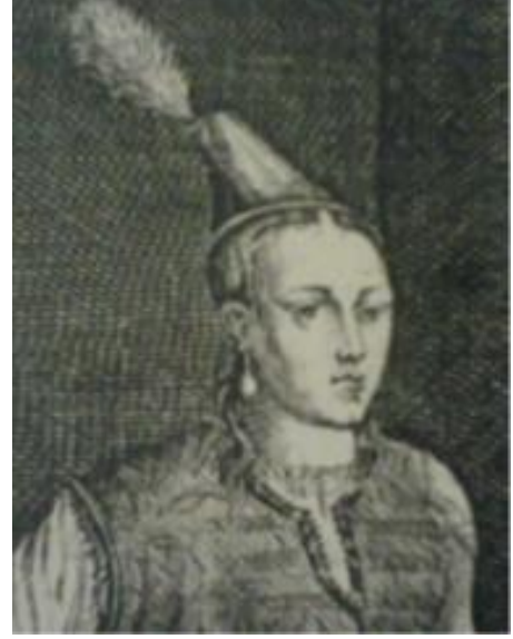
Resim 2.20. Türk Kadını ( Gravürlerle Türkiye , Cilt 1, Kültür Bakanlığı Yayınları, 2002, s:158)

Ortadan ayrılarak taranmış olan saçlar sırt üzerine doğru arkada örgülüdür. Başın tepe kısmında yukarıya doğru daralan koni şeklinde başlığın ucunda büyükçe uzun tüy bulunmaktadır (Resim 2.20). 83