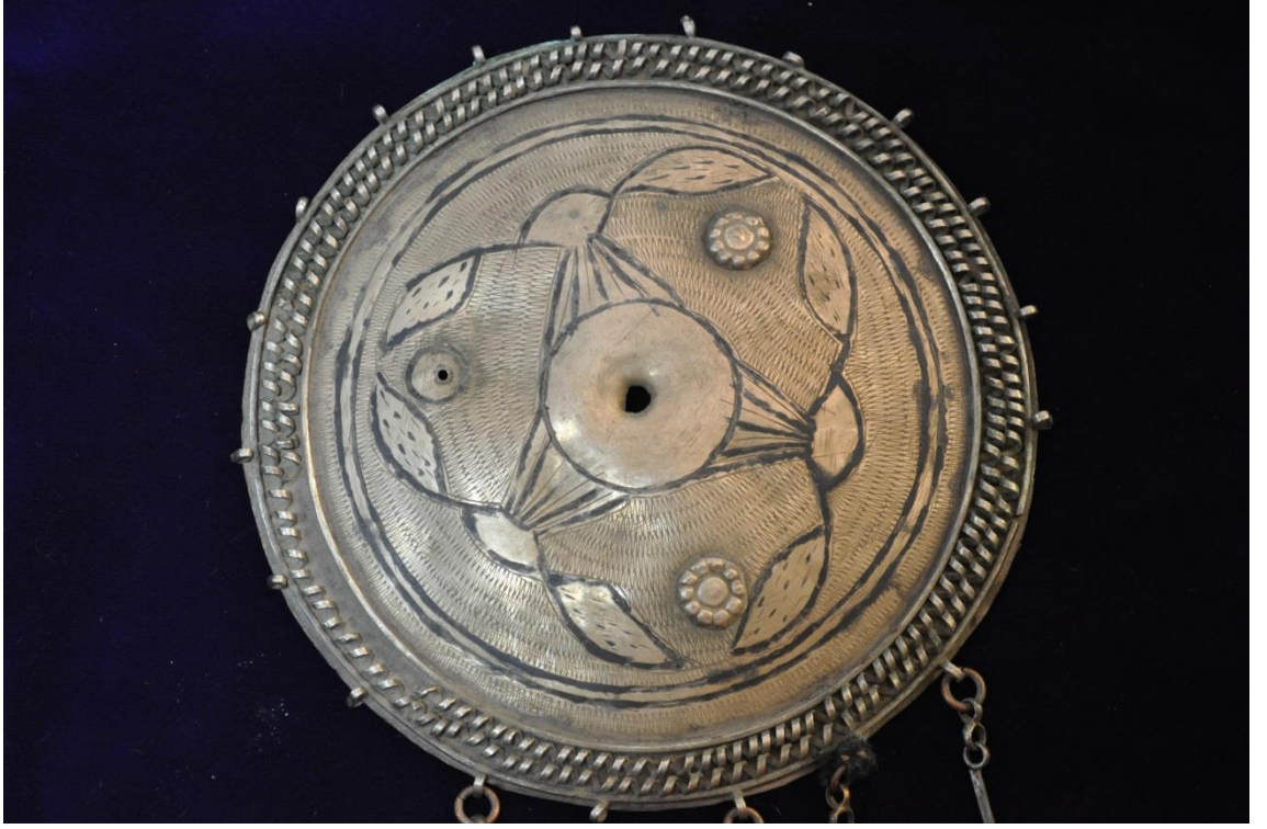
Resim 4.8.a. Gümüş Tepelik Genel Görünümü (K. Mercimek).

Çok fazla tahrip olmuş örneklerdendir. Tepeliğin sadece ana bölümü mevcut durumdadır. Üzerindeki süslemelerin, liralardan olmadığı görülmektedir. Yine yaprakların geometrik unsurlarla birlikte oluşturduğu bir kompozisyon bulunmaktadır.