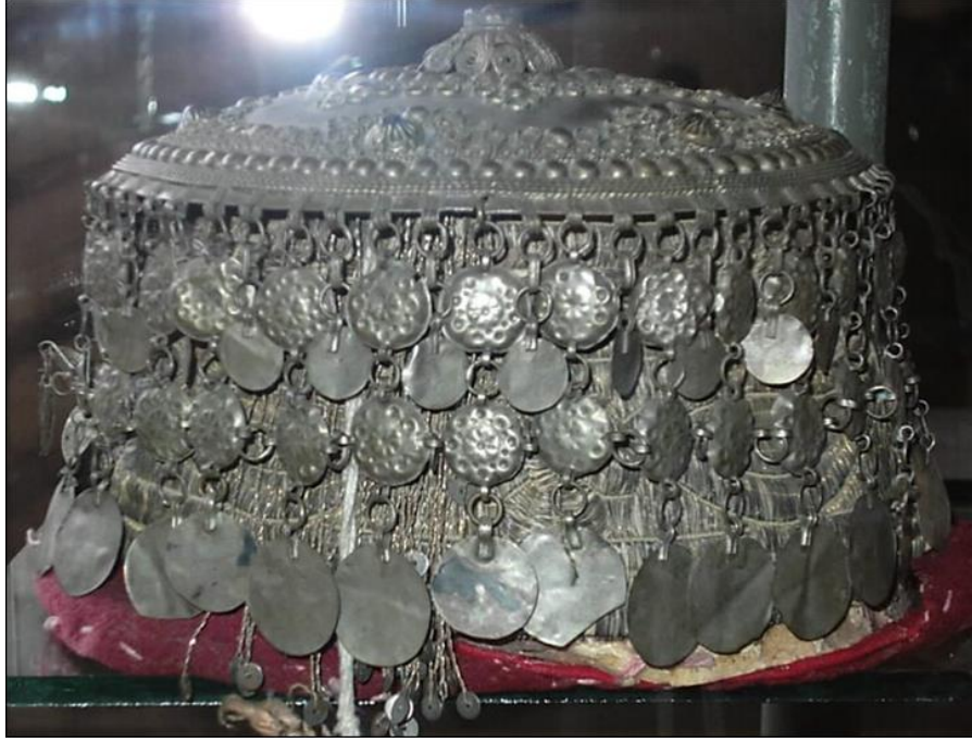
Resim 3.9. Gümüş Liralı Bordo Fes (H.Murat Devrek).

Tepelik: Tepelikler genellikle sade veya alın bölümü sıralı lira bulunan feslerin üzerine veya başlıkların üzerine örtüden sonra en üst bölümde duracak şekilde yerleştirilir. Tepelikler ekseriyetle gümüş ve altından yapıp ustasının maharetlerini gösterdiği ve çoğunlukla da gelin başları yapılırken yani baş bağlanırken kullanılan ihtişamlı ve süslü bir takıdır. Üzeri çiçek motifleri, geometrik motiflerle bezenmiş kıymetli taşlarla süslenmiş olanları mevcuttur. Silindirik gümüş veya altın tabaka özenle işlenmiş olup etrafı kulak hizasını geçecek şekilde sarkan zincirler, helezonlarla çepeçevredir. Bu her bir zincirin ucunda kimi zaman altın liralara, kimi zamanda altından işlenmiş çeşitli motifler ve yahut kıymetli taşlar bulunmaktadır. 115