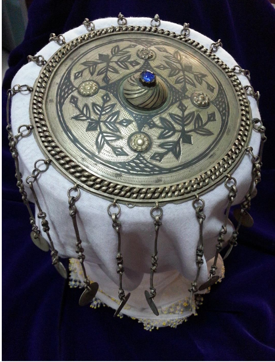
Resim 4.7.b. Gümüş, 2. Mavi Taşlı Örnek Tepeliğin Detaylı Kompozisyon Görünümü (K. Mercimek)

İç düzeyi düz olan tepeliğin ortaya doğru hafif bombeli bir yapısı vardır. Yine küçük bir kubbeyle başlayan tepeliğin merkez noktasında mavi bir taş bulunmaktadır. Kubbenin üzeri ise hafif bir sarmaldan oluşmaktadır. Gümüş tepeliğin üzerinde gümüş liralari eksiksiz durumdadır. Bitkisel formlardan oluşan süslemesi oldukça düzgündür. Kenarlarında metal bir telin sarmal bir şekilde kıvrılmasıyla oluşturulmuş zencerek tarzında iki sıra süsleme bandı bulunur.