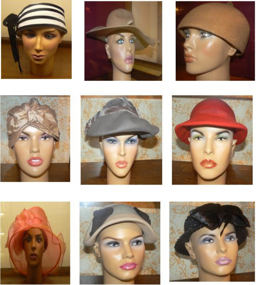
Resim 2.22. Cumhuriyet Döneminde ve Sonrasında Kullanılan Şapkalar (Mimar Vedat Tek Kültür ve Sanat Merkezi, Kastamonu) (F.Özsoy)