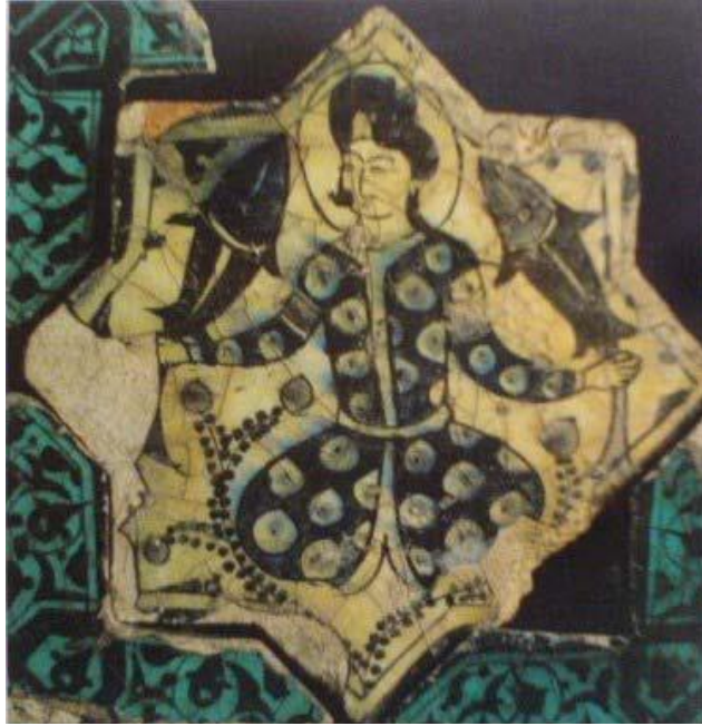
Resim 2.10. Beyşehir Kubadabat Sarayı Duvar Çinisi (F. Özsoy)

Kubadabad Sarayı'nın çinilerinde (Resim 2.10), ellerinde balık tutan figürde, Türk usulü bağdaş kurmuş durumda resmedilmiştir. Saçlar arkaya doğru toplanmış ve alın kısmına doğru yüksekçe bir topuz yapılmıştır. Alın üzerine toplanan saçın üzerine üçgen şeklinde bir süsleme bulunmaktadır. 72