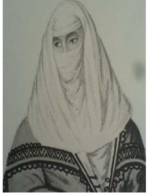
Resim 2.18. Türk Kadını (Gravürlerle Türkiye, Cilt 1, Kültür Bakanlığı Yayınları, 2002, s:157)

Baş örtüsü iki parçadan oluşmakta ve feraceyi andırmaktadır. İçteki parça, ağız ve burunu örterek, başa geçirilmiştir. Diğer parça, yine baş üzerinden geçirilerek, omuzları da örterek önde birleştirilmiştir (Resim 2.18). 81