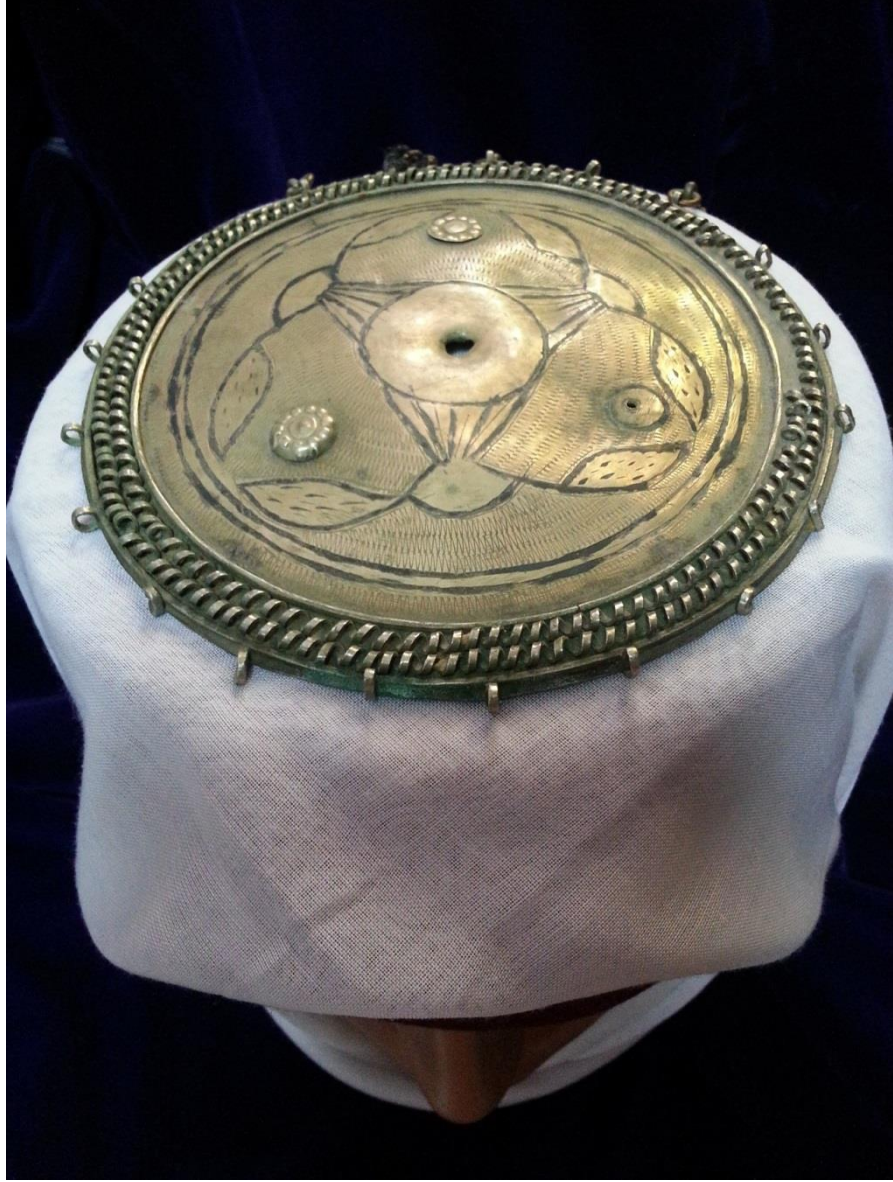
Resim 4.8.b. Gümüş Tepelik Detaylı Kompozisyon Görünümü (K. Mercimek).

Tepeliğin orta kısmındaki delik burada küçük kubbemsi parçanın bulunduğunu işaret etmektedir Diğer örneklerde olduğu gibi yapraklarla bölünmüş alanların bağlayıcı kabartmalı çiçekleri görülmektedir. Bunlardan iki tanesi tepelik üzerinde iken üçüncüsü yoktur. Sade bir kompozisyona sahip olan tepeliğin kompozisyonu yine kıvrımlı sarmallarla kapanmıştır. Fakat bu sarmallar da yer yer kırıktır.