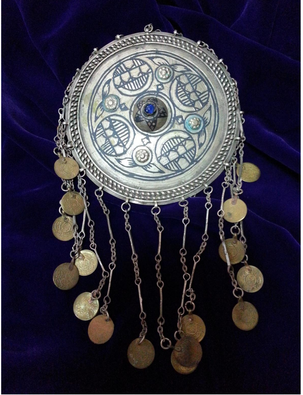
Resim 4.6.b. Gümüş, Mavi Taşlı, Altın Liralı Tepelik Detay (K. Mercimek).

Yuvarlak olan bölüm gümüştür, zincirlerin ucundaki liralar ise altın rengidir. Yine müzeden gerekli bilgiler alınamadığından liralarmın altın mı yoksa başka bir maden mi olduğu anlaşılamadığı için bu konu ile ilgili detaylı bilgi verilememektedir.