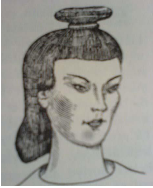
Resim 2.5. Uygurlarda Kadınların Baş Tuvaleti (F. Özsoy)