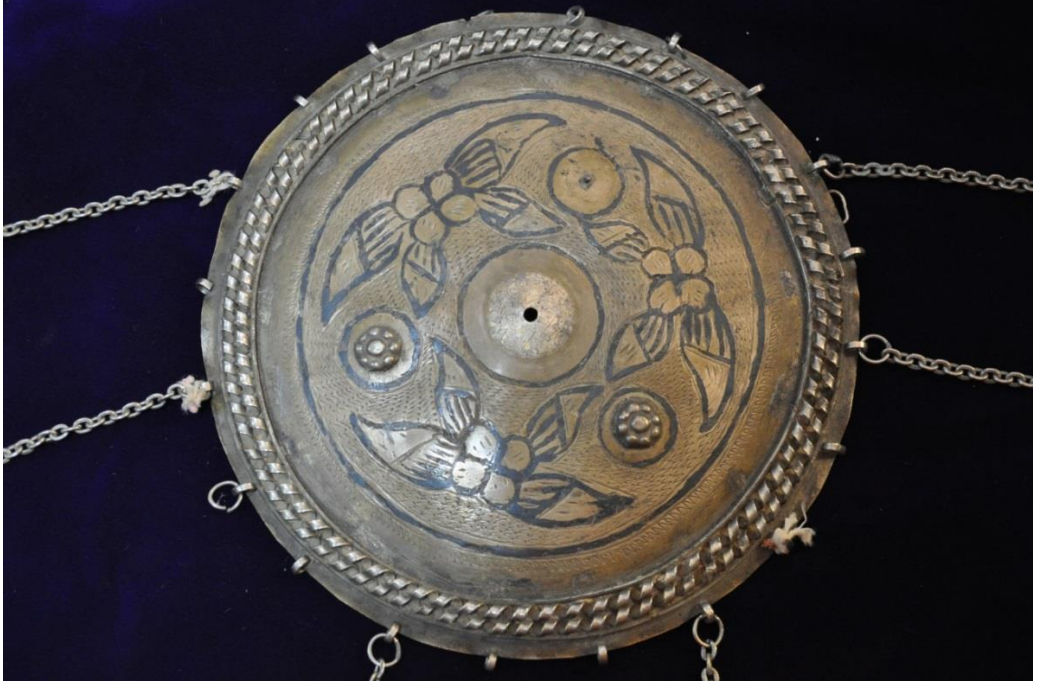
Resim 4.9.a. Gümüş Tepelik Detay Görünüm (K. Mercimek).

Resim 4.8.a nolu tepeliğin eşidir. Bu örneğin de temel bölümü mevcut durumdadır. Tepeliğin merkez noktası yani küçük kubbeyi andıran bölümü yine yoktur. Üzerindeki bağlayıcı küçük kabartmalı çiçeklerden biri de eksiktir. Tepeliğin kenarlarından 6 adet zincir sarmaktadır fakat uçlarında liraları yoktur.