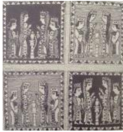
Resim 2.3. V. Pazırık Kurganında Bulunan Dokuma Örneği Çizimi (F. Salman)

“V. Pazırık kurganında bulunan goblen tekniğindeki bir dokuma parçası üzerinde çeşitli kadın figürlerinin işlendiği görülür. Uzmanlar buradaki kadın figürlerinin, mitolojik bir konuyu canlandırdığını söylemektedirler. Figürler çok net seçilmese de, soylu kadınların buhurdanlıkla ayin yaptıklarını veya ayine hazırlandıklarını yansıtmaktadır. Tanrıçaların başlarında birer taç bulunmaktadır. Kendilerine hizmet eden küçük kadın figürlerinde de taç olduğu görülmektedir. Ancak ortadaki figürlerin başlarındaki taçlardan aşağıya doğru bir örtü inmektedir” (Resim 2.3). 62