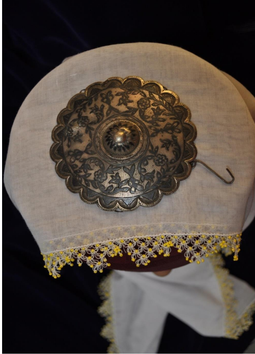
Resim 4.1.b. Gümüş Tepelik Genel Görünümü (K. Mercimek).

Tepelik fes üzerine, içerisindeki kancalarla sabitlenebilecek bir şekildedir (Resim 4.1.b). Tepelik üzerinde bulunan kancalı metal parça, tepeliğin belirli noktalardan liralara sarktığı, uçlarında liralara veya metal pulların olabileceğini işaret eder. Envanter defterinin gösterilmemesi sebebi ile tepelik ile ilgili herhangi bir bilgi edinilememiştir.