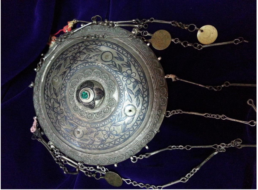
Resim 4.4.b. Gümüş Yeşil Taşlı, Altın Liralı Tepelik Genel Görünüm (K. Mercimek).

Bu tepelikte kompozisyon hemen hemen tüm tepeliklerde görüldüğü gibi yuvarlak ve küçük bir kubbe merkezi noktada da bulunmaktadır. Tepedeki küçük kubbe bir çiçeğin üstten görünümünü andırır biçimde düzenlenmiş, çiçeğin merkezi noktasını ifade eden bölüme yeşil bir taş yerleştirilmiştir. Bu bölümden sonra zarif bir telkâri işi göze çarpmaktadır. Bu bordürün bir tekrarı en son bordürde de görülmektedir. Böylece kompozisyonda bir bütünlük sağlanmıştır.