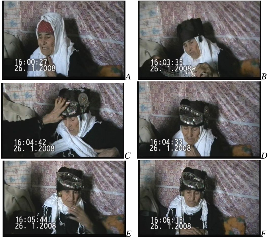
Resim 4.12. Kahramanmaraş ili Çağlayancerit İlçesinde Rastlanan Hâlâ Takıları ve Fesi ile Baş Süslemesini Yapan Yaşlı Kadın Örneği (H.F.Derebent).

Kahramanmaraş ili Çağlayancerit ilçesinde yaşlı kadın baş bağlama ve takıları görülmektedir. Öncelikle Resim 4.12-A resmindeki gibi ilk önce başa saçları tamamen içine alan bir örtü bağlanarak fesin takılacağı zemin hazırlanmıştır. Daha sonra beyaz pamuklu tülbent çene altından sabitlenmektedir. Kahramanmaraş'ta da Anadolu'nun hemen her bölgesinde görülen renkler ve anlamları genellikle aynıdır. Bu örnekte de görüldüğü üzere fesin üzerine siyah baş örtüsü çepecevre bağlanmaktadır (Resim 4.12-B). Beyaz tülbent (şeş) çenenin altından bağlandıktan sonra boyundan dolanarak uçları önlerden serbest bırakılmıştır (Resim 4.12-C, D, E, F).