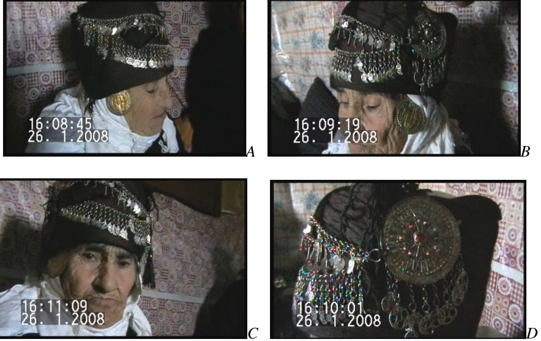
Resim 4.13. Kahramanmaraş İli Çağlayancerit İlçesi Kadın Baş Bağlama Örneği (H. F. Derebent)

Tülbent ve eşarpların bağlanmasından sonra takılar takılarak baş süslemesi tamamlanmıştır. Başın en üst bölümüne takılan takının altına gelen bölümü, renkli cam boncuklar ve yaprak şeklinde gümüş parçalarla süslenmiştir. Sıralı zincirlerin bir tarafında büyük yuvarlak bölüm yine cam boncuklarla ve kabartmalı desenlerle süslenmiştir. Yine bu parçanın uç kısımlarından yuvarlak parçalar sallanmaktadır. Yanaklarının hizasında dulukluk denilen dövme altından yapılmış takılar mevcuttur.