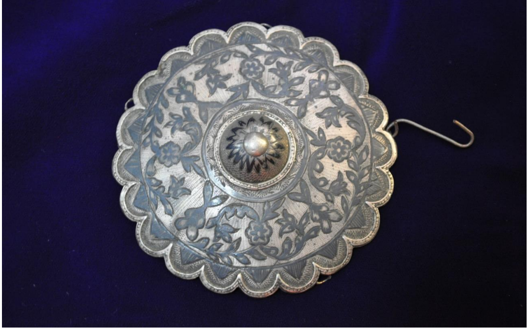
Resim 4.1.a. Gümüş Tepelik Detay Görünüm (K. Mercimek).

Kahramanmaraş müzesinde bulunan gümüş tepelik çiçek ve yaprak motifleri ile bezenmiştir (Resim 4.1.a). Kenar kısımları yarım daireler şeklindedir. Ortası küçük bir kubbe şeklinde yükselmiş olan tepeliğin bu parçası çıkarılıp takılabilen bir düzeneğe şeklindedir. Tepeliğin sadece ana gövdesi muhafaza edilmiştir. Tepeliğin yanlara takılan zincirleri ve liralari mevcut değildir.