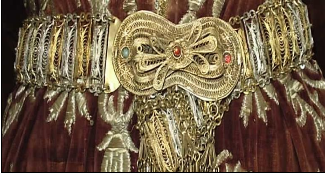
Resim 3.5. Kahramanmaraş Kadın Giyiminde Telkâri Altın ve Gümüş Kemer (H. Murat Devrek)

Çorap: Pamuk veya yün iplikten dokunur, giyen kişinin yaşam ve konumuna göre nakışlı veya nakışsız olarak elde kirmen ile yapılır. Genellikle yünden yapılan çoraplar giyilir ve renk olarak doğal yün renginde olur. Soğuk havalarda yün çoraplar giyilirken sıcak havalarda pamuklu çoraplar giyilir.