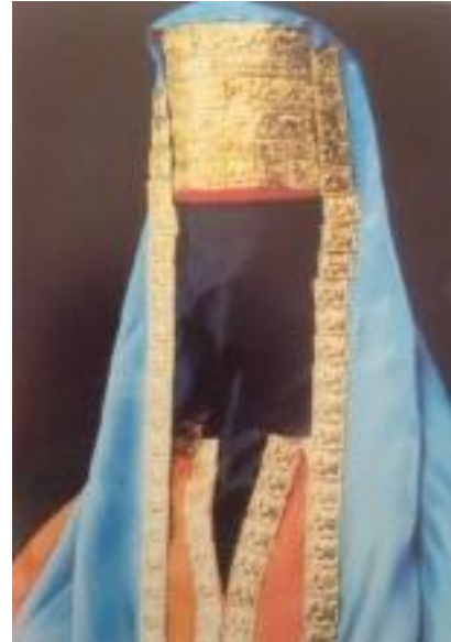
Resim 2.1. İskit Kadın Başlığı (F. Salman) Resim 2.2. İskit Kadın Başlığı (F. Salman)

“İskit kadınlarının giysilerinin en belirgin özelliklerinden biri hiç şüphesiz fese benzeyen ve çeşitli formlarda olabilen başlıklardır. Bu başlıklar, Yunanlıların calathos olarak tabir ettiği ve dini törenlerde din adamlarının giydiği bir kıyafet parçası olarak nitelenmektedir. Oysa İskit kadının giyimini oluşturan ve hemen her kurganda görülen