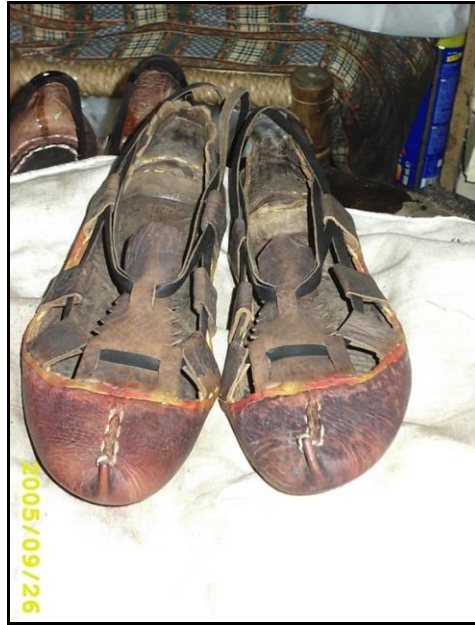
Resim 3.3. Karadağlı Çarığı (H.Murat Devrek)

Günümüzde imalatı tek olup, tarihi Selçuklulardan Osmanlılara kadar uzanan ayakkabılardır. Bunlar; postal, edik, kelik, yemeni, saray yemenisi, Karadağ çarığı adıyla isimlendirilir (Resim 3.3). Bunların derisinden ipliğine kadar her şeyi elde imal edilir. İmalatın hiçbir aşamasında kimyasal madde kullanılmaz. Derilerin boyama aşaması ağaç ve bitki köklerinden, toprak boyadan yapılan kök boya ile yapılmıştır. İplikler saf pamuktan olup, balmumu ile mumlayarak suya ve çürümeye karşı dayanıklı olması sağlanır. 97