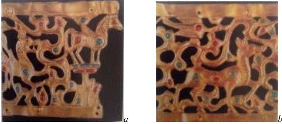
Resim 2.4. Kargalık Tacı (a) Ejder figürü (b) Dağ keçisi figürü detayı (F.SALMAN)