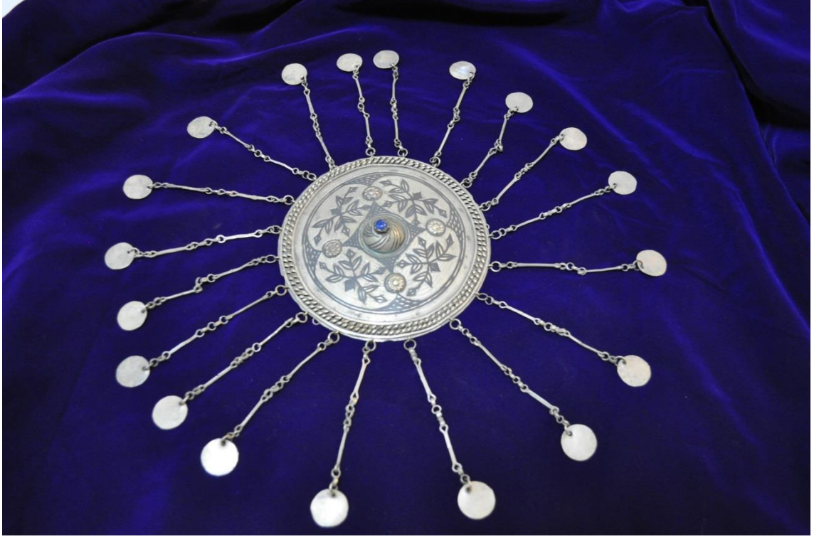
Resim 4.7.a. Gümüş, 2. Mavi Taşlı Örnek, Tepeliğin Genel Görünümü (K. Mercimek).

4.7.a Numaralı tepelik 4.6.a nolu mavi taşlı tepeliğin eşi gibidir. Ufak farklılıklar haricinde hemen hemen aynıdır. Bu tepelik de iyi korunmuştur. 20 adet lirası zincirler ile birlikte sağlam durumdadır.