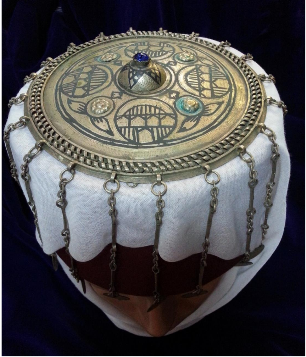
Resim 4.6.d. Gümüş, Mavi Taşlı, Altın Liralı Tepelik Detaylı Kompozisyon Görünümü (K. Mercimek)

Tepeliğın üzerindeki geometrik desenlerin arasında önceki örneklerde gördüğümüz kabartma çiçekler bulunmaktadır. Bu bölümlerin yanlarında yaprakların kompozisyonu doldurduğu görülmektedir. Tepeliğın kompozisyonu, kıvrımlı kabartmalı bir süsleme ile kapanmaktadır. Tepeliğın kabartmalı çiçek kısımlarının etrafında oksitlenmeler olduğu görülmekte. Tepeliğın yanlarında altın liralardan veya paraların asılabileceği zincir dizileri bulunur.