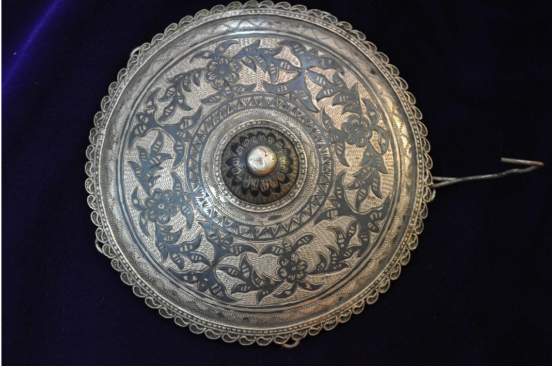
Resim 4.2.a. Gümüş Tepelik Detay Görünüm (K. Mercimek).

Resim 4.1.a'daki örneğe benzerlik gösteren ikinci tepelikte yine orta bölümde küçük bir kubbe vardır. Merkezi noktayı oluşturan bombeli kısımdan dışa doğru oluşturulan bordürler görülmektedir. Tepeliklerin genel itibari ile yuvarlak formlu olanları daha çoktur. Bu örnek de dairesel kompozisyonda birkaç bordürden oluşmuştur. Küçük kubbemsi bölümden sonra başlayarak ince suyolu bordürlerin ardından geniş bir bordür görülmektedir. Bu bölümde çiçek ve yapraklarla oluşturulmuş bir kompozisyon göze çarpmaktadır. Geniş bordürün ardından dar bir bordürle desen sınırları bitmiş, farklı bir teknikle en dış bölüme zarif bir desen verilerek tamamlanmıştır. En dış bölüm telkâriyi andıran bir teknikle zarif bir şekilde tamamlanmıştır.