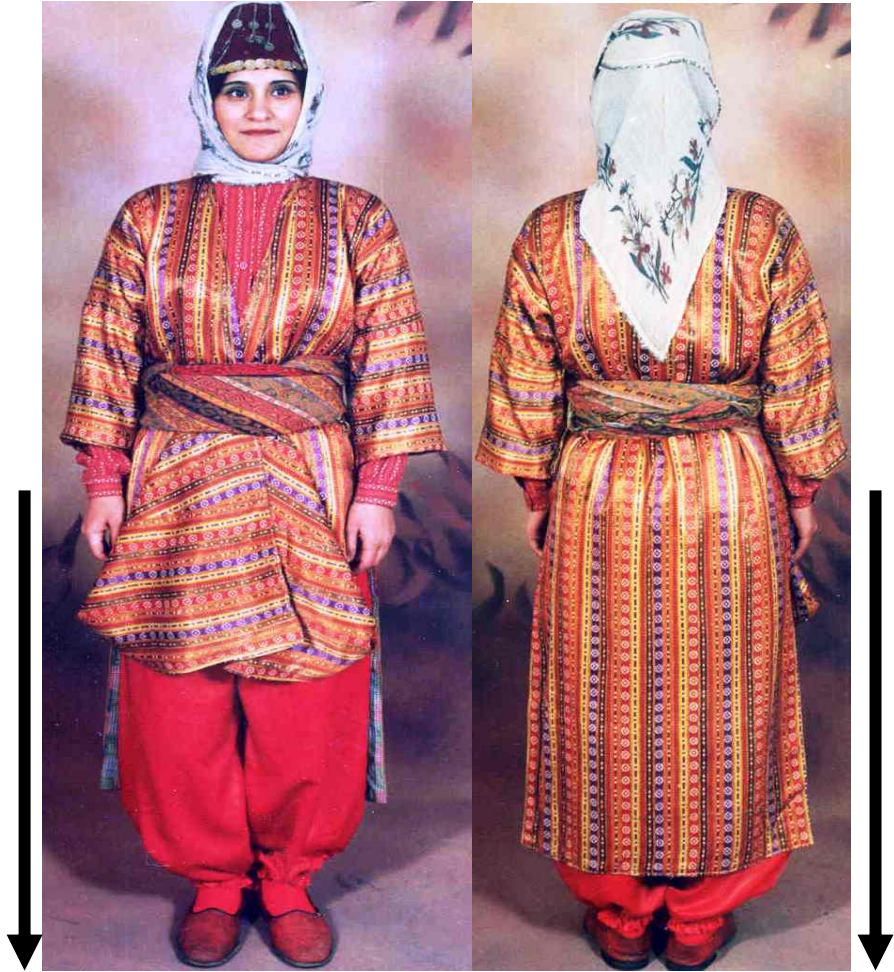
Resim 3.4. Kahramanmaraş Günlük Kadın Giyimi (K.Maraş Halk Eğitim Müdürlüğü)

Üç etek, insanların boyuna göre 2.50 m. kumaştan oluşur. Üç etekler kutnu kumaştan ve simli kadifelerden yapılır. Ön kısma 100 cm, arka kısma 100 cm, kollara ise 50 cm kumaş kullanılır. Kumaşlara işleme yapılmaz. Desenleri kumaşın kendisinde mevcuttur. İç kısmına keten ve düz kumaştan astar olarak 2,50 m. kumaş kullanılır. Üç etekler beş parçadan oluşurlar. 2 tane kol, 2 tane ön, 1 tane yırtmaç ve 1 tane de arka parçadan oluşurlar. Üç etekler cepsizdirler. Omuz kısmı ve kol altları dikilir, iki yanına yan yırtmaçları açılır (yırtmaçlar 50 cm). Kolları dikilir ve içine konulacak astar kumaş dikilir. Ön kısmı açık bırakılır, düğmesizdir. Arka kısmı düz olarak ayak topuğundan 20 cm üst kısma kadar dikilir. Yaka arkasında 20 cm boşluk bırakılır. Omuz bollukları 45 cm'dir. Kol uzunlukları 45 cm, kol ucu bolluğu 15 cm'dir. Pamuk iplikle ve naylon iplikle dikimi yapılır. Genellikle köylerde giyilir. Düğün ve bayramlarda da giyilirdi. Renk olarak; portakal rengi, kavuniçi, yeşil ve siyah renklerden dikilir 102