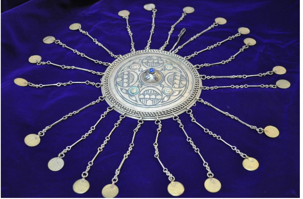
Resim 4.6.a. Gümüş, Mavi Taşlı, Altın Liralı Tepelik Genel Görünüm (K. Mercimek).

Mavi taşlı ve çepeçevre sarkan liraları ile daha iyi korunarak günümüze gelmiş olan bu tepelik, diğer örneklere göre daha iyi bir durumdadır. Tepeliğin başlangıç noktası diğer örneklerle aynıdır, sadece taş rengi değişiklik göstermiştir. Kompozisyon en üst noktada mavi bir taşla başlamıştır.