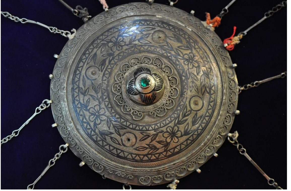
Resim 4.4.a. Gümüş Yeşil Taşlı Tepelik Detay Görünüm (K. Mercimek).

Bir diğer tepelik örneği ise üzerindeki zarif işlemleri ile dikkat çekmektedir. Maalesef çok iyi korunamamış olan tepelikte yer yer desen hasarları mevcut olduğu gibi yine liraları da eksiktir. Tepelik daha önce görmüş olduğumuz bazı küçük tepeliklerden daha büyüktür (Resim 4.1.a, Resim 4.2.a). Tepelikler genellikle feslerin üzerine takılan baş süslemeleri olduğu için ebat olarak fesin üst bölümünü tamamen kaplayacak büyüklükte olmaktadır. Bu tepelik örneği de fesin üst kısmı ile örtüşmektedir. Tepeliğin en dış bölümünde 25 adet zincir halkası bulunmaktadır. Birkaç tanesi mevcuttur, bunlarında bazılarının uçlarında liraları yoktur.