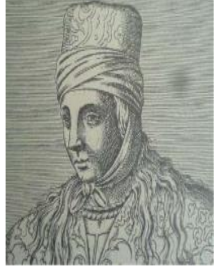
Resim 2.19. Türk Kadını (ev giysili) (Gravürlerle Türkiye, Cilt 1, Kültür Bakanlığı Yayınları, 2002, s:160)

İşlemeli fes görünümlü başlığın alın çevresine sarık şeklinde kumaş sarılıp, çene altından düğüm yapılarak başlık tamamlanmıştır (Resim 2.19). 82