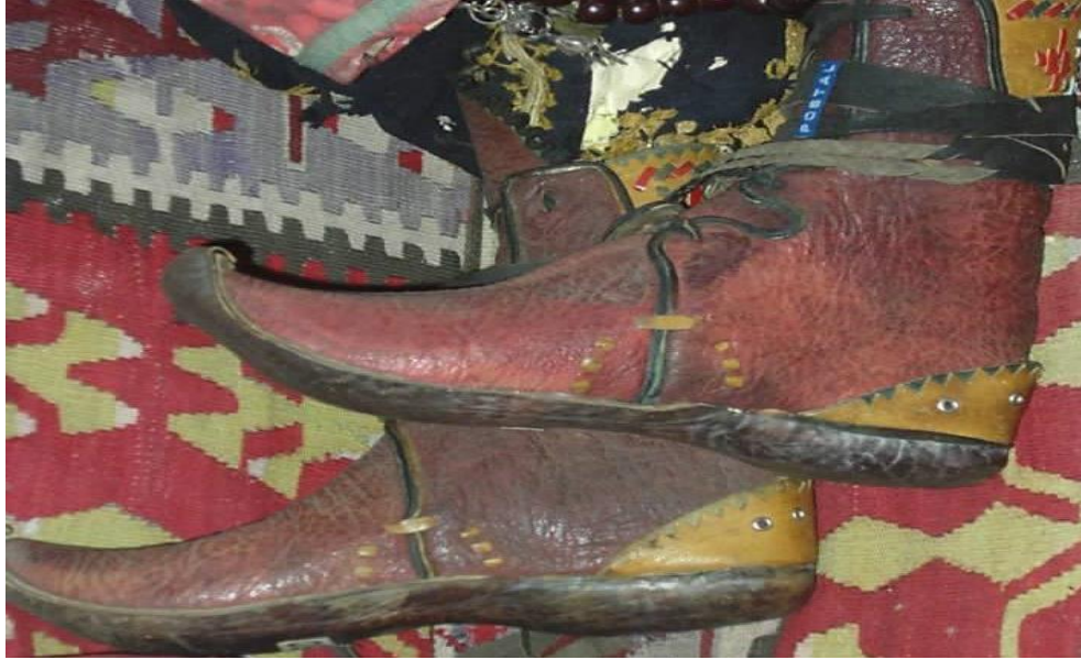
Resim 3.6. Kahramanmaraş Kadın Giyiminde Ayağa Giyilen Ayakkabı (edik)

Günümüzde imalatı tek olup, tarihi Selçuklulardan Osmanlılara kadar uzanan ayakkabılardır. Bunlar; postal, edik, kelik, yemeni, saray yemenisi, Karadağ çarığı adıyla isimlendirilir. Bunların derisinden ipliğine kadar her şeyi elde imal edilir. İmalatın hiçbir aşamasında kimyasal madde kullanılmaz. Derilerin boyama aşaması ağaç ve bitki köklerinden, toprak boyadan yapılan kök boya ile yapılmıştır. İplikler saf pamuktan olup, balmumu ile mumlanarak suya ve çürümeye karşı dayanıklı olması sağlanır. 107