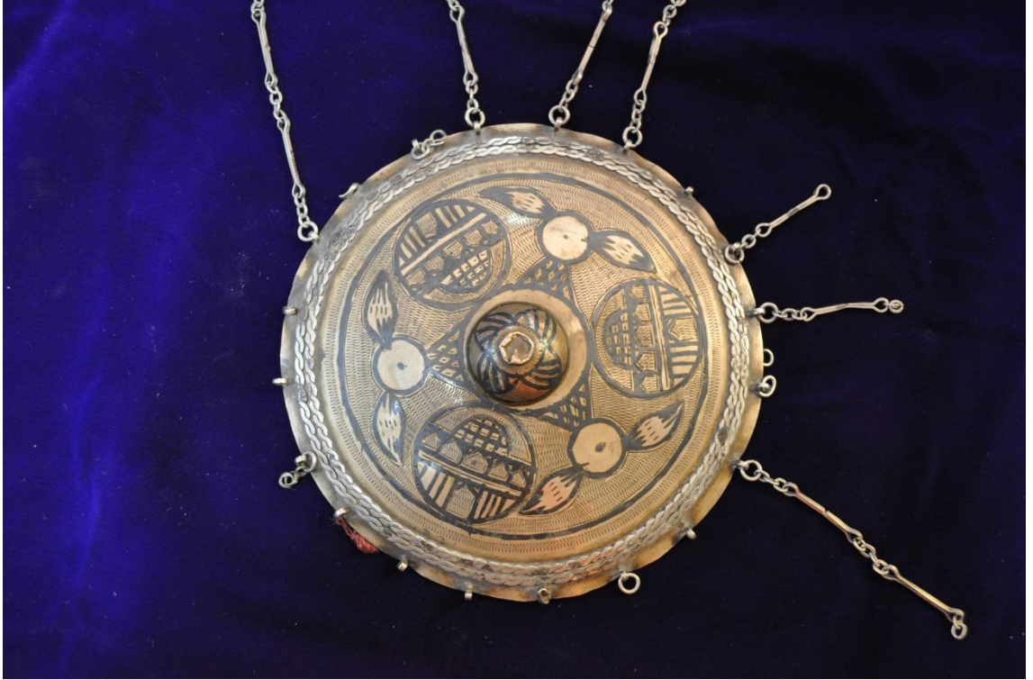
Resim 4.10.b. Gümüş Tepelik Genel Görünüm (K. Mercimek).

Resim 4.10.a örneği kompozisyon olarak Resim 4.6.a deki örnekle benzerlik göstermektedir. Geometrik motiflerden oluşmuş bir kompozisyonu bulunmaktadır. Üç adet dairenin içerisi mimari formları andıran geometrik şekillerle doldurulmuştur. Yaprak motifleri ile aradaki alanlar oluşturulmuştur. Üç adet yaprağın ortasındaki çizilmiş küçük yuvarlak bölüm kabartmalı çiçek motifinin yeridir. Yine en dış bölüme gelen kısım zencerek ile süslenecek kompozisyon kapatılmıştır.