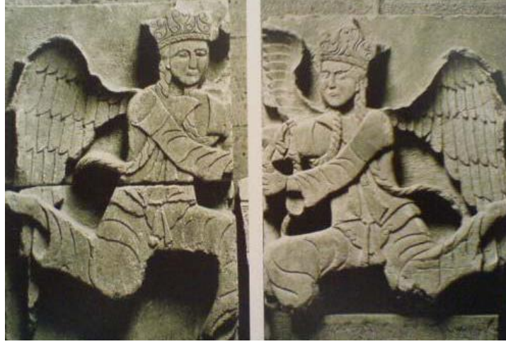
Resim 2.12. Konya Kalesi, Melek Kabartmaları, Konya İnce Minareli Medrese Müzesi. (F. Özsoy)

Melek tasviri İslam sanatında Hıristiyan dünyasından esinlenilmiş ve az rastlanan bir figürdür. Bu figürde saçlar, iki kalın örgü yapılmış, başın ortasına ve başa kabartma ve oymalı başlık yerleştirilmiştir (Resim 2.12).