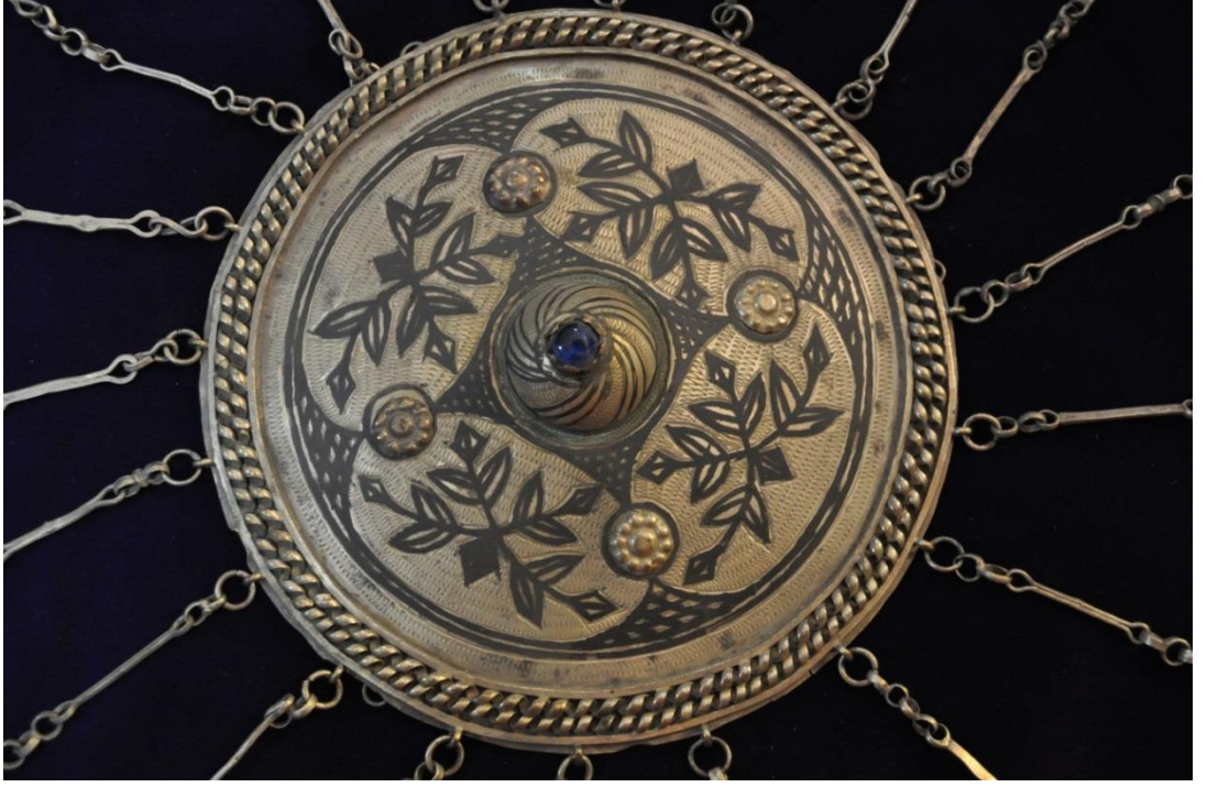
Resim 4.7.c. Gümüş, 2. Mavi Taşlı Tepeliğın Detay Görünümü (K. Mercimek).

Tepeliğın ana bölümü yaprak ve tomurcuklu bitkisel motiflerle süslenmiştir. Bu örnekte de yine motiflerin simetrik olarak yerleştirilmiş olduğu görülüyor. Bağlantı noktaları kabartma çiçek motifi ile birleştirilmiş, kompozisyon çift sıra sarmal gümüş telle kapatılmıştır.