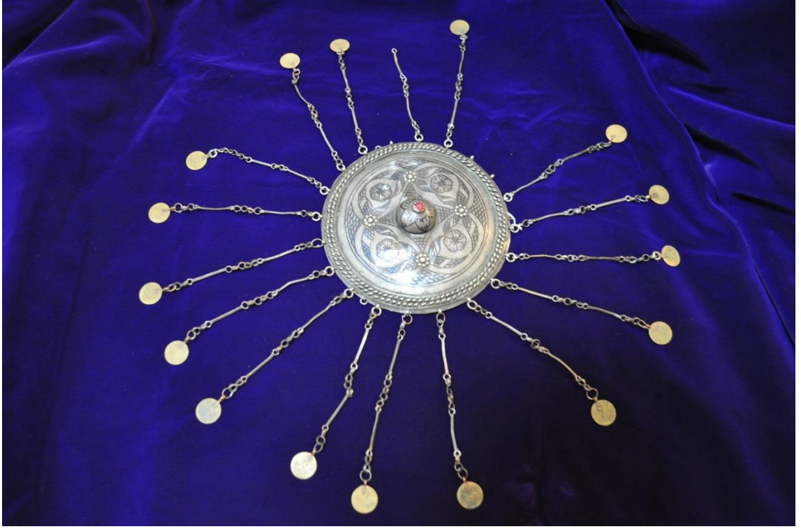
Resim 4.3.a Gümüş ve Altın Liralı Tepelik Genel Görünüm (K. Mercimek).

Bir diğer örnek olan tepelik ise öncekilere nazaran daha korunarak günümüze ulaşmış örneklerden sayılabilir. Kısmen liraları olmasa da çoğunluğu mevcut durumdadır. Önceki iki örneğe göre daha büyük ebatlı bir tepeliktir. Kenarlardan sarkacak şekilde düzenlenmiş olan tepelikte 20 adet zincir halkası mevcuttur fakat bu zincirlerden 17 adedi tepelik üzerinde mevcut iken bir zincir ucunda ise lirası eksiktir.