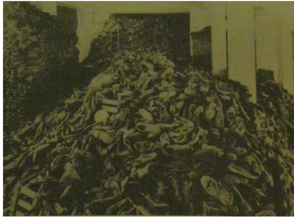
Şekil 1.2. Ölen Yahudilere Ait Ayakkabılar (Knopp 2000: 358).

Bizler ayakkabılarız, bizler son tanıklarız. Bizler dedelerin ve torunların ayakkabılarımız. Prag'dan, Paris'ten, Amsterdam'dan. Sadece kumaştan ve deriden yapıldığımız etten ve kemikten yapılmadığımız için, o cehennem ateşinden kurtulduk.