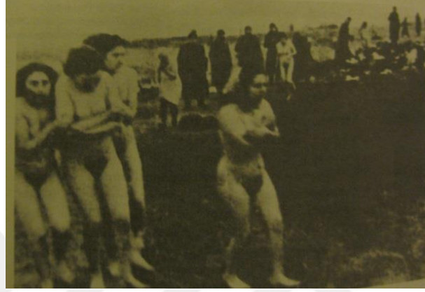
Şekil 1.1. Letonya'da Libau'daki Kumullarda 1941'in Aralık Ayında Yahudi Kadınların Ateş Edilerek Öldürülmesi (Knopp 2000: 86).

zamanı geldiğinde ölüm çukurlarına fırlatılmışlardır. Bu insanlık dışı uygulamalara maruz kalan ve sömürülenlerden bazıları da hiç şüphesiz kadınlar olmuştur. Savaşta kadın onuru ayaklar altına alınmış, kıyafetleri için kadınlar çırıl çıplak soyularak ölüm kuyularına itilmiş, gözleri önünde çocukları öldürülmüş ya da çocuklarının gözleri önünde kendileri öldürülmüştür. Aşağıdaki resim de yaşananları bize en iyi şekilde ispatlamaktadır.