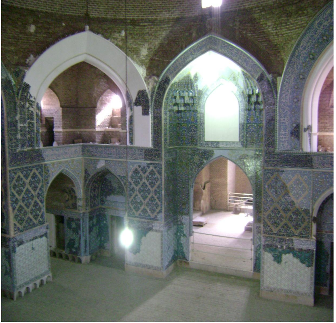
Resim 4: Gök Mescit, İçten Görünüş, Tebriz, 2008