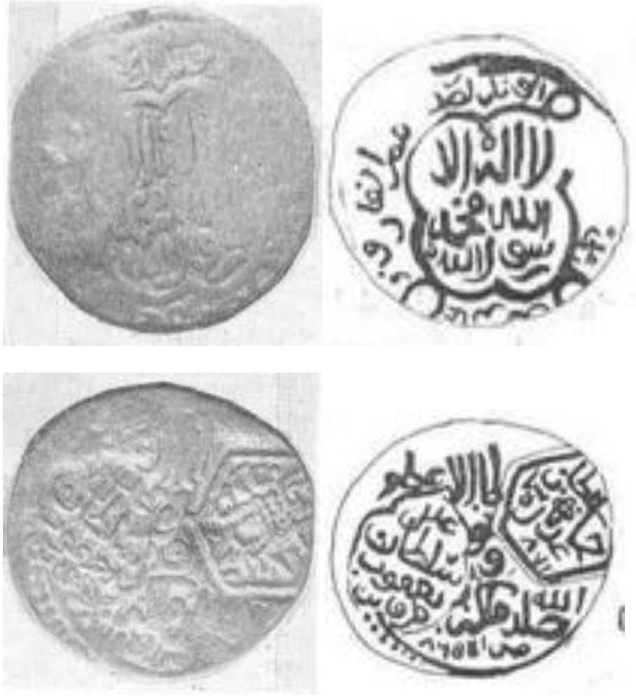
Resim 6: Cihânşah Dönemine Ait Bir Sikke

Sikkenin üzerinde Es-Sultan ûl-Azam Sultan Ebû Said Gürkan sene H.865/M.1461 yazmaktadır. Ancak daha sonrasında sikkenin üzerine önce Cihânşah'ın “Sultan /Cihânşah / Adl” 1466 tarihli damgası, ardından ise Akkoyunlu Sultan Yakup'un “Adl/ Sultan/ Yakub/ Kazvin” H.873/M.1469 damgası vurulmuştur.