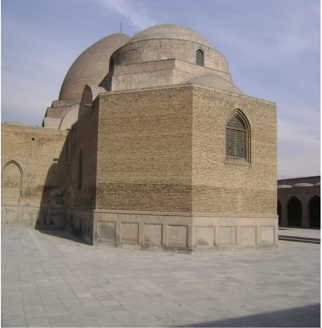
Resim 1: Gök Mescit, Arkadan Görünüş, Tebriz, 2008