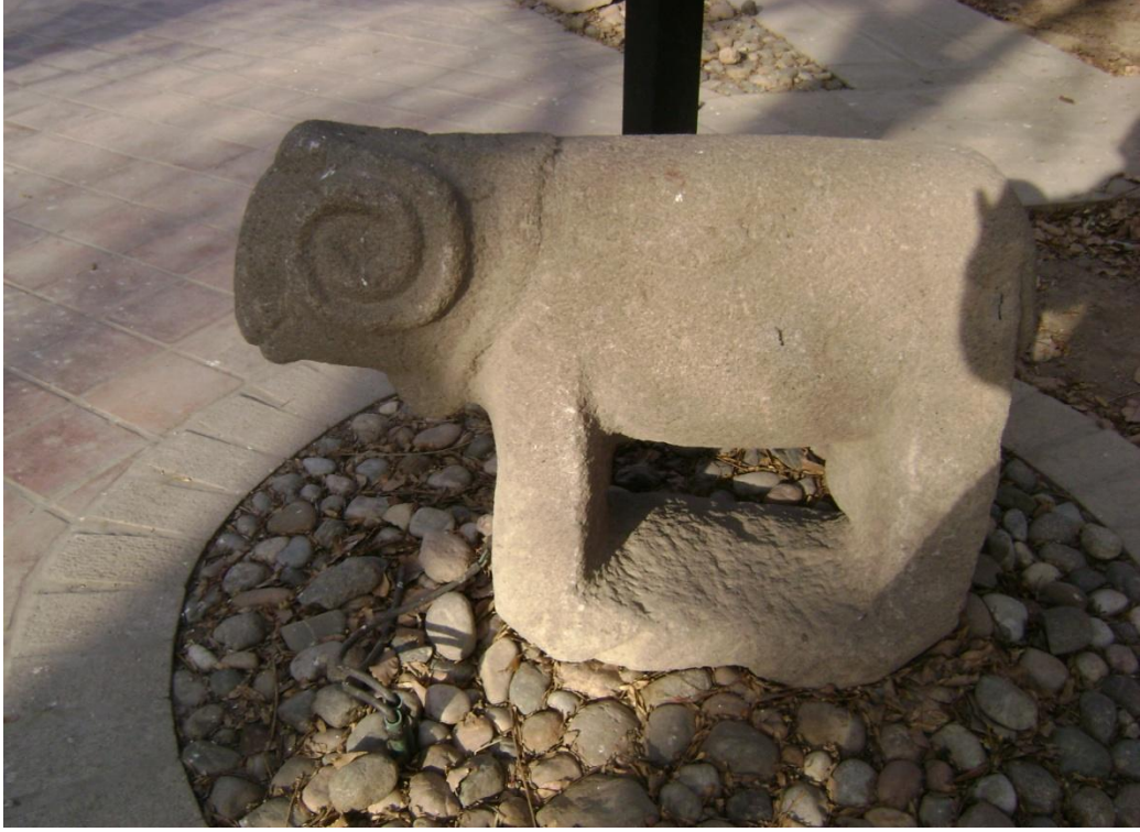
Resim 3: Karakoyunlu Dönemine Ait Mezar Taşı, Azerbaycan Müzesi Arşivinden, Tebriz, 2008