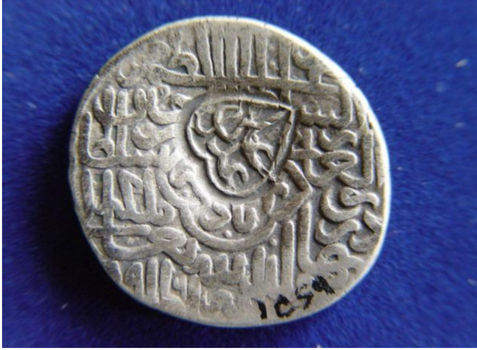
Resim 4: Cihânşah'ın Ođlu Hasan Ali Adına Kesilmiř Sikke, n Yüzü, Azerbaycan Müzesi Arřivinden, Tebriz, 2008