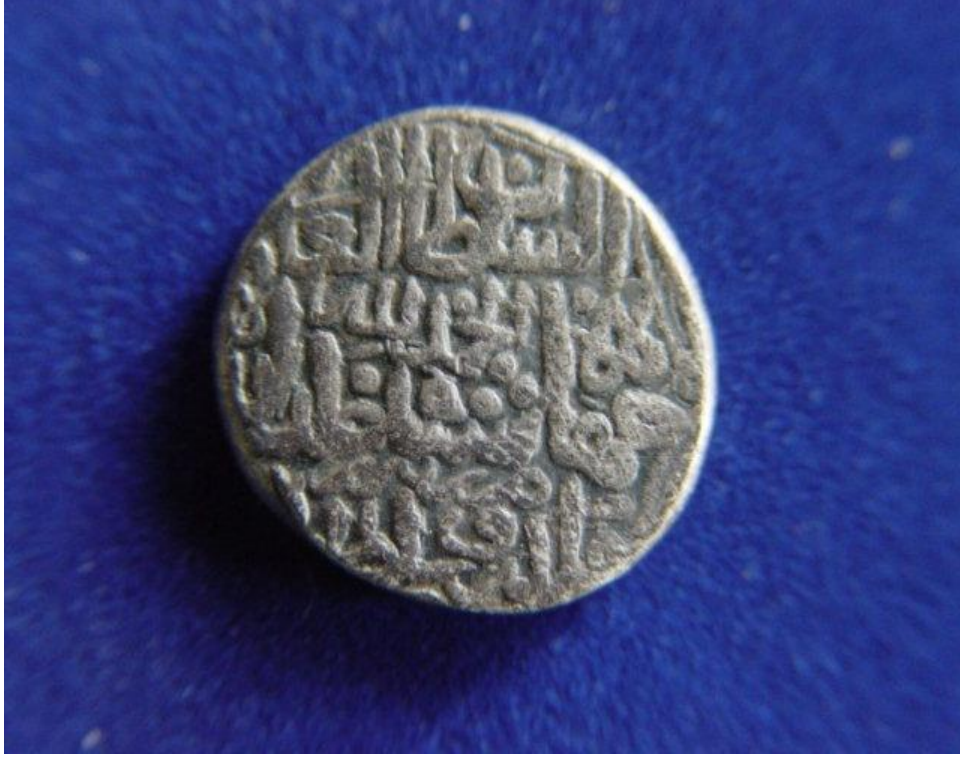
Resim 2: Cihânşah Adına Kesilmiş Sikke, Ön Yüzü, Azerbaycan Müzesi Arşivinden, Tebriz, 2008