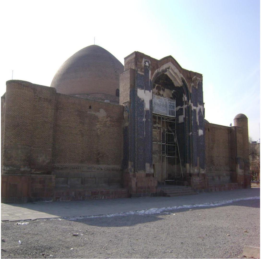
Resim 3: Gök Mescit, Önden Görünüş, Tebriz, 2008