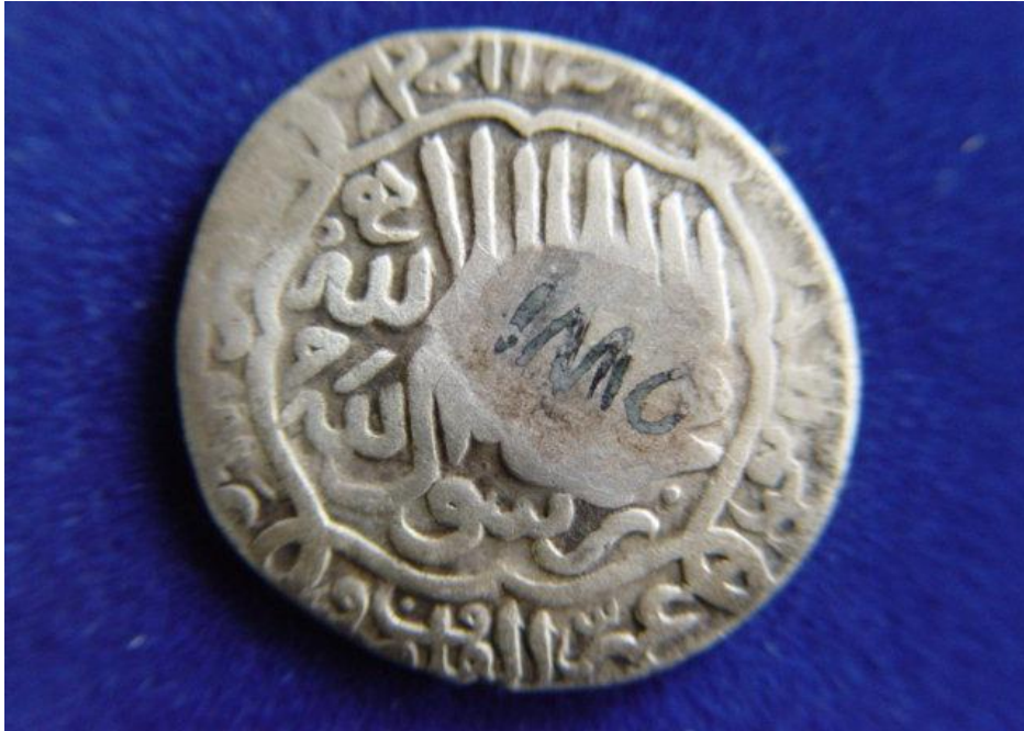
Resim 5: Cihânşah'ın Ođlu Hasan Ali Adına Kesilmiř Sikke, Arka Yüzü, Azerbaycan Müzesi Arřivinden, Tebriz, 2008