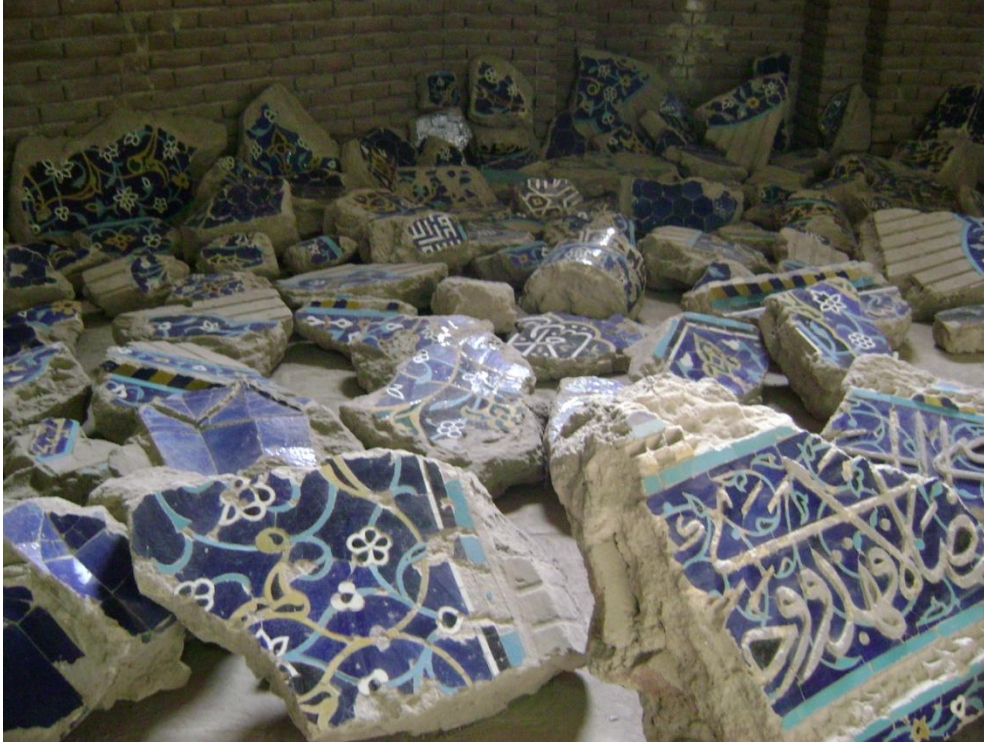
Resim 5: Gök Mescit, Dökülen Çiniler, Tebriz, 2008