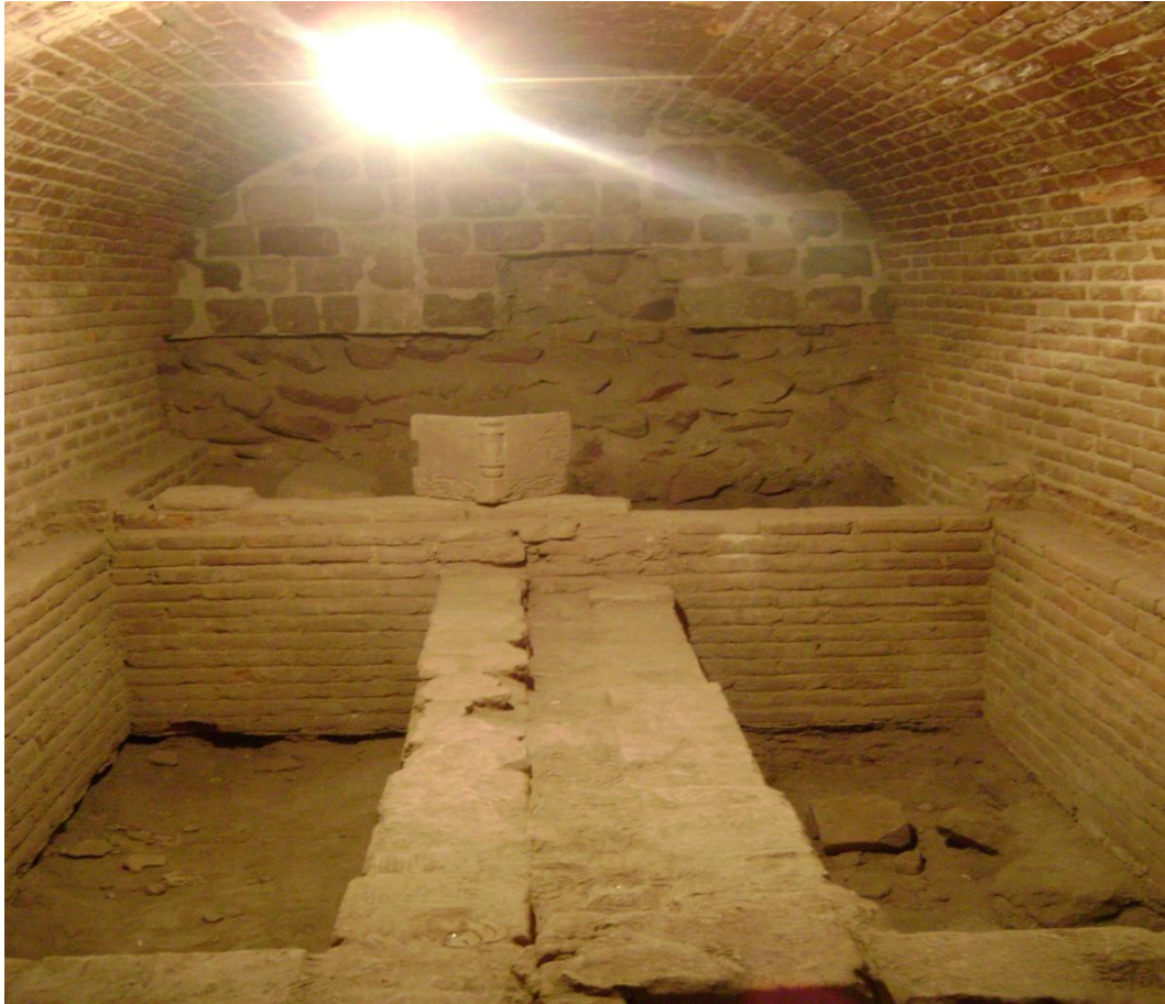
Resim 2: Cihânşah ve Eşi Hatun Can Begüm'ün Mezar Yeri, Tebriz, 2008