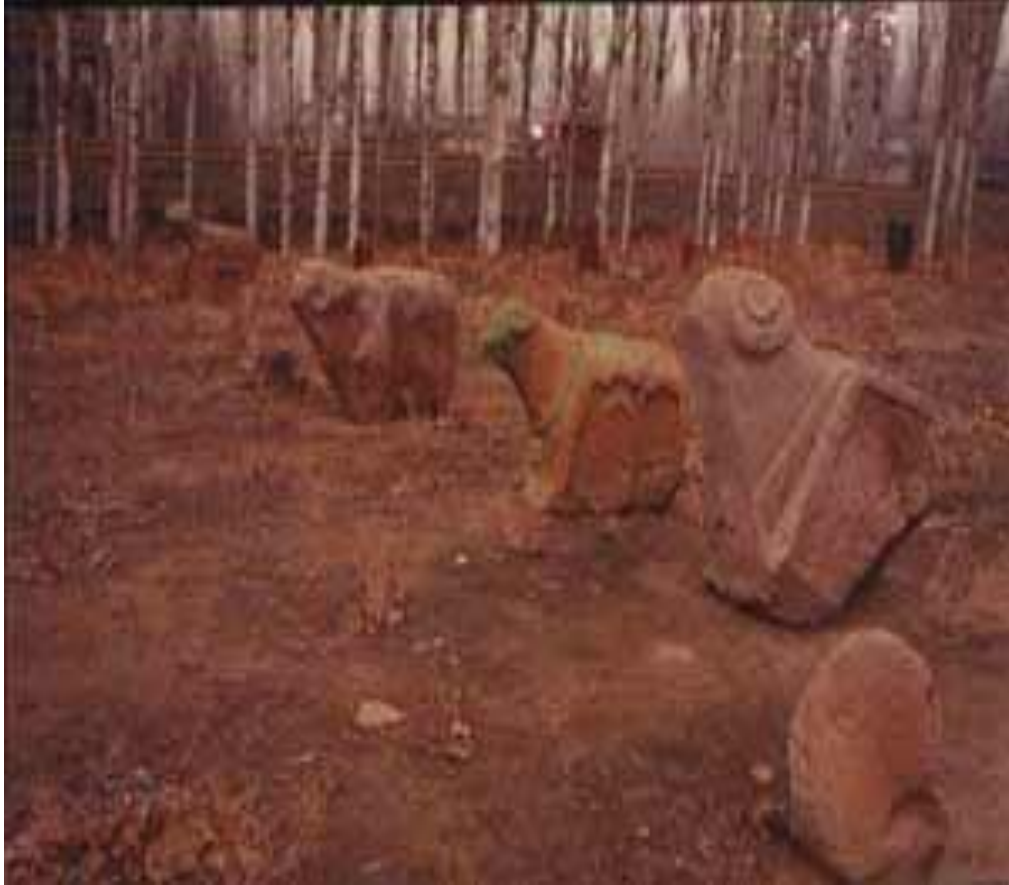
Resim 5: İğdır'ın Karakoyunlu İlçesinde Bulunan Mezar Taşları