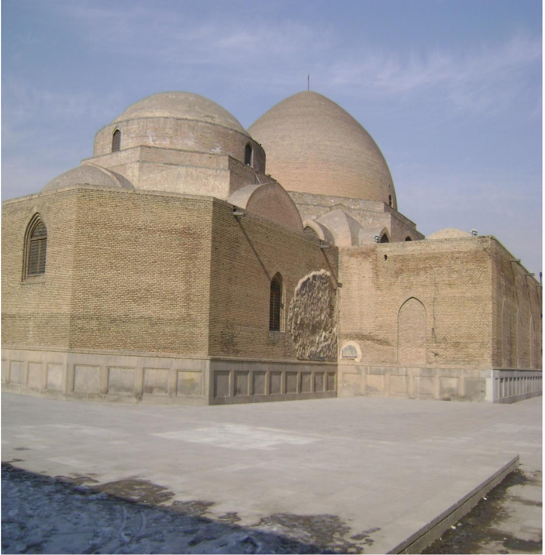
Resim 2: Gök Mescit, Arkadan ve Yandan Görünüş, Tebriz, 2008