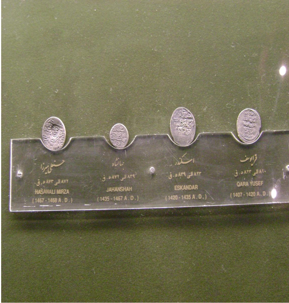
Resim 1: Karakoyunlu Sikkeleri, Tebriz, 2008