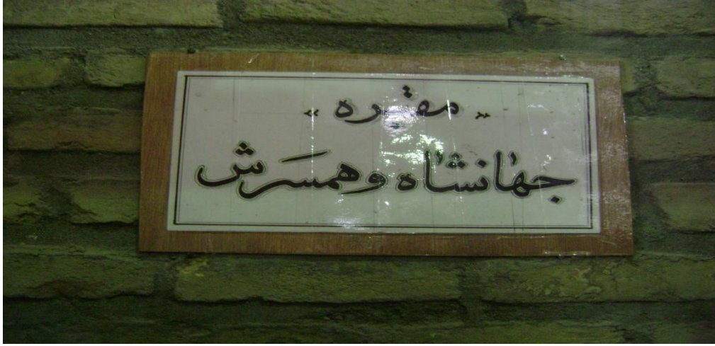
Resim 1: Cihânşah ve Eşi Hatun Can Begüm'ün Mezarı Kapı Üstü, Tebriz, 2008