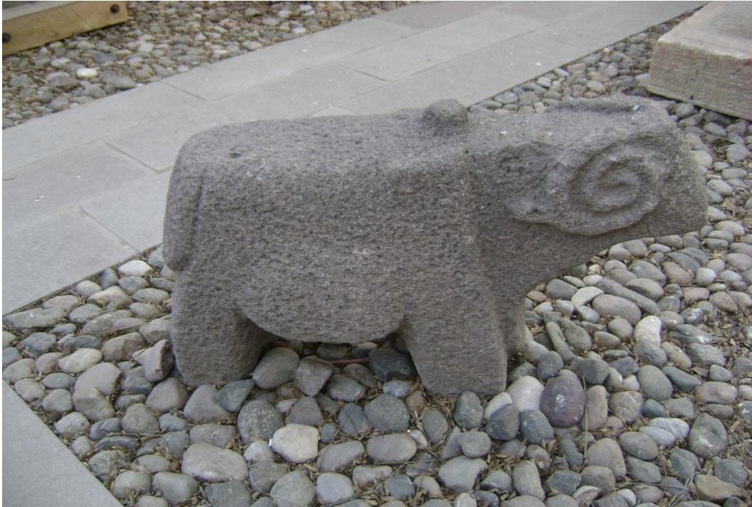
Resim 4: Mezar Taşı, Azerbaycan Müzesi Arşivinden, Tebriz, 2008