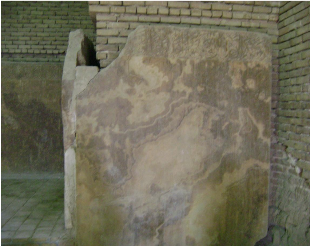
Resim 6: Gök Mescit, İçten Görünüş, Çinileri Dökülmüş Duvar, Tebriz, 2008