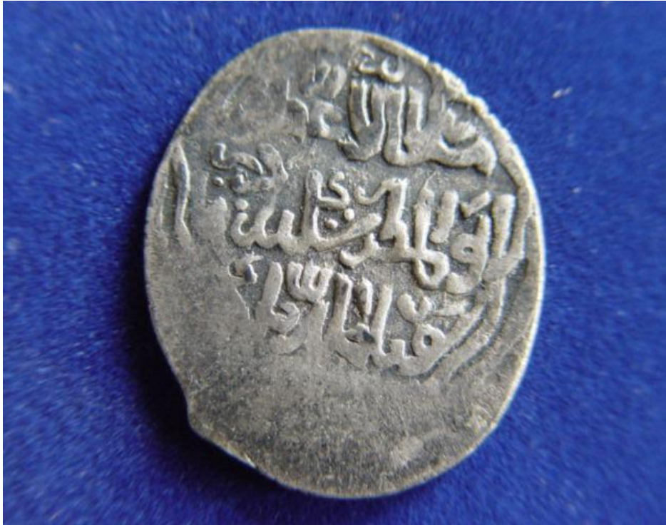
Resim 3: Cihânşah Adına Kesilmiş Sikke, Arka Yüzü, Azerbaycan Müzesi Arşivinden, Tebriz, 2008