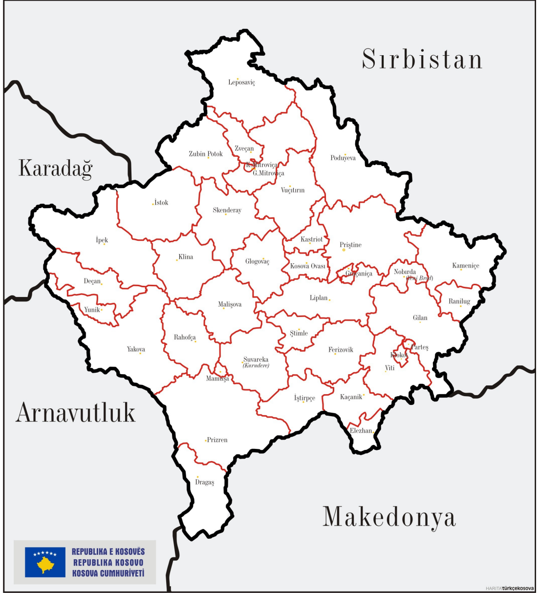
Kosova'nın İdari Haritası