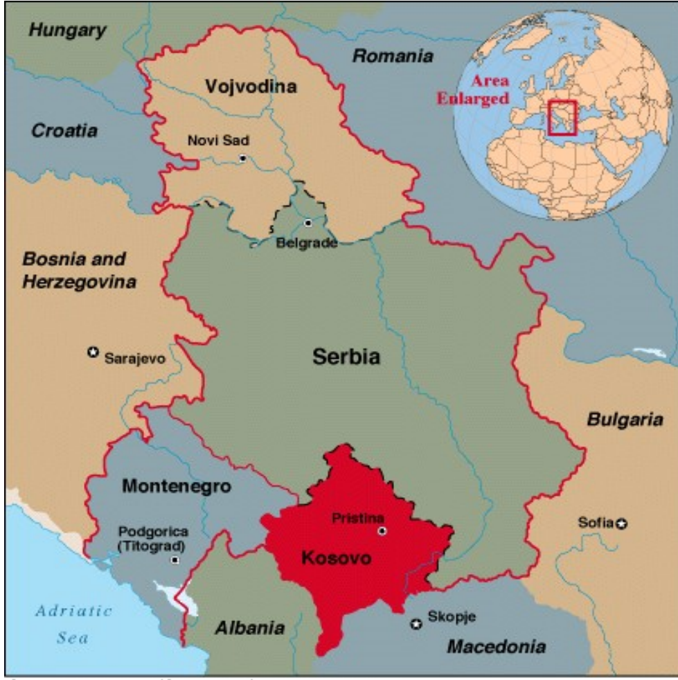
Kosova ve Komşuları

Kaynak: < http://www.google.com.tr/imgresimgurl=http://www.csdesign.ch/max/ferien/kosovo2003/images/kosovomap. > , (09.10.2010).