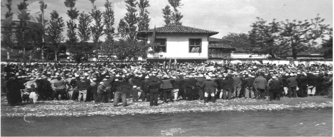
Prizren Arnavut Birliği'nin Toplandığı Ev