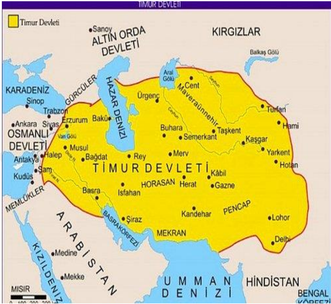
Harita 2. Timurlu Devleti Sınırları