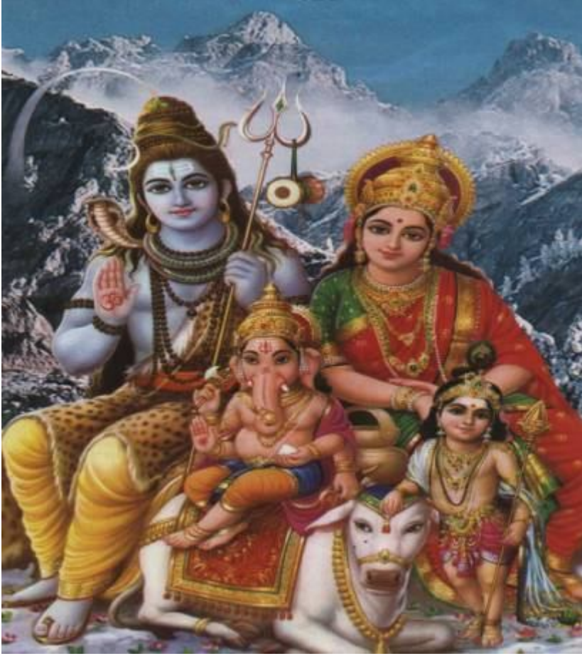
Tanrı Şiva, Tanrıça Devī, Gaṇeṣa, çocuk Krishṇa ve Nandi