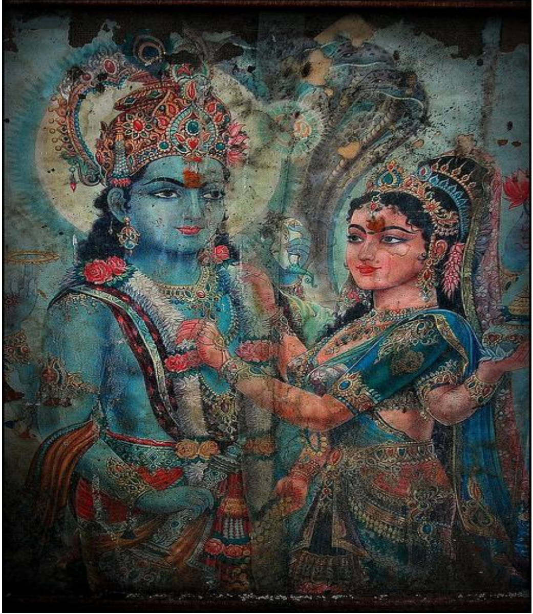
Tanrı Vishnu ve Tanrıça Lakshmi