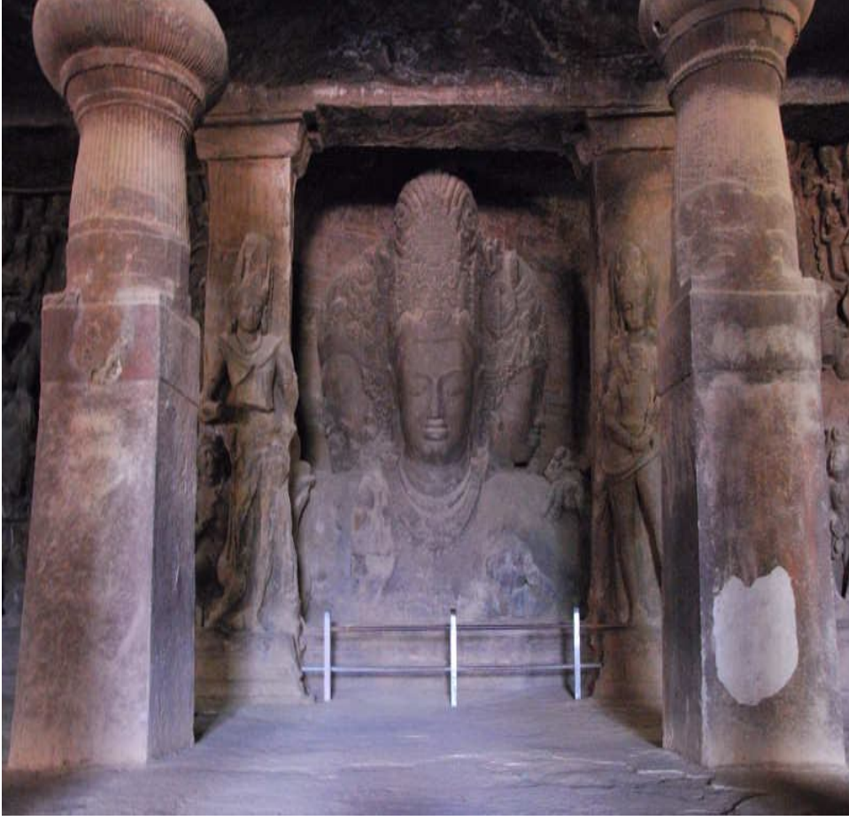
Elephanta Mağaraları, Trimurti Tasviri