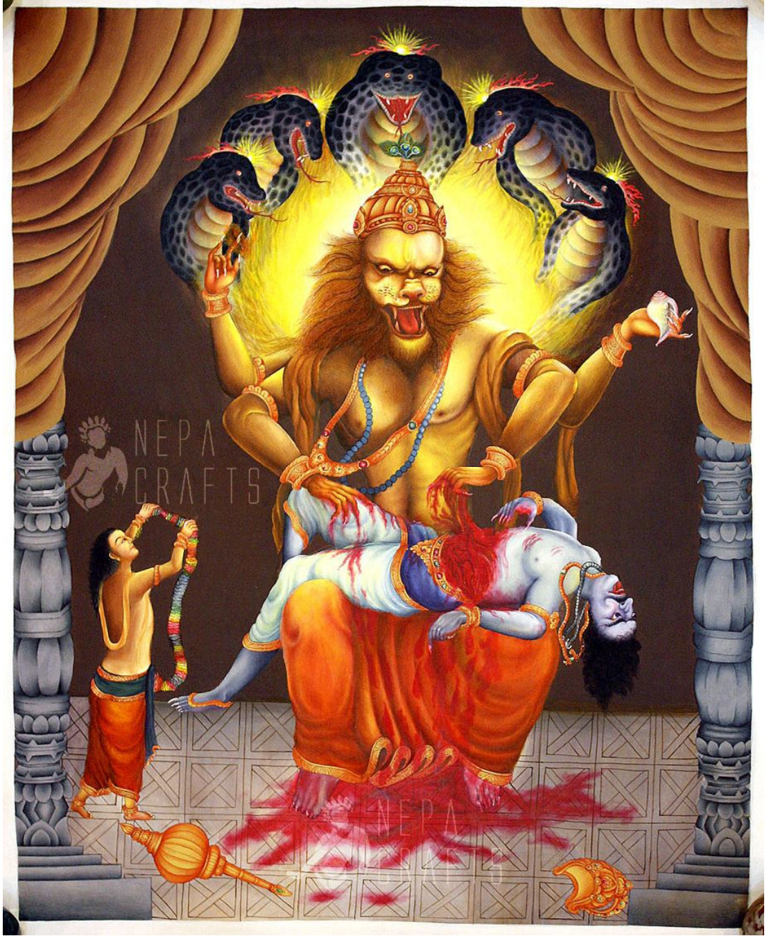
Tanrı Vishnu'nun Avatarası Narasimha