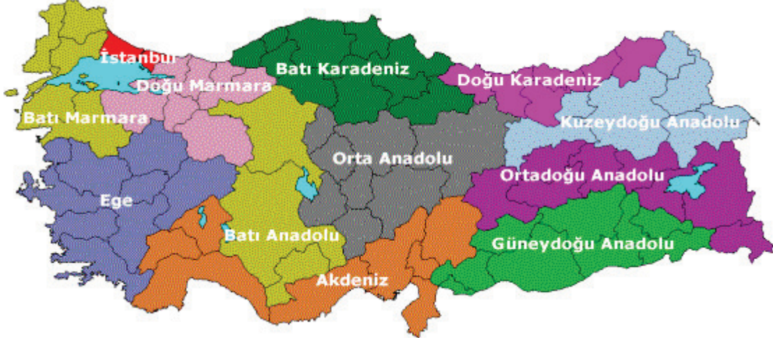
Şekil 3: Düzey 1 Grubunda Yer Alan 12 İstatiksel Bölge Biriminin Türkiye Üzerindeki Dağılımı