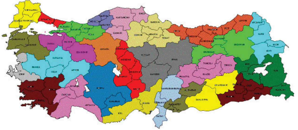
Şekil 4 : Düze y 2 Grubunda Yer Alan 26 İstatistiksel Bölge Biriminin Türkiye Üzerindeki Dağılımı