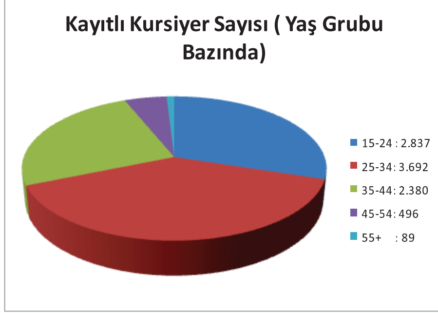
Şekil 2: Yaş Grubu Bazında Kayıtlı Kursiyer Sayısı