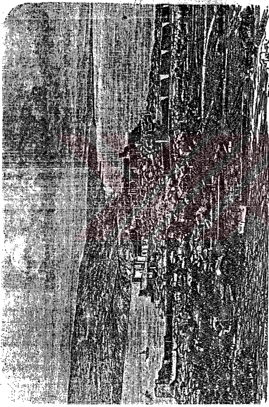
19. Asrın ikinci yarısında (1884) Sinop'un genel görünüşü (Bir fotoğraftan Taylor tarafından yapılmış resim.)