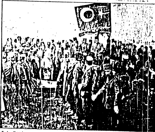
Ali Sükrü Bey'in Trabzon Boztepe'de defin merasimi, 1923