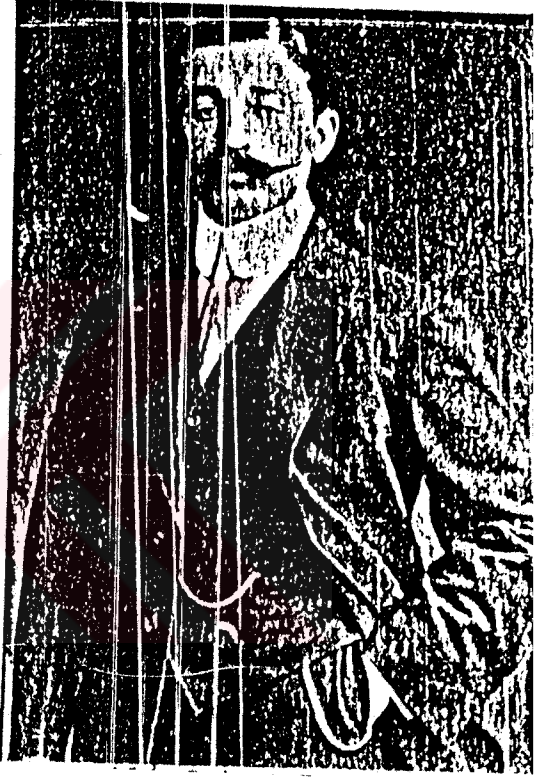
Ali Sükrü Bey (1884-1923)