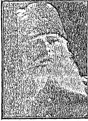
فوق العاده دیوان حرب عرفی رئیس محمود میرت پاشا