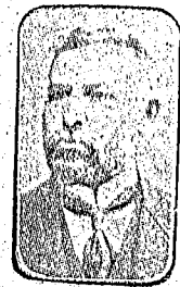
جناب مدیر عمومی