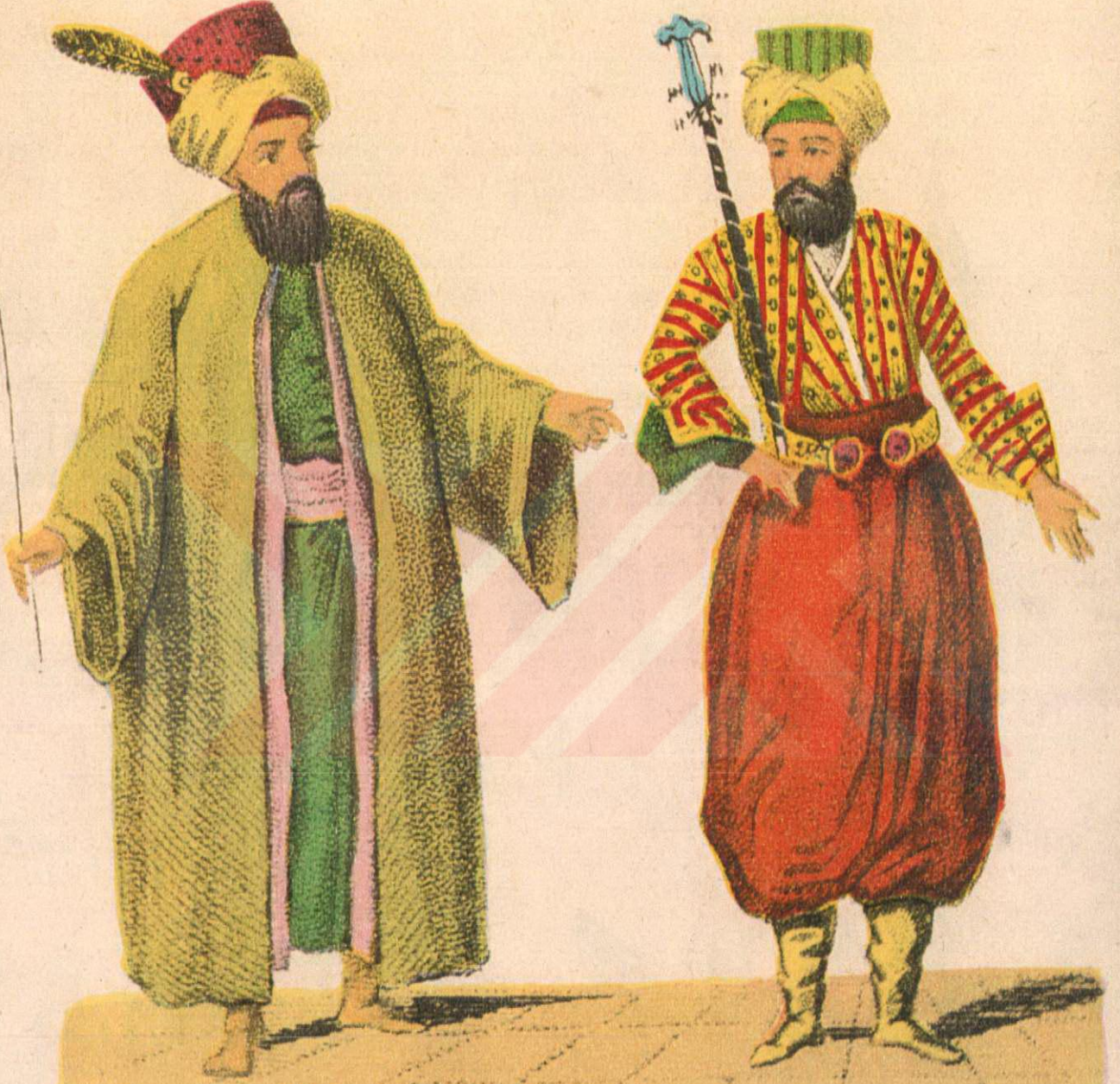
Solda Divân-ı Hümâyûn Çavuşbaşısı ve yanında bir divân çavuşu