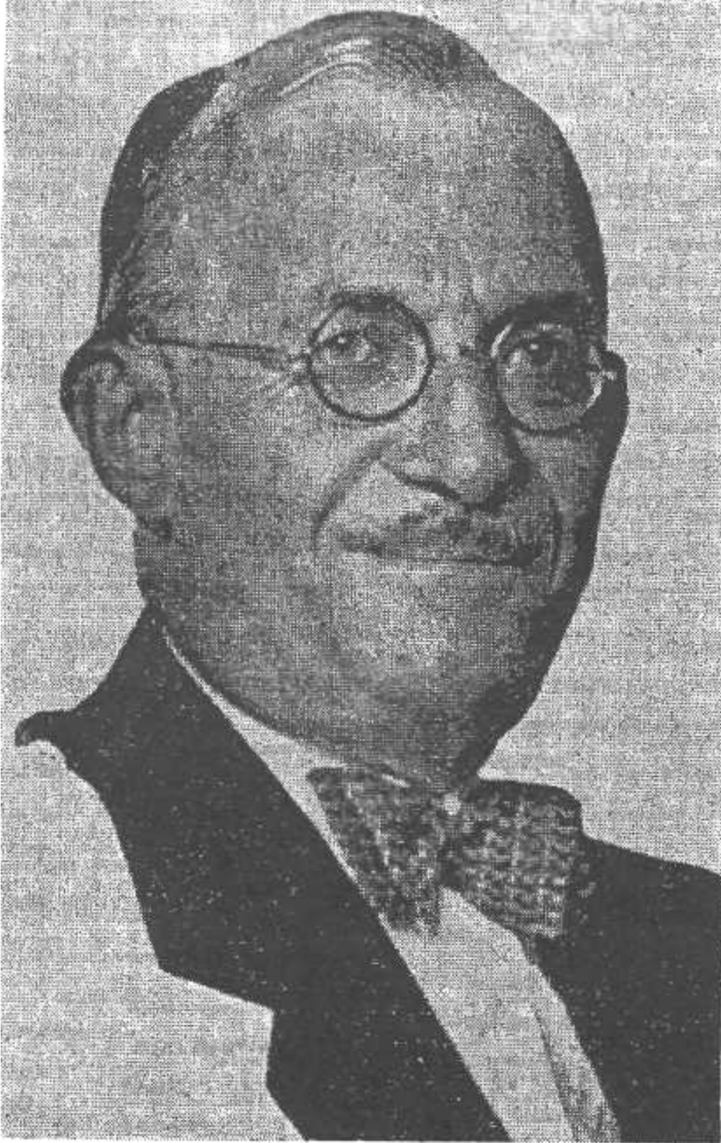
Müverrih Ahmet Refik Bey