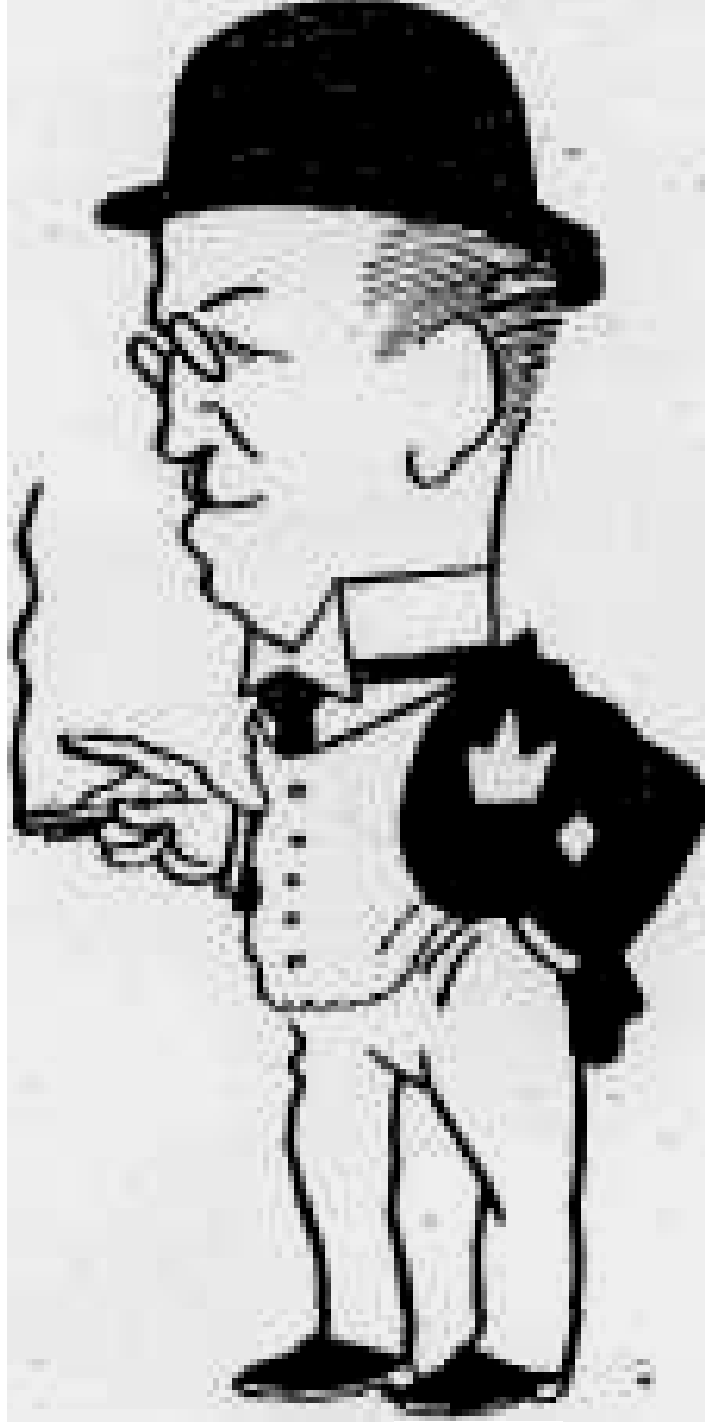
Müverrih Ahmet Refik Bey Yıl:1926