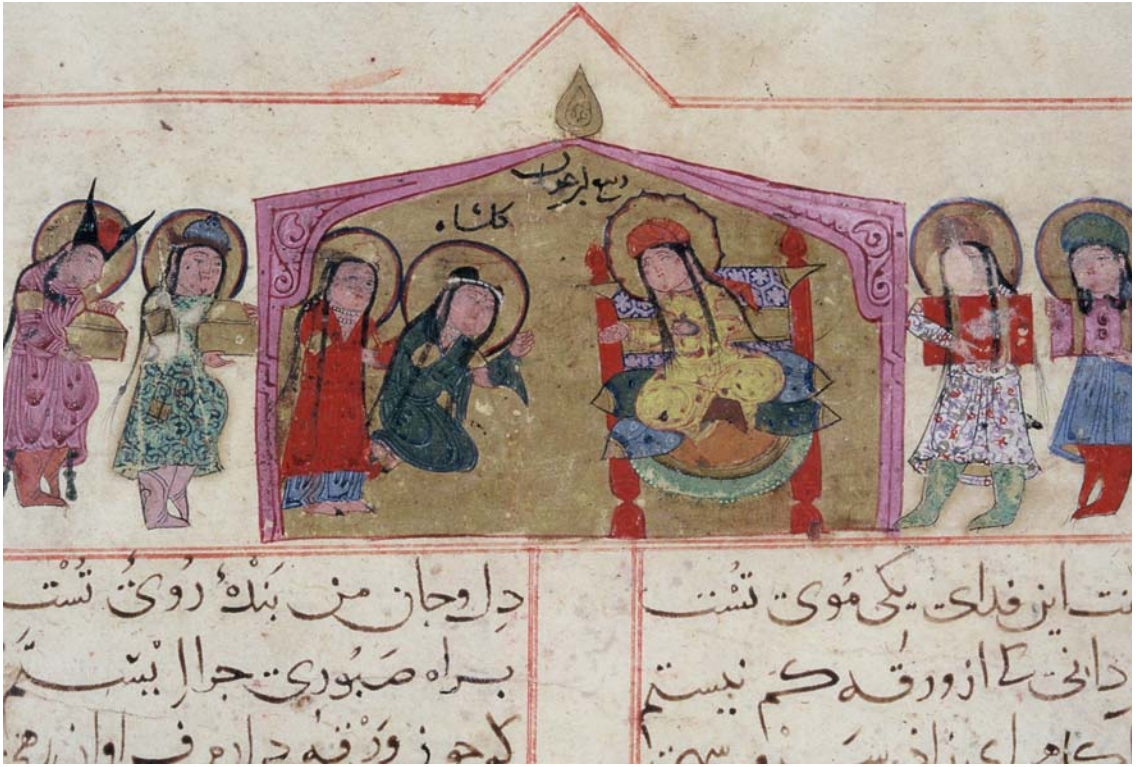
Resim 5- Kaçırılan Gülşah, Rebi'nin çadırında. Varka ve Gülşah, TSMK, H.841, 8b.