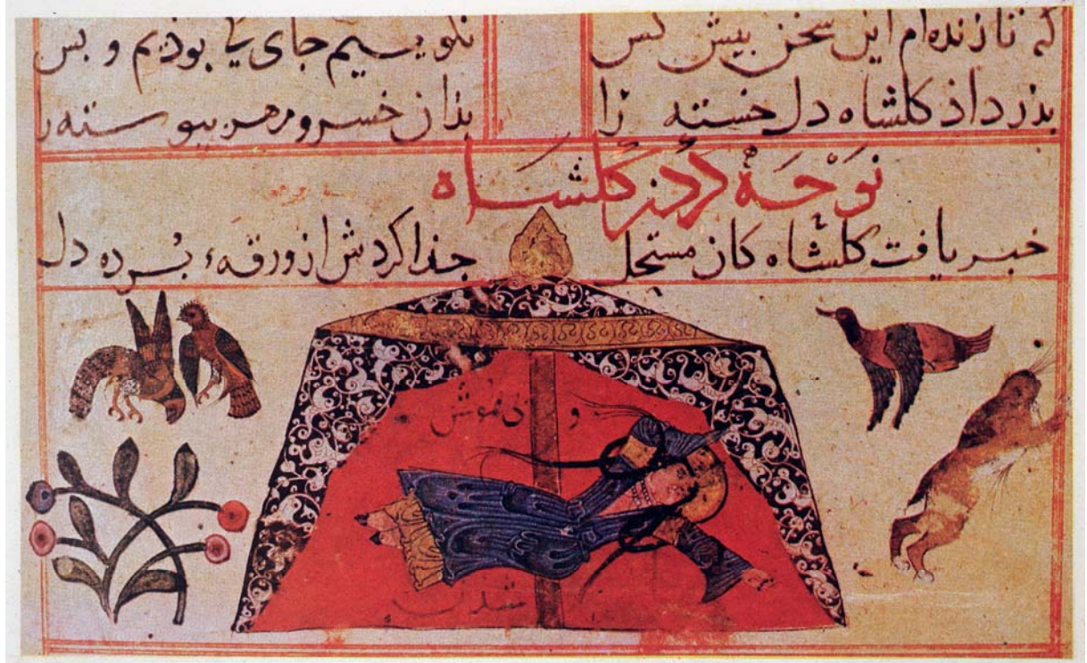
Resim 9- Gülşah'ın bayılması. Varka ve Gülşah, TSMK, H. 841. (Filiz Çağman, Zeren Tanındı, Topkapı Sarayı Müzesi İslâm Minyatürleri, İstanbul, 1979).