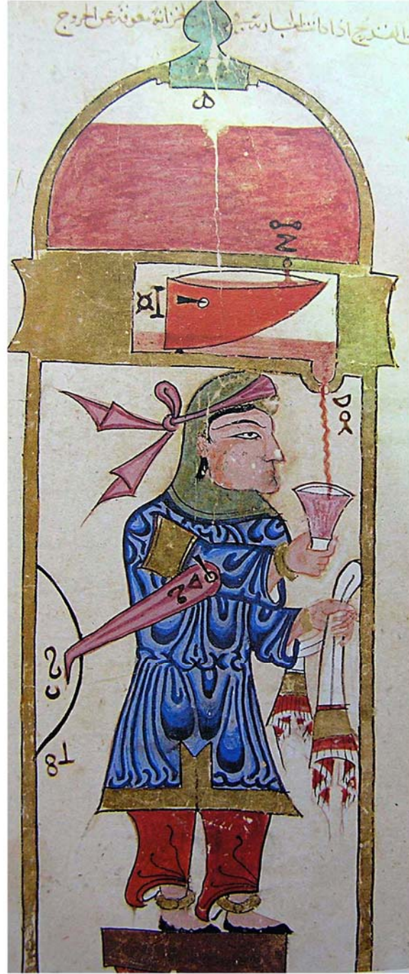
Resim 2: Otomatik içki ikram cihazı, Kitâbü'l fî Ma'rifet el-Hıyal el-Hendesiya, TSMK, H. 414, y. 106b. ( Çağlarboyu Anadolu'da Kadın, Anadolu Kadınının 9000 Yılı , haz. Selmin Kangal, Nurhan Turan, İstanbul, 1993, s. 258).