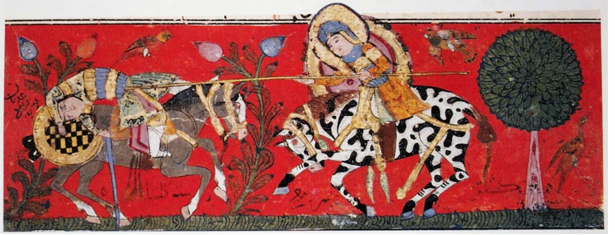
Resim 8- Gülşah savaşıyor. Varka ve Gülşah, TSMK, H. 841. ( Çağlarboyu Anadolu'da Kadın, Anadolu Kadınının 9000 Yılı , haz. Selmin Kangal-Nurhan Turan, İstanbul, 1993, s. 193).