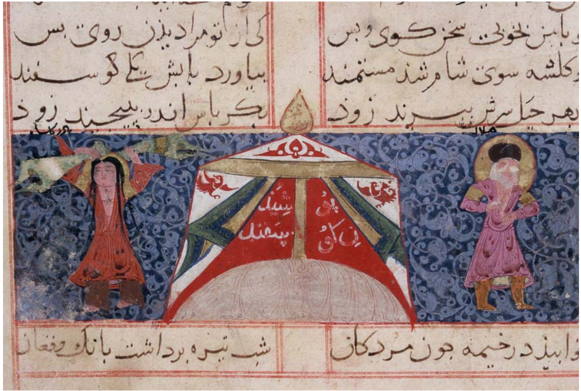
Resim 6- Varka'yı aldatmak için koyun ölüsünün konduğu mezarın başında sözde yas tutan Gülşah'ın annesi, Varka ve Gülşah, TSMK, H.841, 46a.