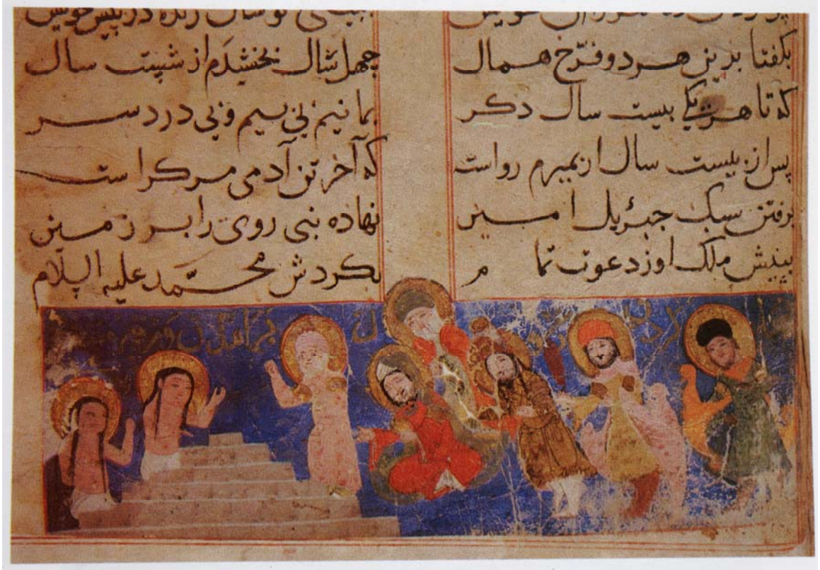
Resim 12- Hz. Muhammed'in savaş dönüşü Varka ve Gülşah'ın mezarını ziyaret etmesi. Varka ve Gülşah, TSMK, H. 841, 70r. ( Güner İnal, Türk Münyatür Sanatı, Ankara, 1995).