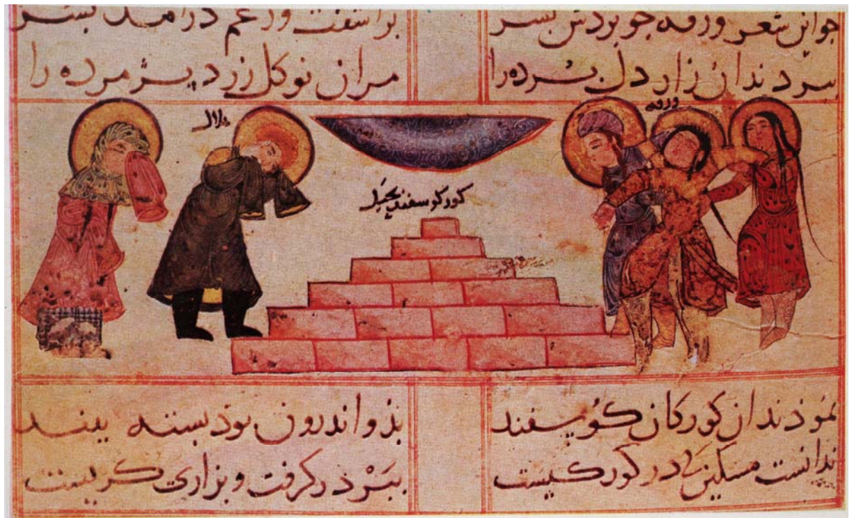
Resim 10- Varka, Gülşah'ın yalancı mezarı başında. Varka ve Gülşah, TSMK, H. 841. ( Filiz Çağman, Zeren Tanındı, Topkapı Sarayı Müzesi İslâm Minyatürleri, İstanbul, 1979).