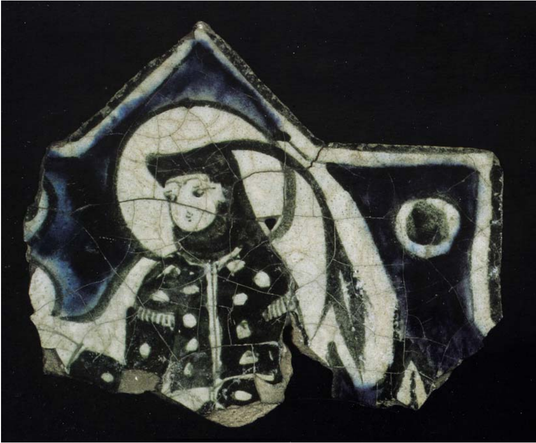
Resim 14- Kadın figürlü çini parçası, Kubadâbâd Sarayı'ndan (1236), Konya Karatay Medresesi Müzesi. ( Alâeddin'in Lambası Anadolu Selçuklu Çağı Sanatı ve Alâeddin Keykubad, Haz. Ekrem Işın, İstanbul, 2001, s. 80).