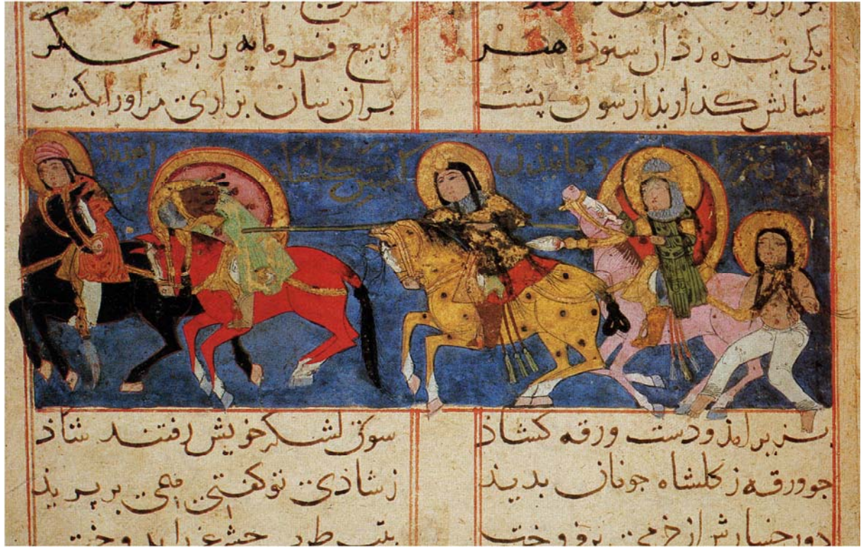
Resim 7- Savaş sahnesi, Varka ve Gülşah, TSMK, H. 841. ( Mazhar Ş. İpşiroğlu, Chefs-d'œuvre du Topkapi Peintures et miniatures, Bibliothèque des Arts, Paris, Fribourg, 1980).