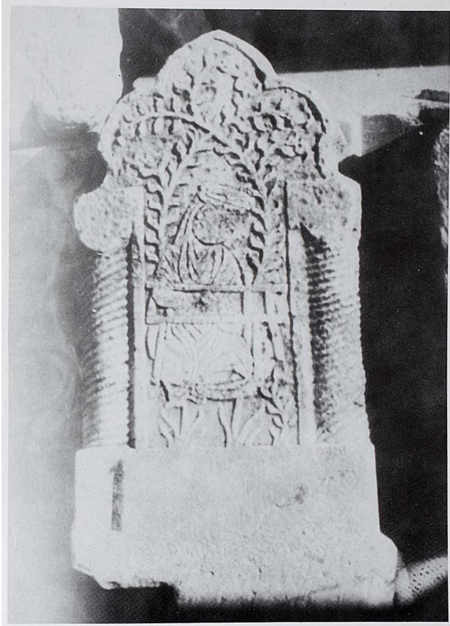
Resim 13- Gergef işleyen kadın figürlü mezar taşı, Akşehir Taş Eserleri Müzesi. ( Beyhan Karamağaralı, Ahlat Mezar Taşları, Ankara, 1992).