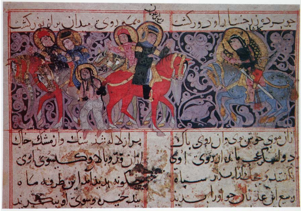
Resim 11- Gülşah ile Rebi'nin karşılaşması. Varka ve Gülşah, TSMK, H.841, 21v. ( Güner İnal, Türk Minyatür Sanatı, Ankara, 1995).