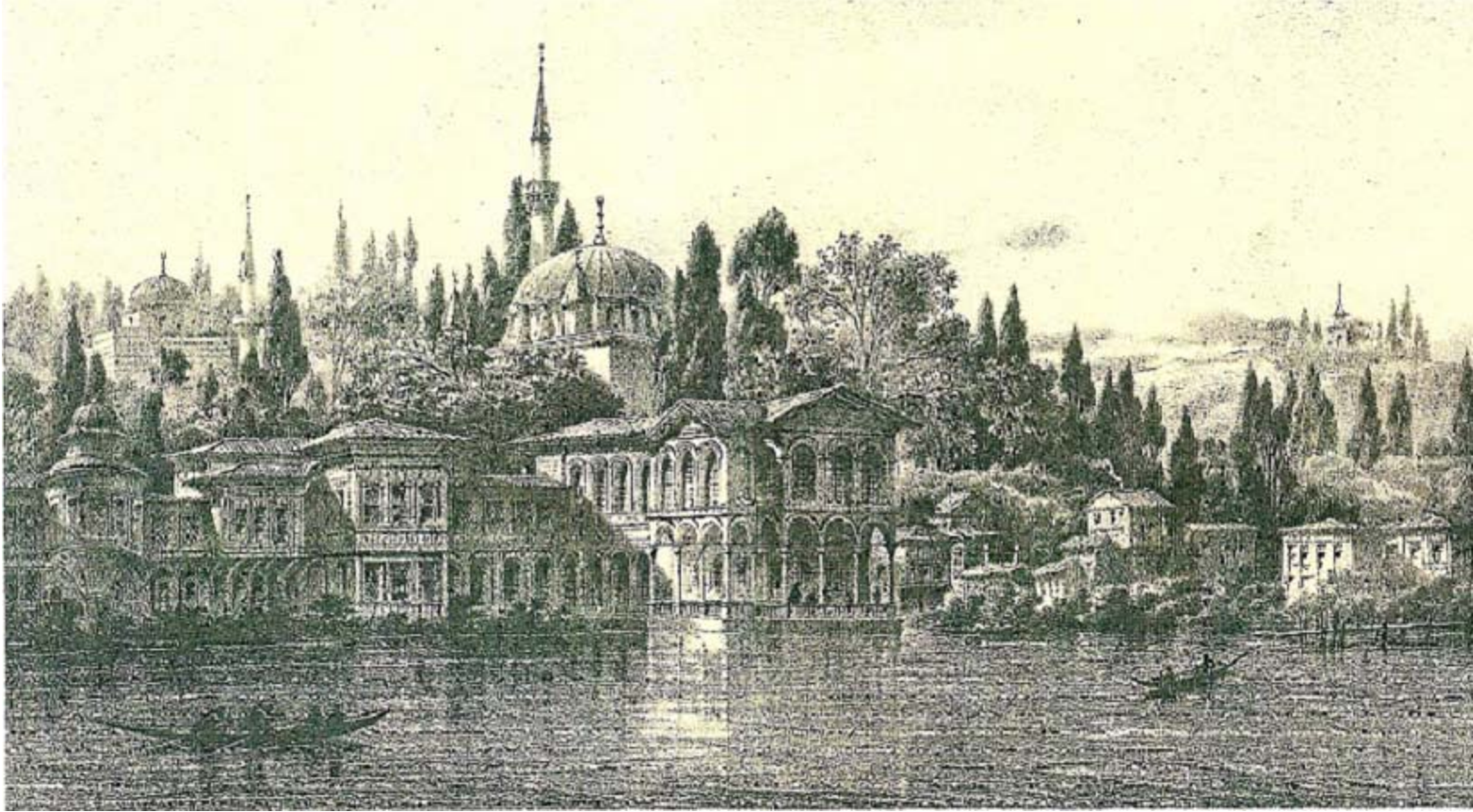
Esmâ Sultan'ın Eyüp Sarayı'nı gösterir Eugene Flandin'in gravürü ( L'Orient , (1852'de Paris'te yayınlanan kitabın tıpkıbasımı) Karakuşak Basın ve Yayın Limited Şirketi, İstanbul, 1984, s.33).