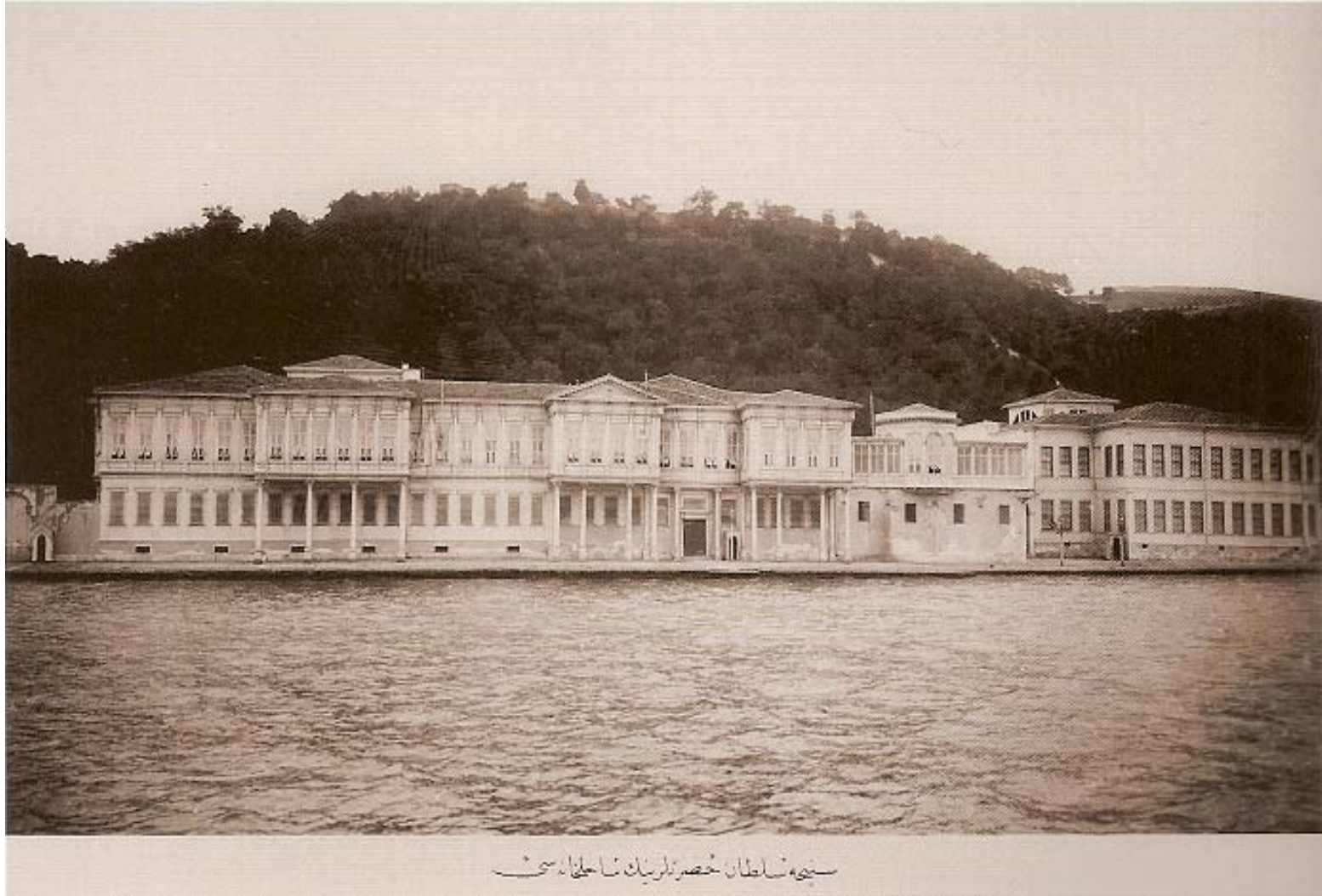
Tırnakçı Yalısı ( Sultan II. Abdülhamit Arşivi İstanbul Fotoğrafları [Photographs of İstanbul From the Archives of Sultan Abdülhamit II], İstanbul Büyükşehir Belediyesi Kültür A.Ş., IRCICA, İstanbul 2007, s.222 ).