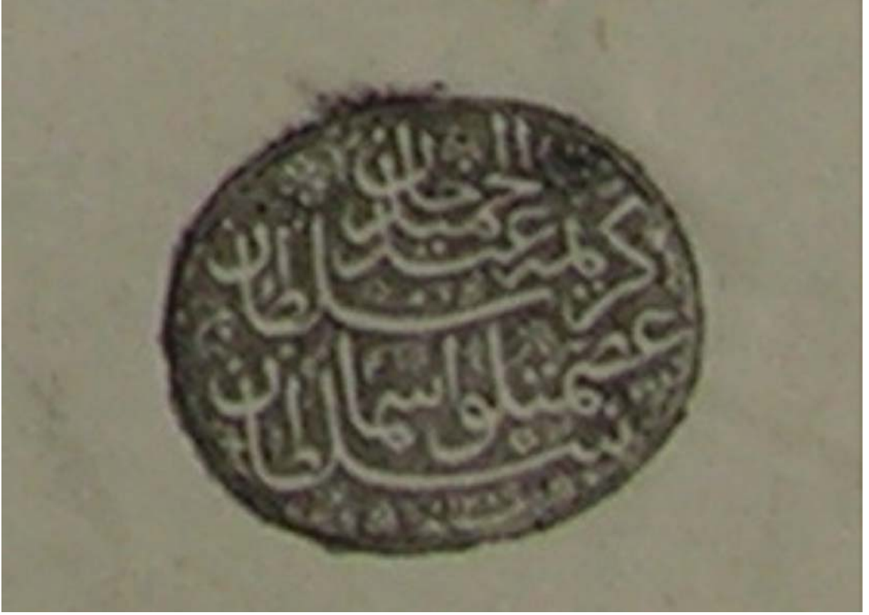
Esmâ Sultan'ın mührü (T SMA, D. 2270, vr. 5b).