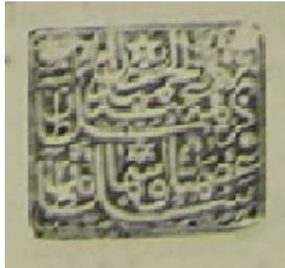
Esmâ Sultan'ın başka bir mührü (T SMA, E. 247/51).