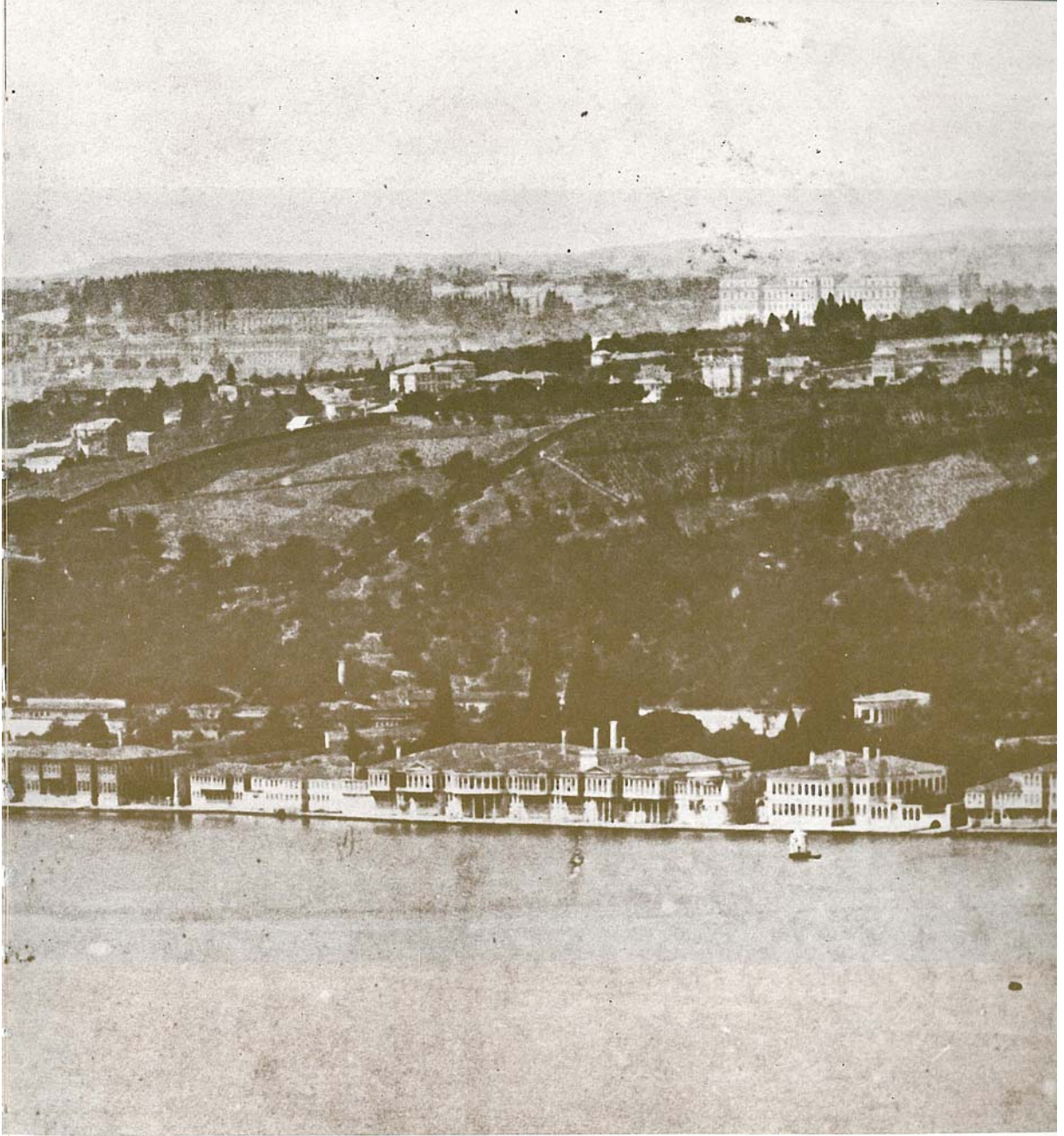
Esmâ Sultan'ın Tırnakçı Yalısı (Sedad Hakkı Eldem, Boğaziçi Anıları: Reminiscences of the Bosphorus , Aletaş Alarko Eğitim Tesisi, İstanbul 1979, s. 71).