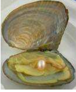
Sadef ve İncisi