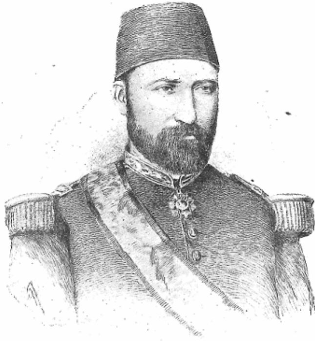
سليمان حسنى پاشا