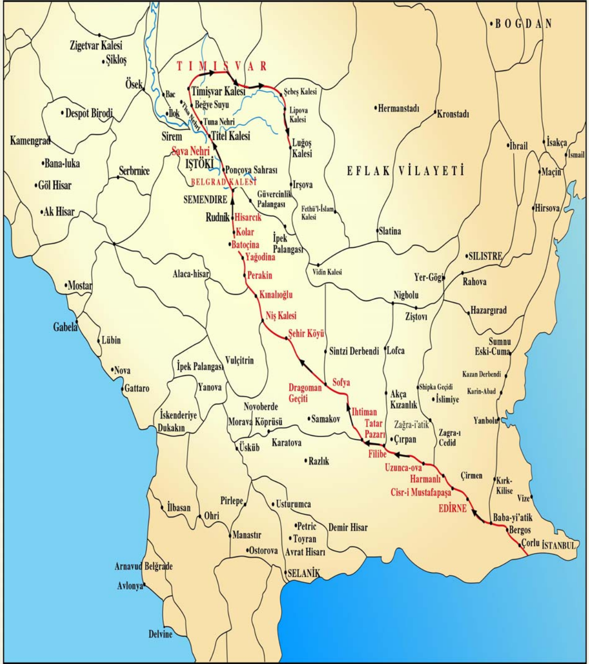
Ordunun Konakladığı Menziller