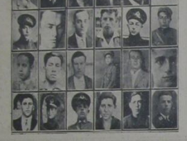
دنیای غیر یلیری قونفره سی