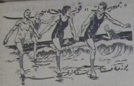
بوزمه ساقاقلریمیز ۱۹ آغستون محمد کونی اولدیم