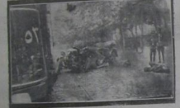
مددهش براوطومیل فاجعه سی اولدی. ایکی کیتی اولدی، ابع کیتی ده اقبدر بار ایلدیر.