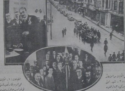
دو قاره آتقده و استانبول داخل اولدیغی حالده بکری اوج ولایتده انتخابات یا ایلمیش و فرقه نامزدلری متفقاً مبعوث انتخاب ایلدیلشدر.