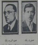
نون و علاءالدین کیکر بر ایکی کوه قونو چایورده حرکت ایلمیور