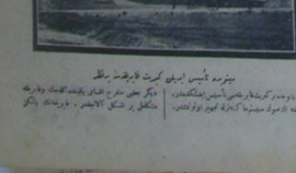
ساخته مکمل برکرت قایمقرقی تانیس ایلمیور