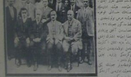
قونفره یوزره ایلانور اشتراک ایلمیور