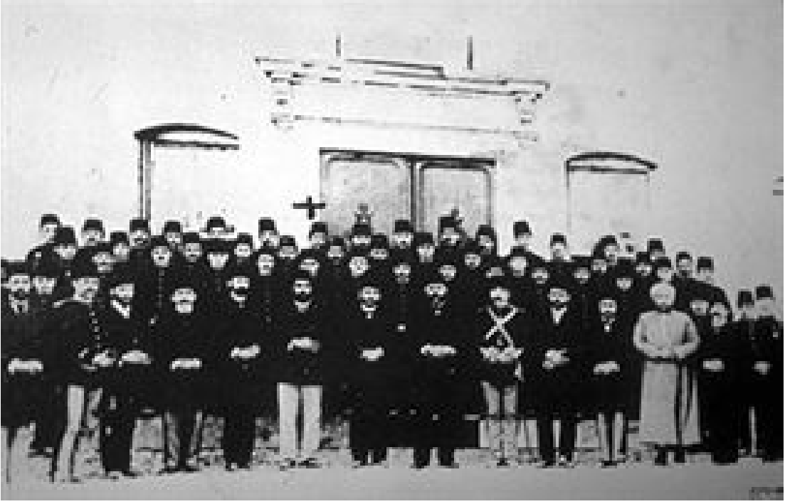
Kaynak: Mithat Cemal Kuntay, Mehmed Akif (Hayatı-Seciyesi-Sanatı- Eserleri) , İstanbul 1939.