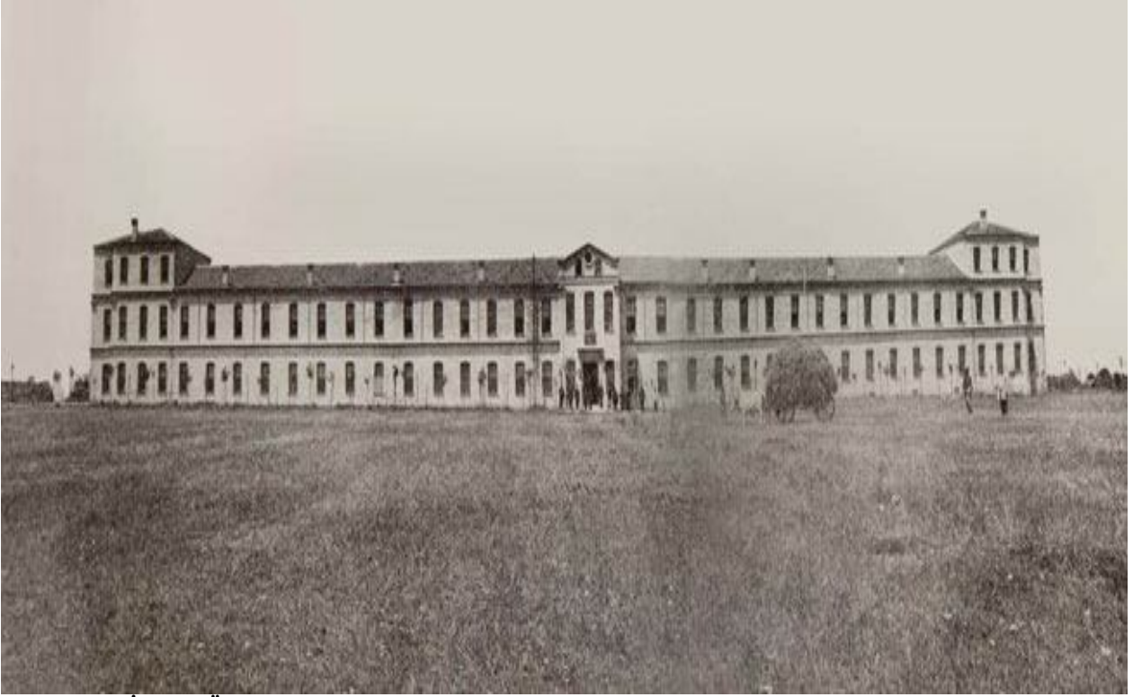
Resim1. Halkalı Ziraat Mektebi'nin cepheden görünüşü