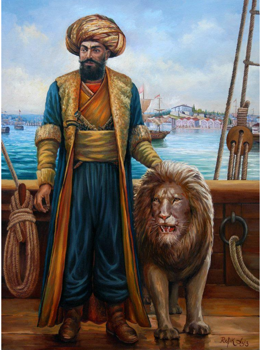
Ek 5: Cezayirli Hasan Paşa'yı tasvir eden bir başka yağlı boya tablosu*