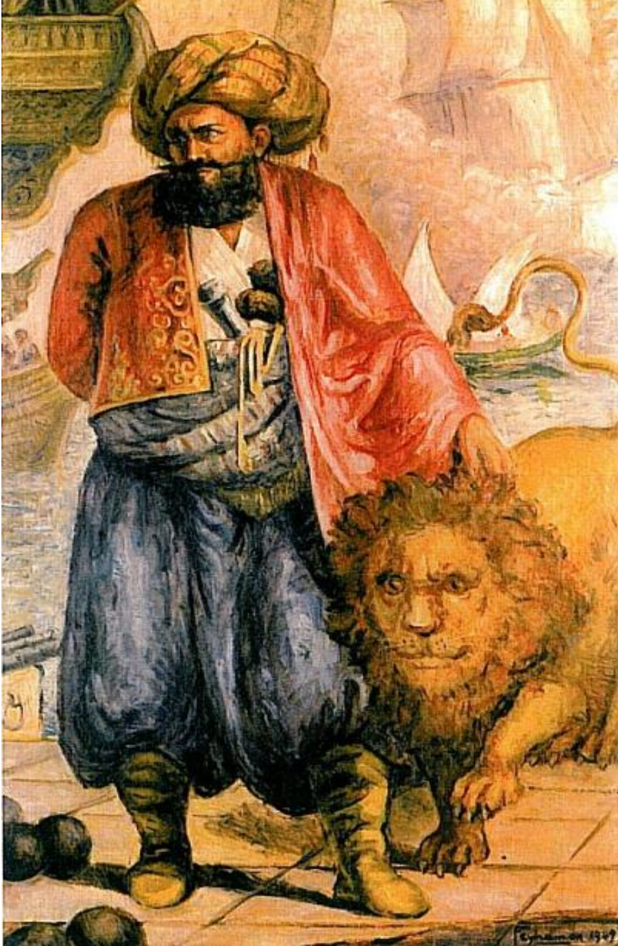
Ek 2: Cezayirli Hasan Paşa'yı betimleyen bir yağlı boya tablosu *