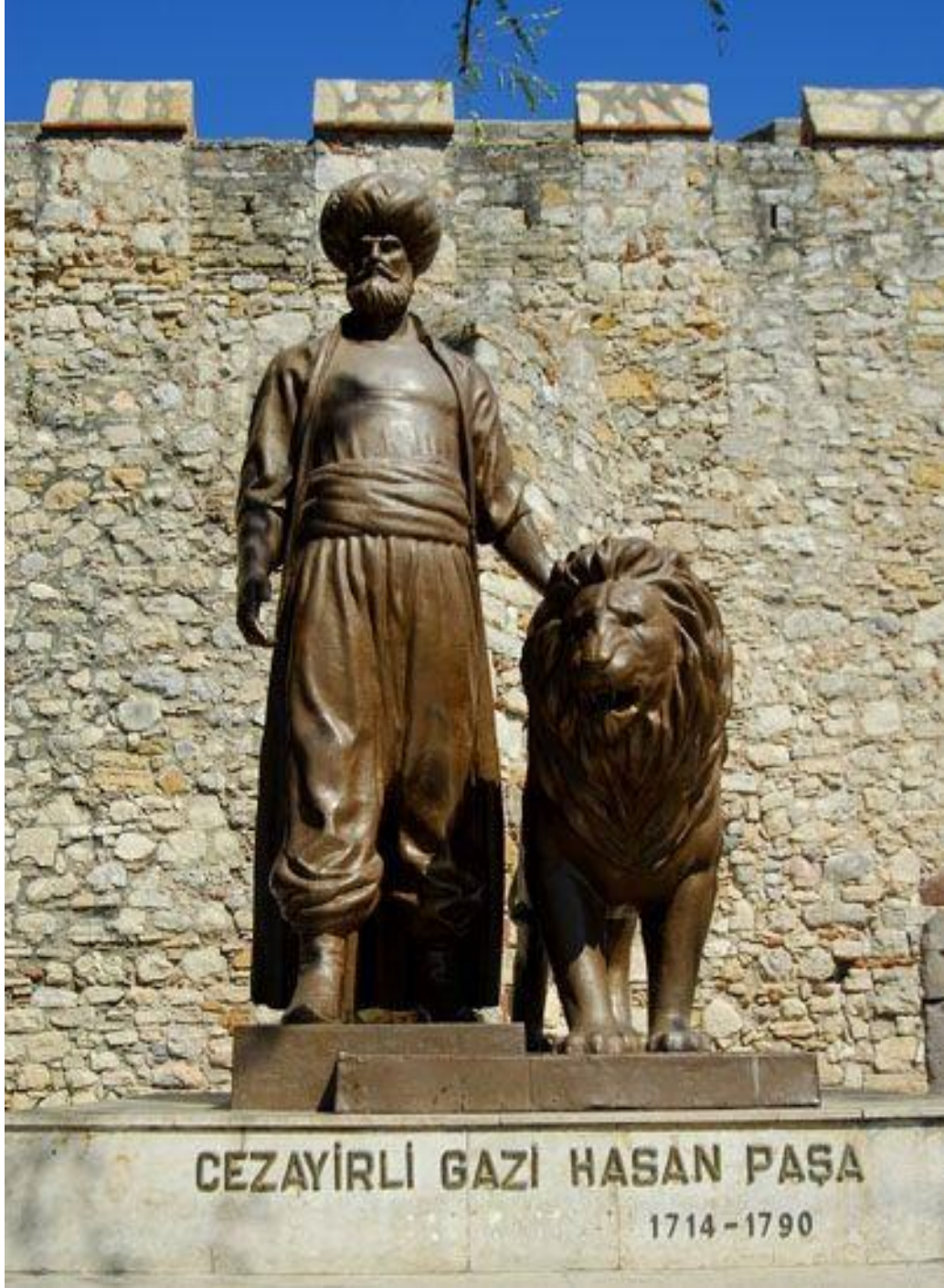
Ek 6: Cezayirli Hasan Paşa'nın Çeşme Kalesi Önündeki Anıtı