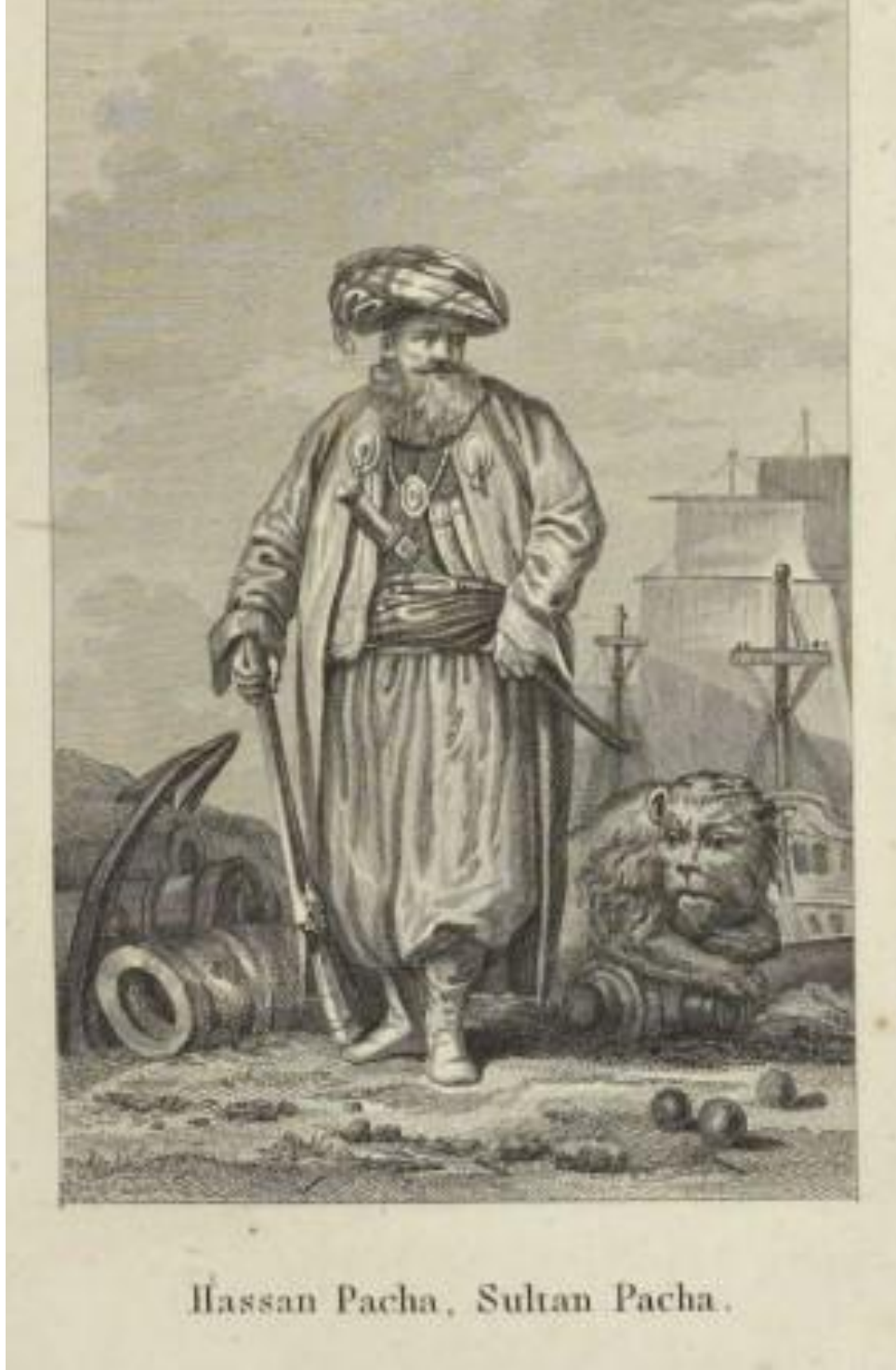
Hasan Pacha, Sultan Pacha.