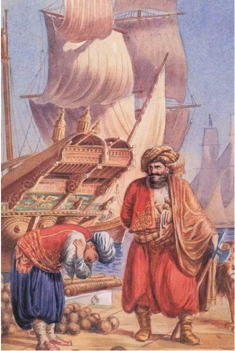
Ek 3: Cezayirli Hasan Paşa'yı tasvir eden tablo*