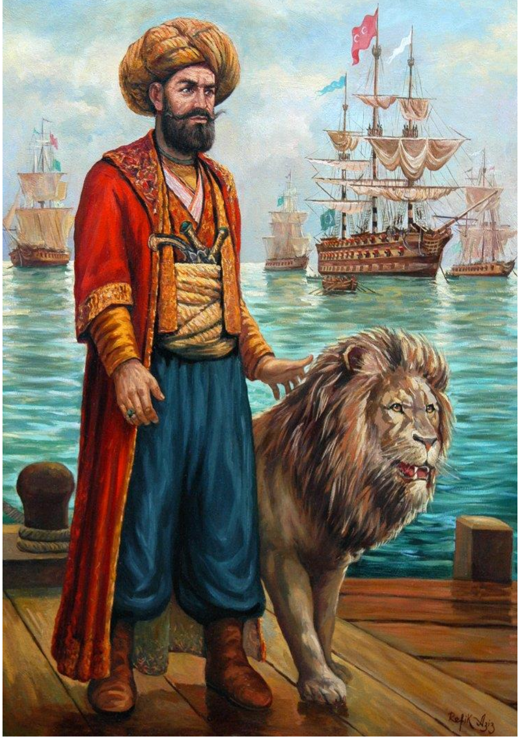
Ek 4: Cezayirli Hasan Paşa'yı tasvir eden yağlı boya tablosu*